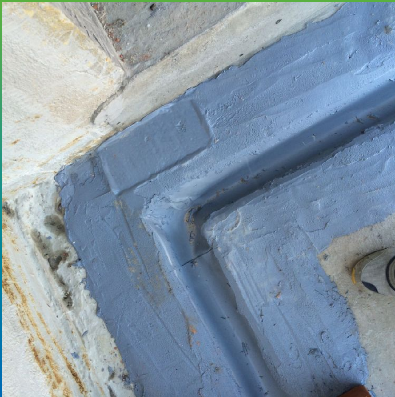
Финальный вид шва