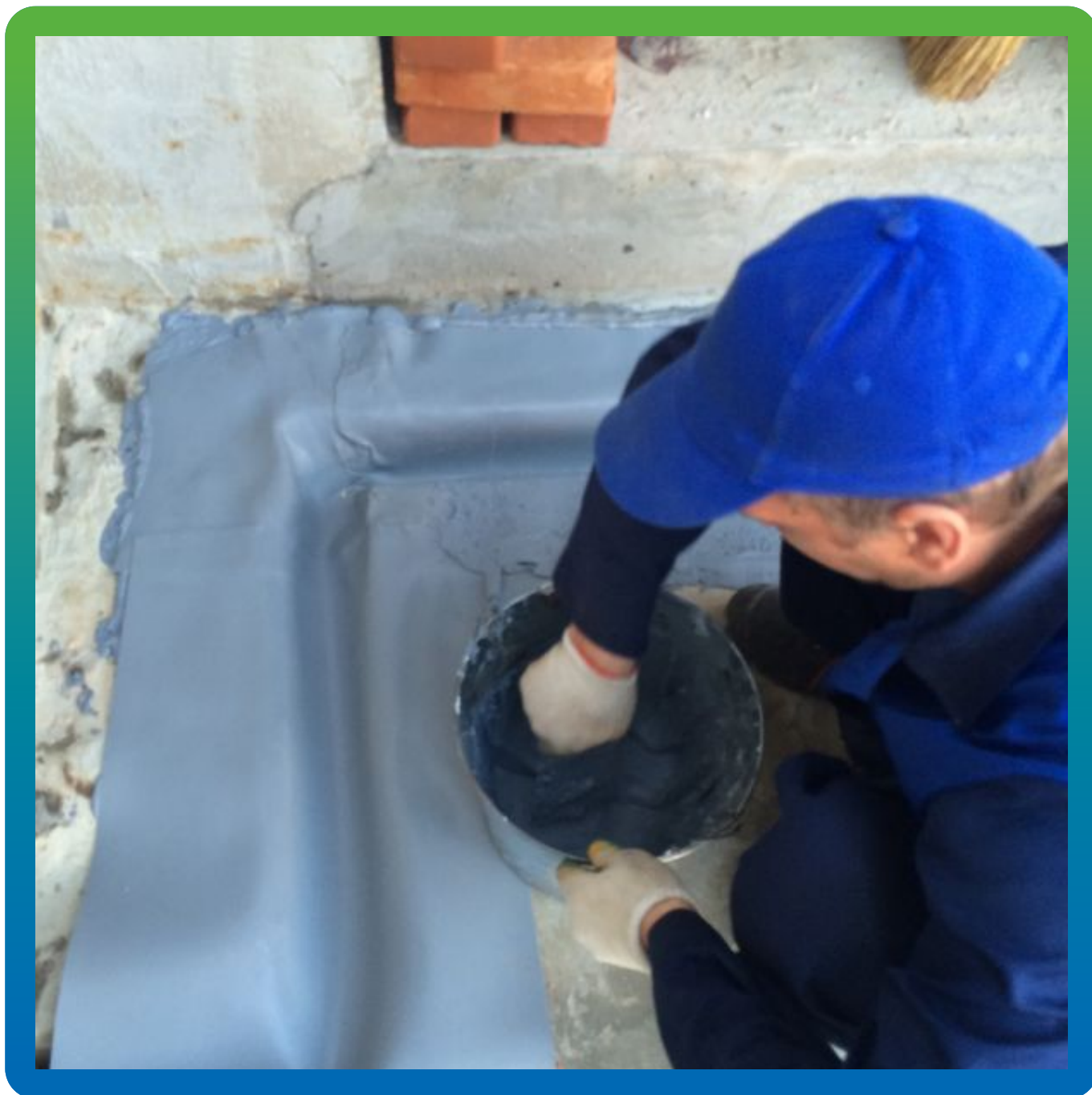
Вид приклеенной ленты, нанесение клея сверху