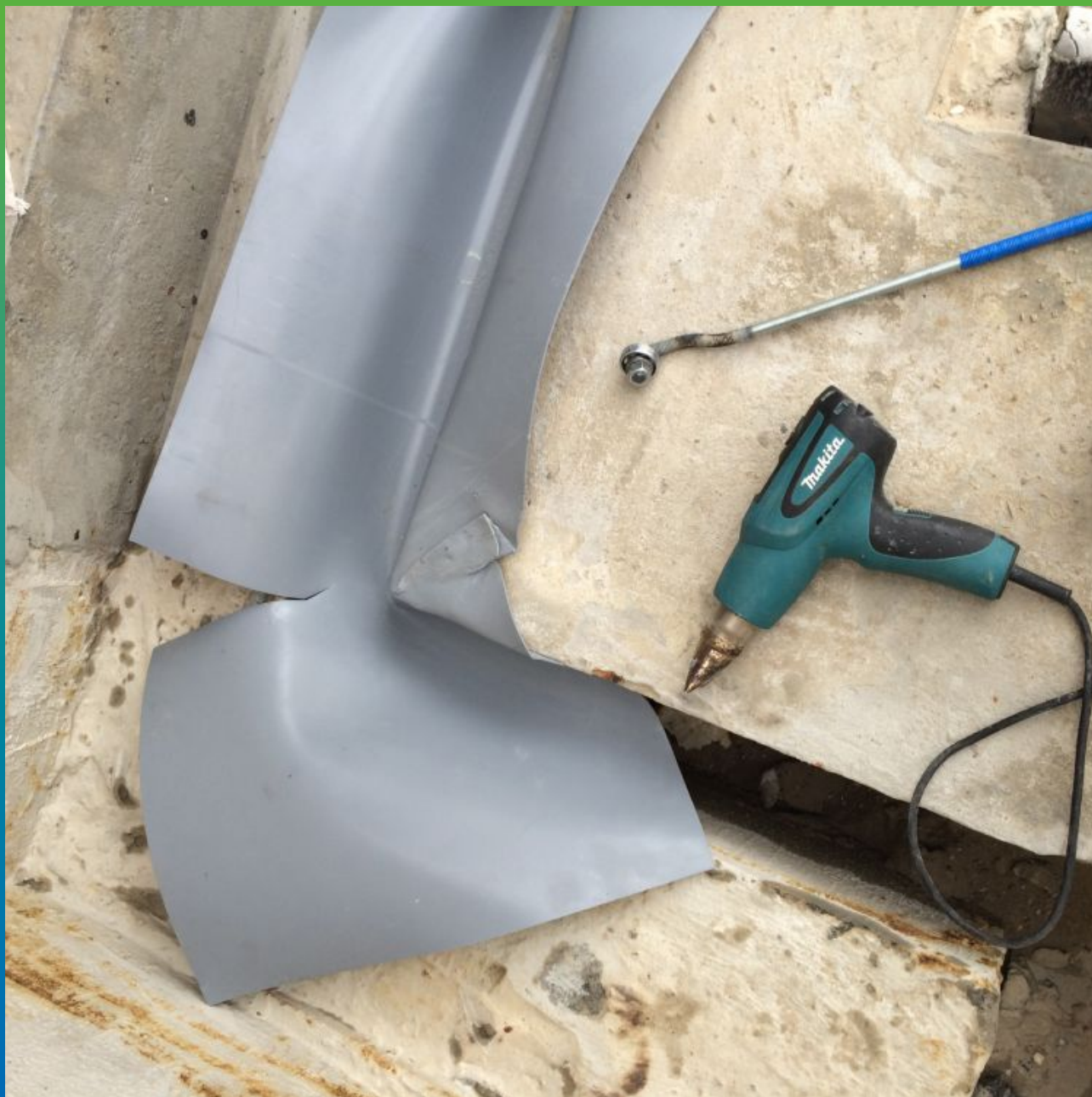
Сваривание ленты в углах поворота