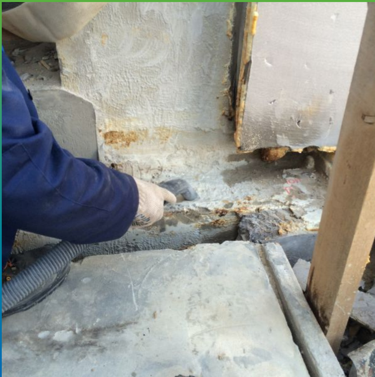
Обеспыливание поверхности строительным пылесосом