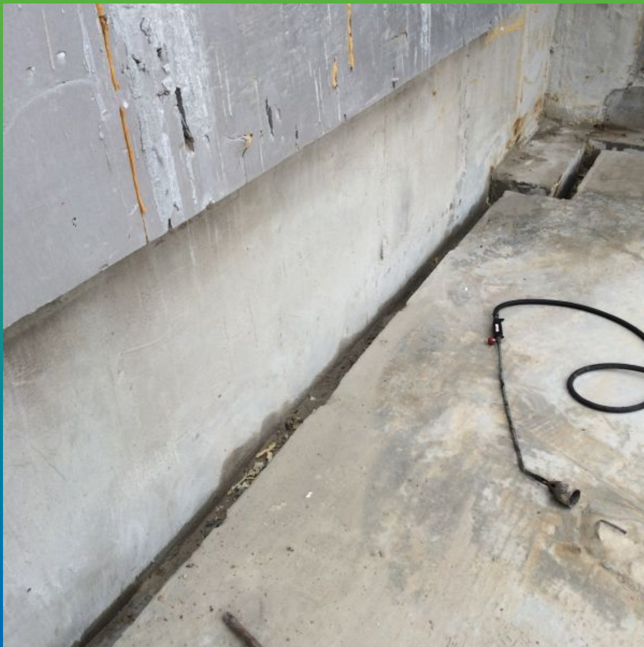
Вид деформационного шва (100 мм)