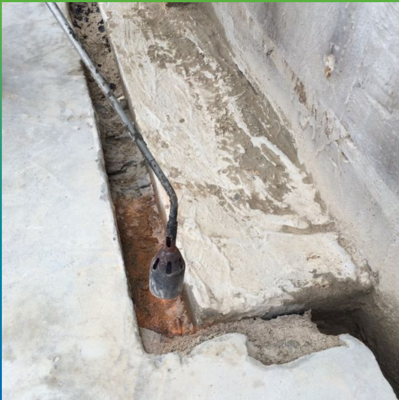
Прогрев влажного бетона