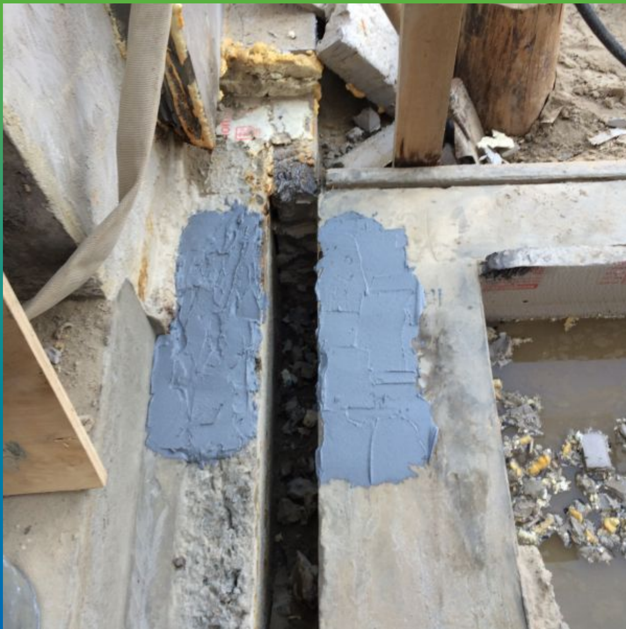
Нанесение эпоксидного клея Манопокс 331