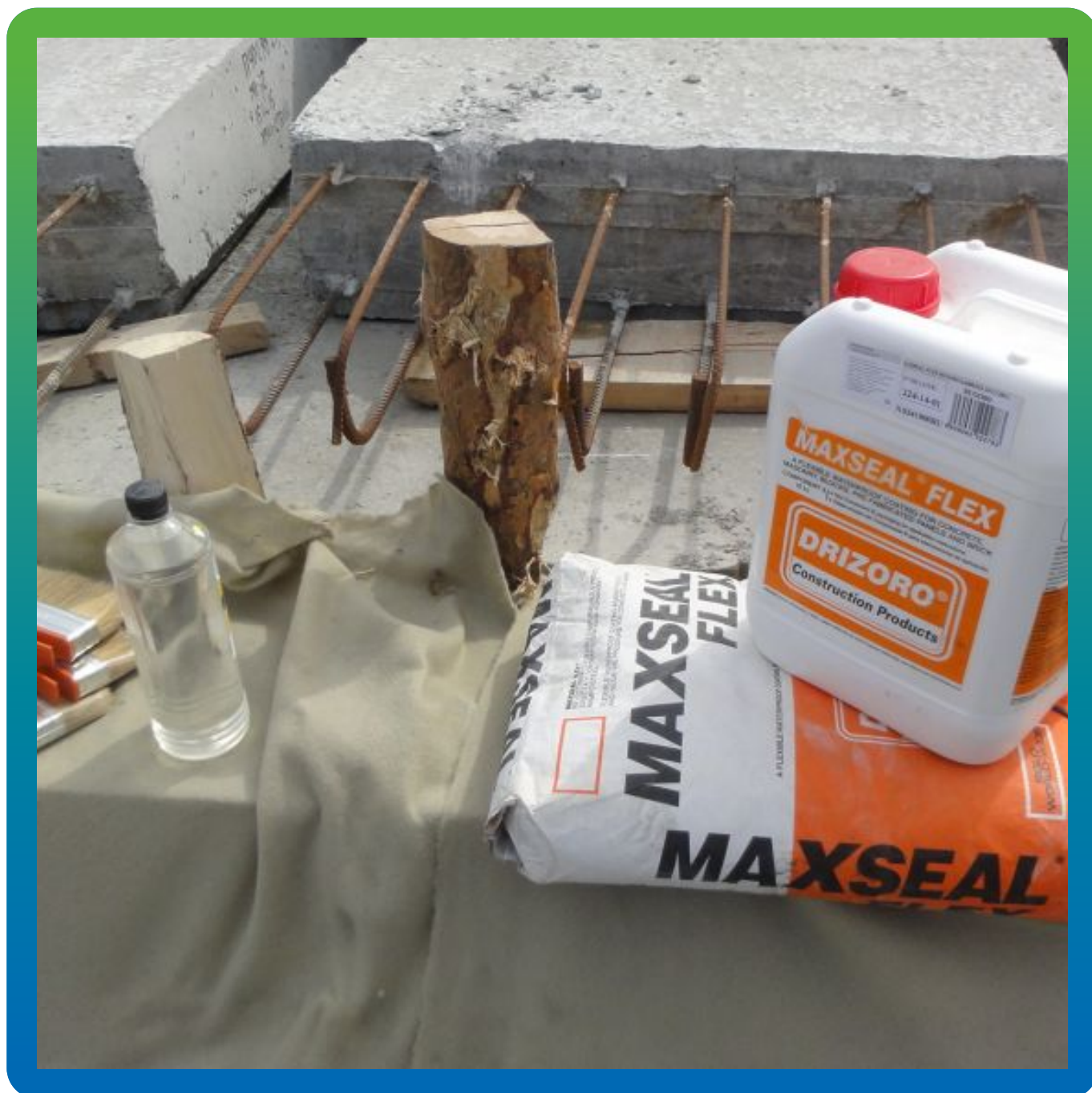
Материалы на объекте