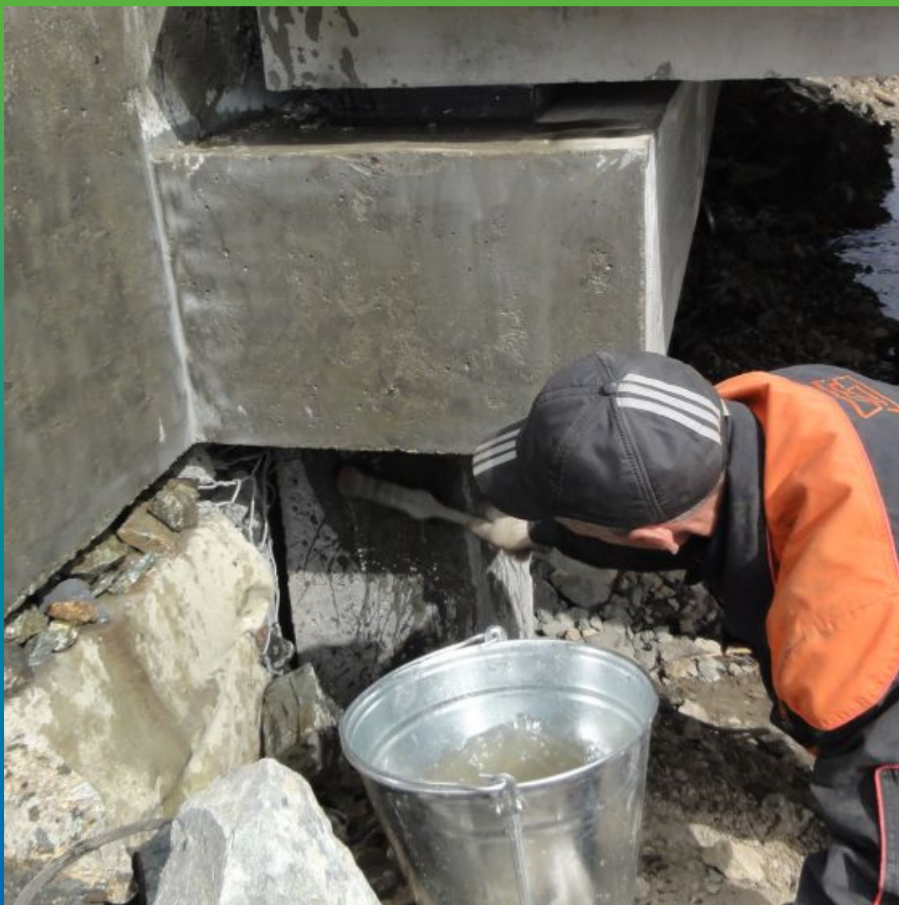
Увлажнение конструкции перед нанесением Максил Флекс