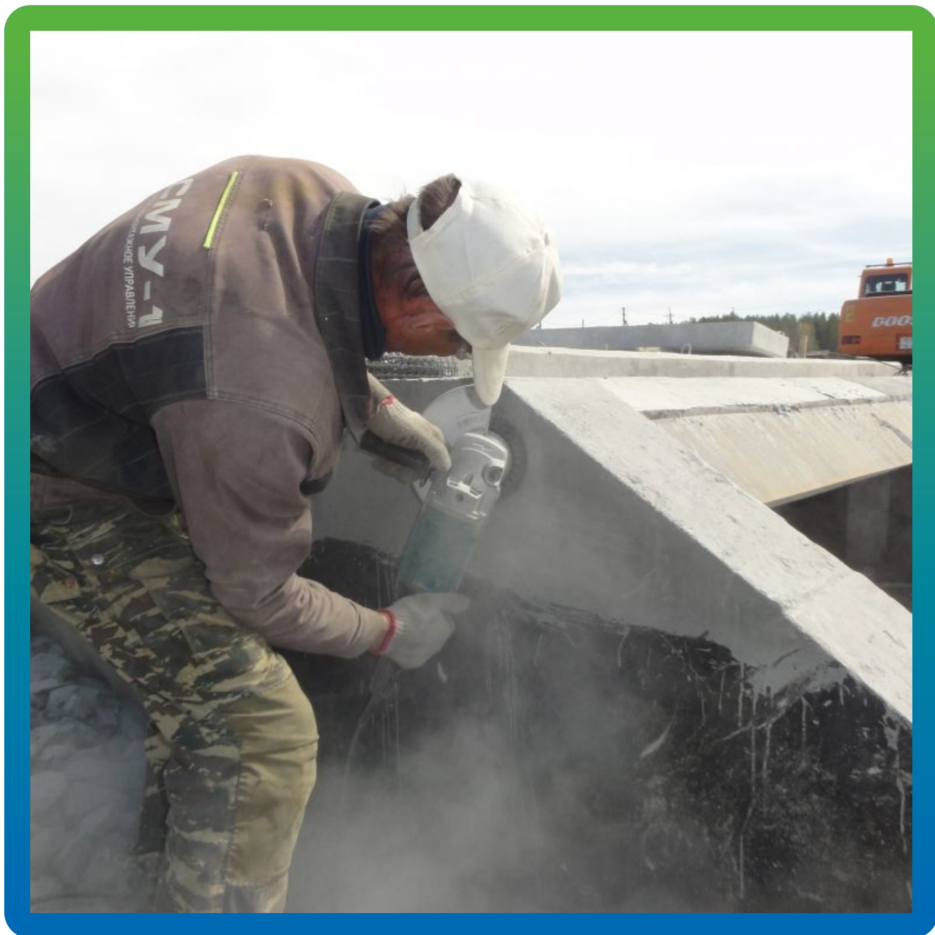
Подготовка поверхности перед нанесением Максил Флекс