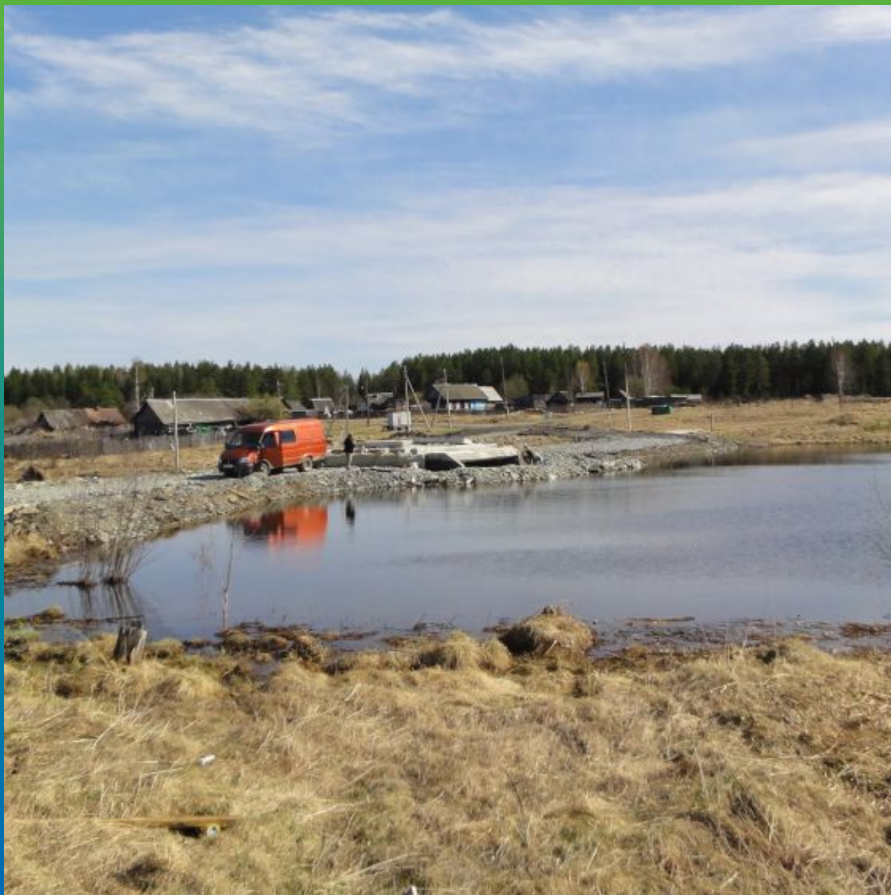
Общий вид объекта