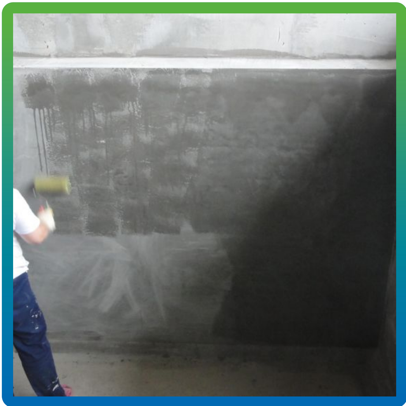
Увлажнение поверхности перед нанесением Стармекс Сил Флекс