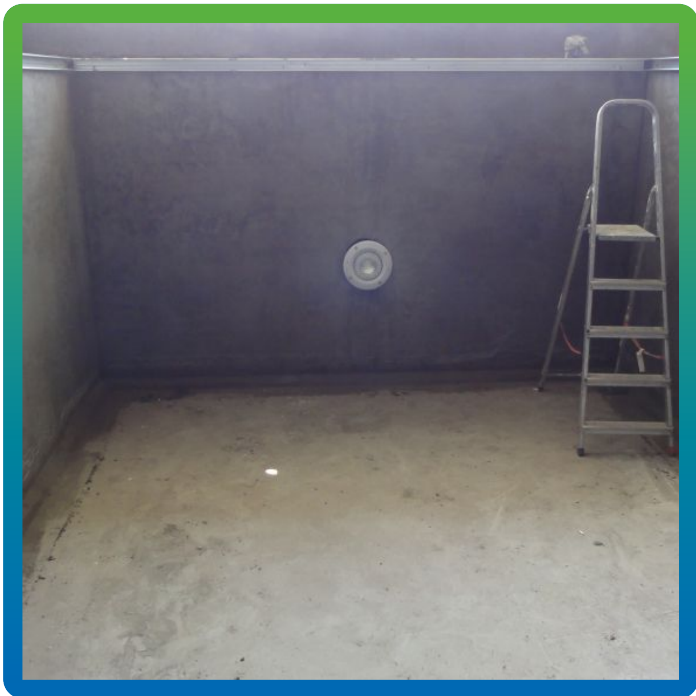
Вид подготовленной поверхности