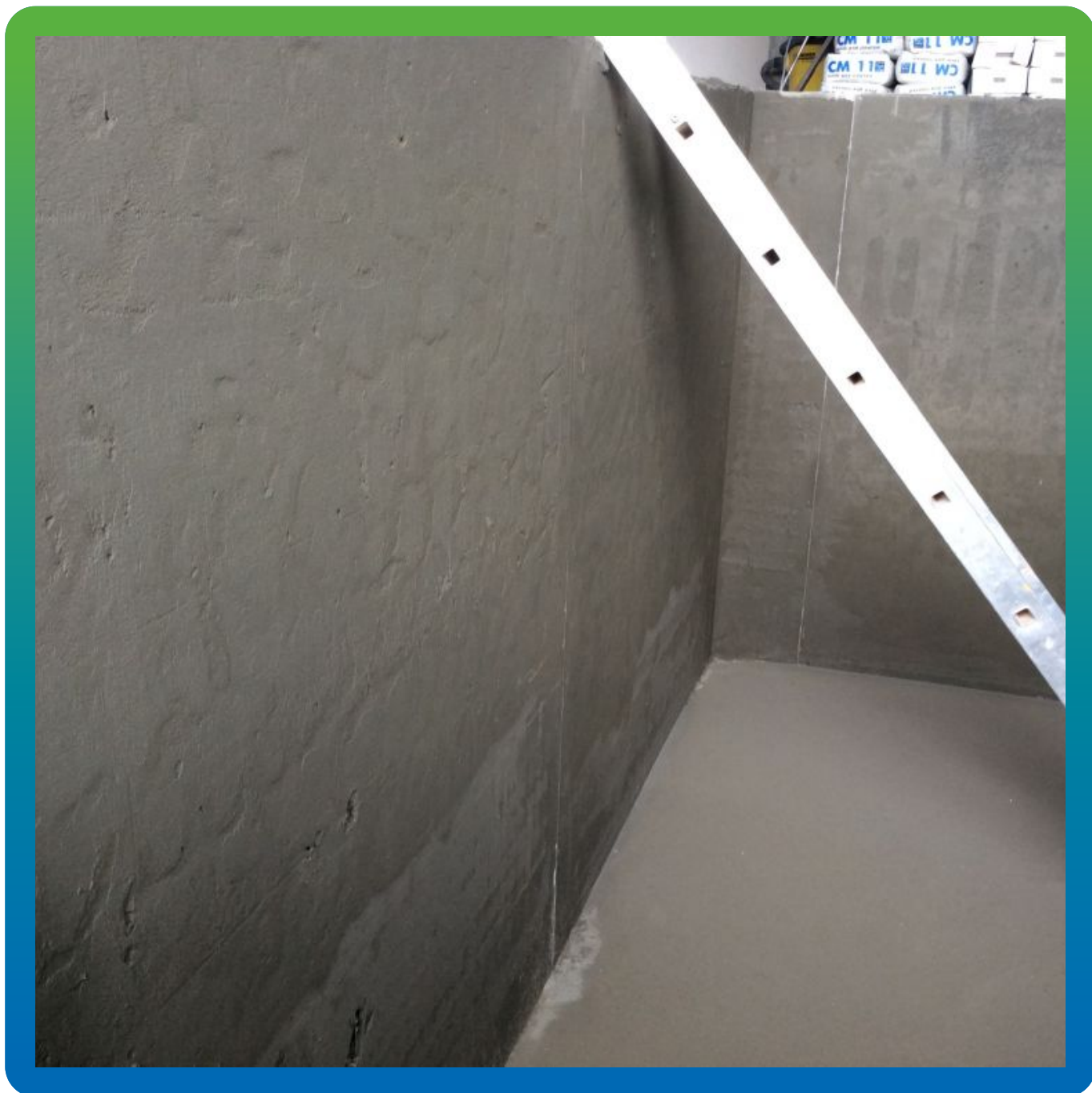
Первоначальный вид поверхности