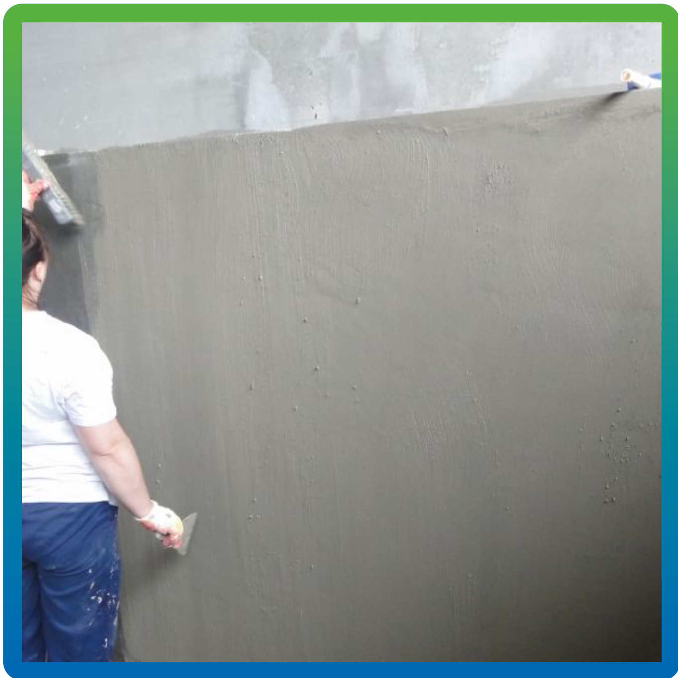
Нанесение состава Стармекс Сил Флекс