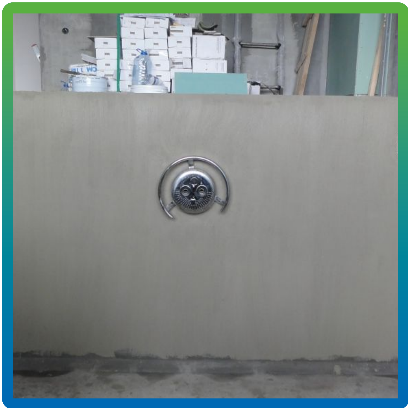
Вид обработанной стены составом Стармекс Сил Флекс