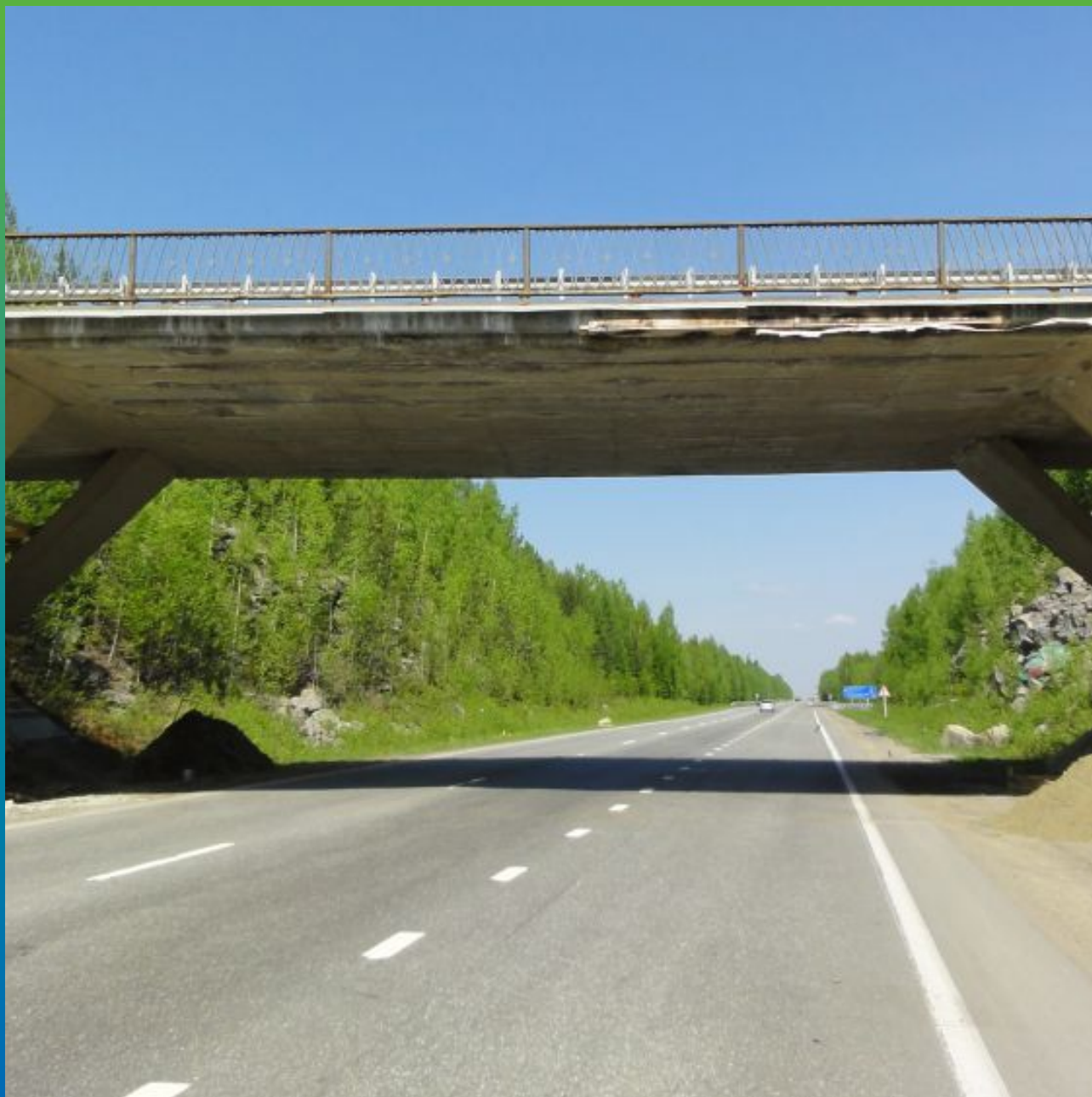
Вид моста до ремонта