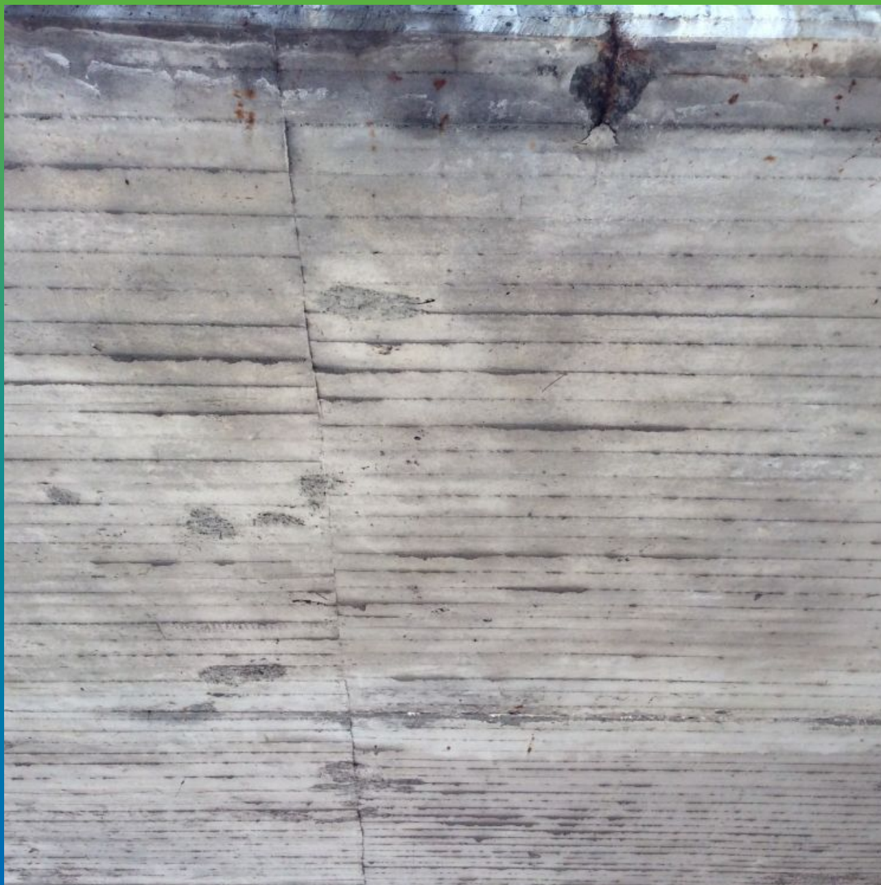
Первоначальный вид поверхности