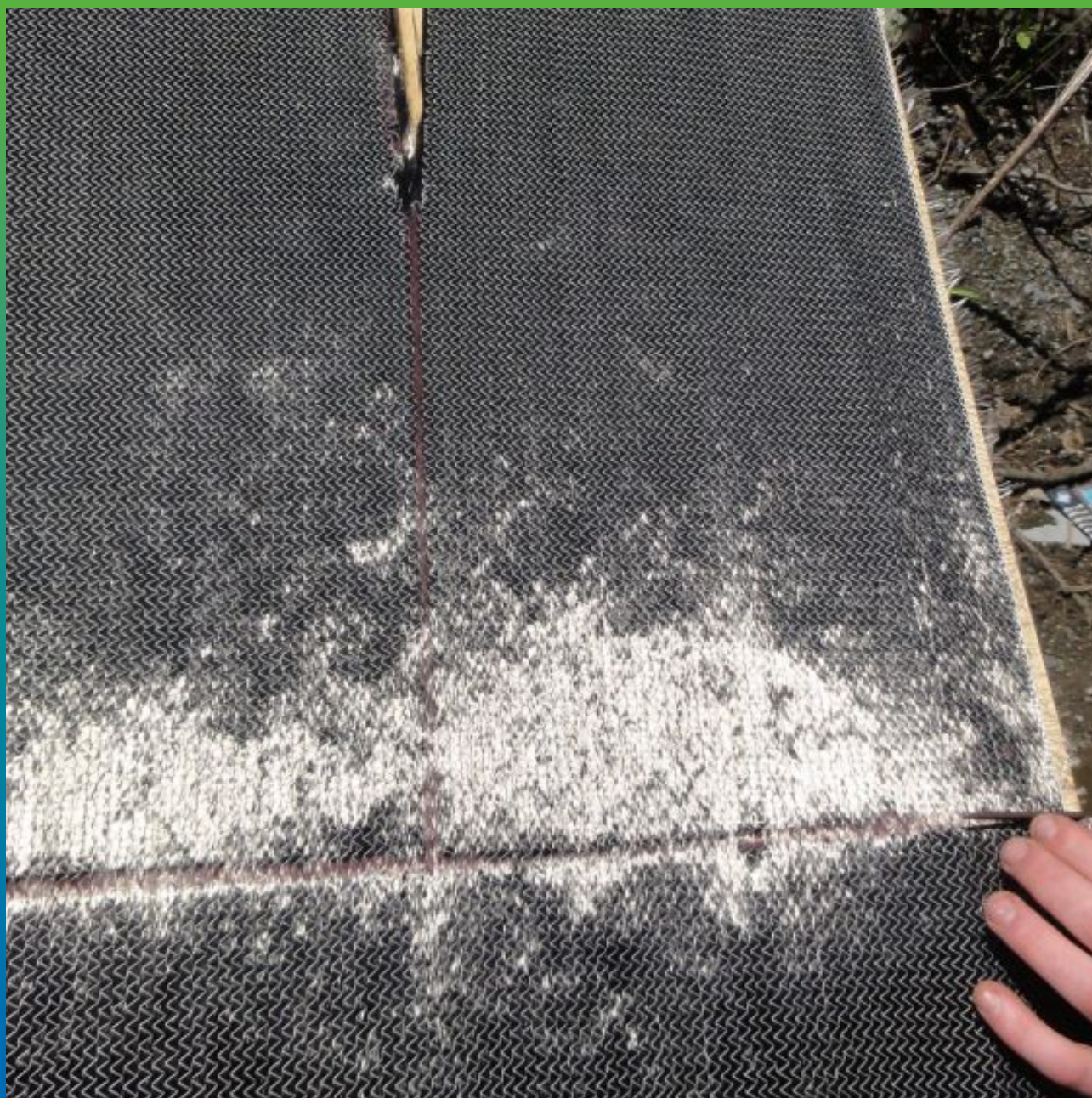
Раскрой холста согласно проекту