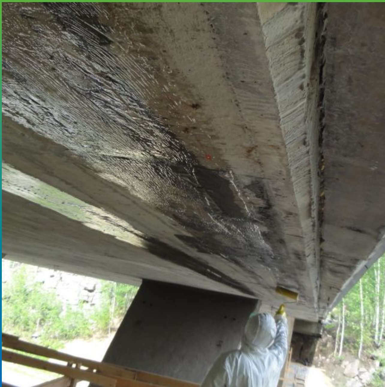
Нанесение основного (загущенного) слоя Тайфо С