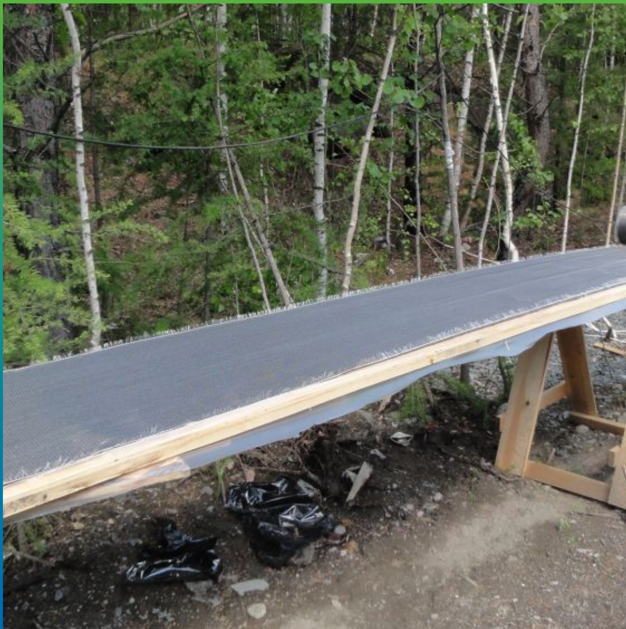
Холст Тайфо СЦХ