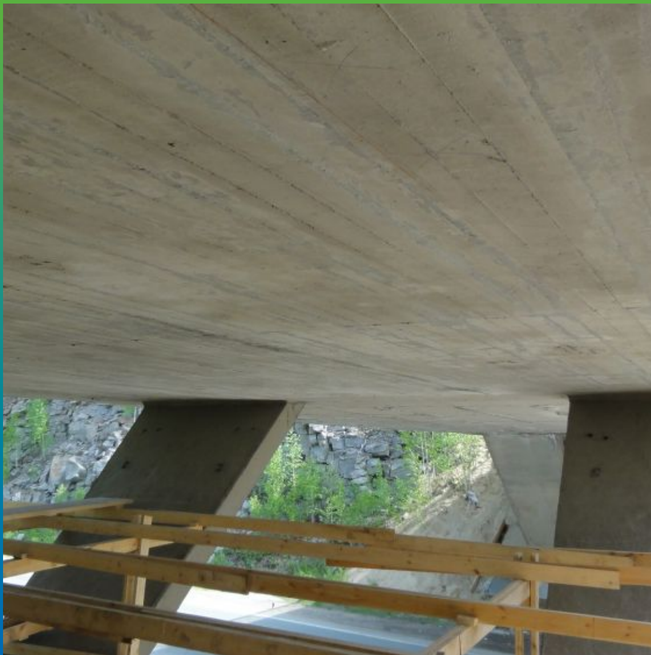
Вид подготовленной поверхности