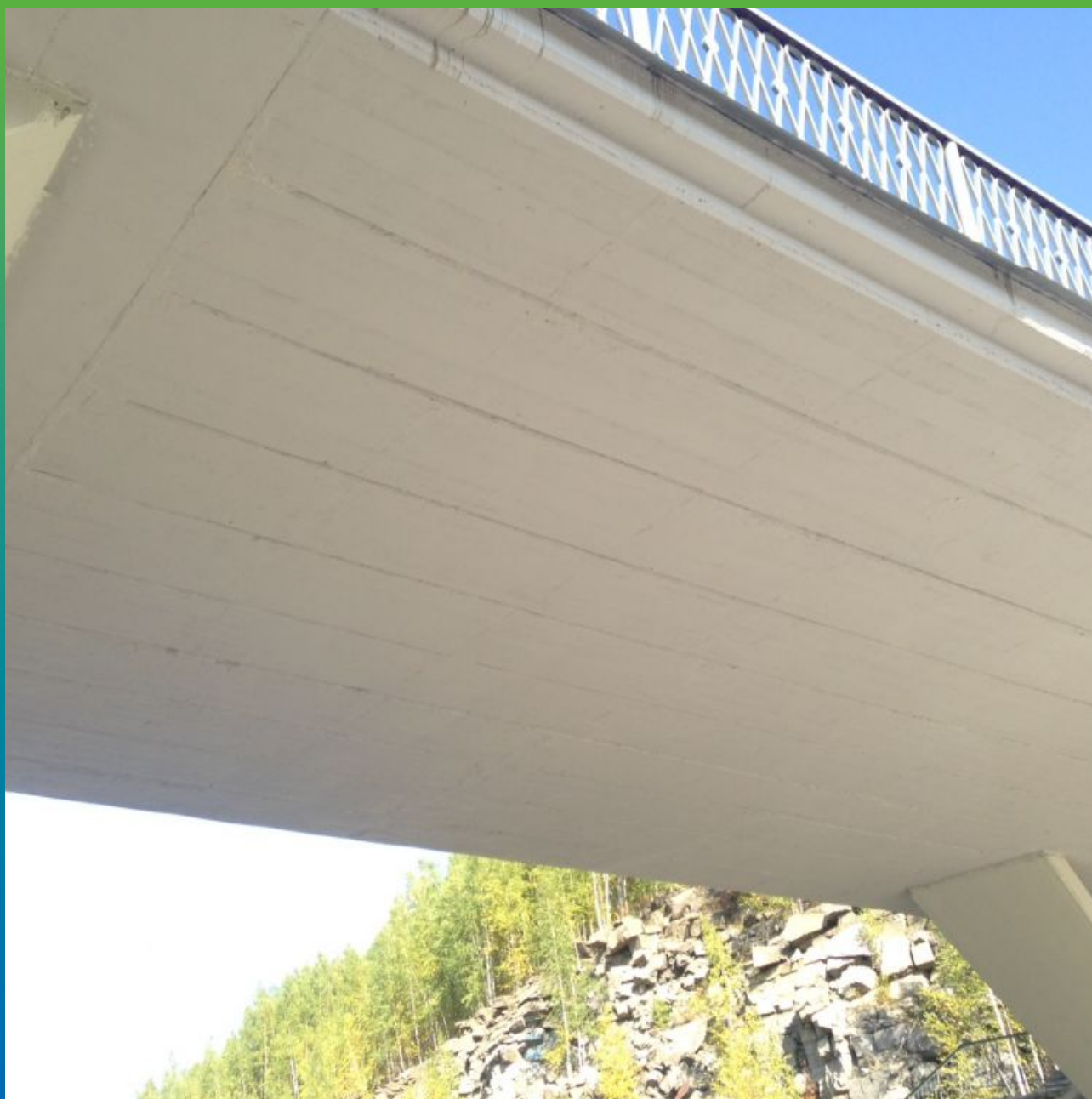
Вид моста обработанного Максшин Эластик