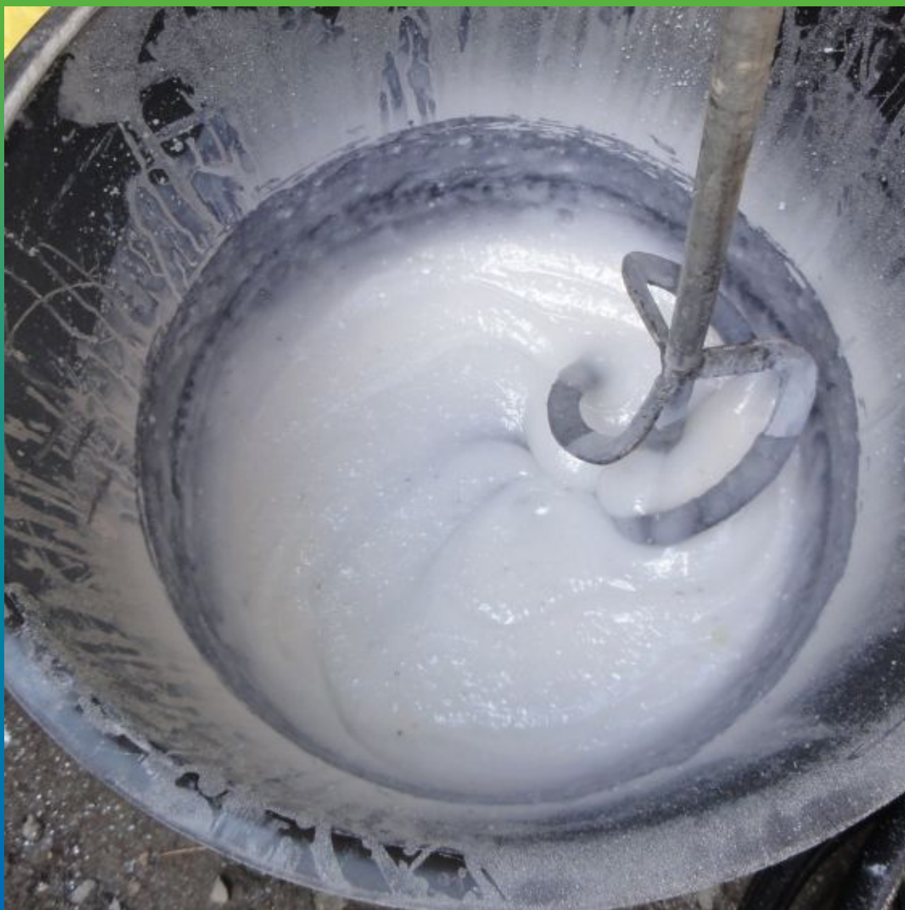
Загущение Тайфо С с помощью Тайфо Тикс