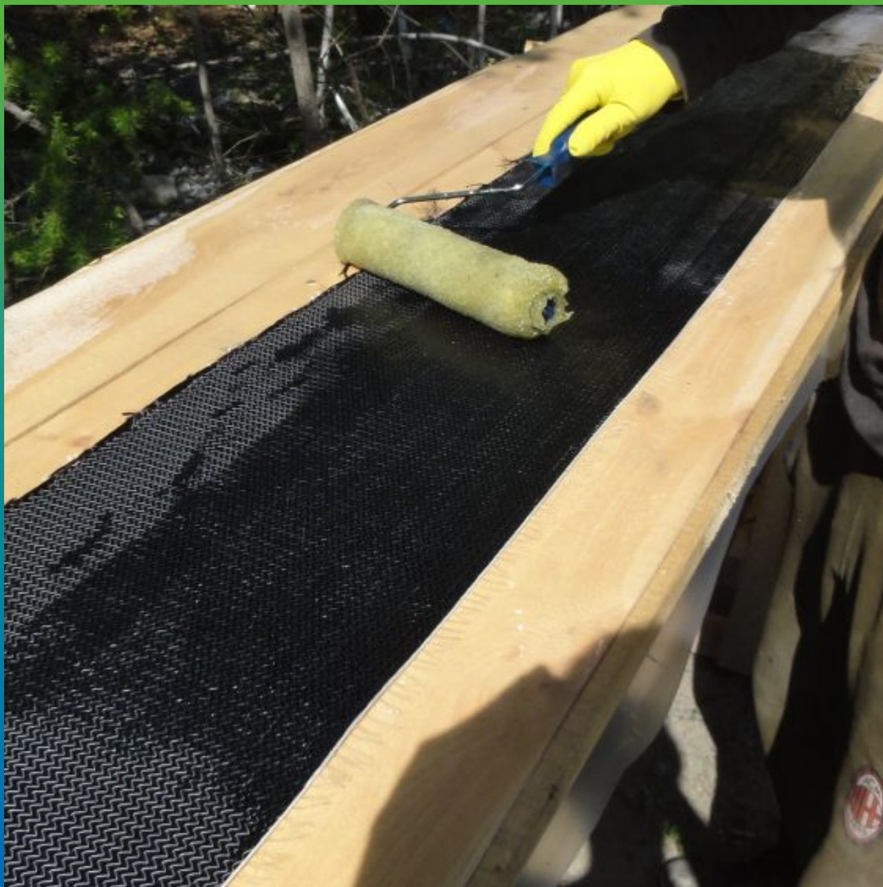
Пропитка холста Тайфо СЦХ, эпоксидным составом Тайфо С