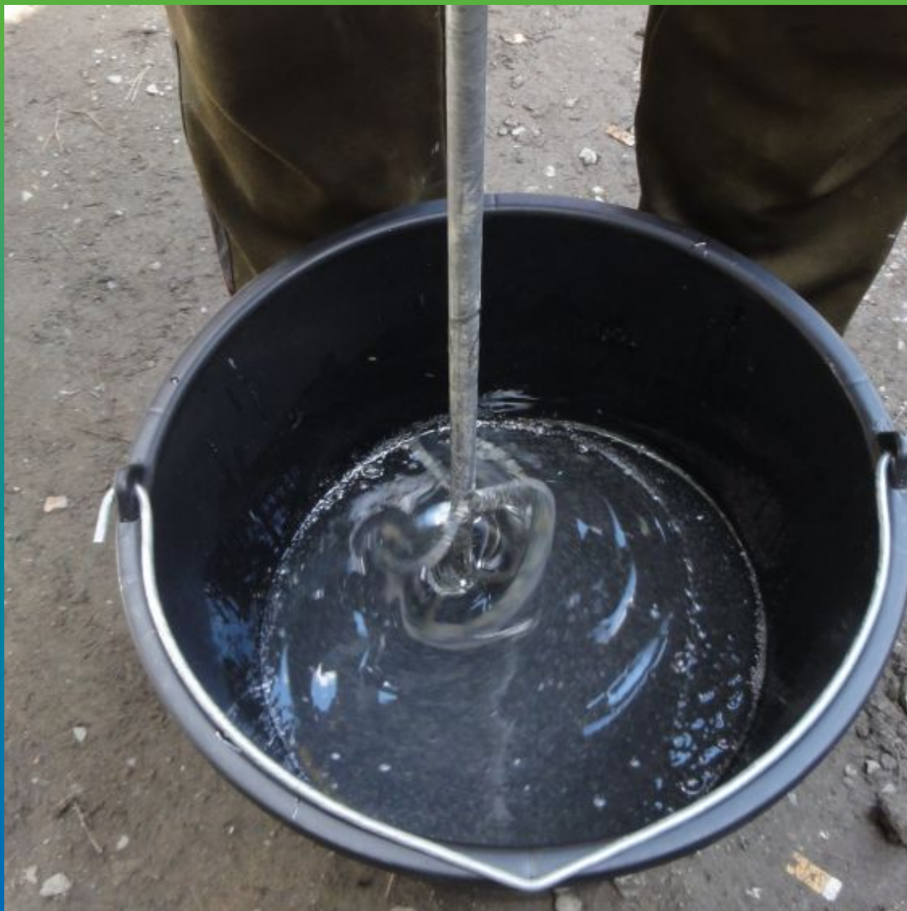
Затворение Тайфо С