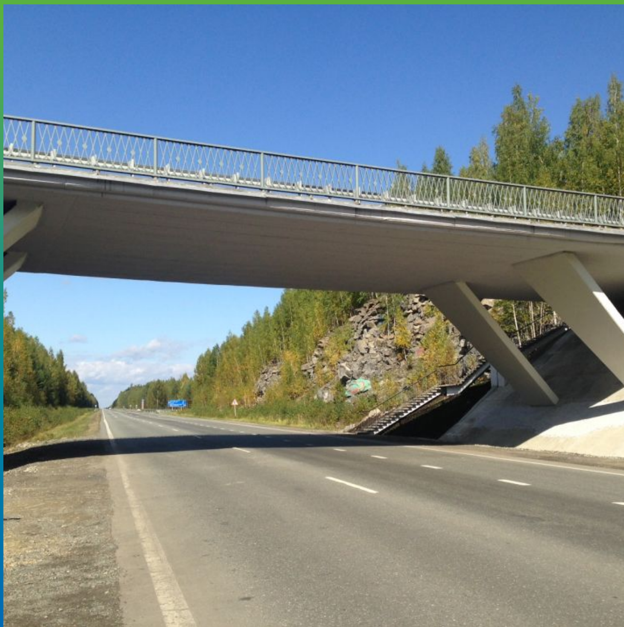
Финальный вид моста