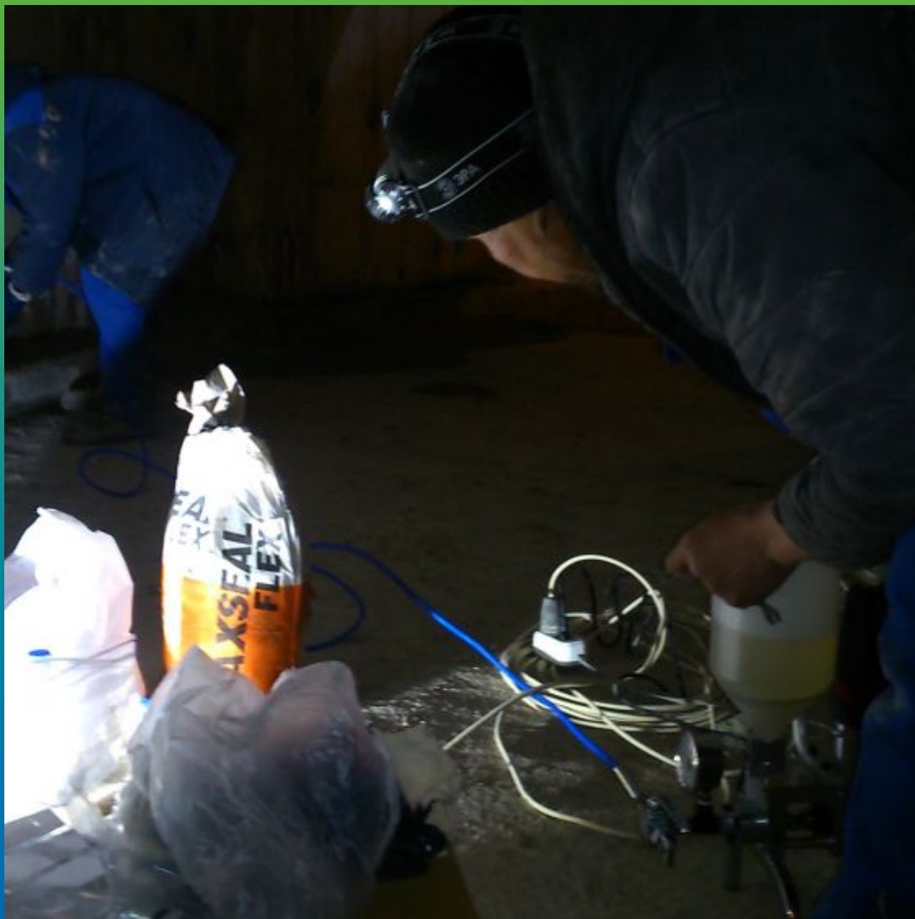
Инъектирование Манопур С