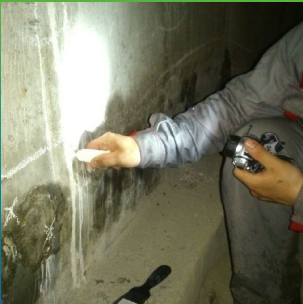
Разметка под шпury