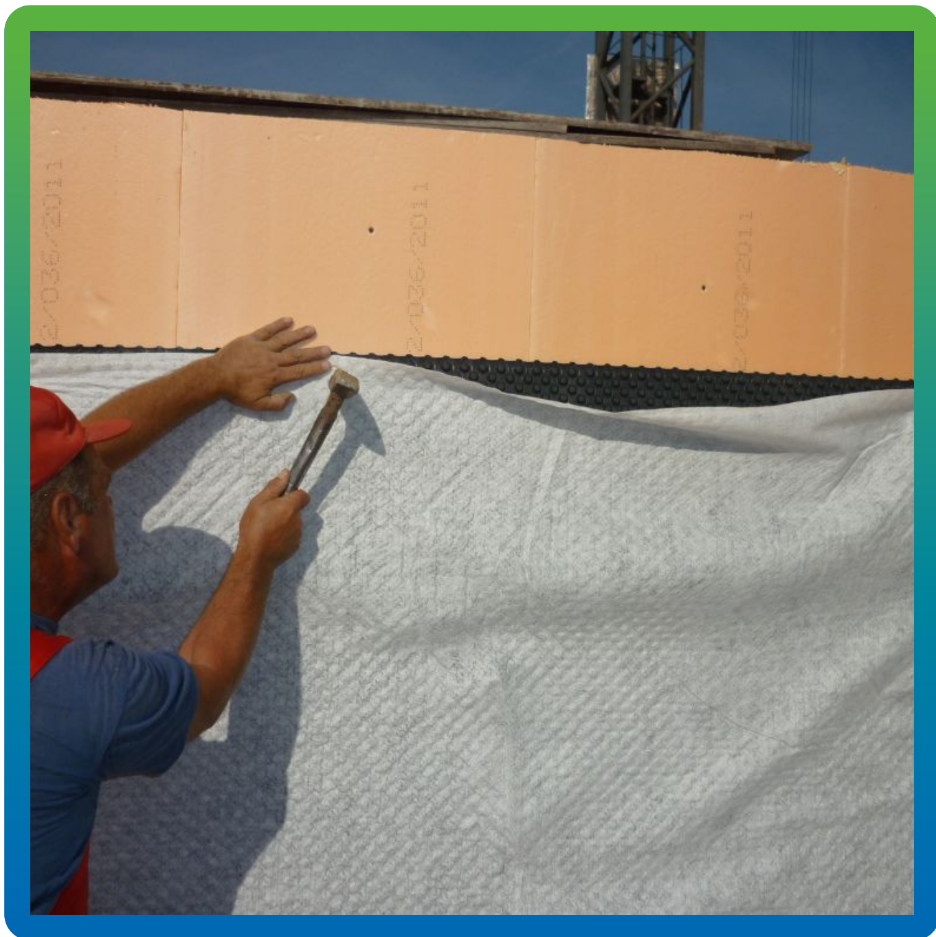
Монтаж Максдрейн 8ГТ