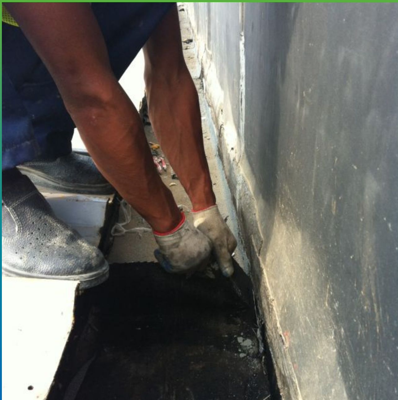
Демонтаж старого покрытия (гидроизоляции). Вид сопряжений.