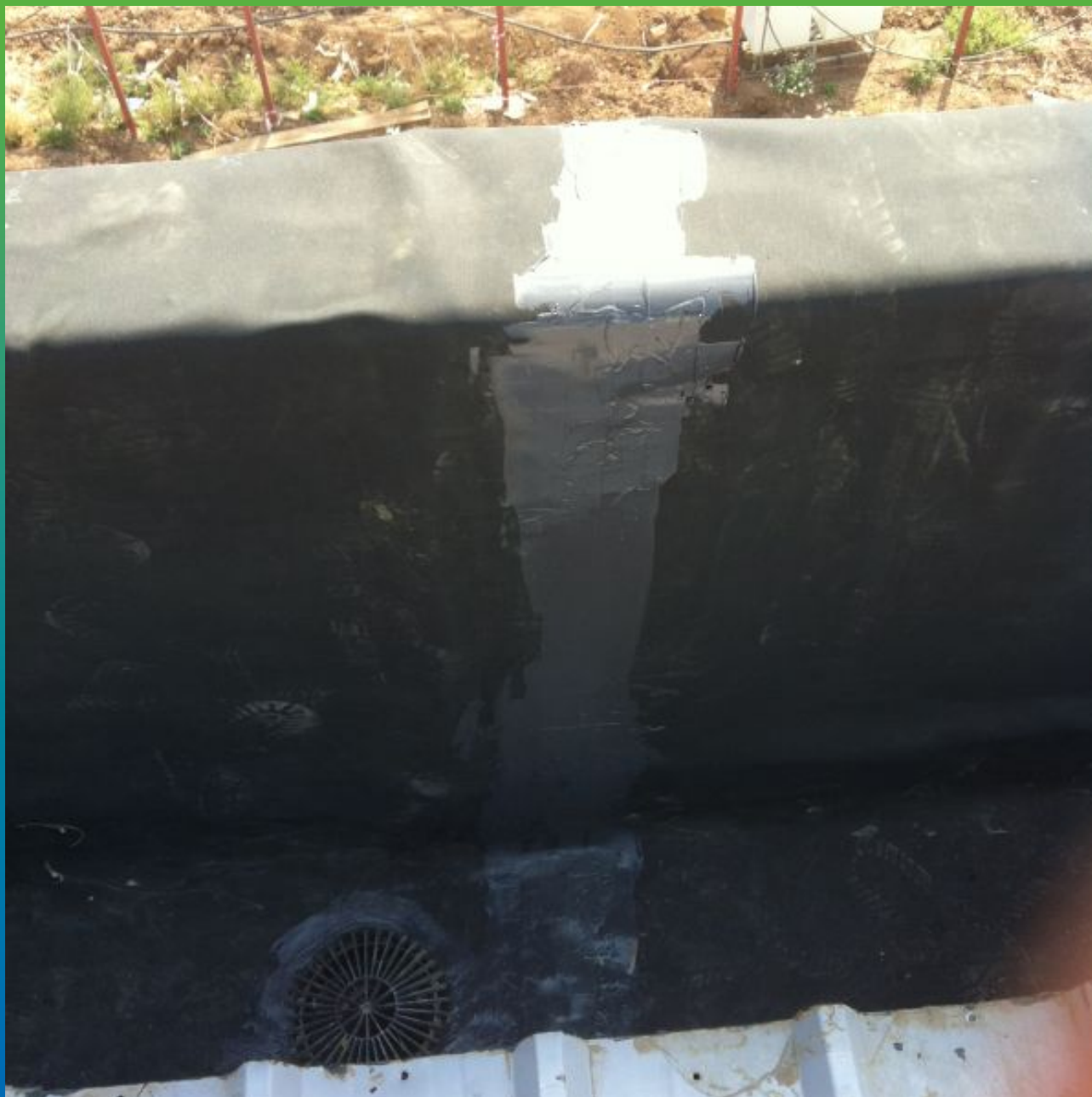
Герметизированные швы, сопряжения, водосточные воронки. Общий вид.