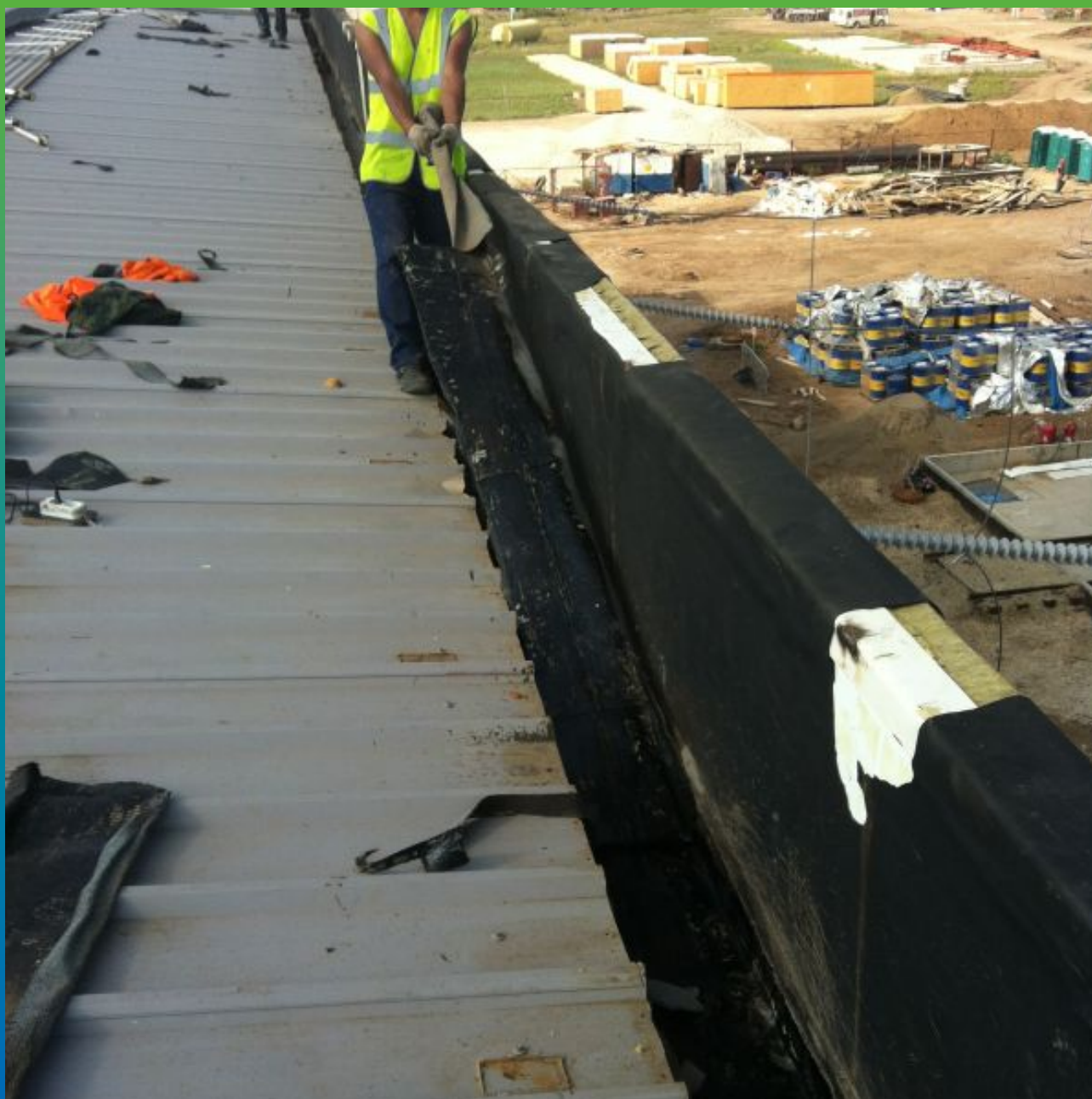
Демонтаж старого покрытия (гидроизоляции) лотка. Общий вид.