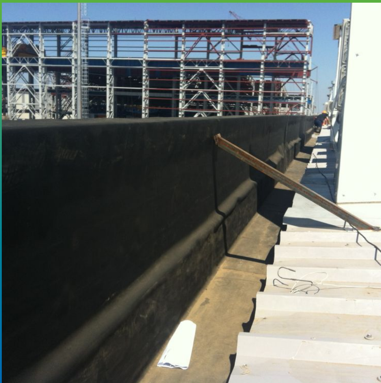
Укладка карт ЭПДМ "Прелести" согласно схемам раскроя. Общий вид.