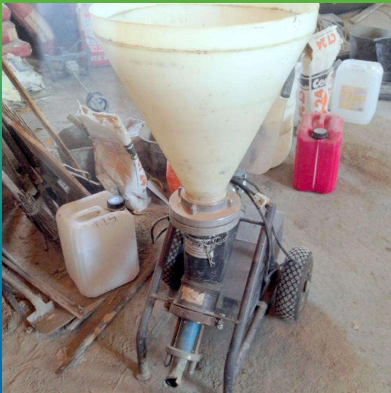
Оборудование шнековый насос "БМП 6"