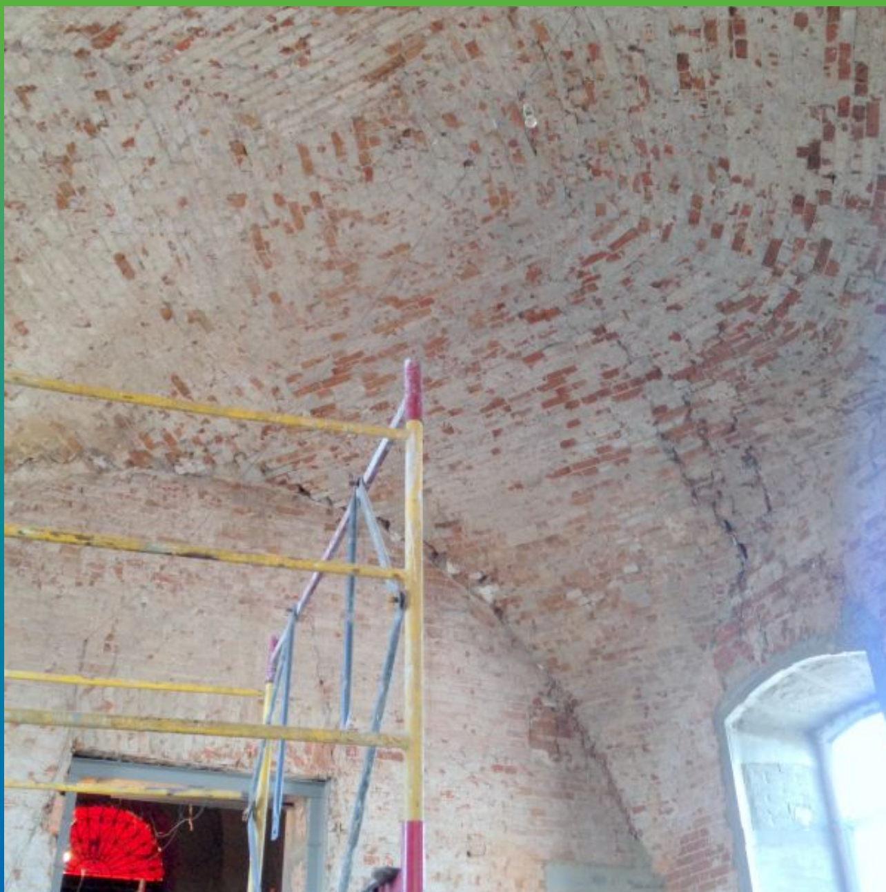
Вид на трещины и дефекты кирпичной кладки.