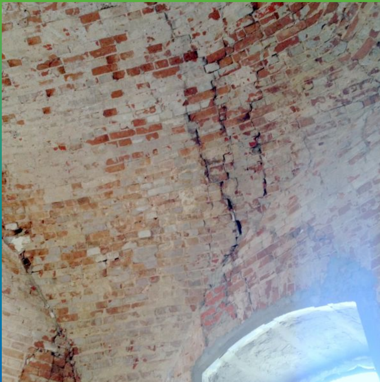
Вид на трещины и дефекты кирпичной кладки. Другой вид.