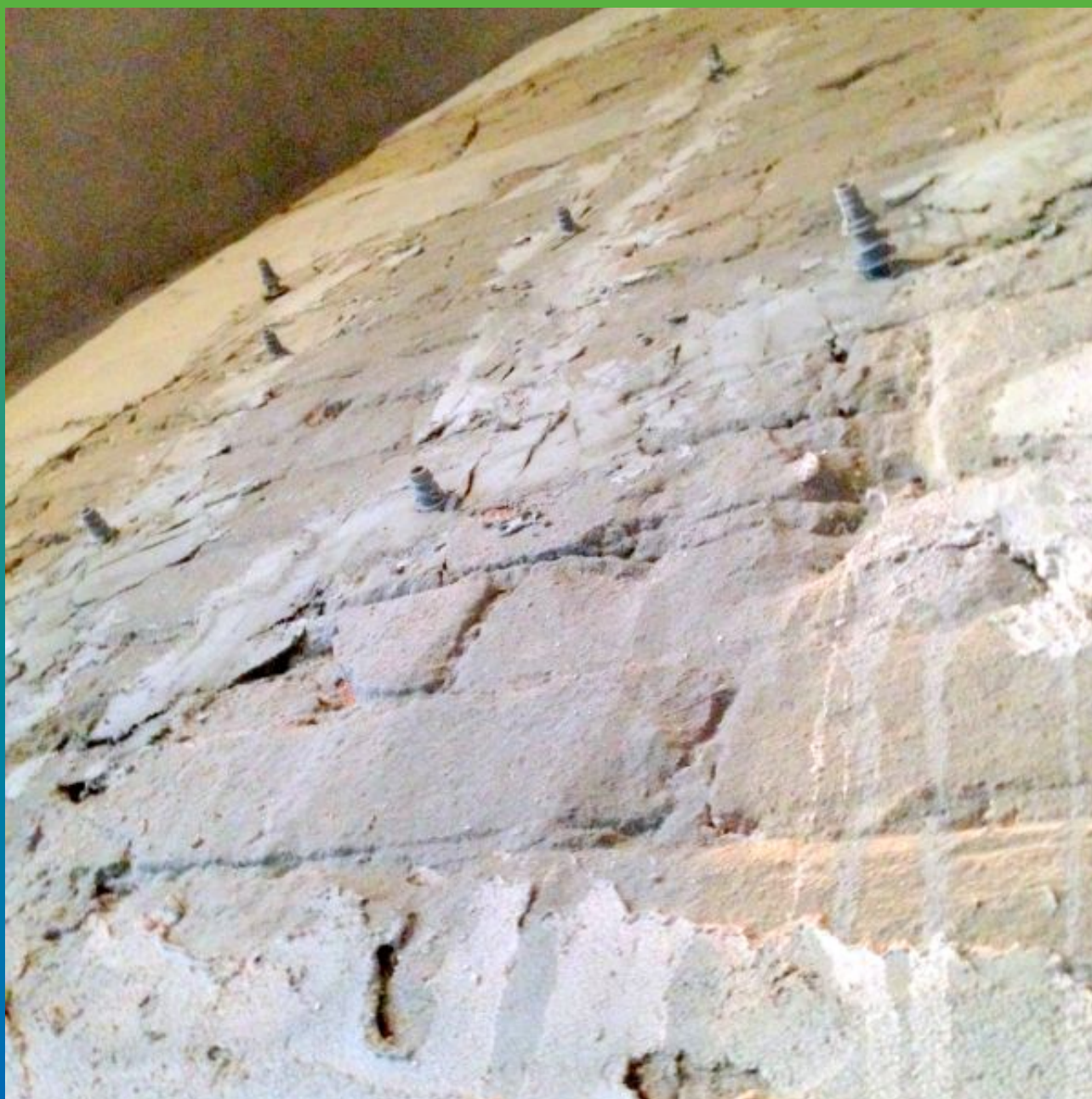
Монтаж инъекционных пакеров "БМ 2830" в трещины.