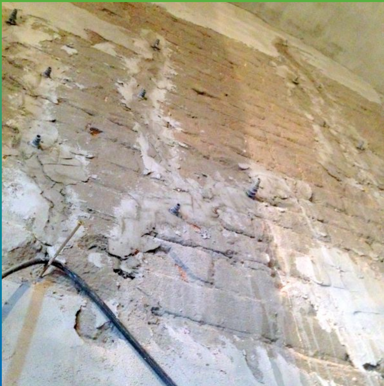
Подготовленный участок для инъектирования микроцементного состава "Максгрут инжекшн". Общий вид.