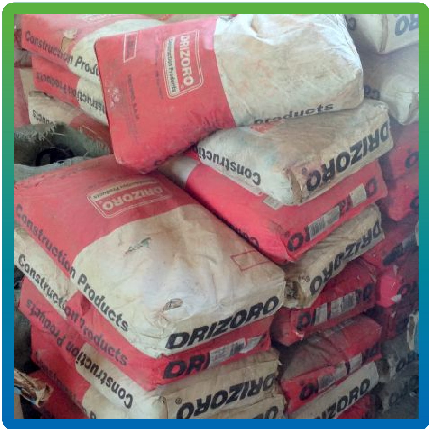
Материал "Максгрут Инжекшн" на объекте.