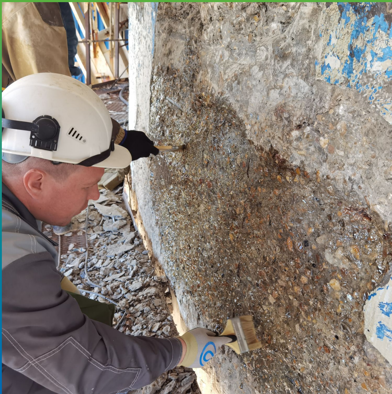
Нанесение грунтовочного слоя ДенсТоп ЭП 106 на пробном участке