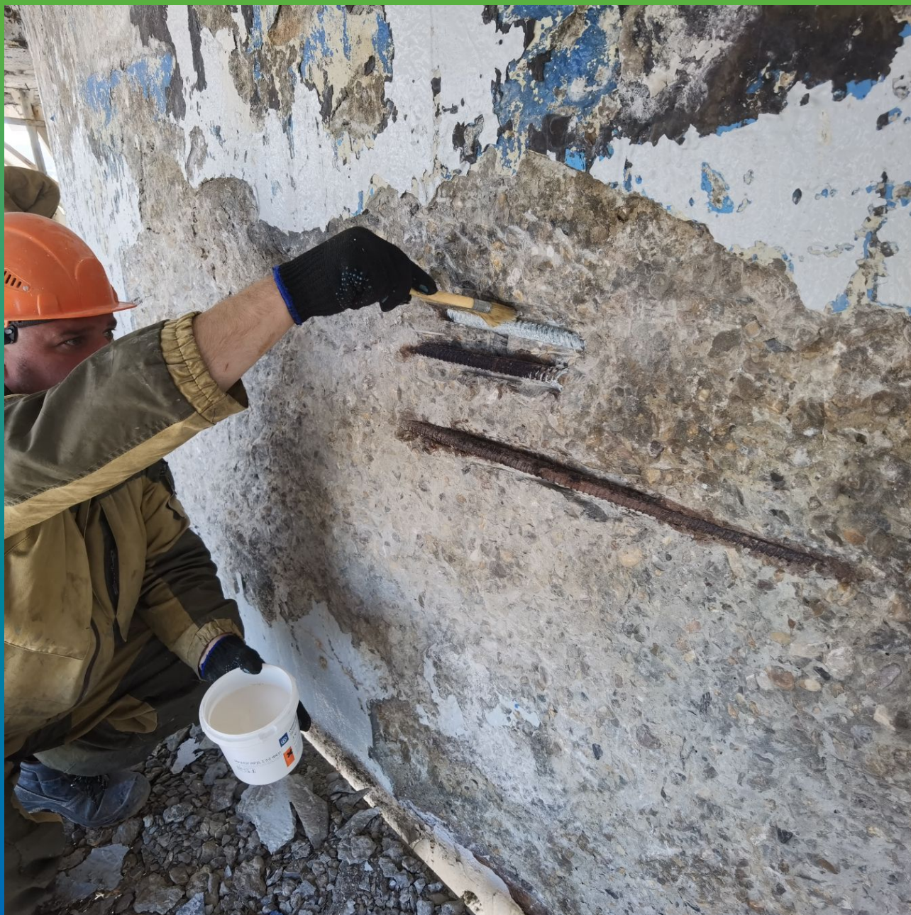
Нанесение пассиватора коррозии Маногард 133 Фер на оголенную арматуру