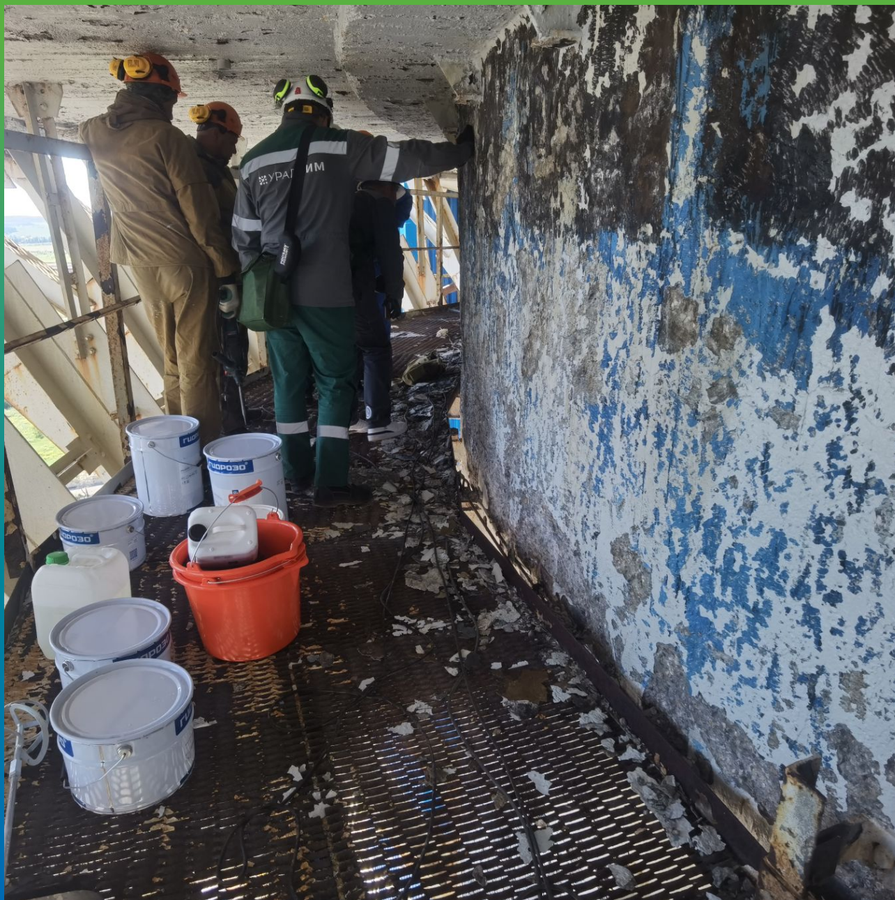
Подготовка поверхности путем отбивки непрочных участков конструкции