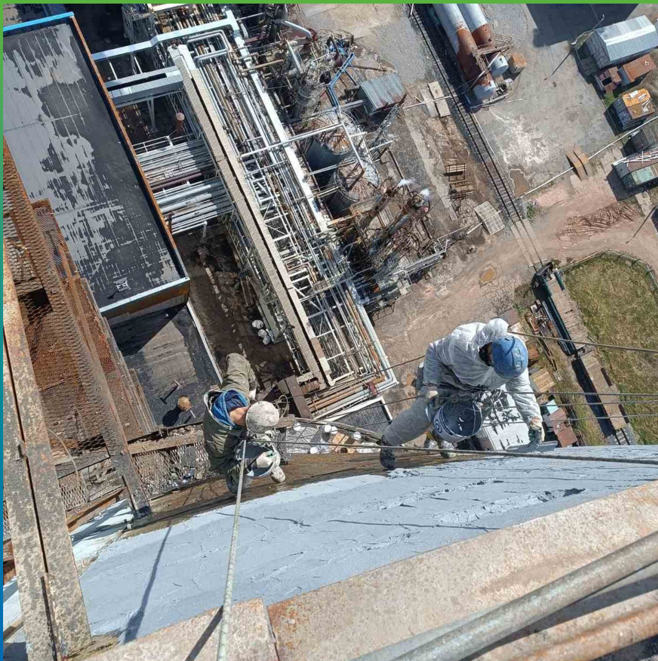
Работа на высоте с материалом Манопокс 331