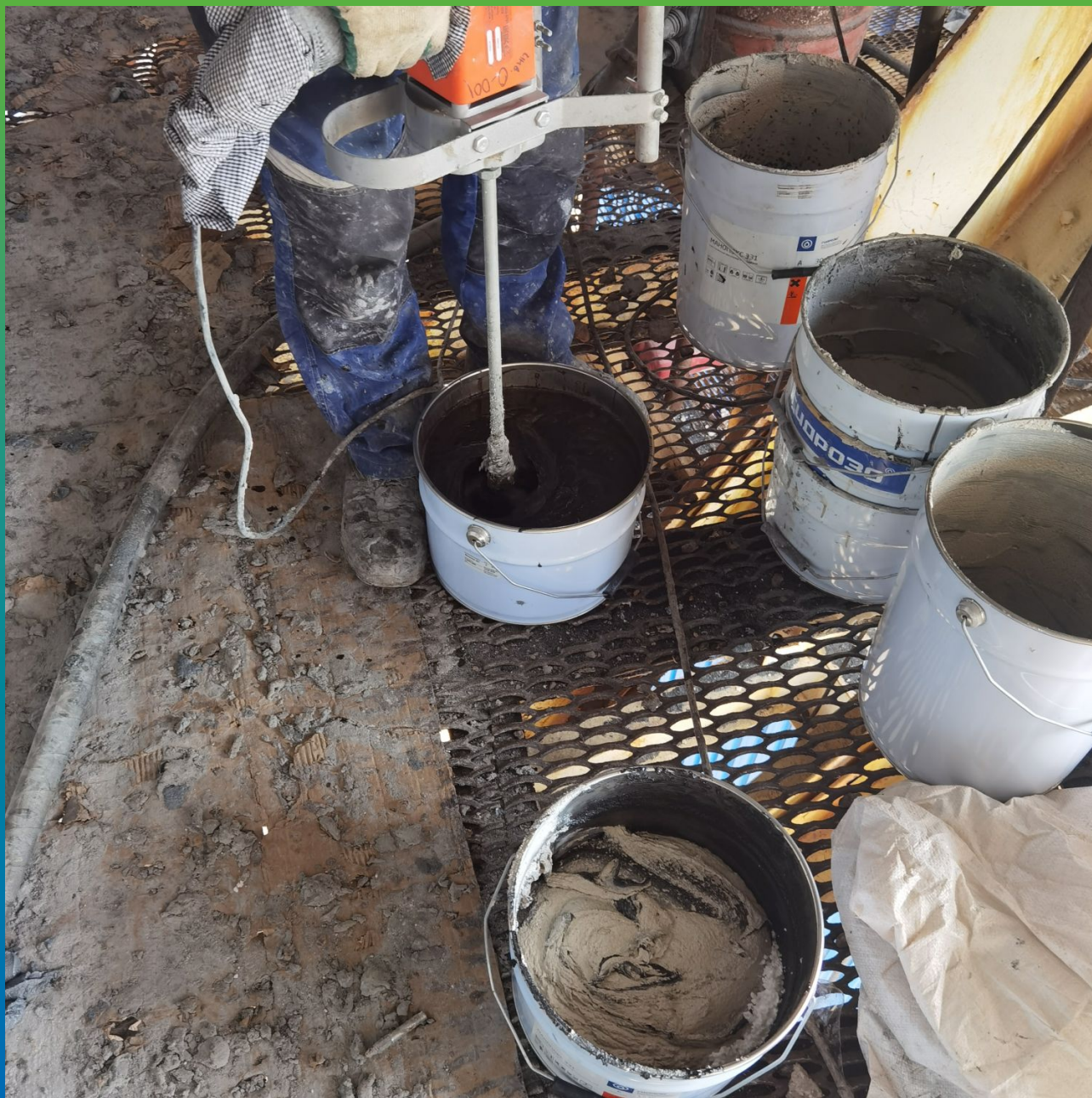
Подготовка к нанесению ремонтного состава на эпоксидной основе Манопокс 331