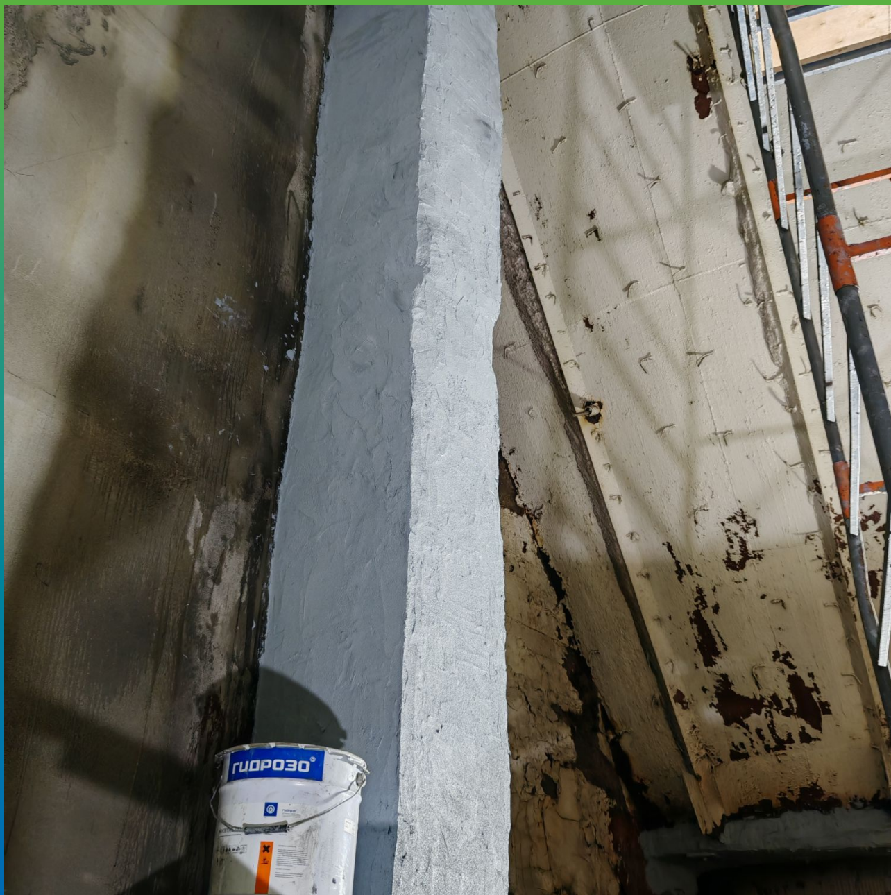
Ремонт внутренних вертикальных участков грануляционной башни