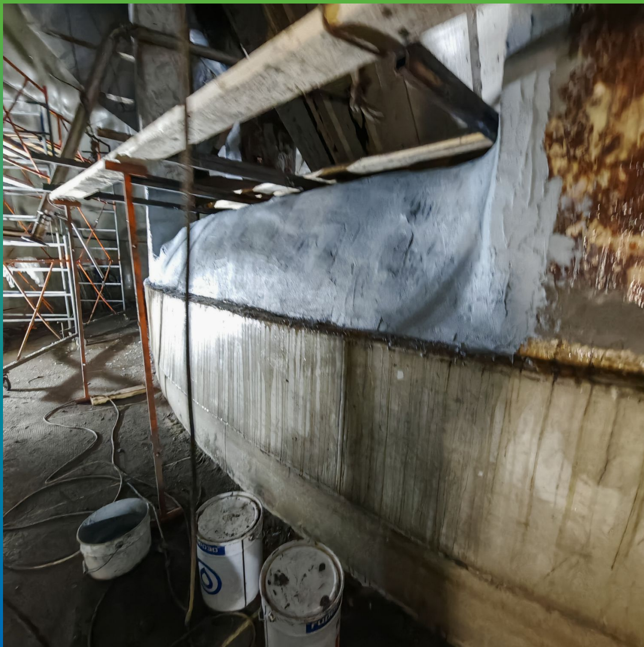
Ремонт внутренних горизонтальных участков грануляционной башни