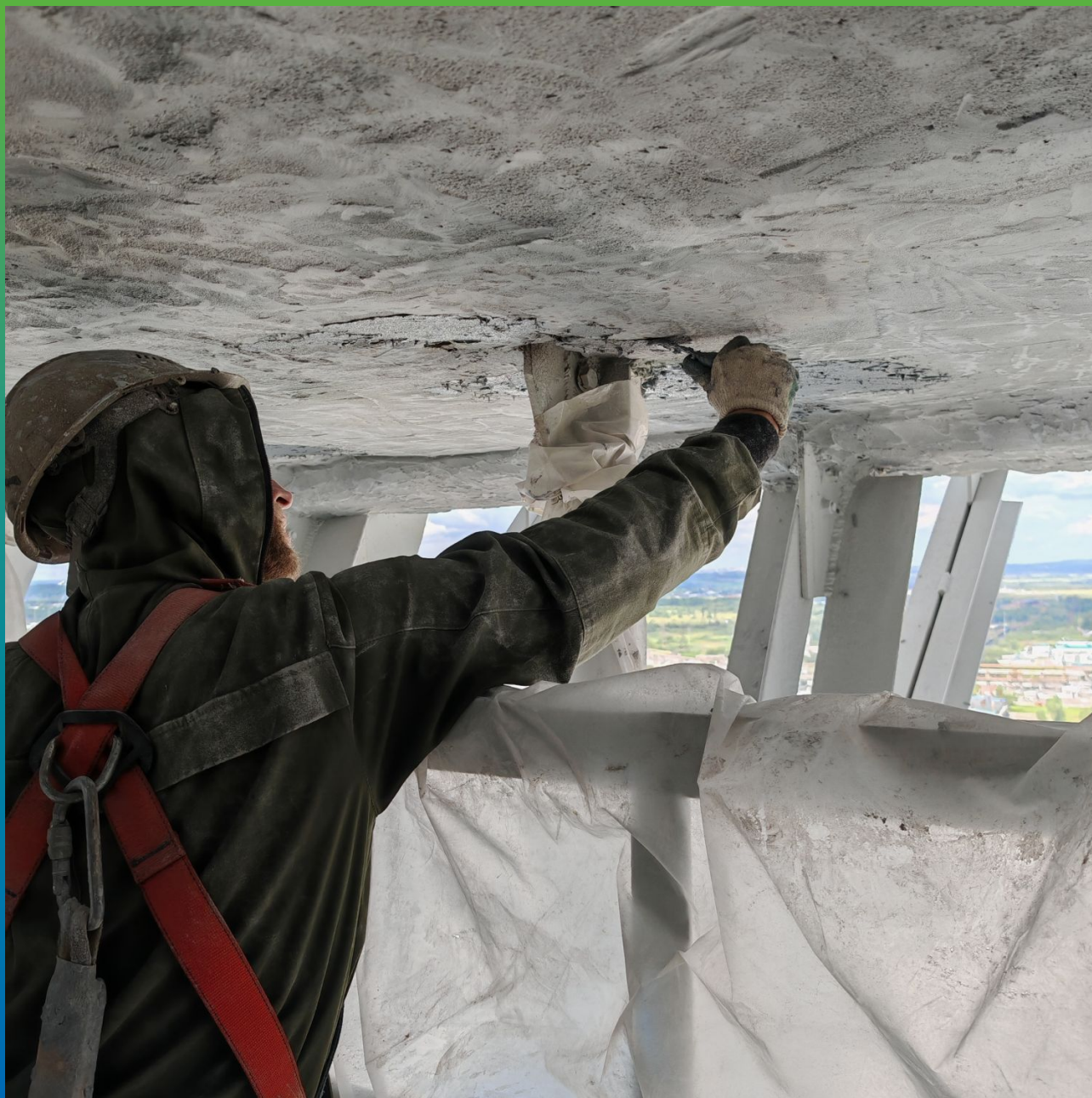
Ремонт горизонтальных участков материалом Манопокс 331