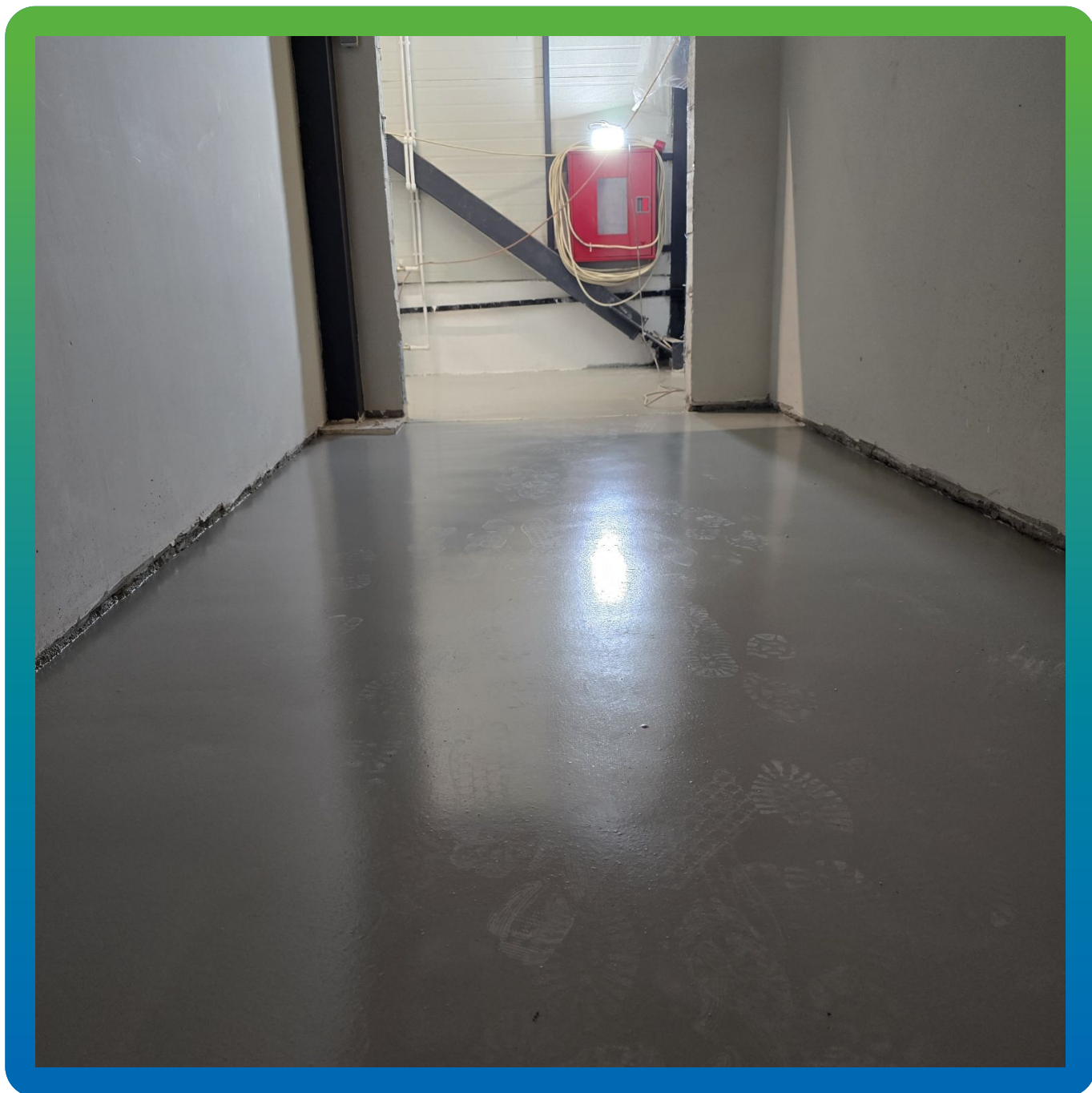
Участок с примененным покрытием