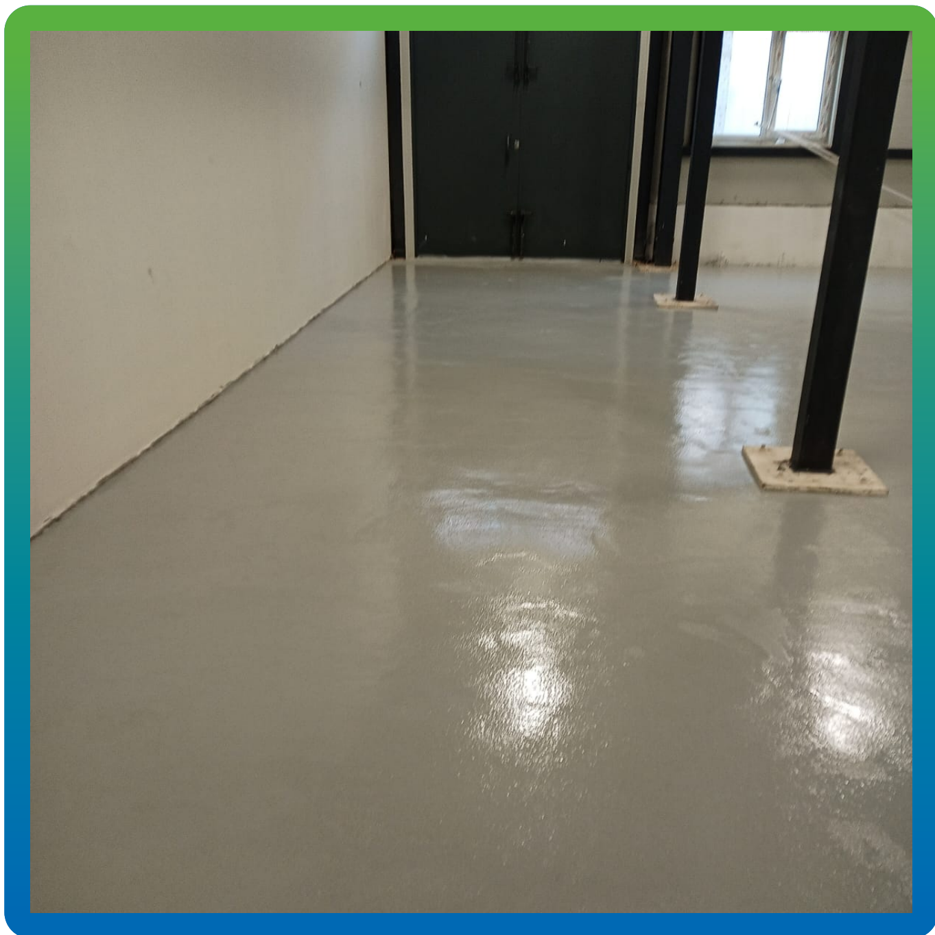
Вид на нанесенное покрытие ДенсТоп ПМ 605 Тровел