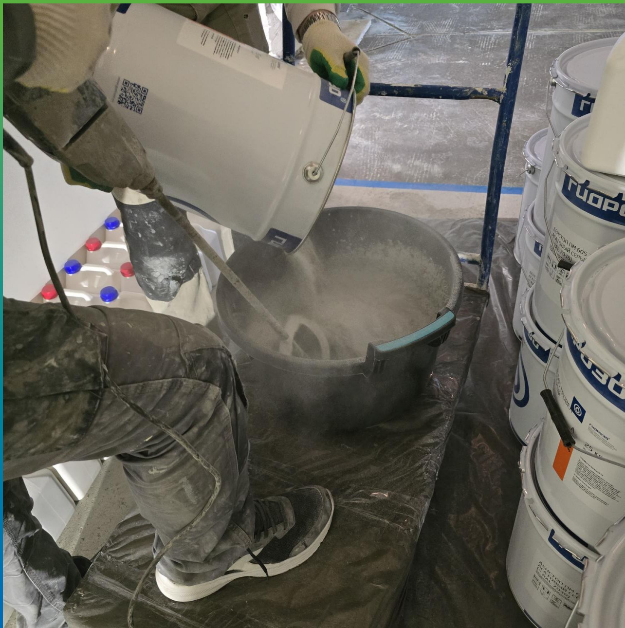
Замешивание компонентов материала ДенТоп ПМ 605 Трвел