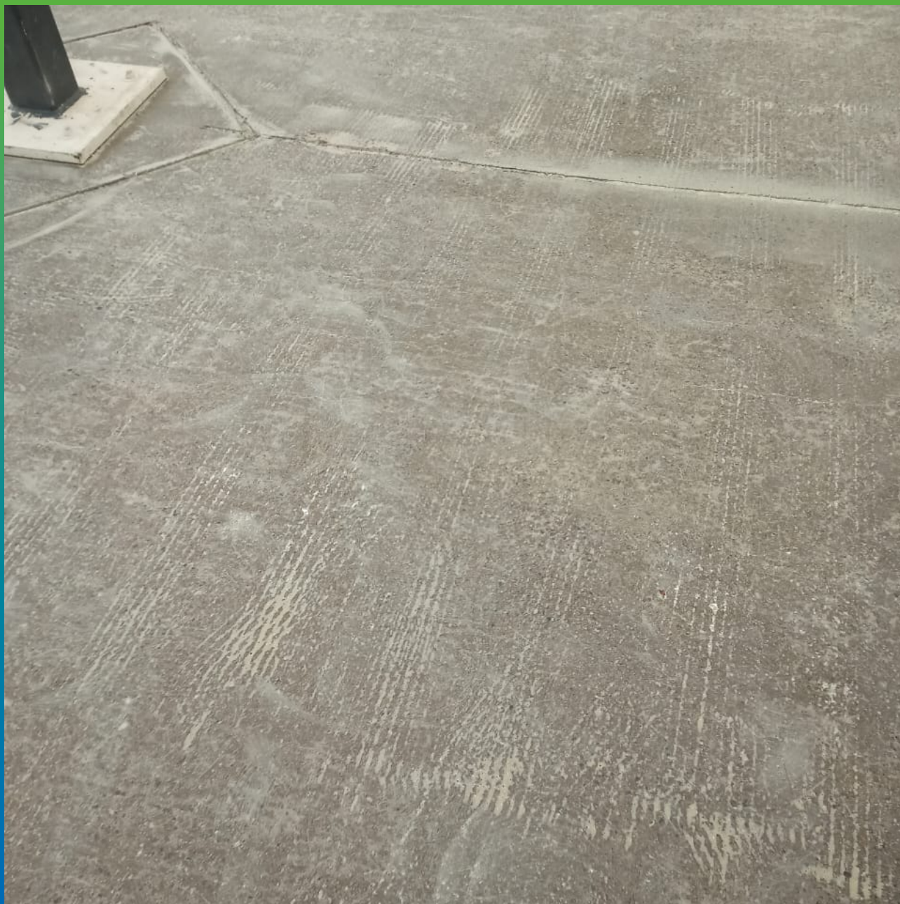
Загрунтованное основание с пропилами