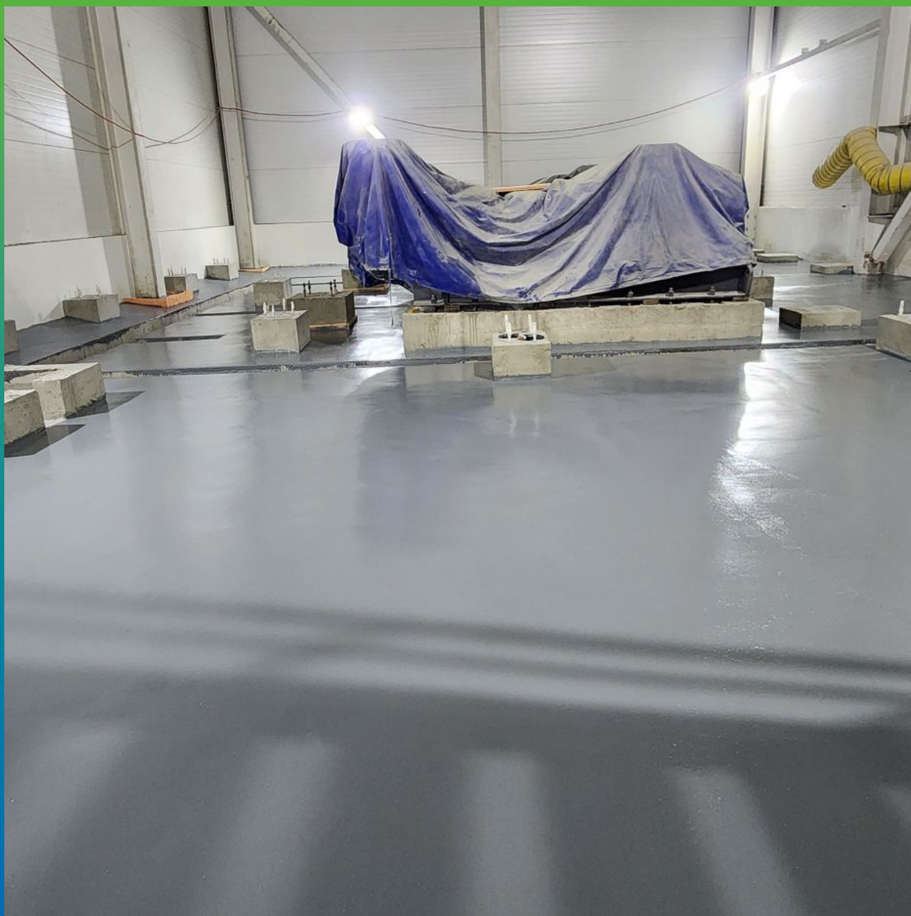
Участок с примененным покрытием толщиной 9 мм