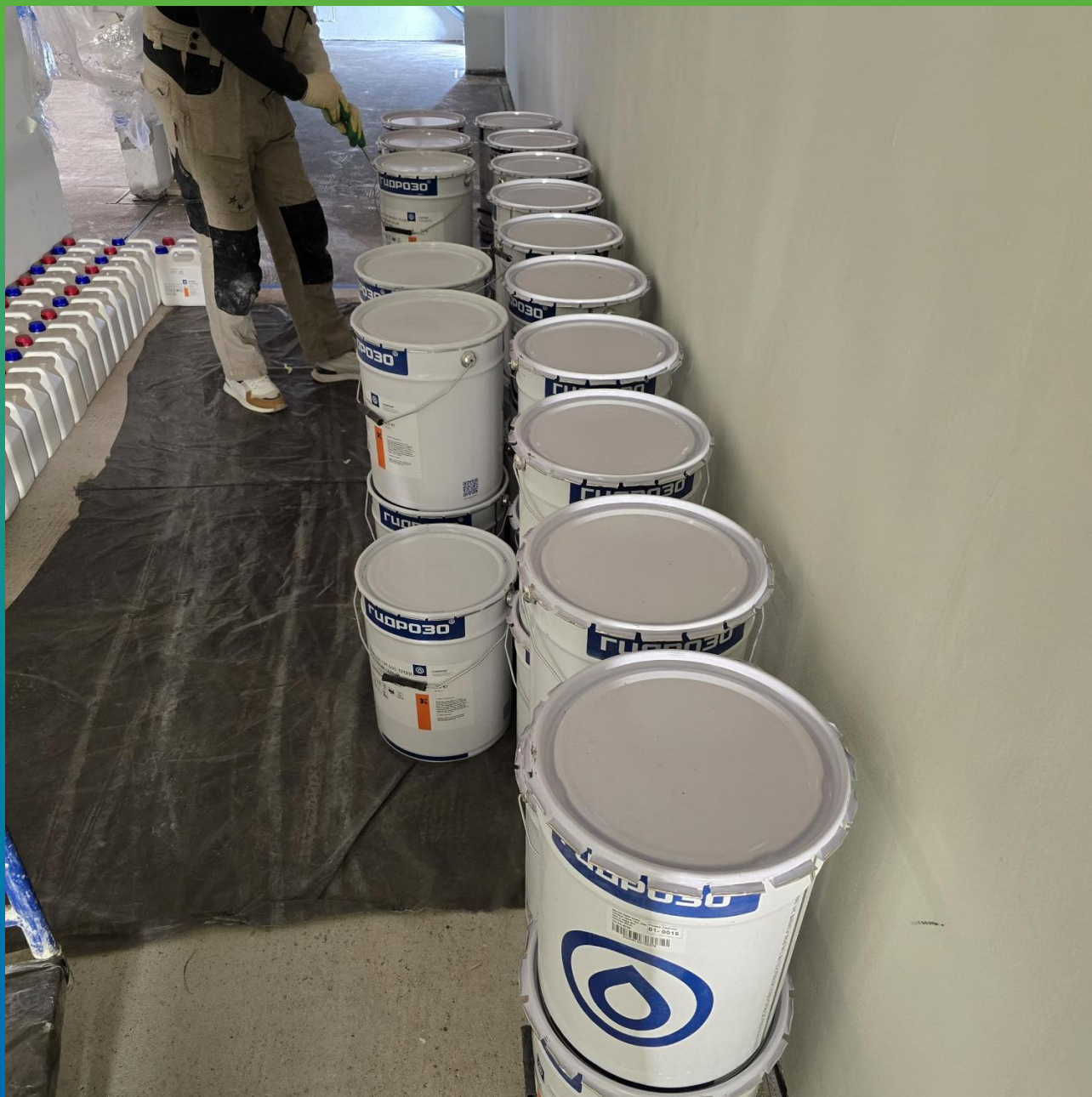
Материалы на объекте перед замешиванием