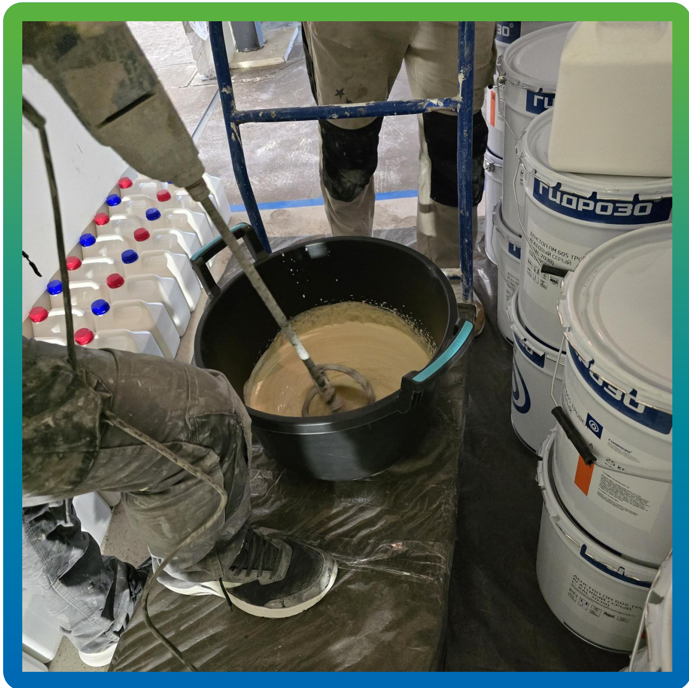
Замешивание грунтовочного состава ДенсТоп ПМ 600 на объекте