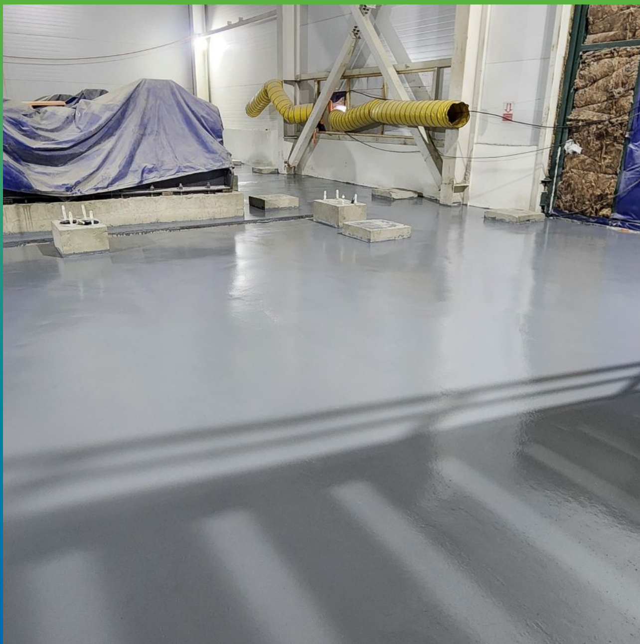
Вид на покрытие