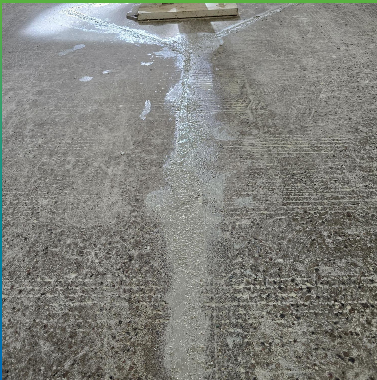
Вид на загрунтованную поверхность ДенсТоп ПМ 600 с заполненными пропилами составом ДенсТоп ПМ 605 Тровел