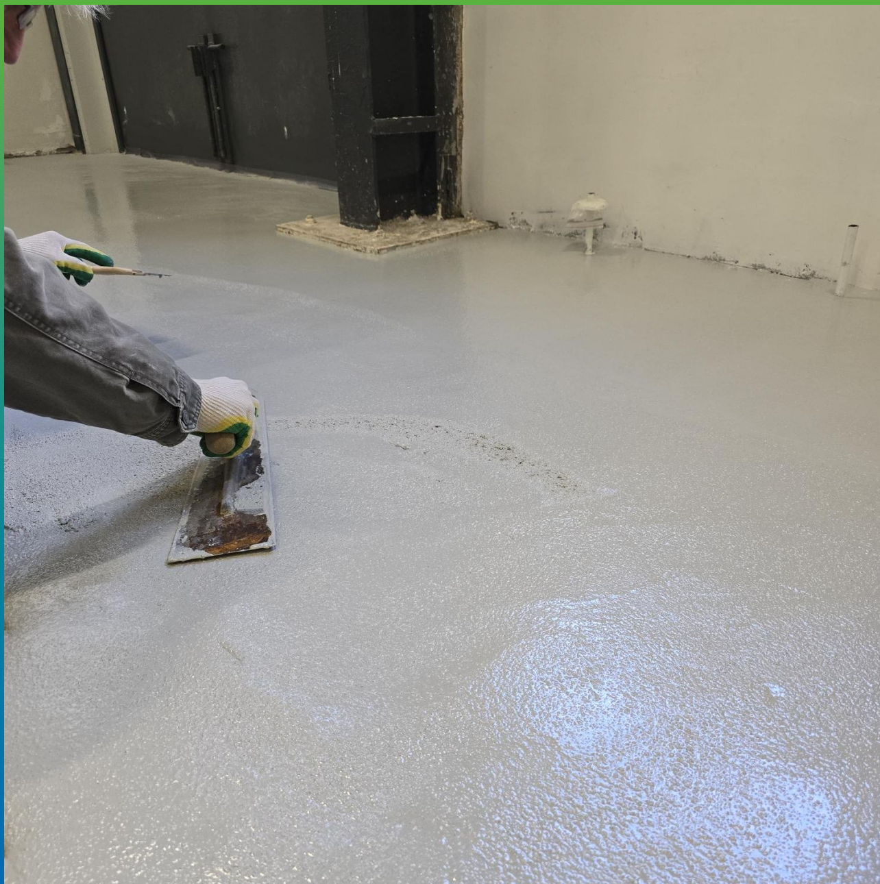
Выглаживание поверхности после нанесения