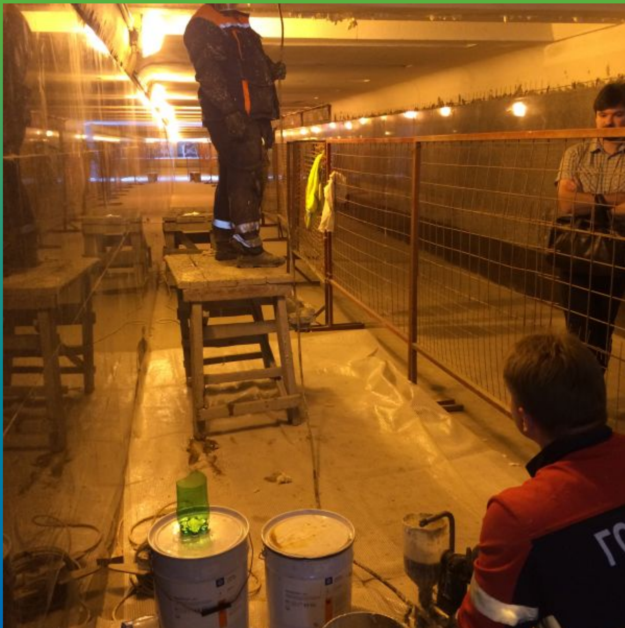
Инъектирование полиуретановой смолы Манопур 143