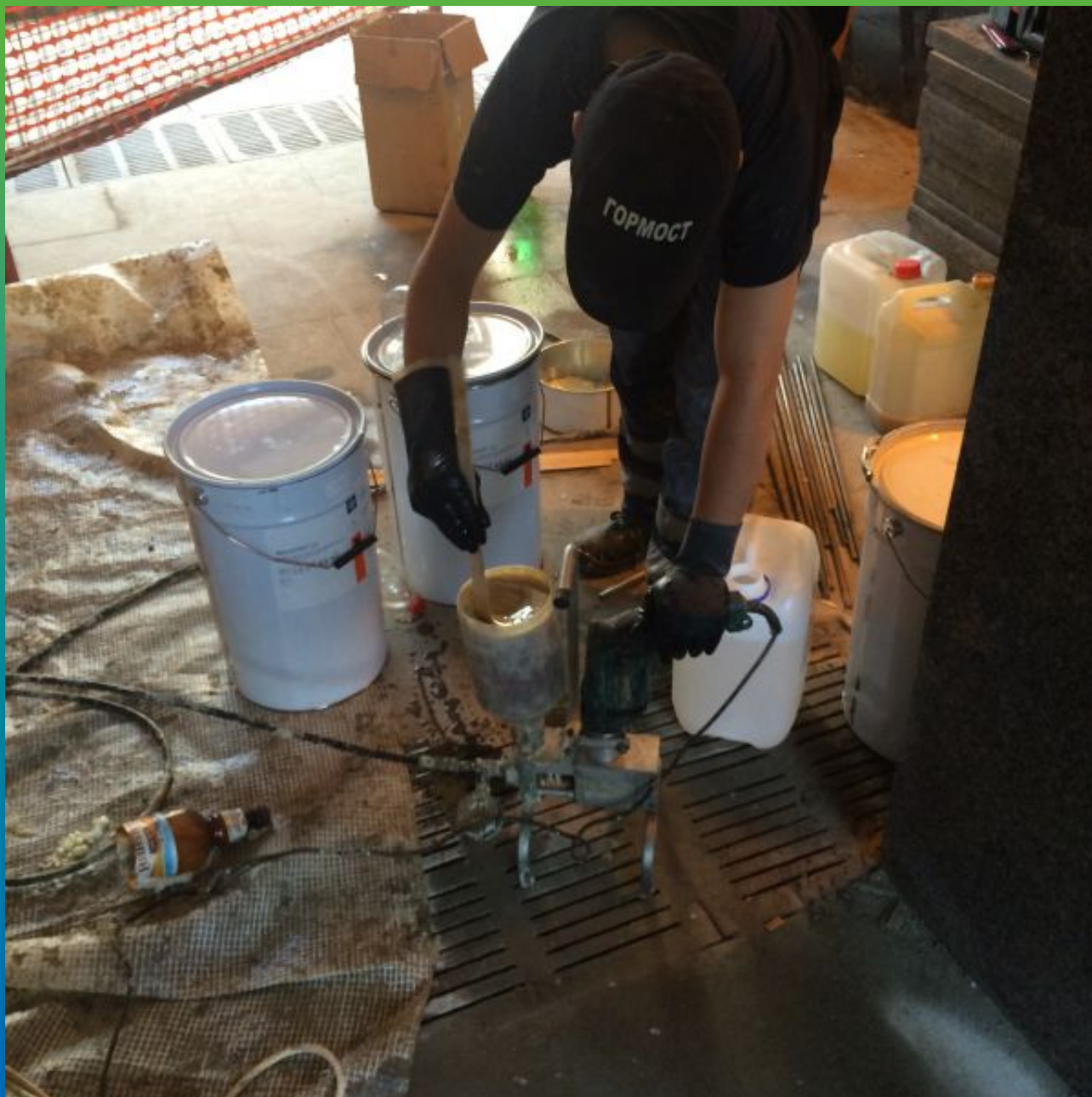
Смешивание двух компонентов Манопур 15