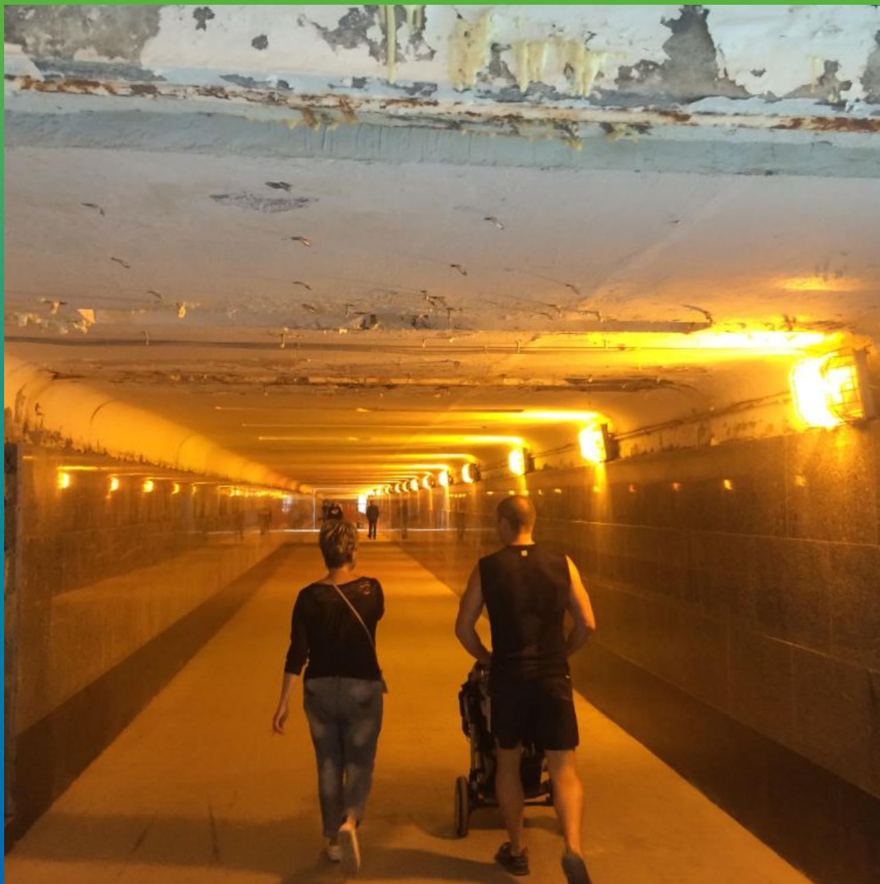
Вид объекта после инъектирования