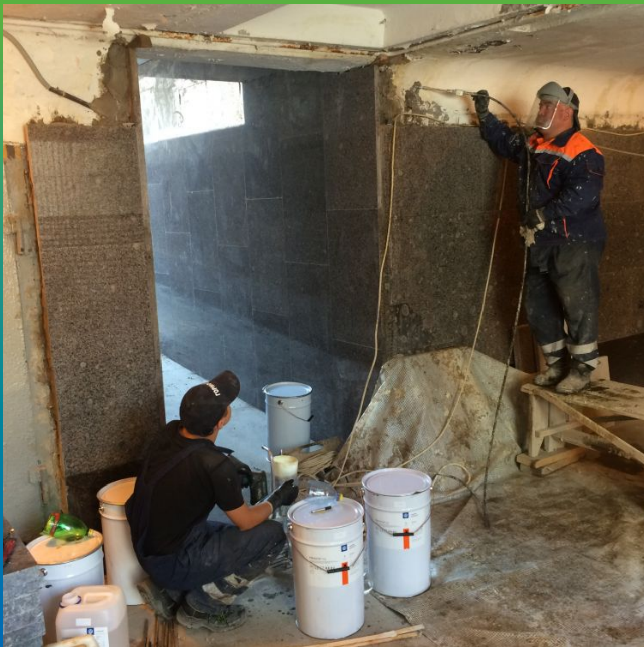
Инъектирование полиуретановой пены Манопур 15