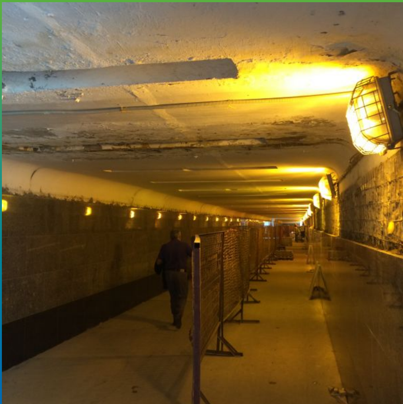
Вид объекта изнутри