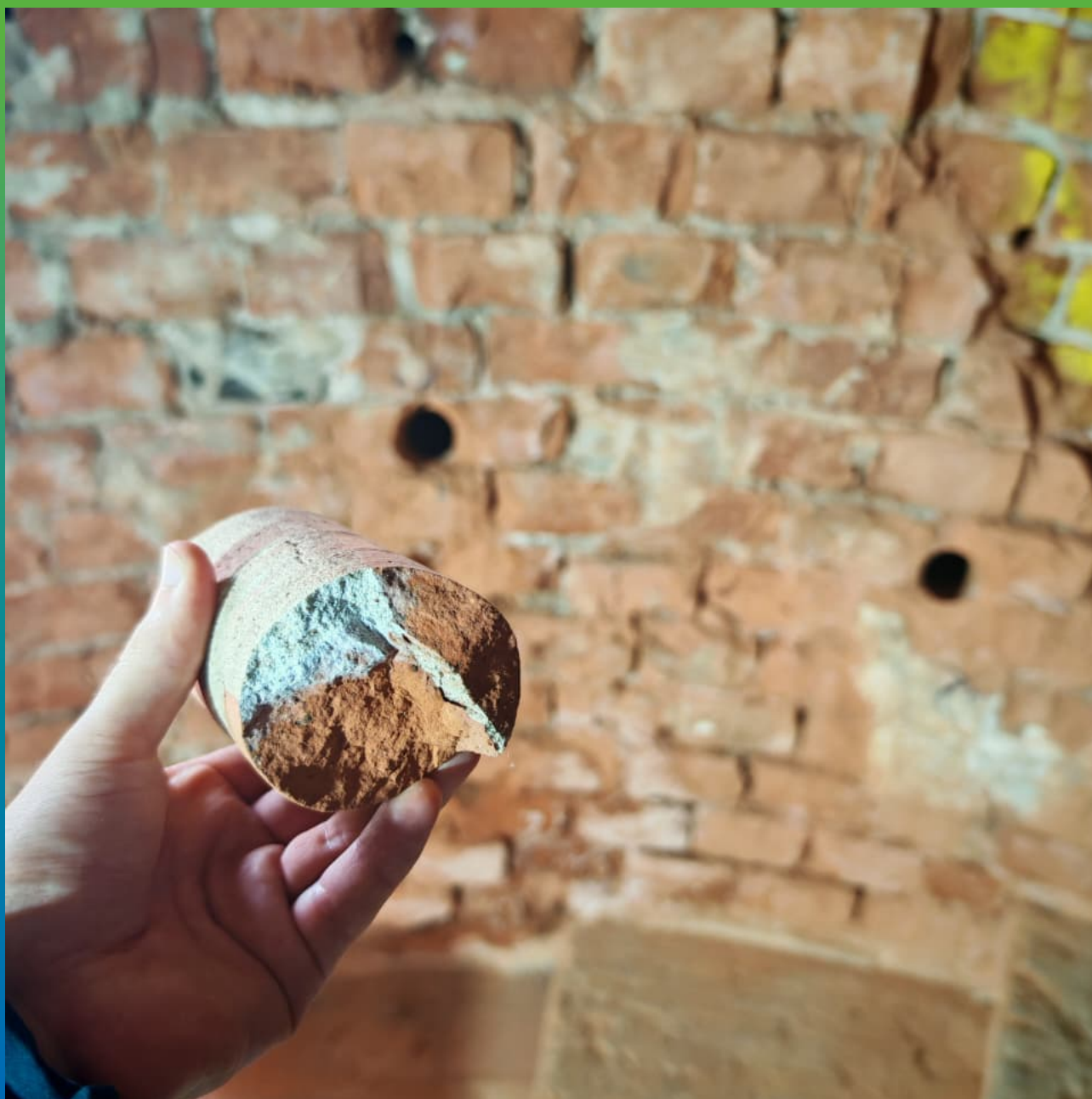
Вырубка керна из кирпичной кладки