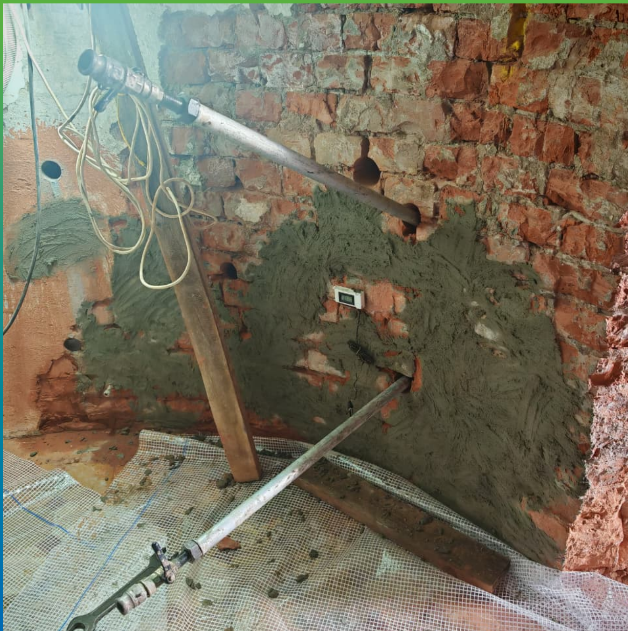
Установка инъекционных трубок