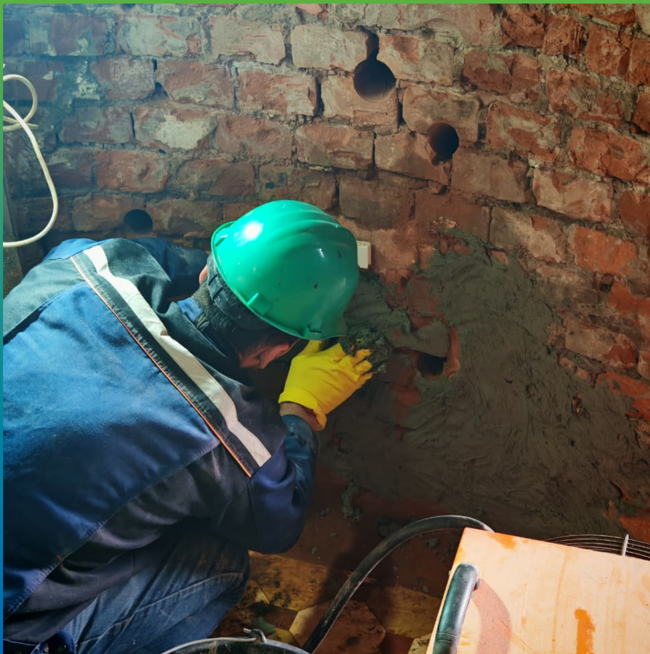
Нанесение состава Стармекс Лайм С в зоне инъекционных работ