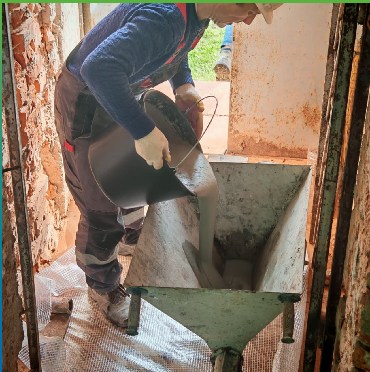
Подача состава Маноцем Фил в инъекционное оборудование