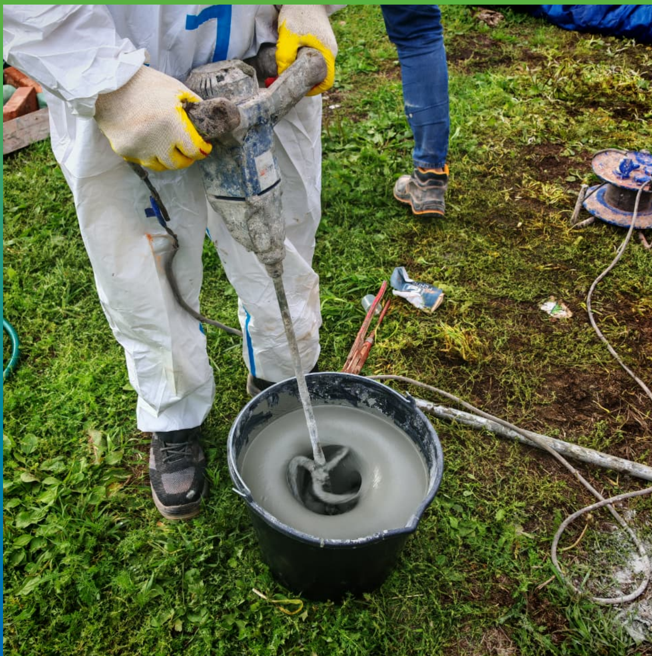
Процесс замешивания инъекционного состава Маноцем Фил