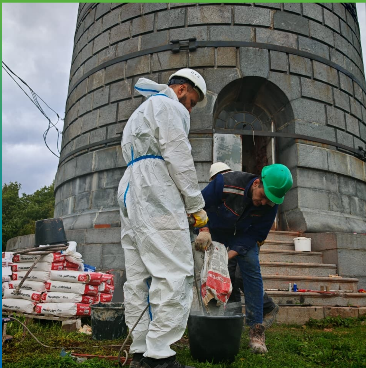
Процесс замешивания инъекционного состава Маноцем Фил