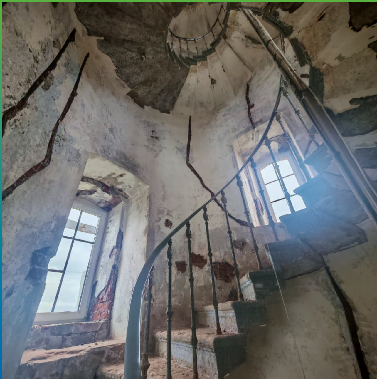
Вид кирпичной кладки маяка изнутри