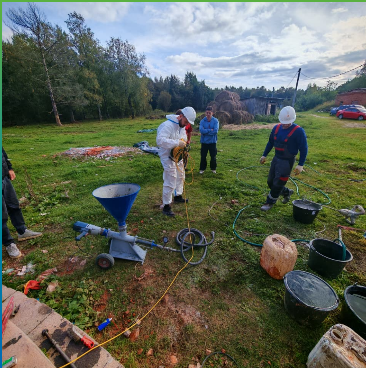
Подготовка инъекционного оборудования