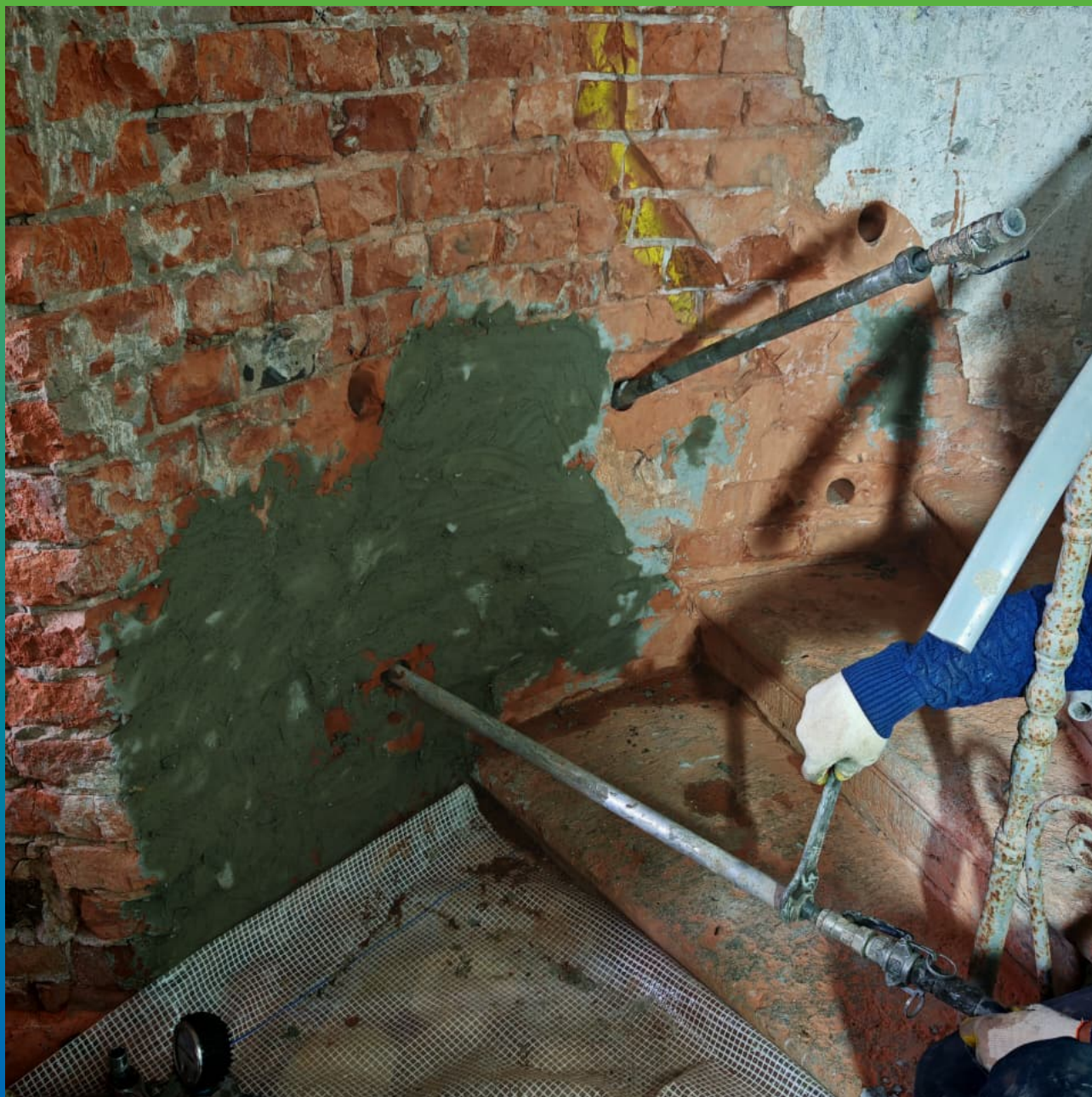
Инъектирование кирпичных стен составом Маноцем Фил