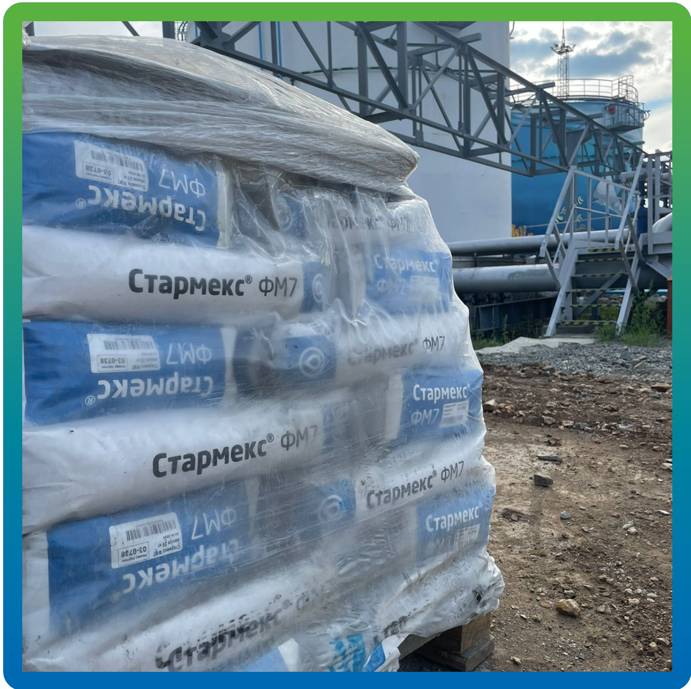
Высокоподвижный ремонтный подливочный состав Стармекс ФМ7