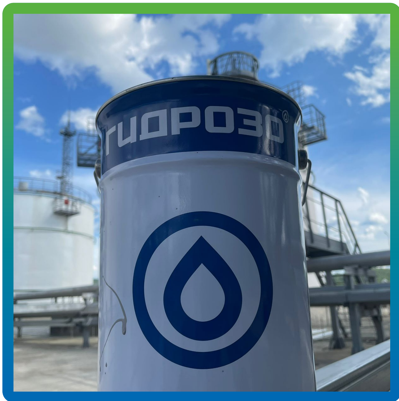
Водоразбавимый эпоксидный грунтовочный состав ДенсТоп ЭП 105