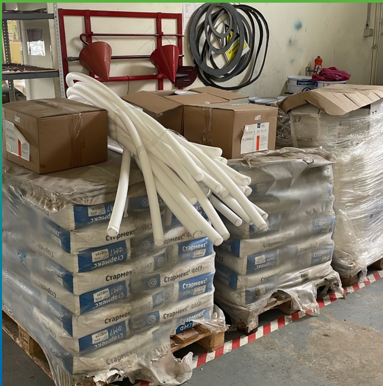
Материал на объекте