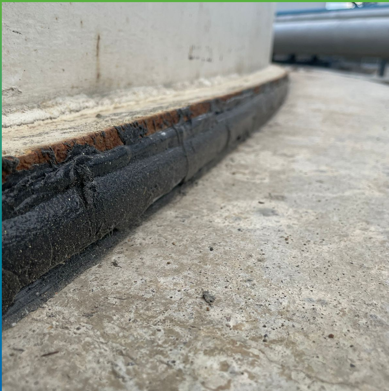
Участок после ремонта