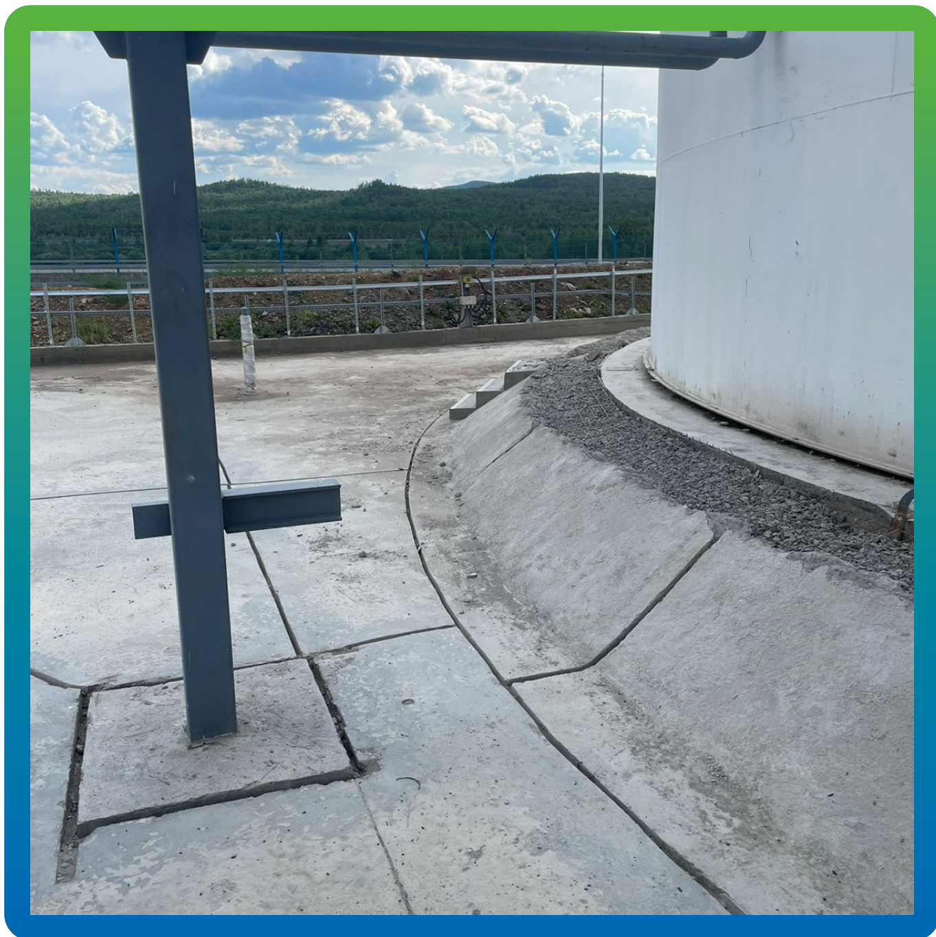
Зачищены слабые слои основания