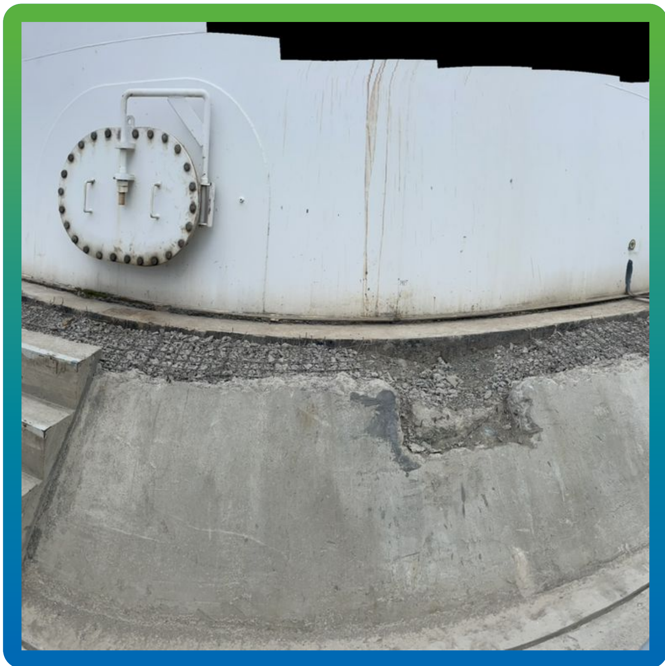
Дефекты бетонной обваловки