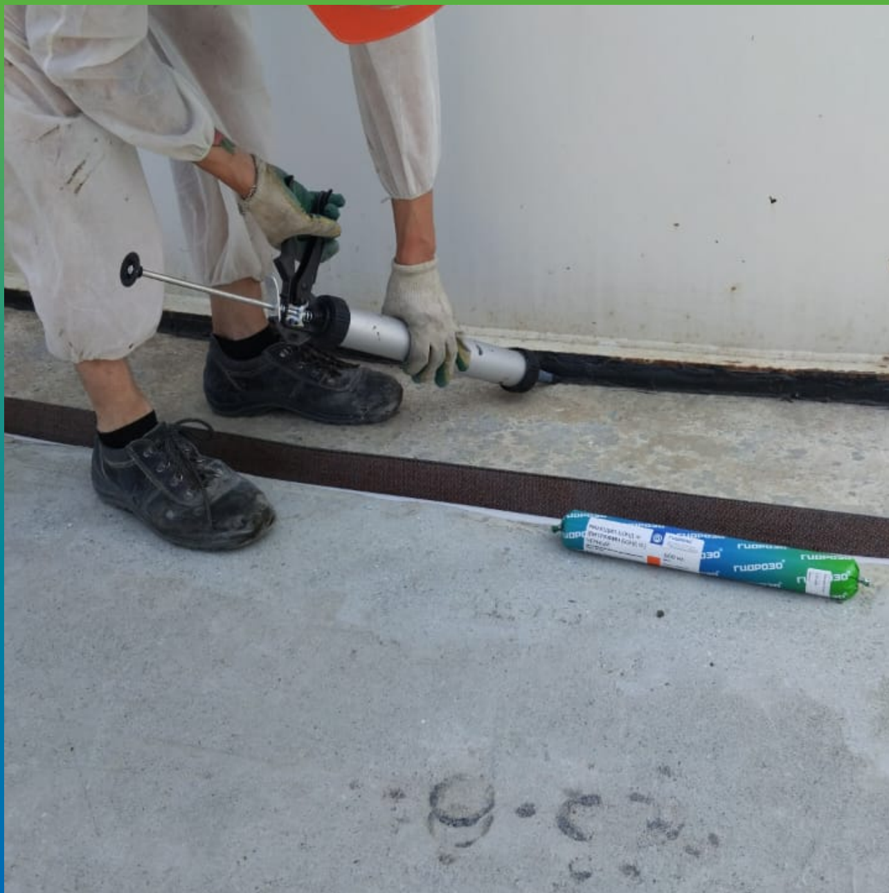
Герметизация примыкания к отмостке