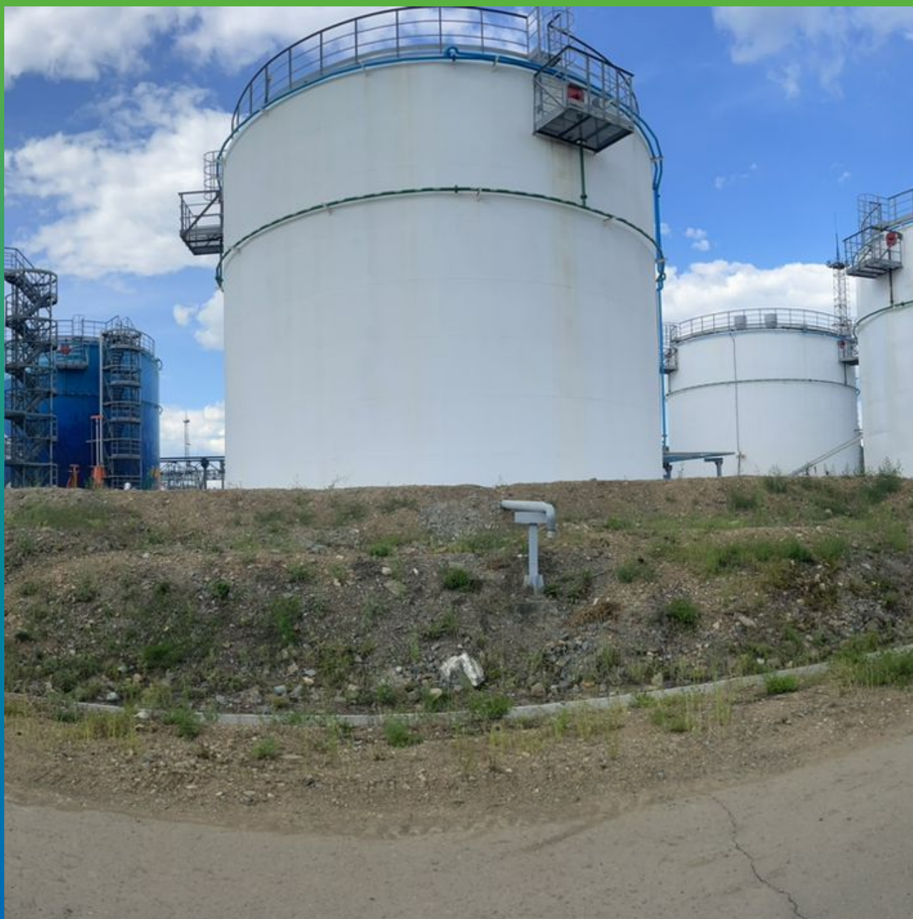
Площадка парка ГСМ