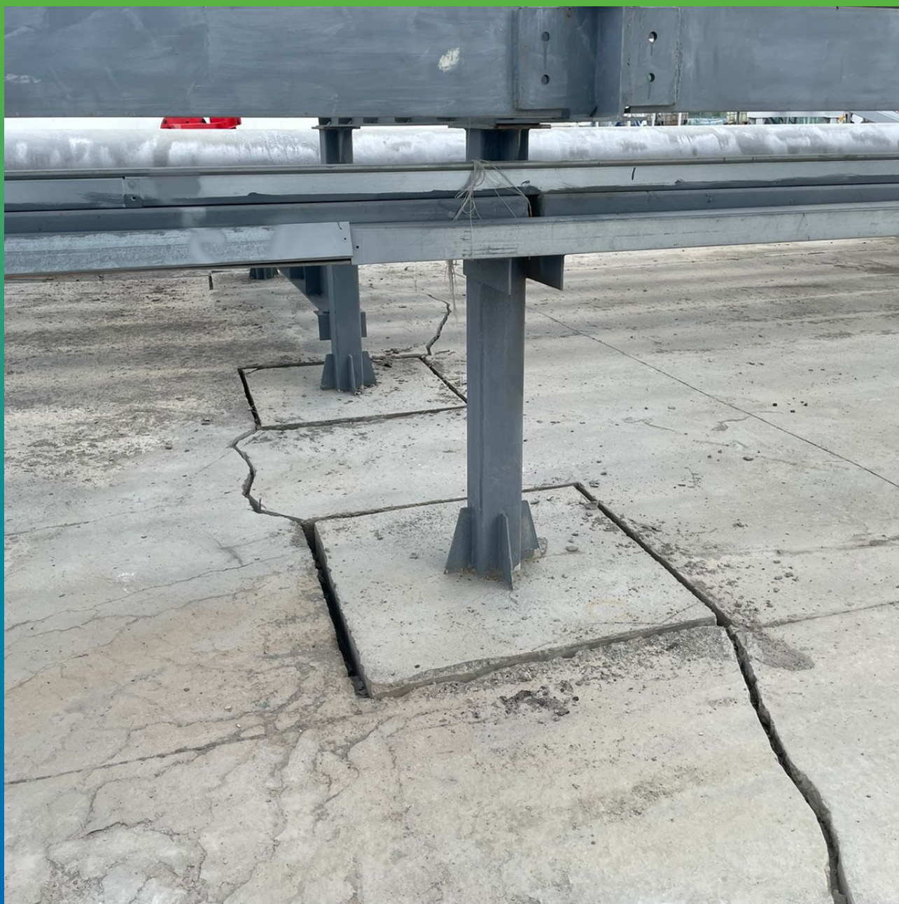
Расшивка трещин бетонной площадки