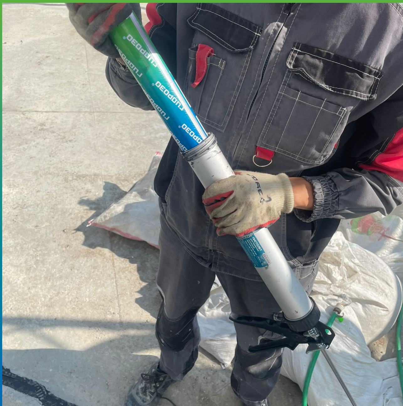
Подготовка герметизирующего состава Манодил Бонд Ф