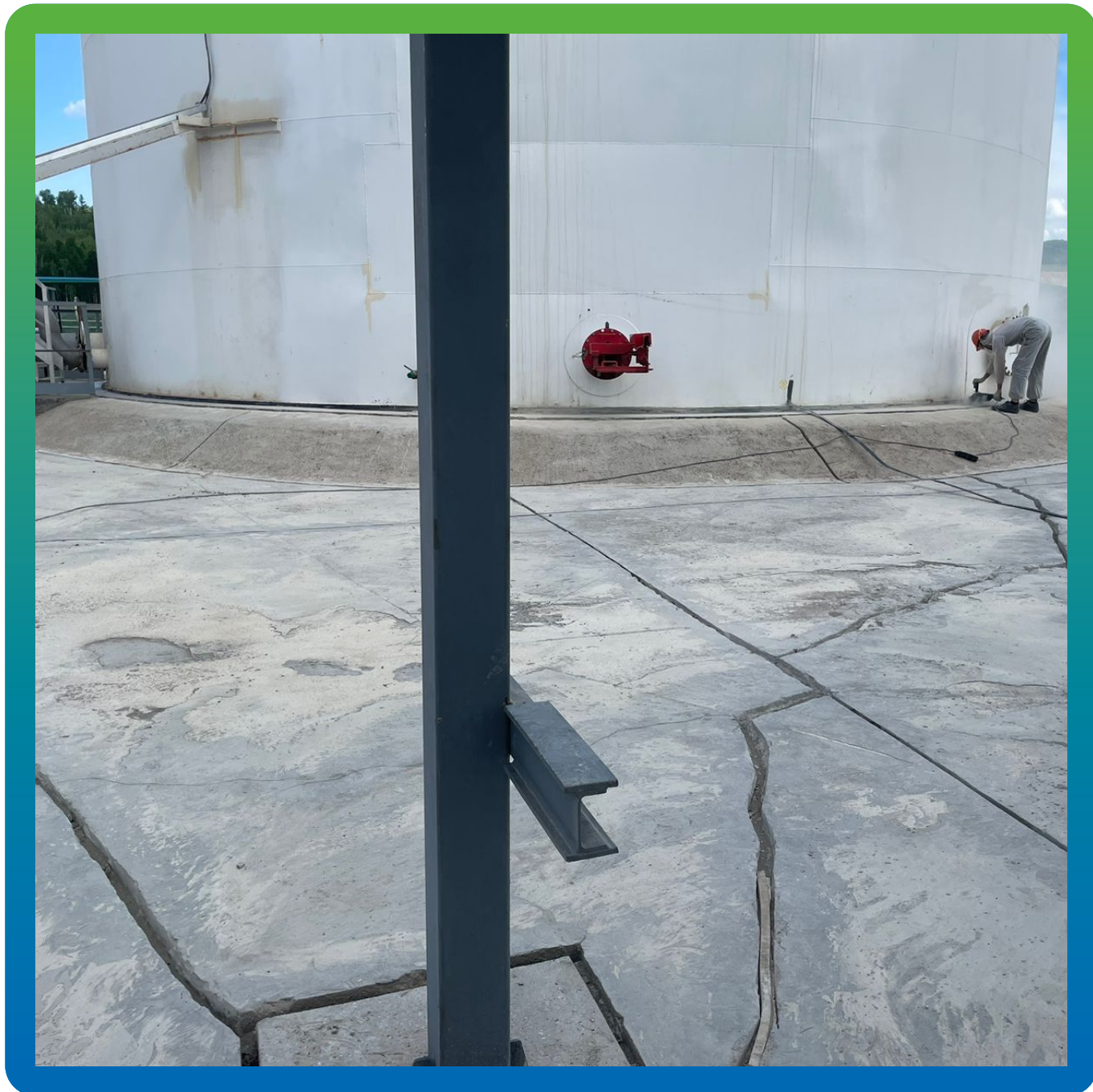
Трещины бетонной площадки