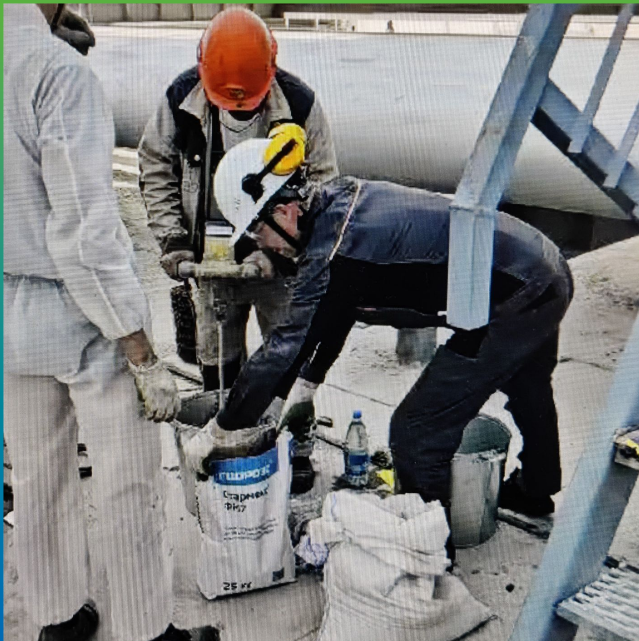
Замешивание подливочного ремонтного состава Стармекс ФМ7