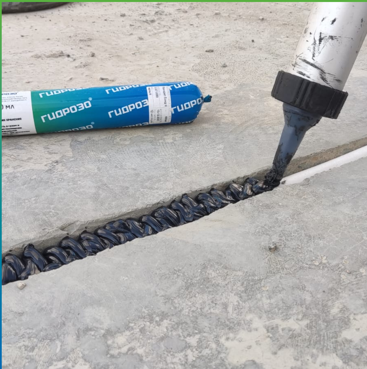
Нанесение высокоэластичного химстойкого герметизирующего состава Манодил Бонд Ф