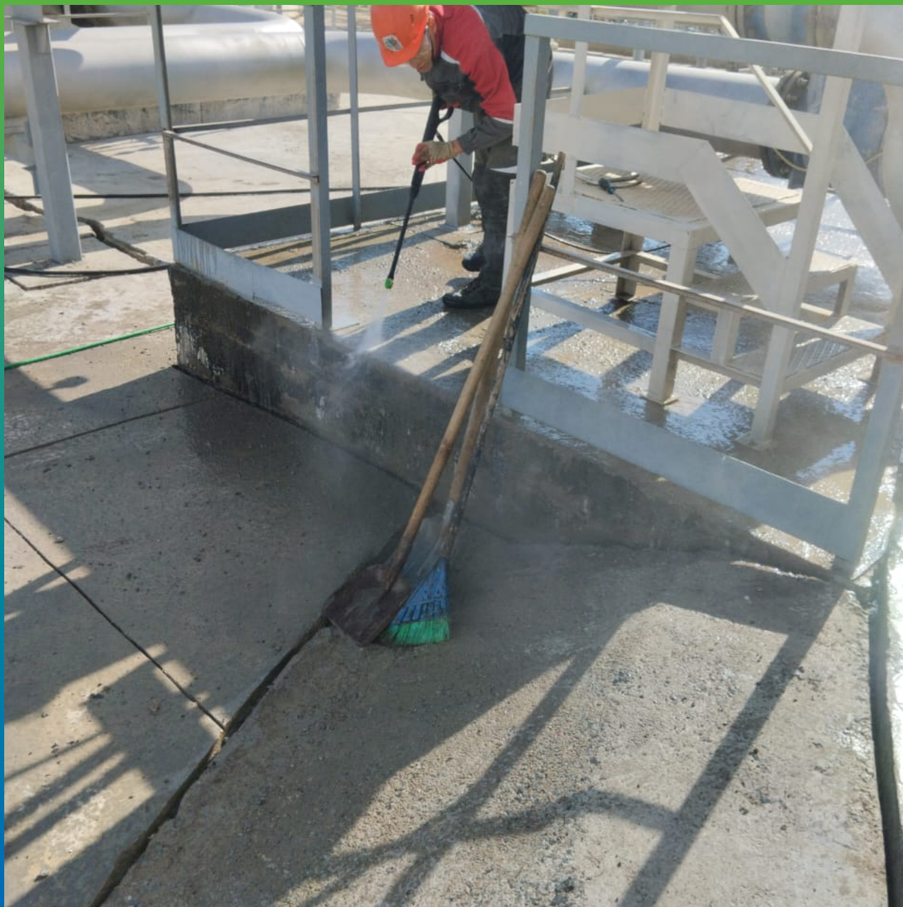
Подготовка трещин основания