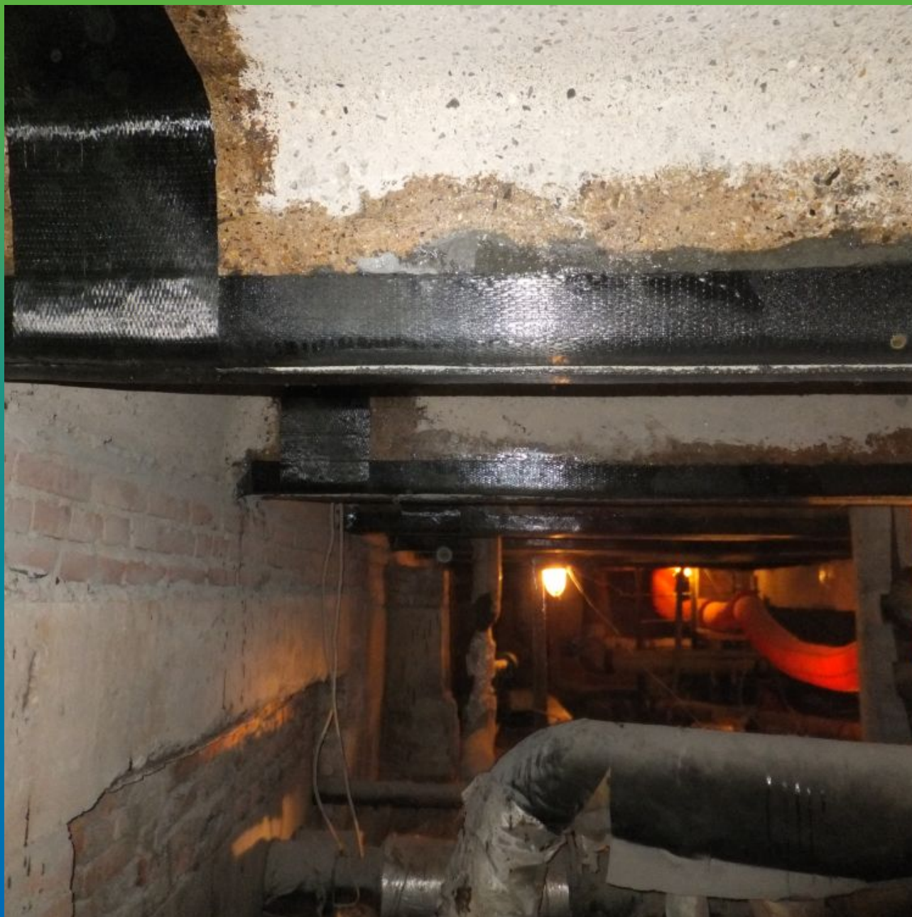
Вид усиленного объекта