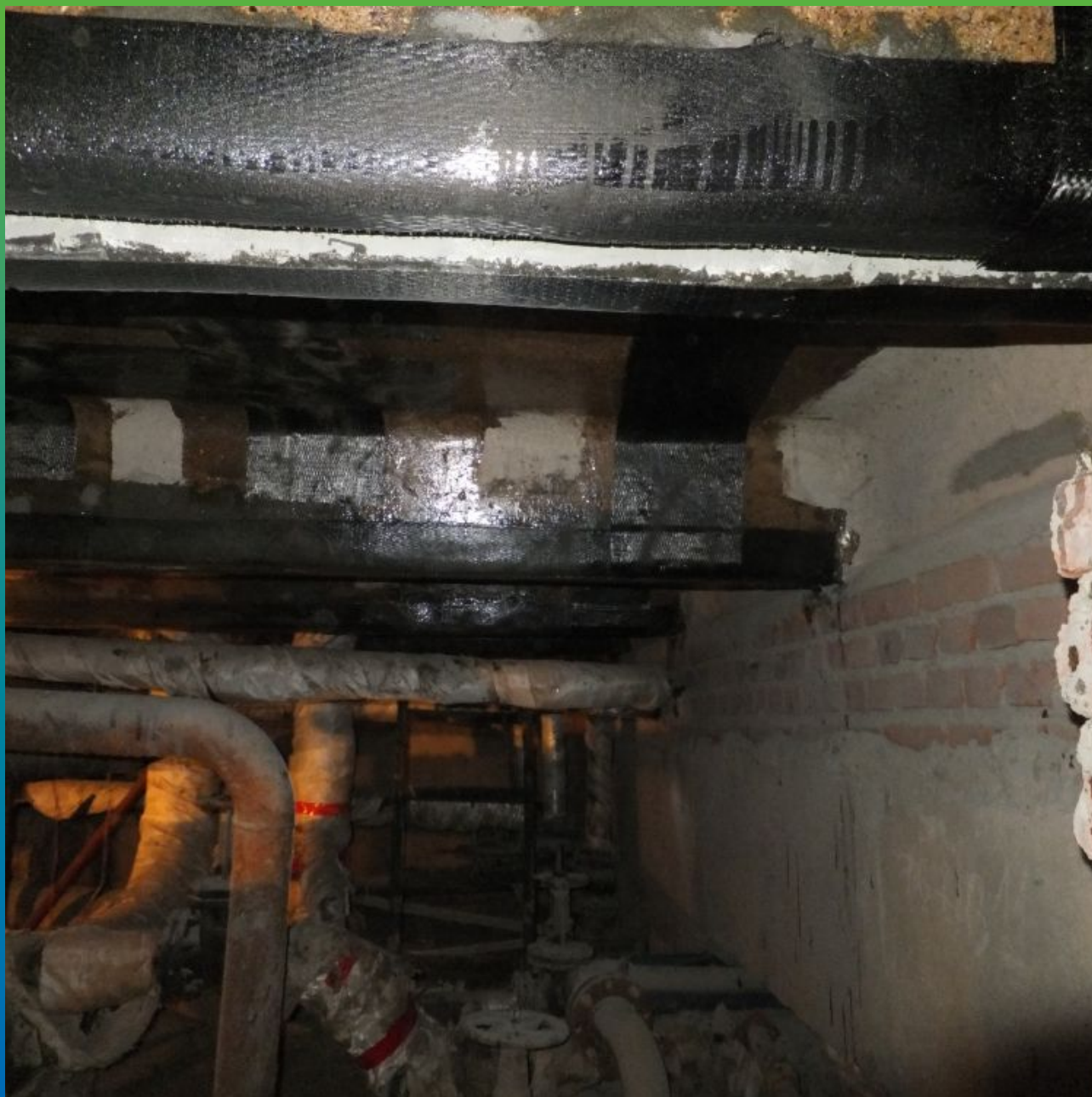
Вид усиленного объекта