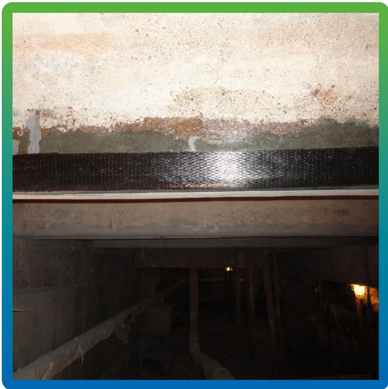
Балка, усиленная углехолстом Тайфо СЦХ-41 и эпоксидным составом Тайфо СТ