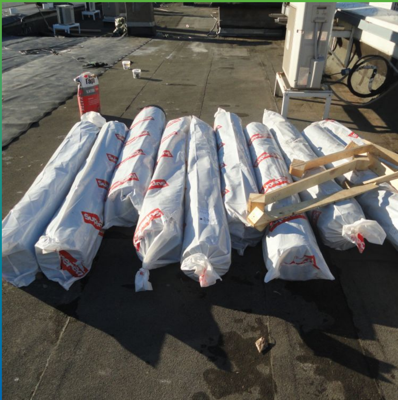
ЭПДМ мембрана Суперсил СТ на объекте