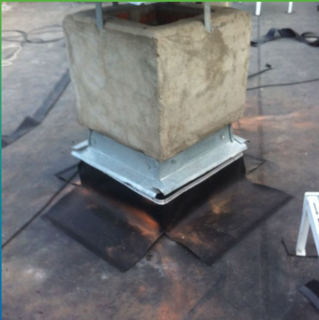
Гидроизоляция вентиляционных шахт