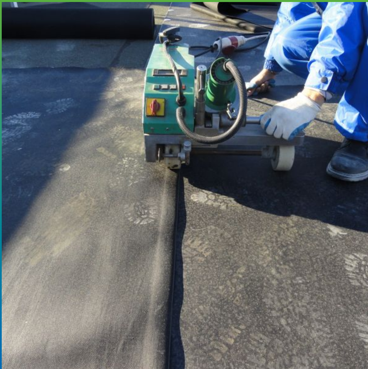
Сварка ЭПДМ мембраны Суперсил СТ горячим воздухом