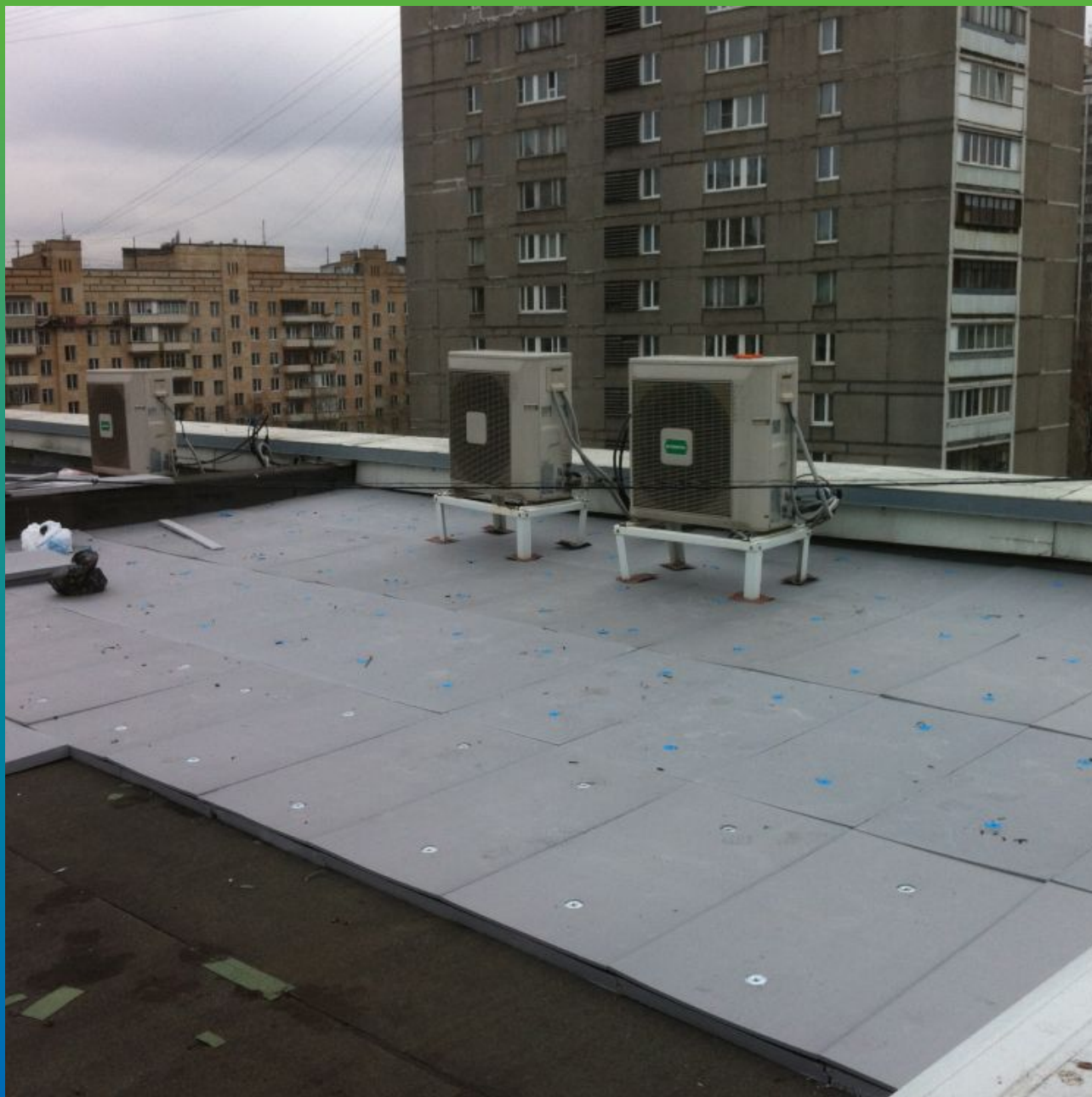
Утепление отдельного участка кровли