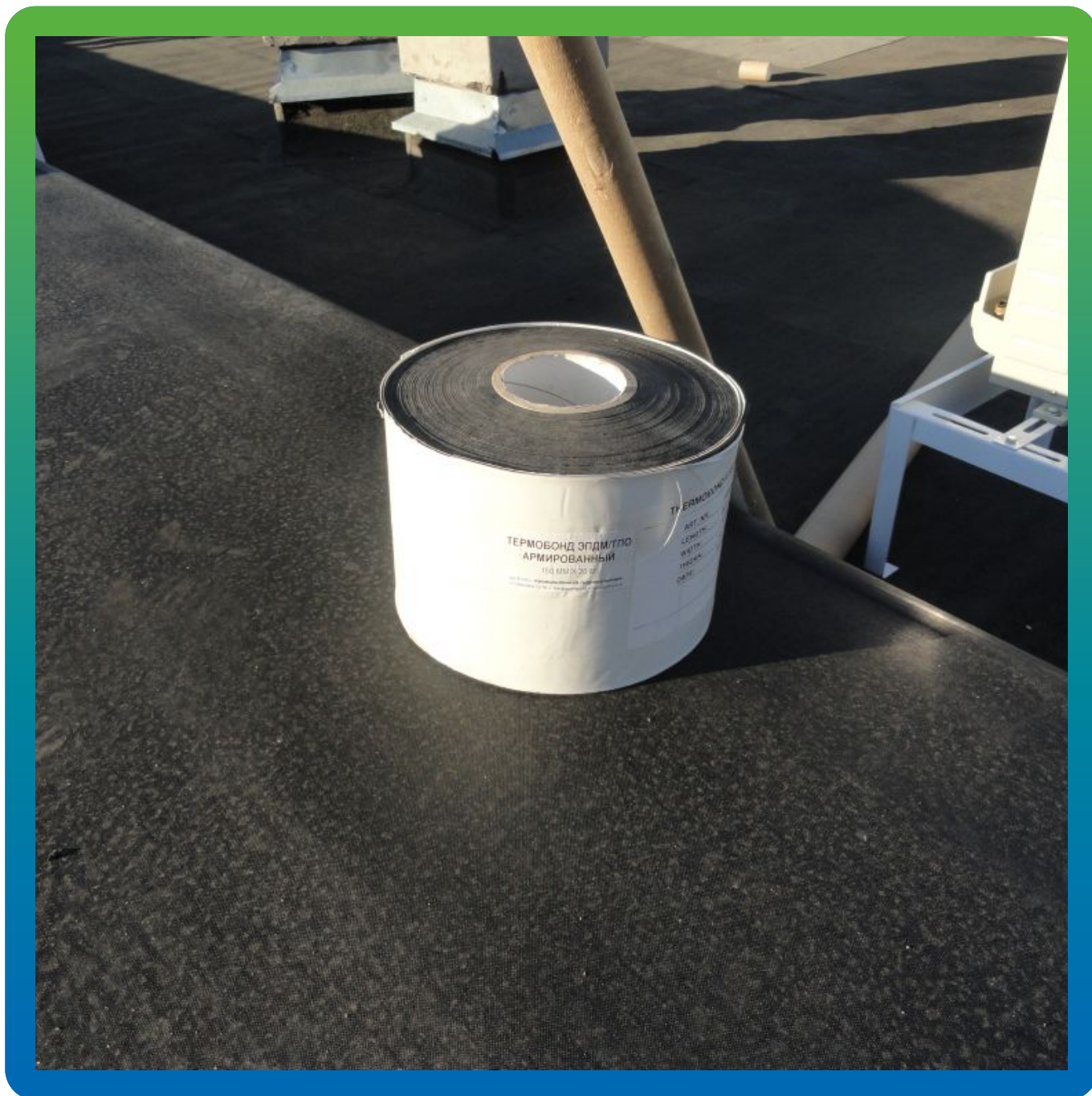
Термобонд армированный на объекте