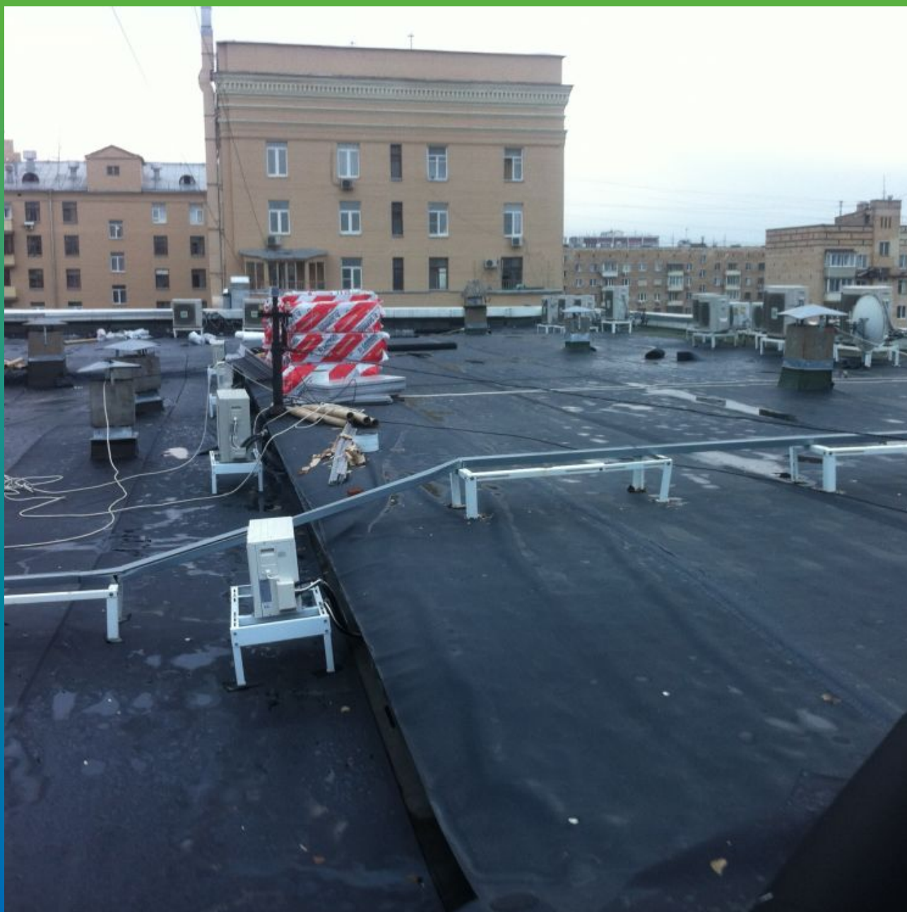
Готовая кровля. Вид 2