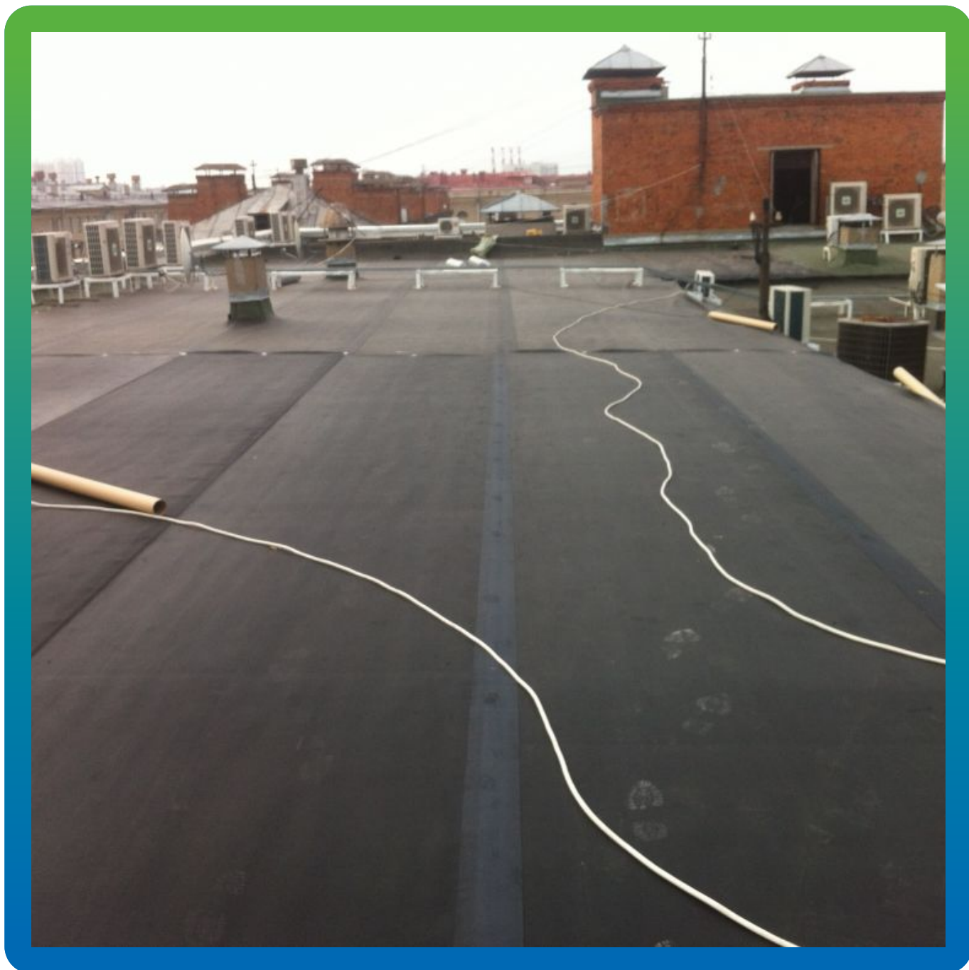
Суперсил СТ, 2.1 мм