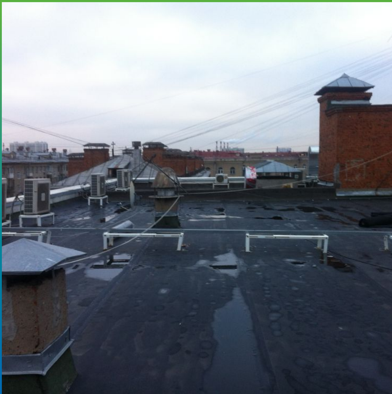
Готовая кровля. Вид 1