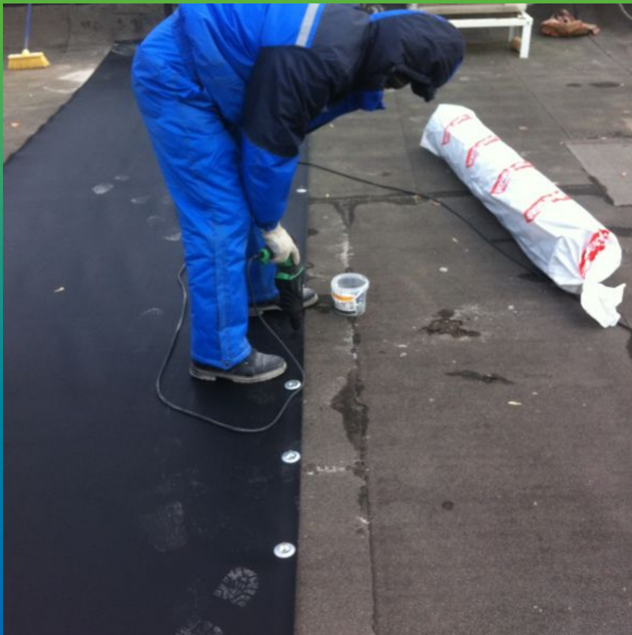
Механическое крепление мембраны Суперсил СТ