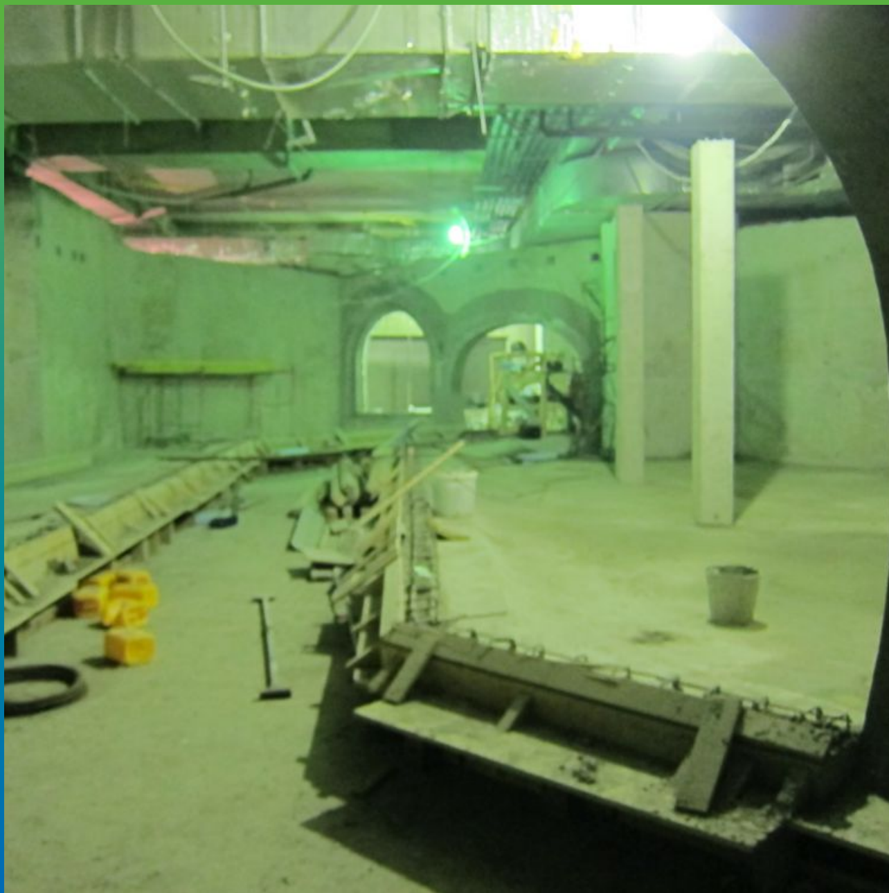
Подготовка "четвертей" под гидроизоляцию