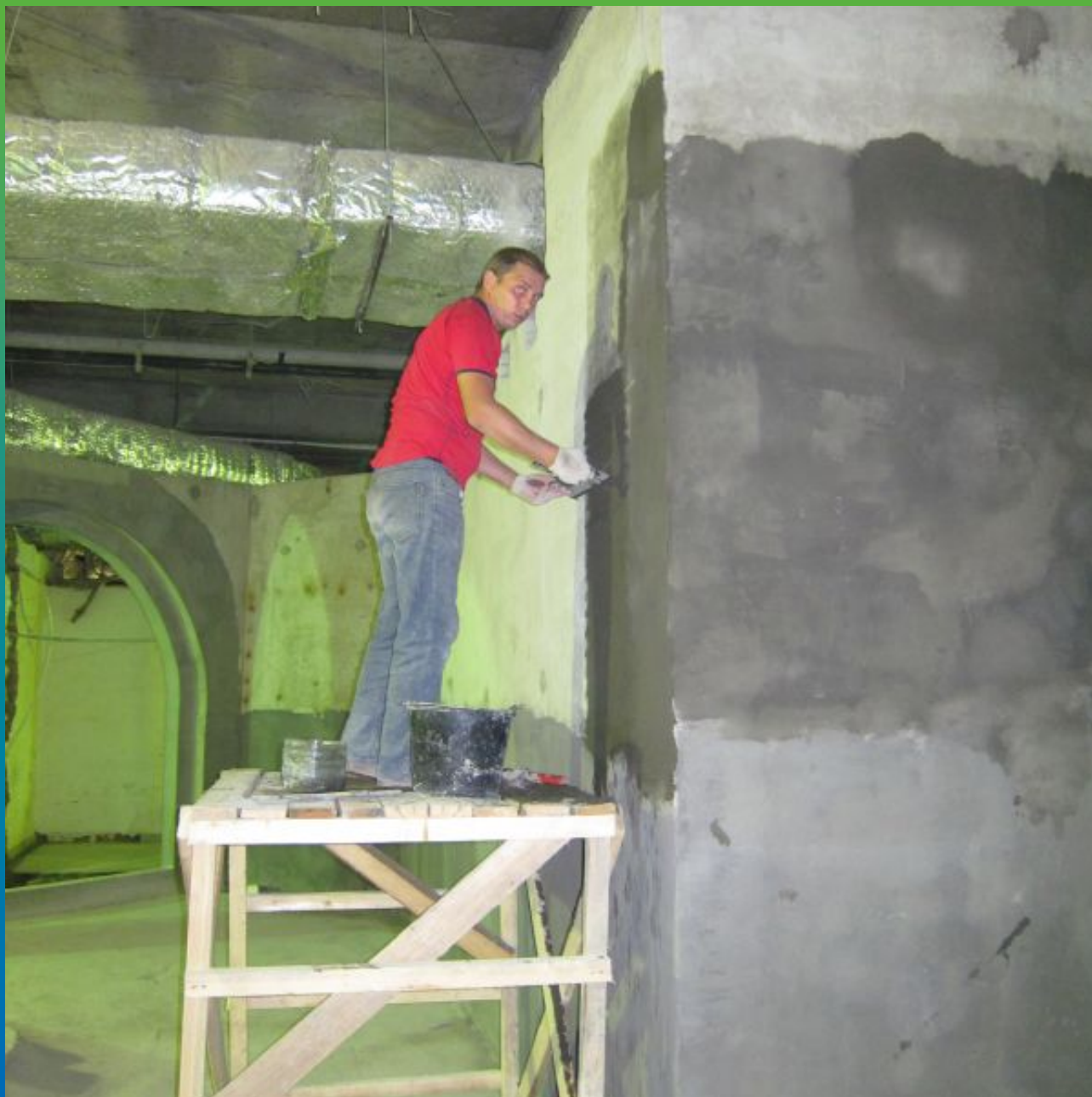
Нанесение ремонтного состава Маккрест