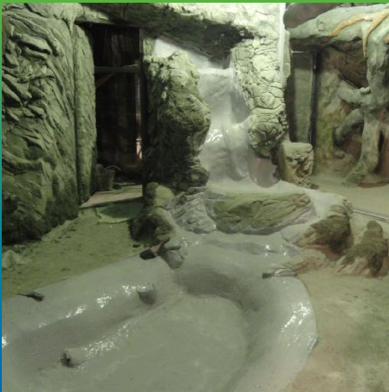
Гидроизоляция вольера для млекопитающих. Материал ДенТоп ЭП 201