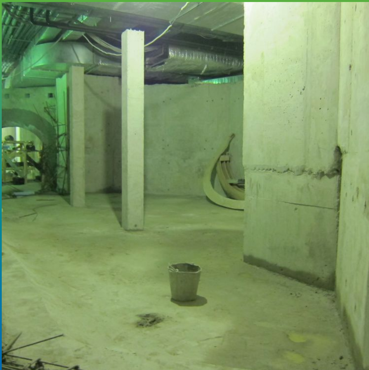
Вид танка №1