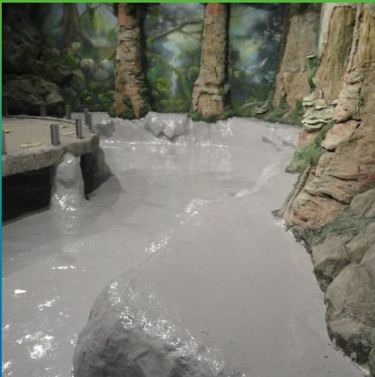
Гидроизоляция вольера для крокодилов. Материал ДенсТоп ЭП 201