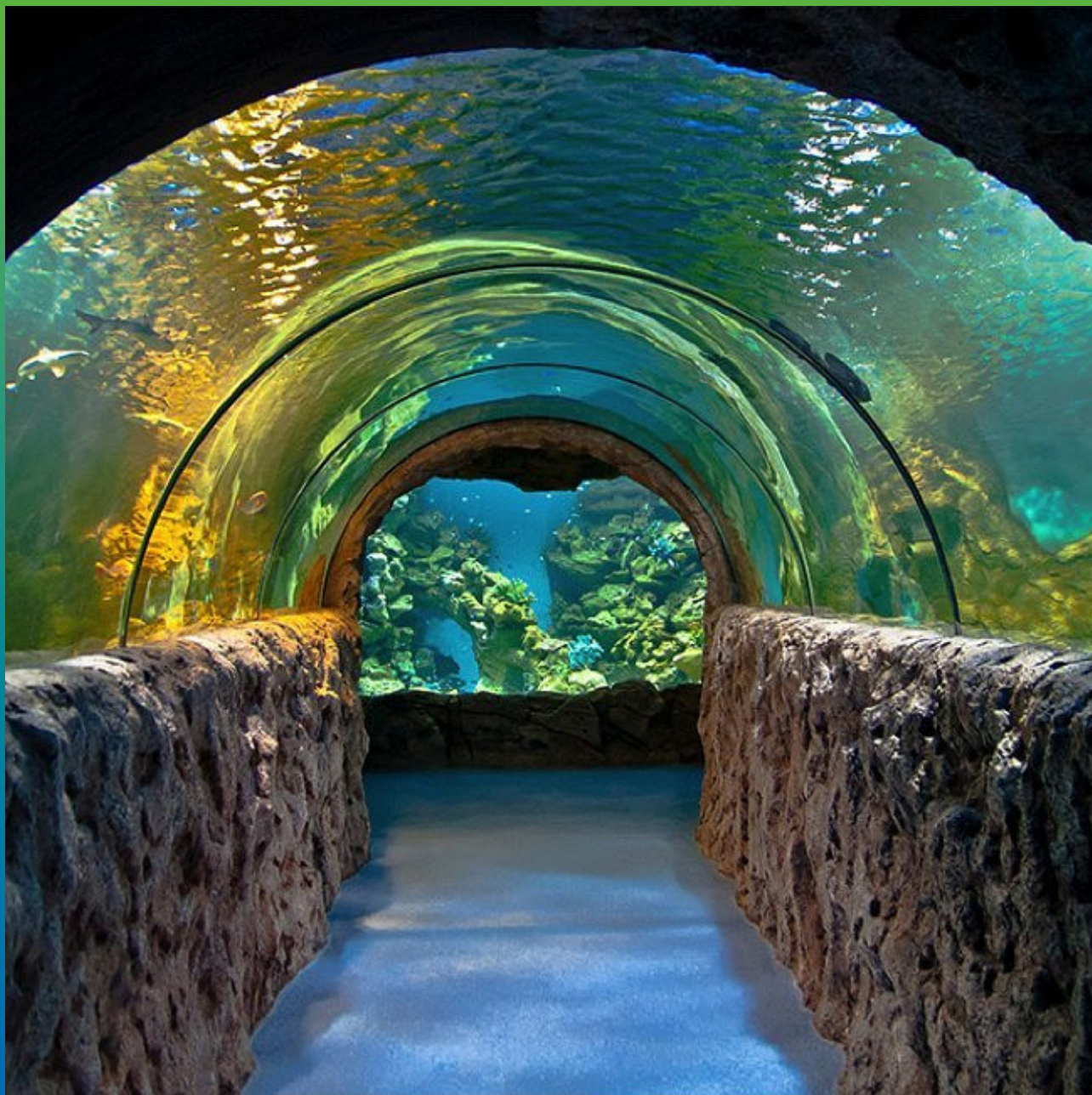
Вид тоннеля изнутри