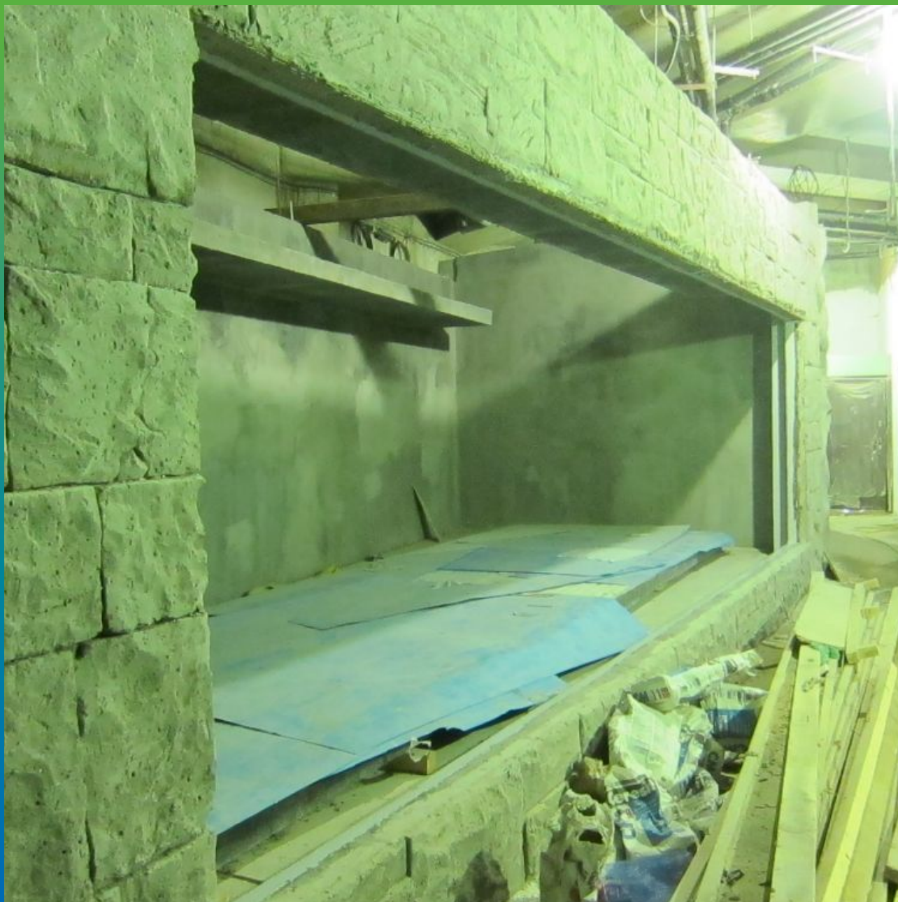
Подготовительные работы под гидроизоляцию "четвертей"