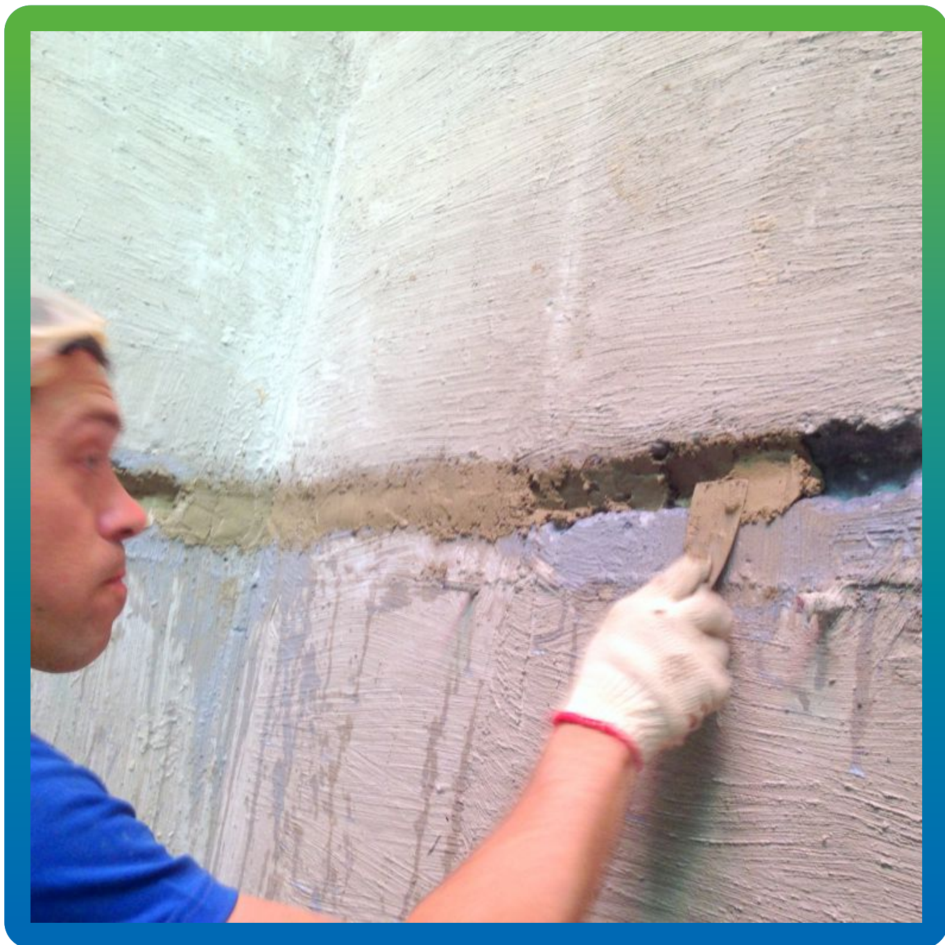
Чеканка шва ремонтным составом Стармекс РМ 3.