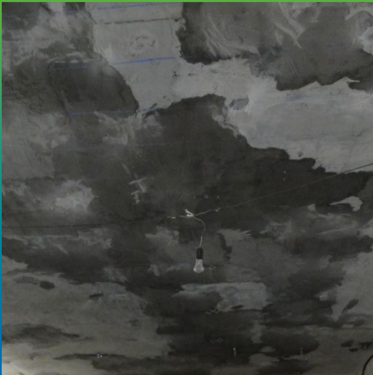
Вид отремонтированной плиты перекрытия