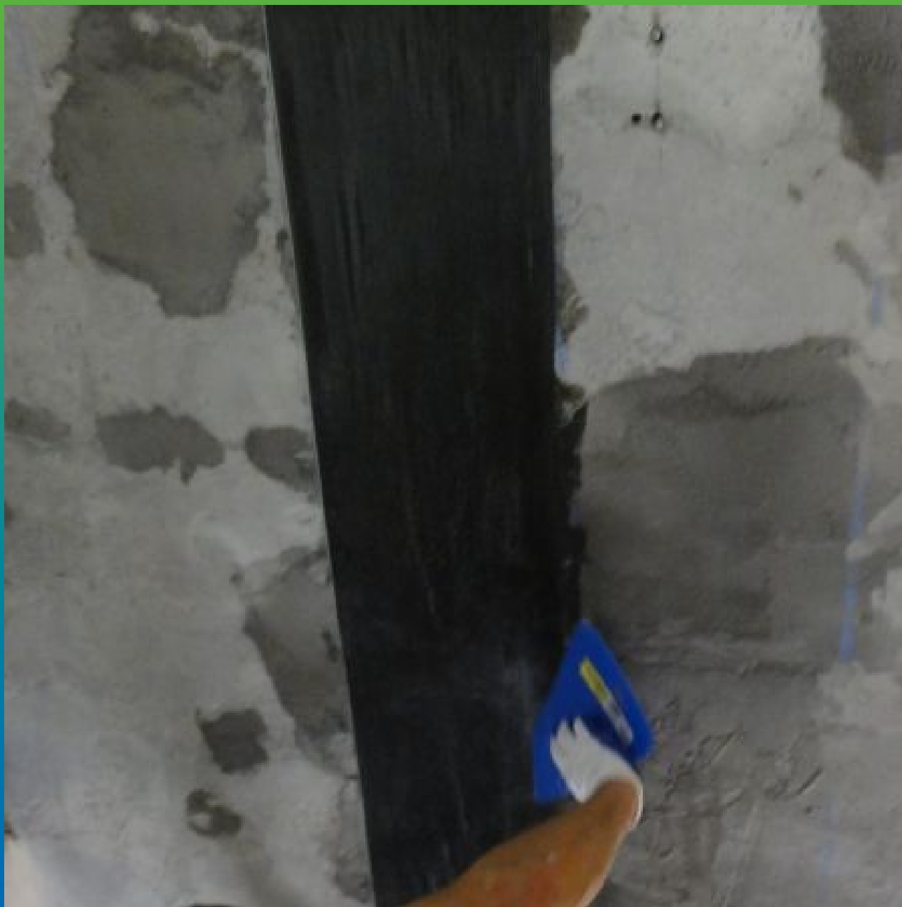
Монтаж холста Тайфо СЦХ 7 АП-Н