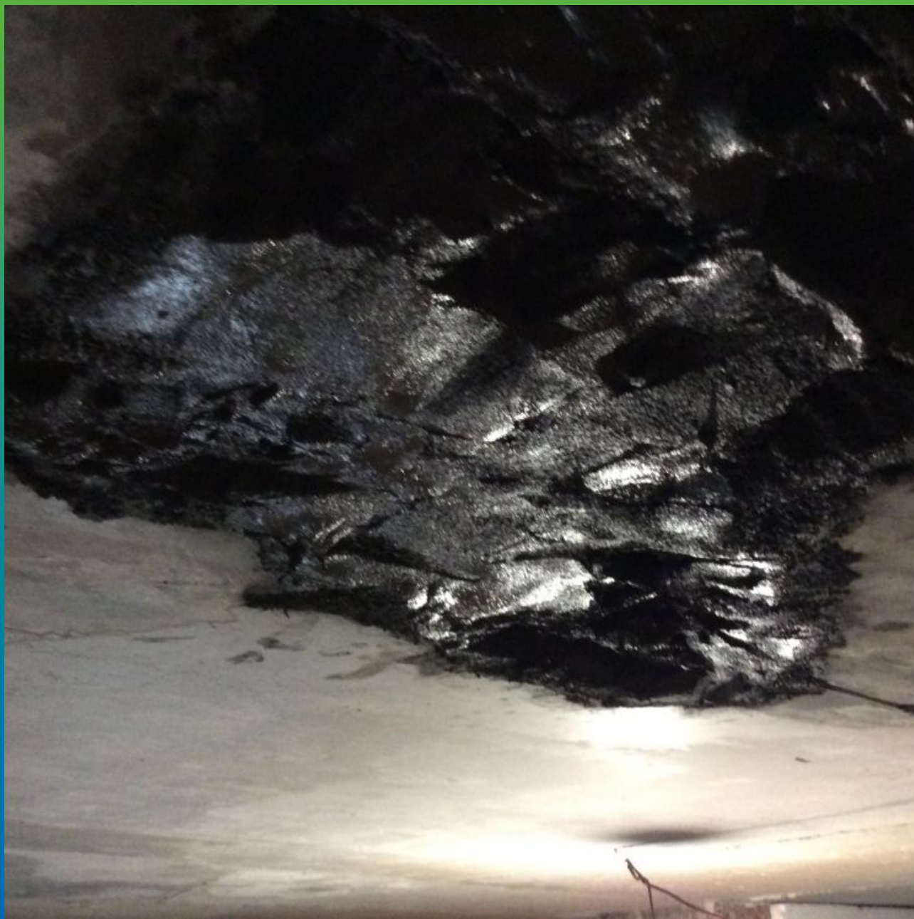
Восстановление геометрии плиты перекрытия с помощью Максрайт 500