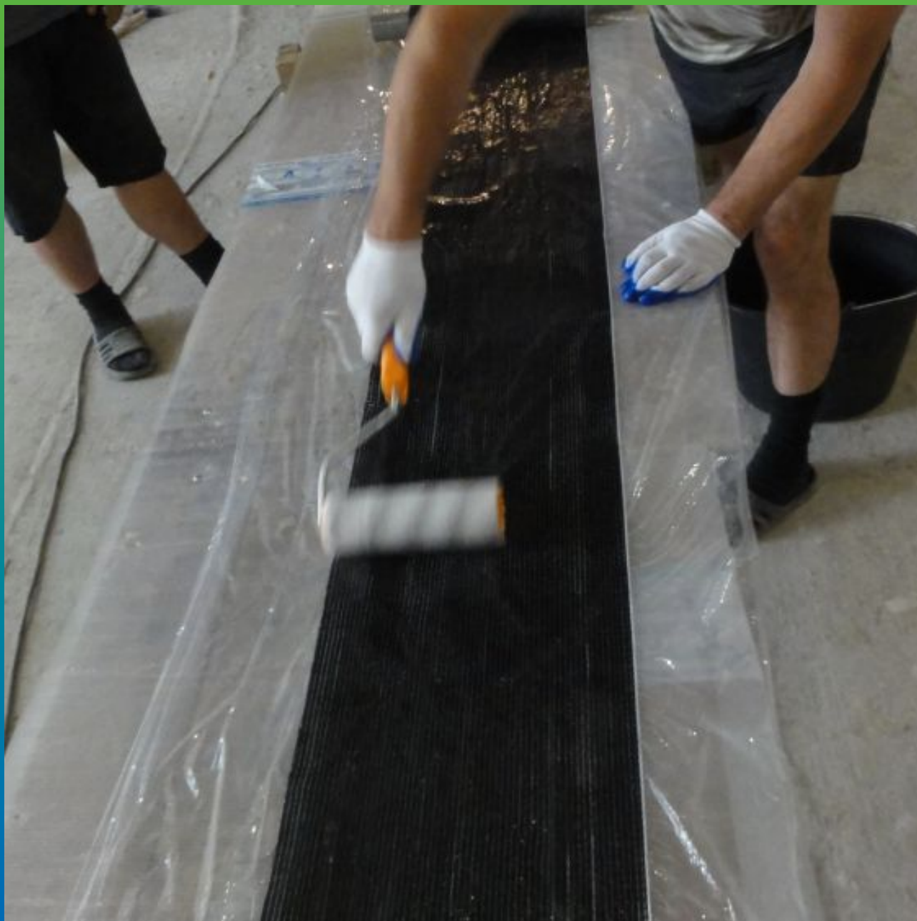
Пропитка холста эпоксидным составом Тайфо С