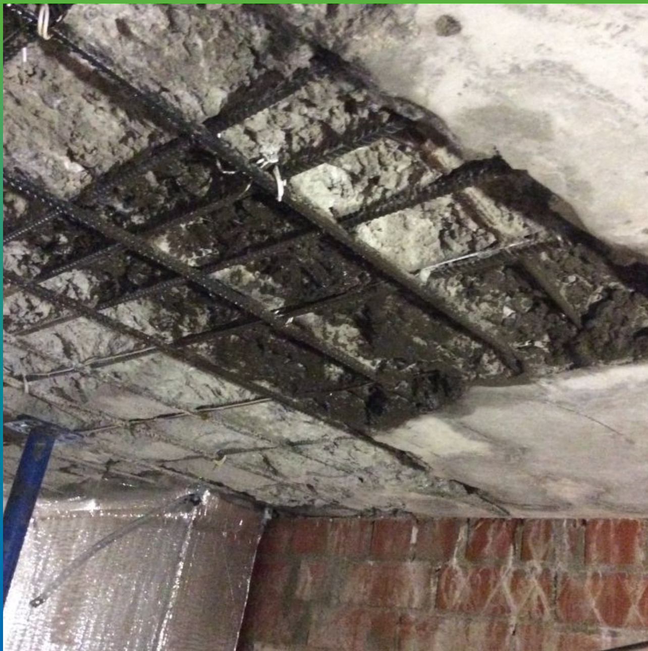
Нанесение грунтовочного слоя Максрайт 500