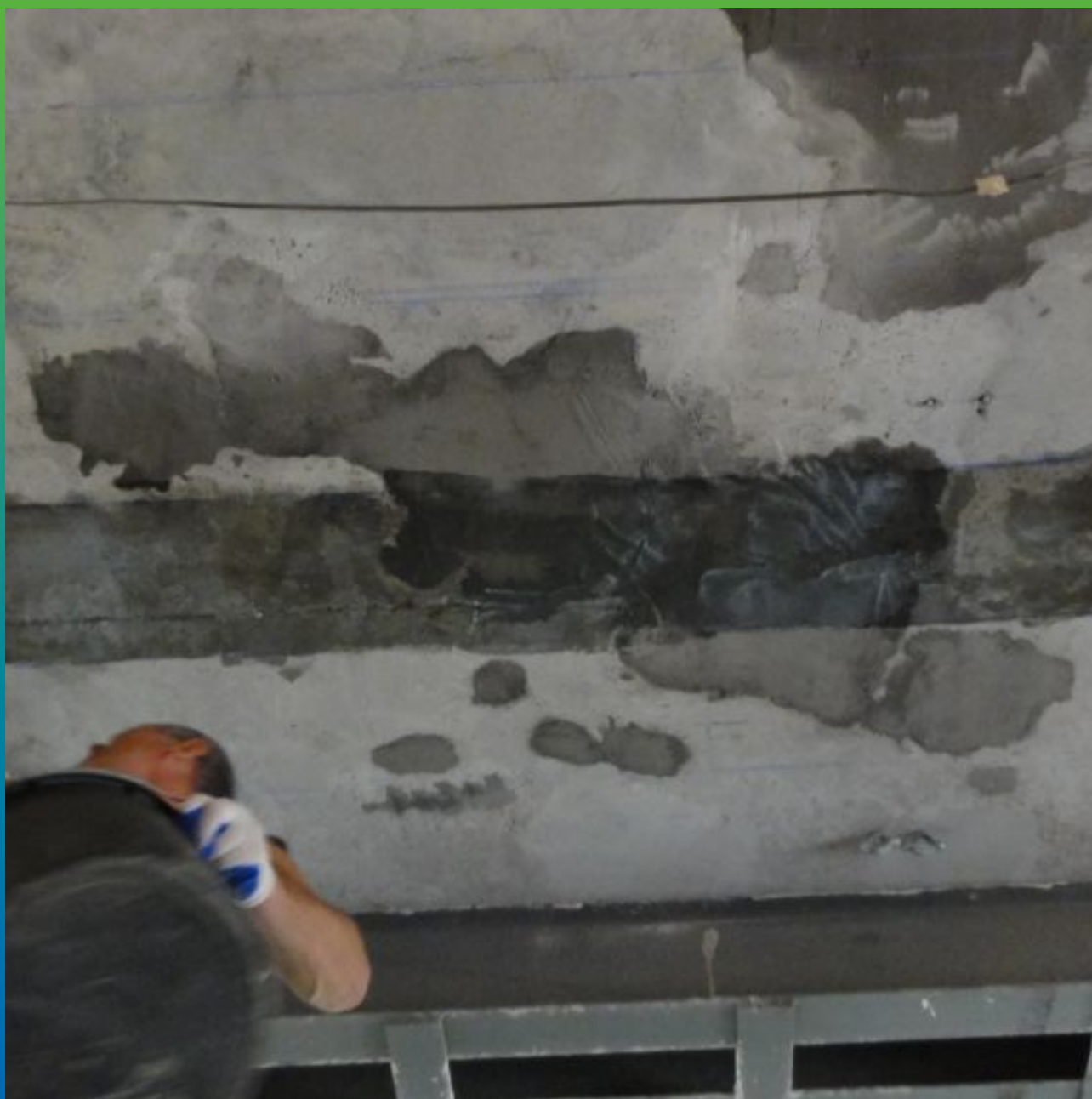
Нанесение основного слоя Тайфо С + Тайфо Тикс