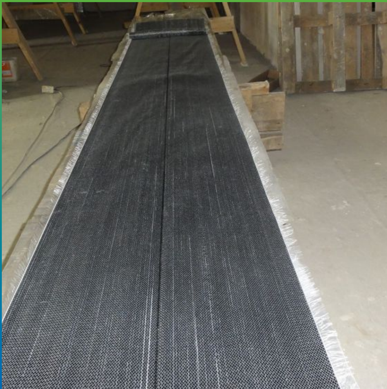
Разметка холста Тайфо согласно раскрою