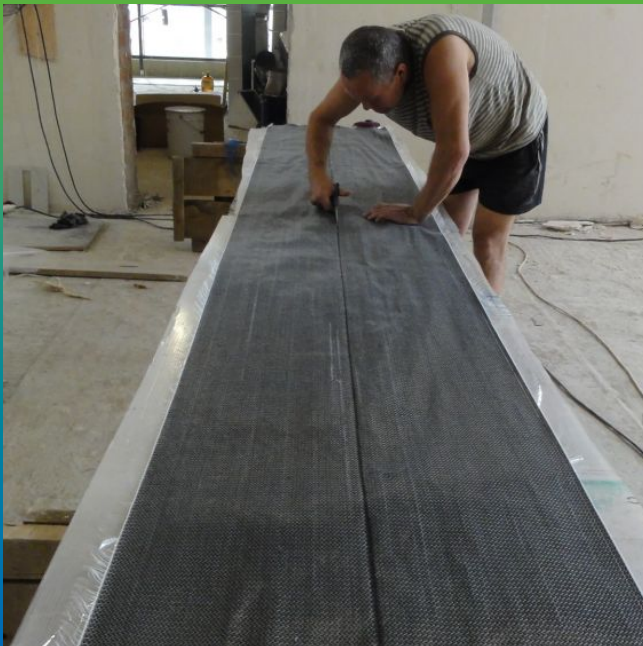
Раскрой холста Тайфо согласно проекту