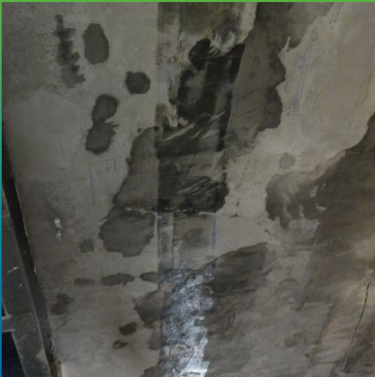
Нанесение грунтовочного слоя Тайфо С на поверхность