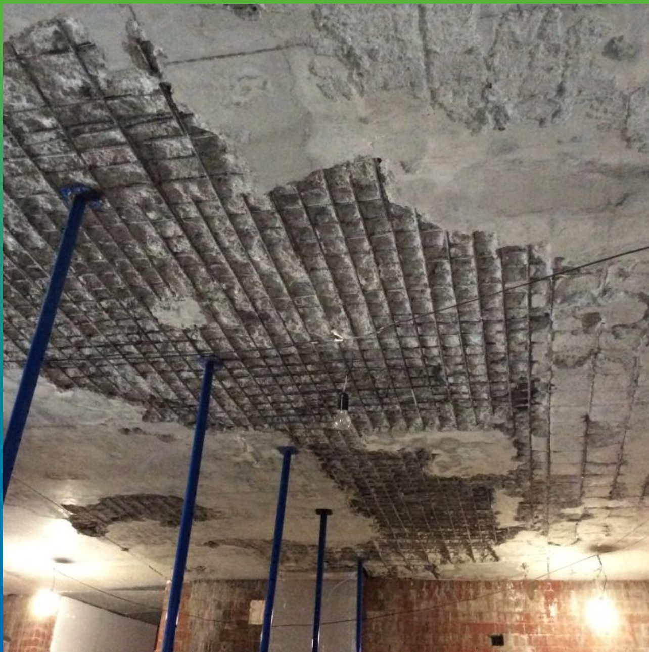
Первоначальный вид плиты перекрытия