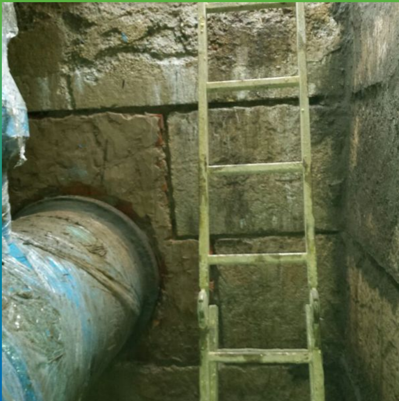
Расшивка швов ФБС