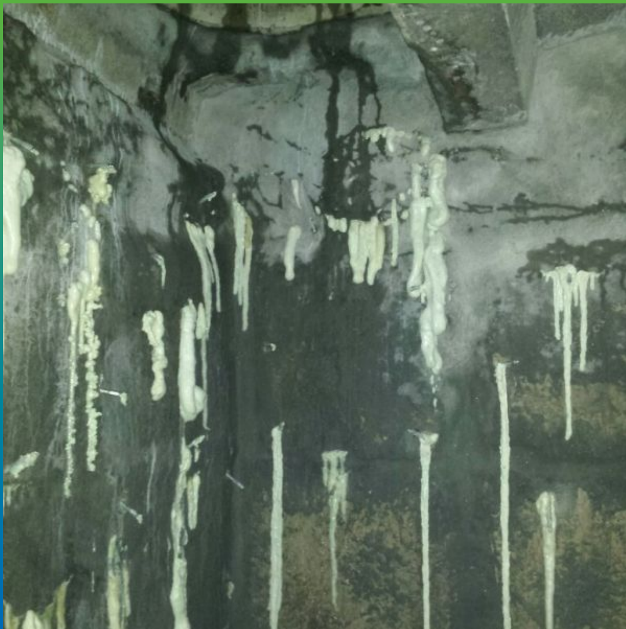
Инъектирование Манопур С