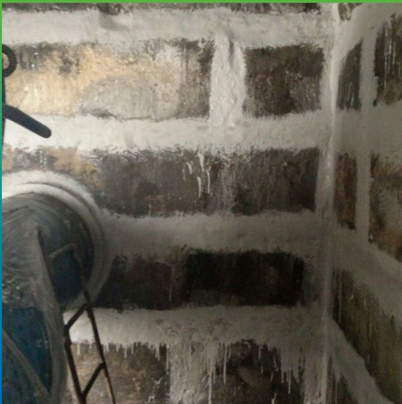
Камера после проведения работ