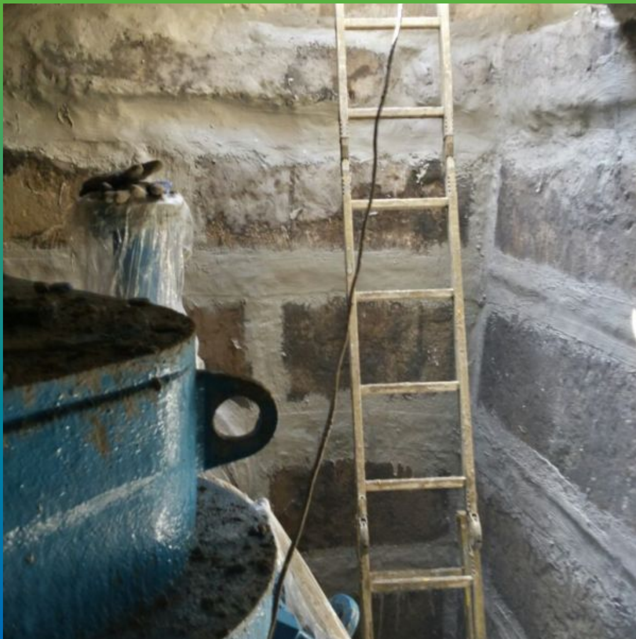
Камера после проведения работ