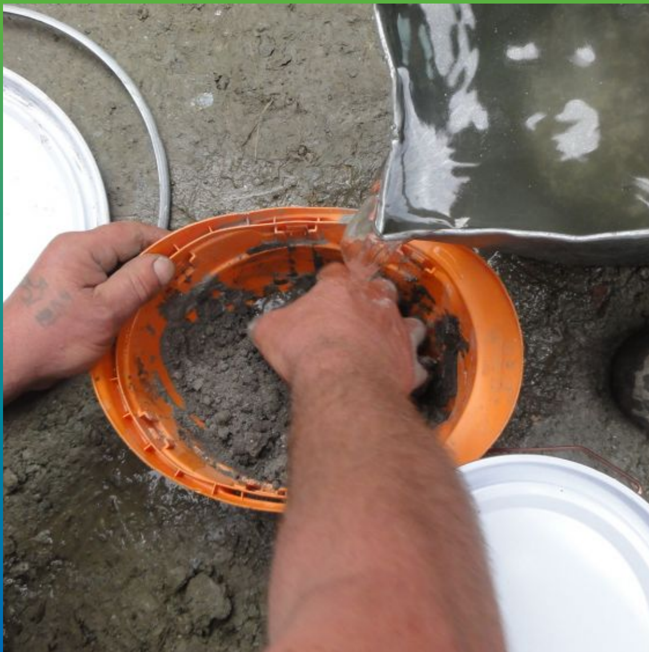
Затворение материала Максбетон