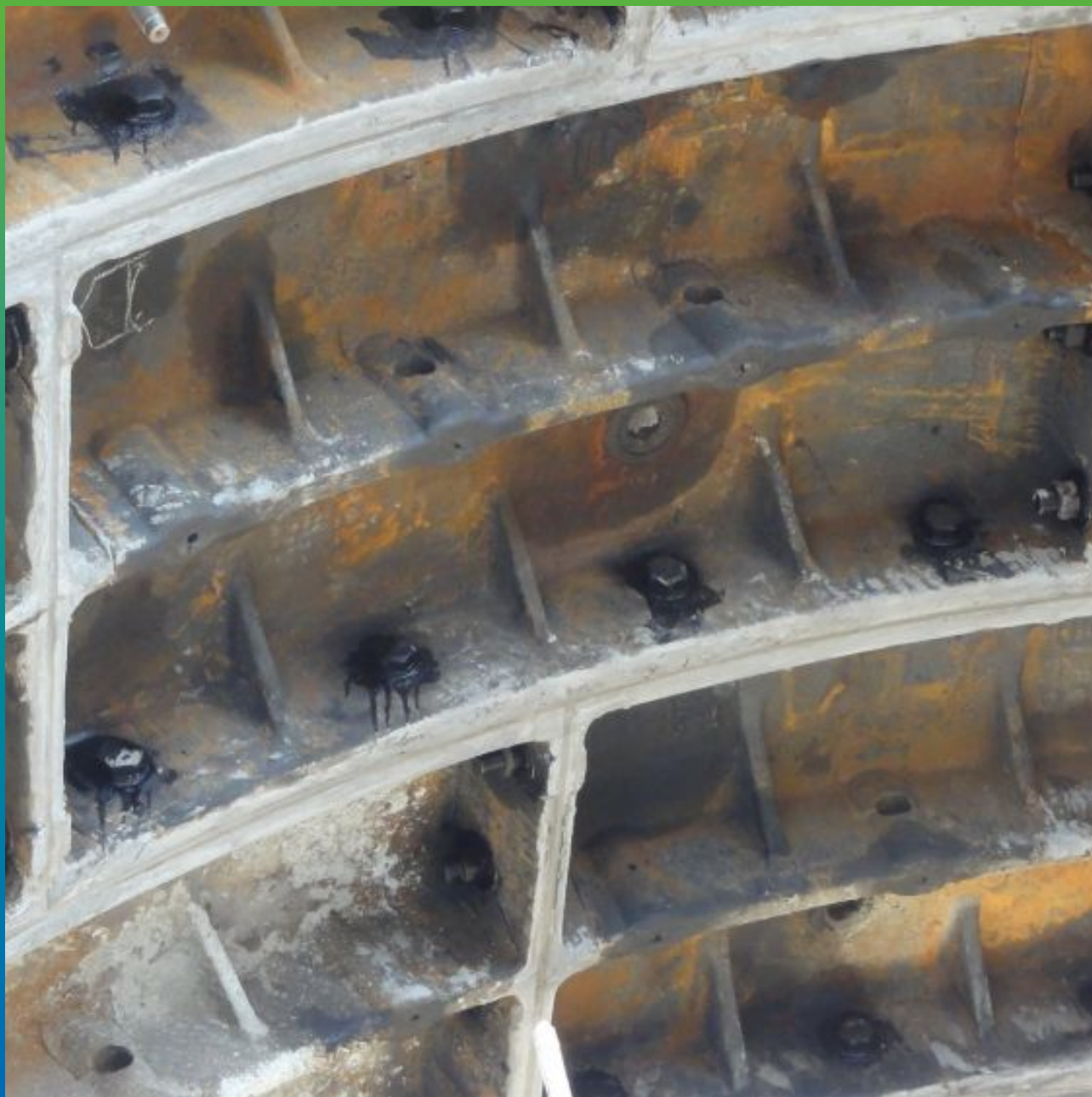
Финальный вид зачеканенных швов