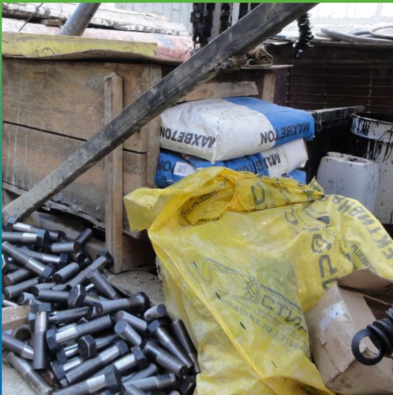
Вид материала на объекте