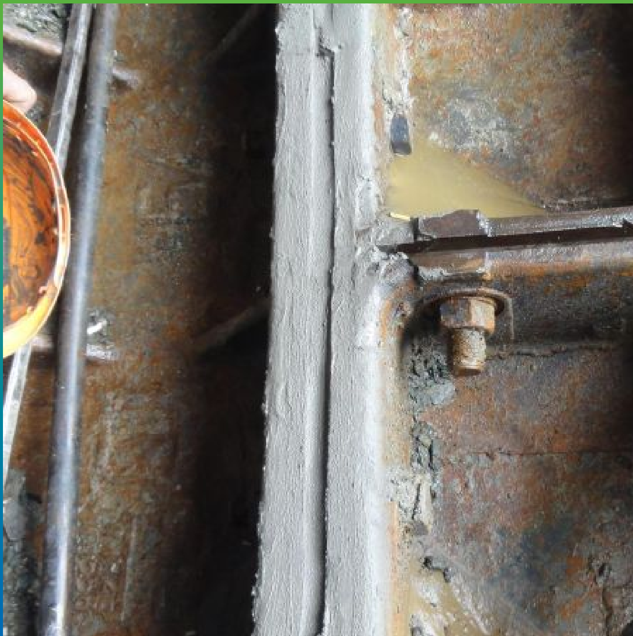
Чеканка шва тубингов с помощью Максбетон