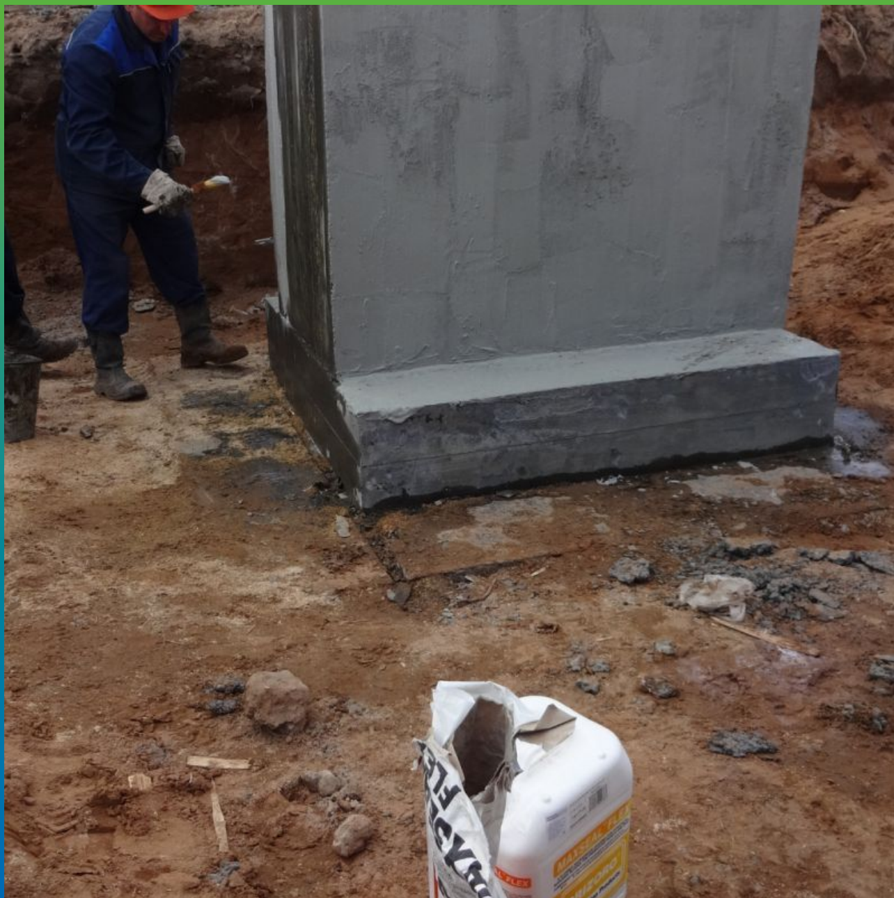
Фундаменты с нанесенной гидроизоляцией Максил Флекс