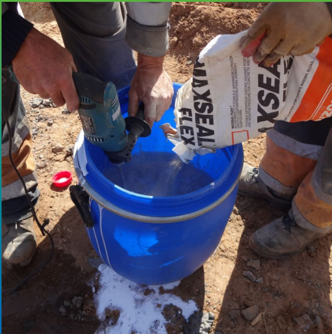
Затворение 2-х компонентов Макссил Флекс