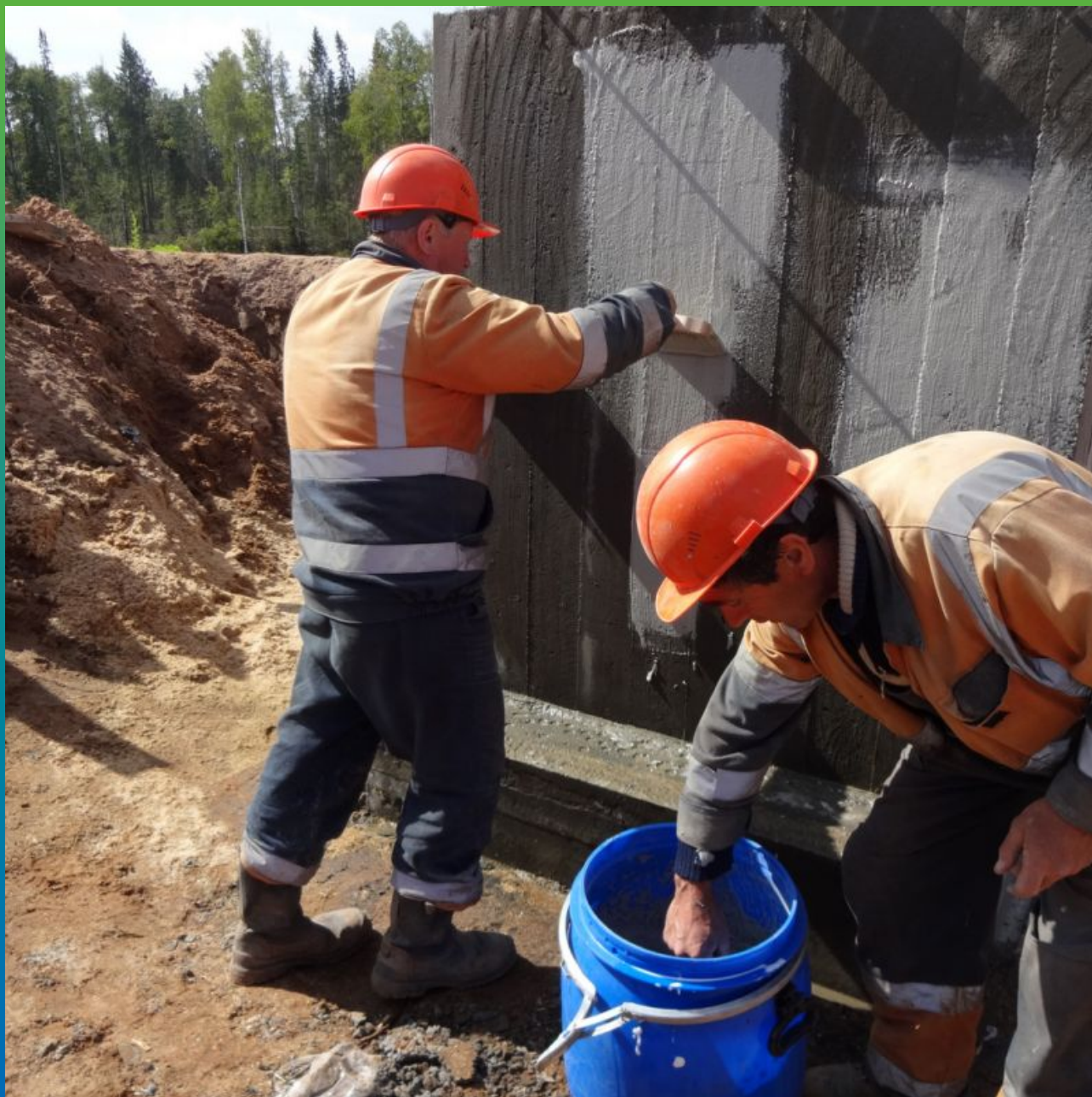
Нанесение Максил Флекс на фундаменты