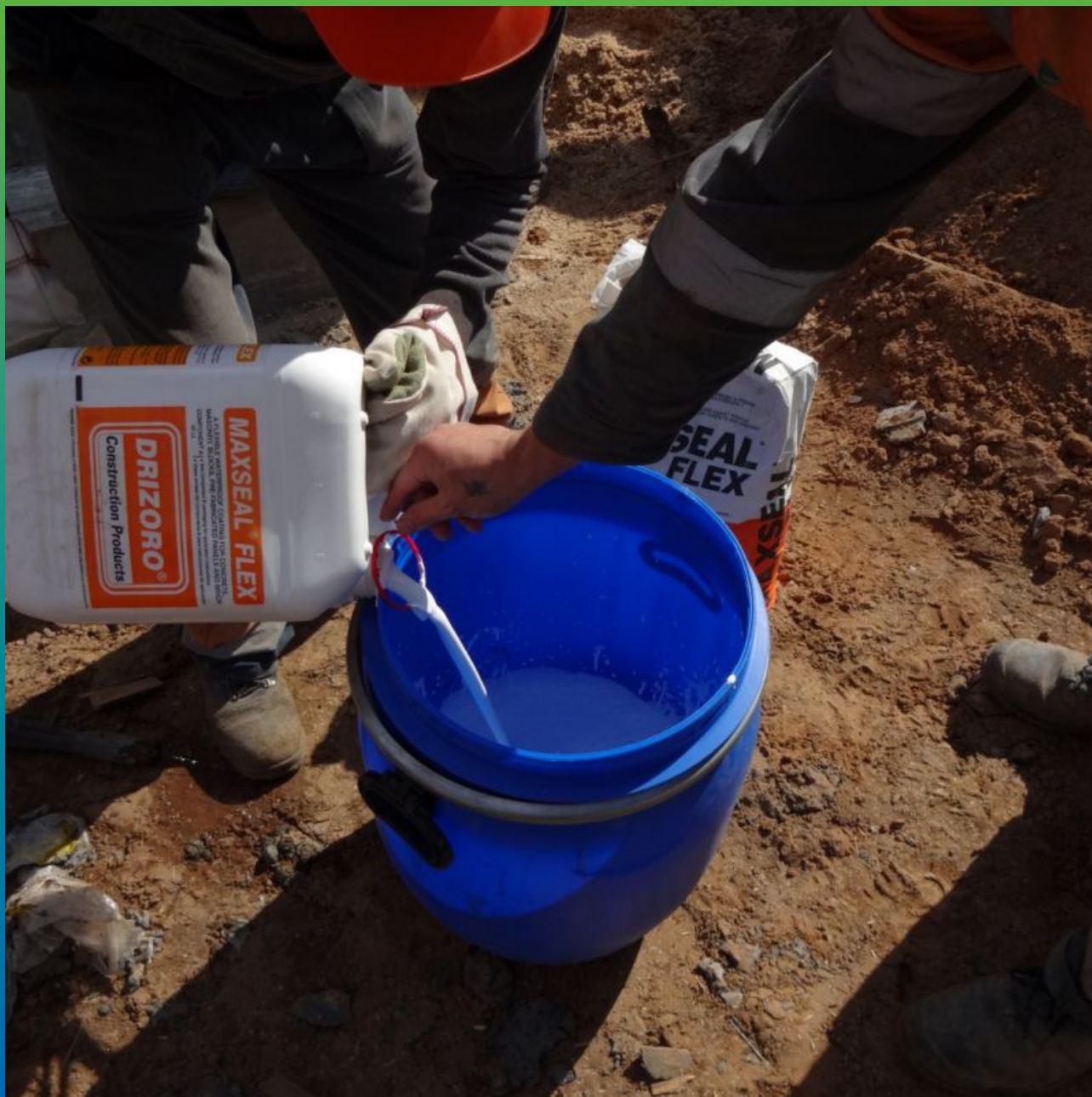
Затворение 2-х компонентов Макссил Флекс