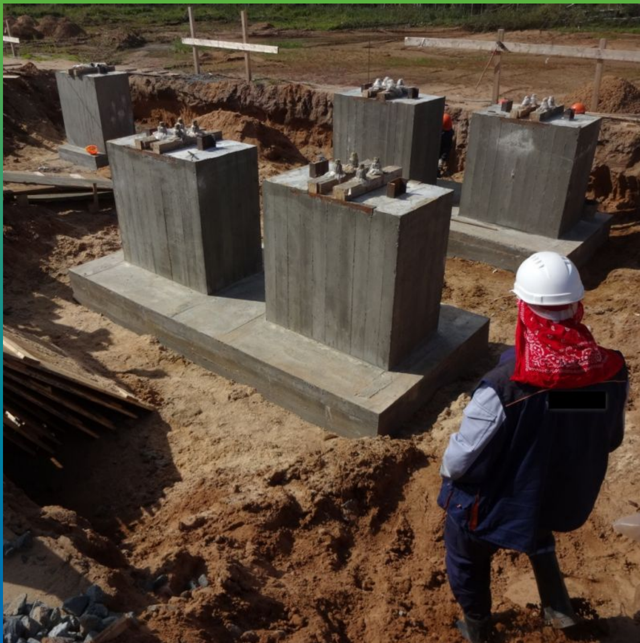
Общий вид объекта