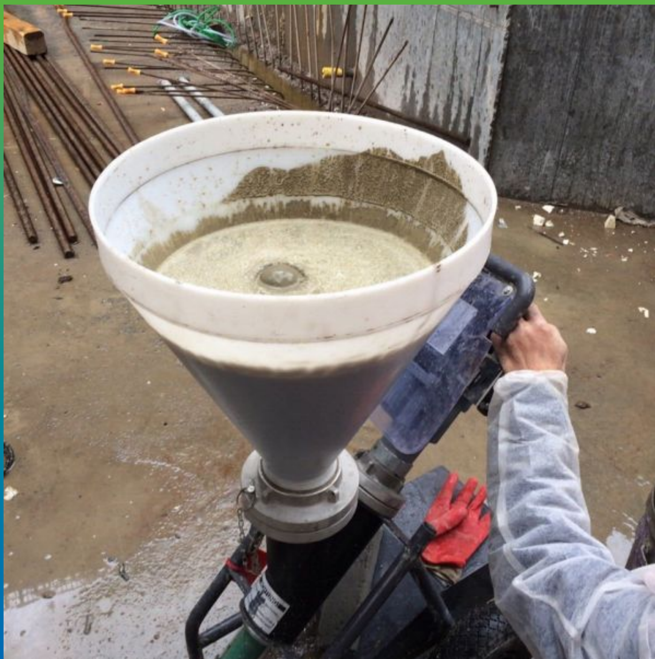
Заправка бункера насоса