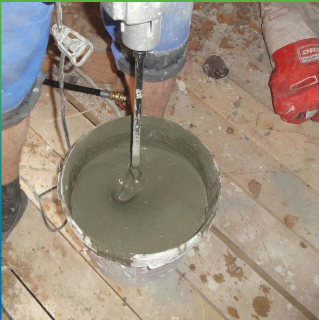
Замешивание микроцементного состава