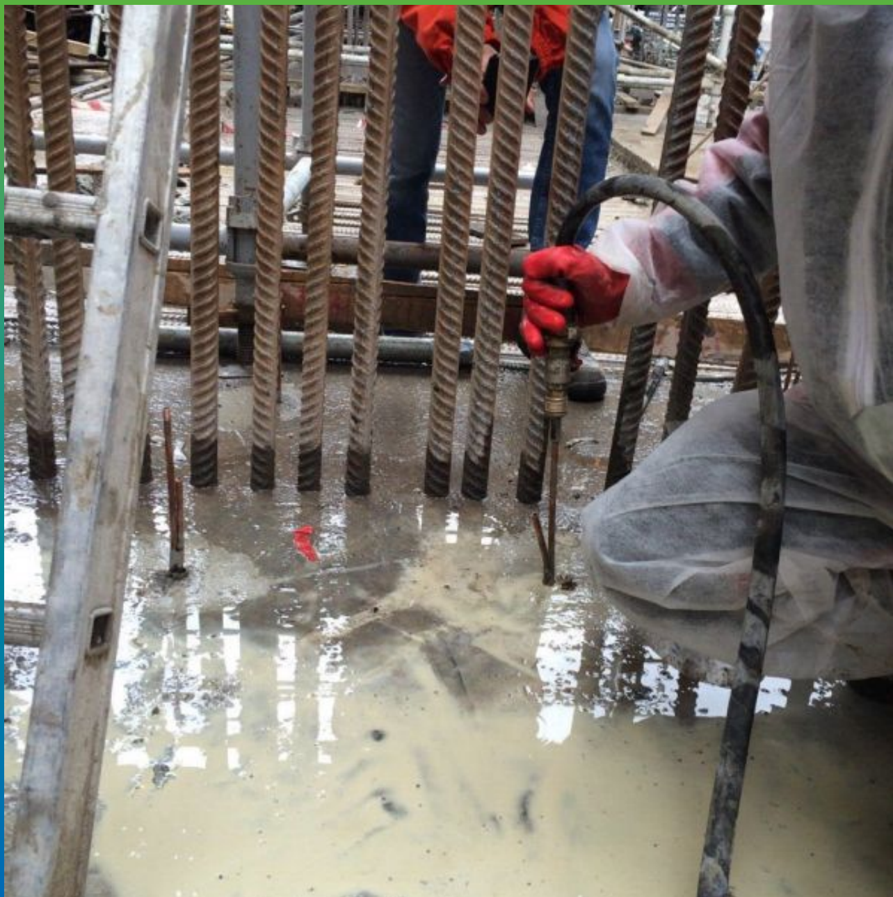
Процесс инъектирования микроцемента