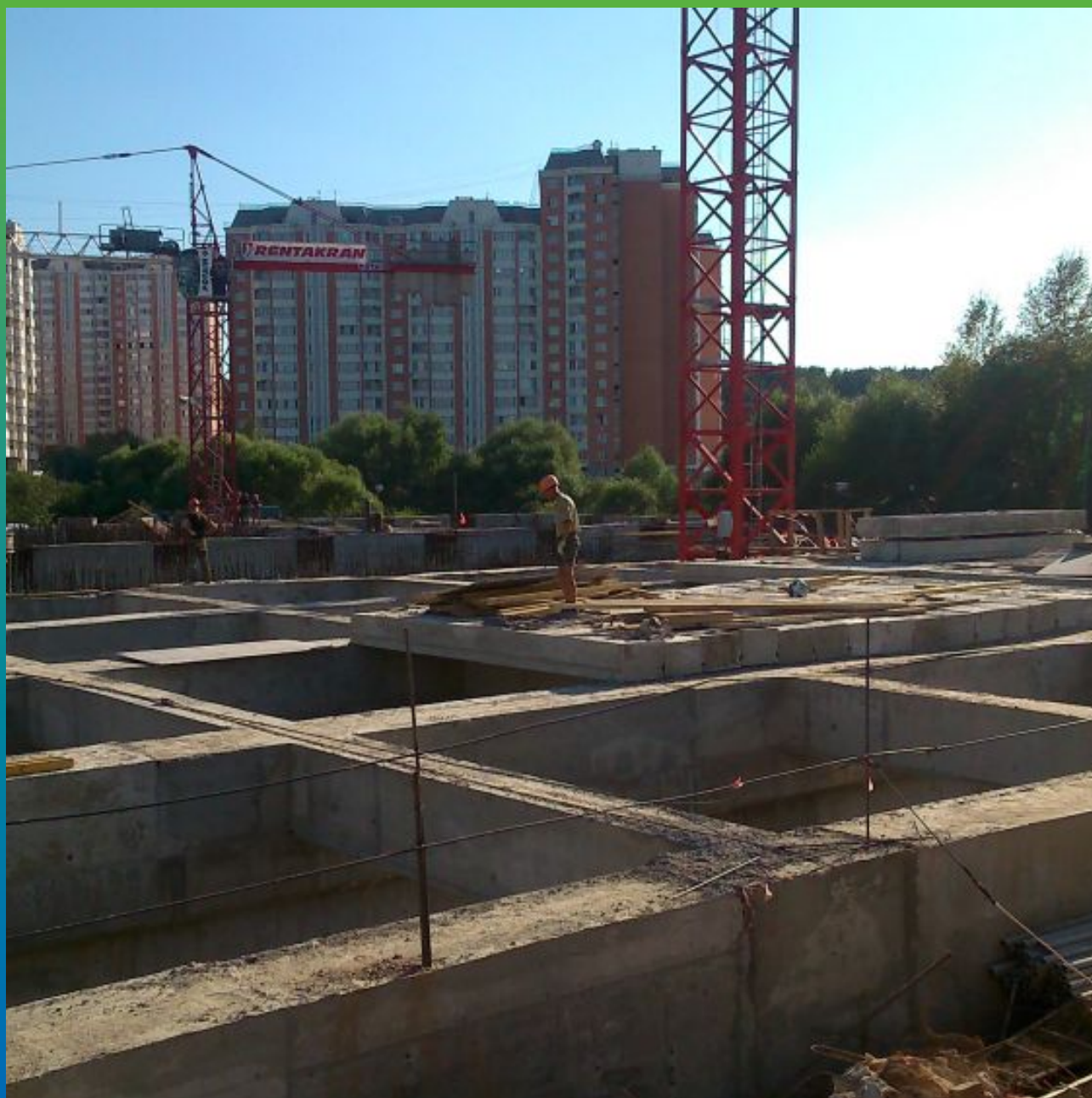
Общий вид объекта