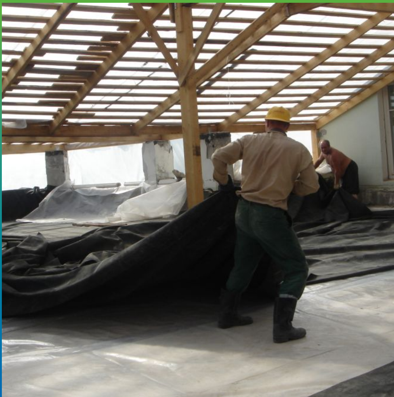
Укладка ЭПДМ-Мембраны Эластосил Т.