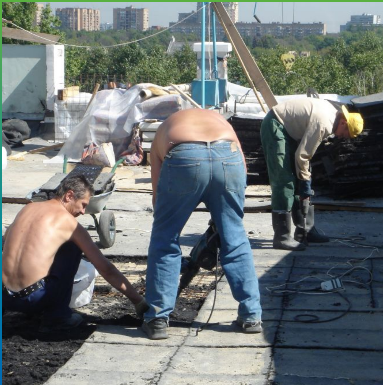
Демонтаж существующей кровли.