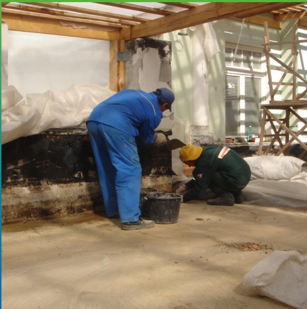
Подготовка основания по ЭПДМ-Мембрану Эластосил Т.