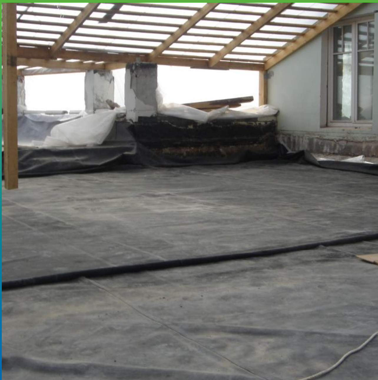
ЭПДМ-мембрана Эластосил Т, горизонтальная часть.