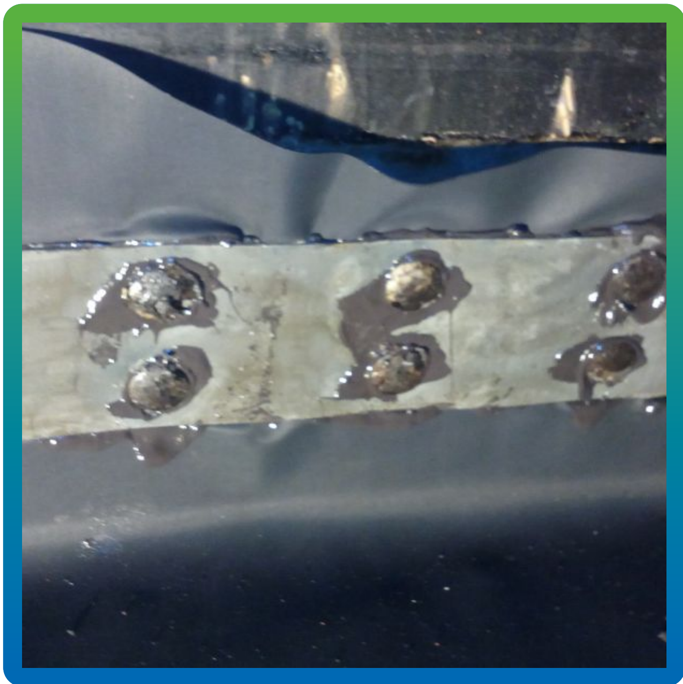
Крепление прижимной планки и герметизация, материал Витрафин Бонд Ф.