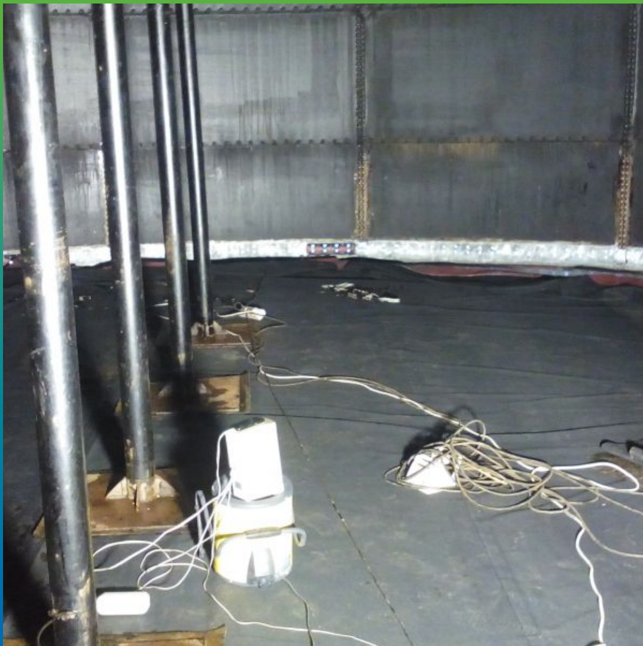
Гидроизоляция дна резервуара.