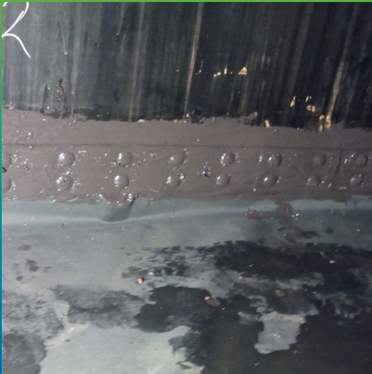
Герметизация вертикальной части резервуара.