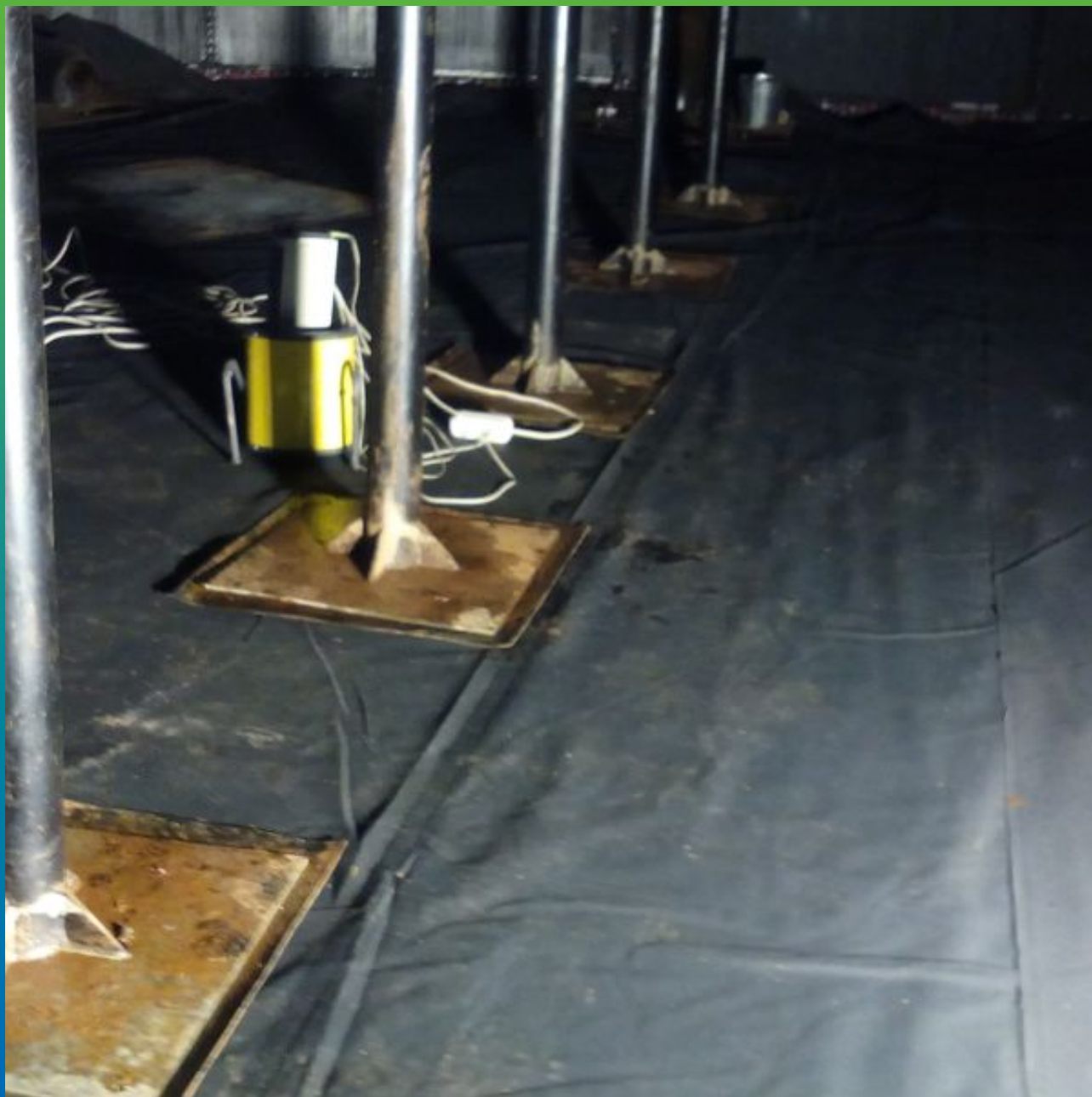
Монтаж опор на ЭПДМ-Мембрану Эластосил Т.