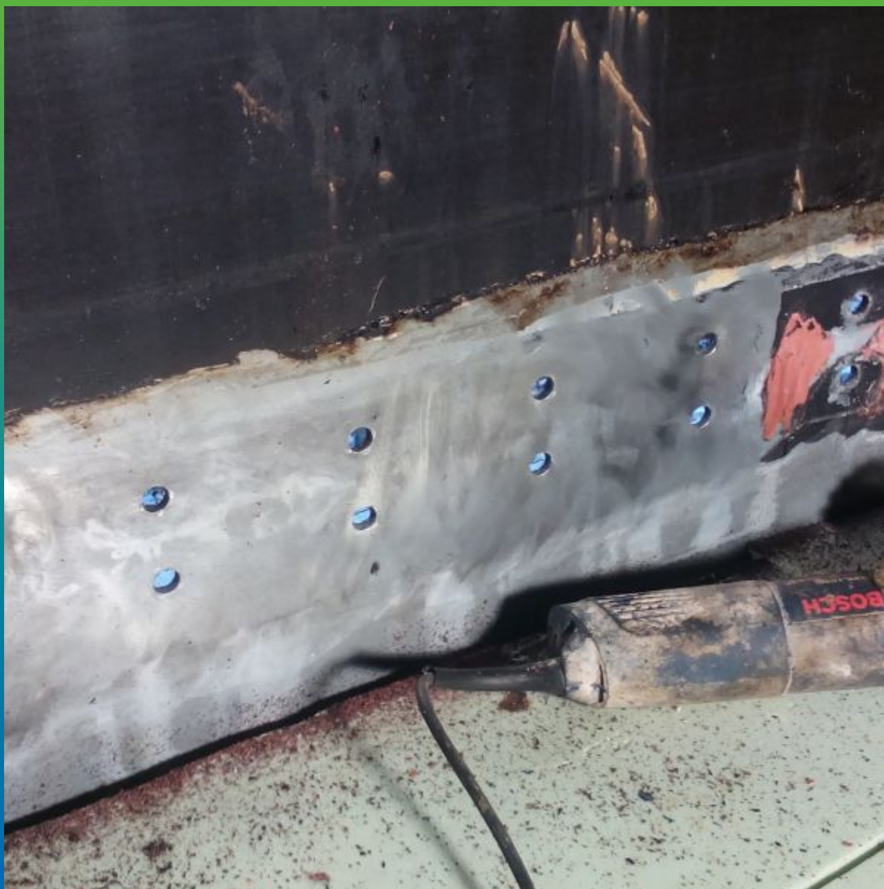
Подготовка вертикальной части к монтажу ЭПДМ-Мембраны.