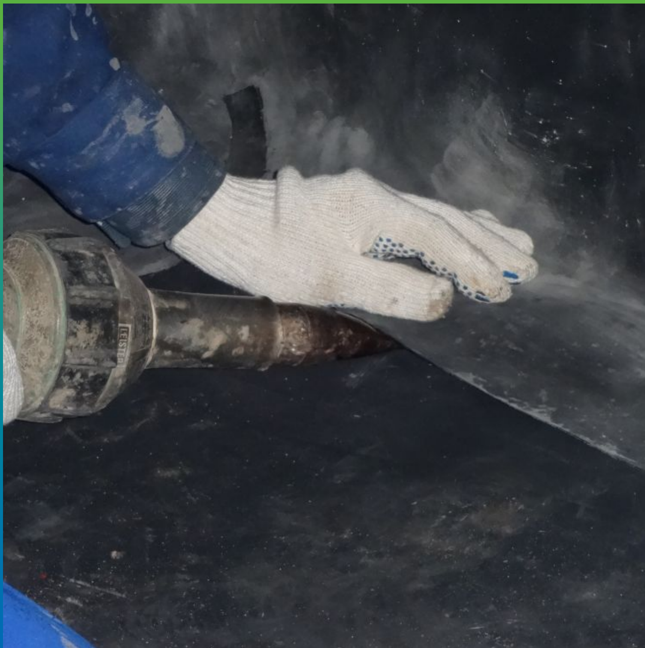
Сварка горячим воздухом двух карт методом "Термобонд"