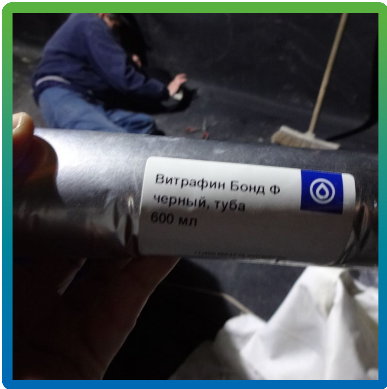
Гидроизоляция вводов выводов химостойким герметиком Витрафин Бонд Ф