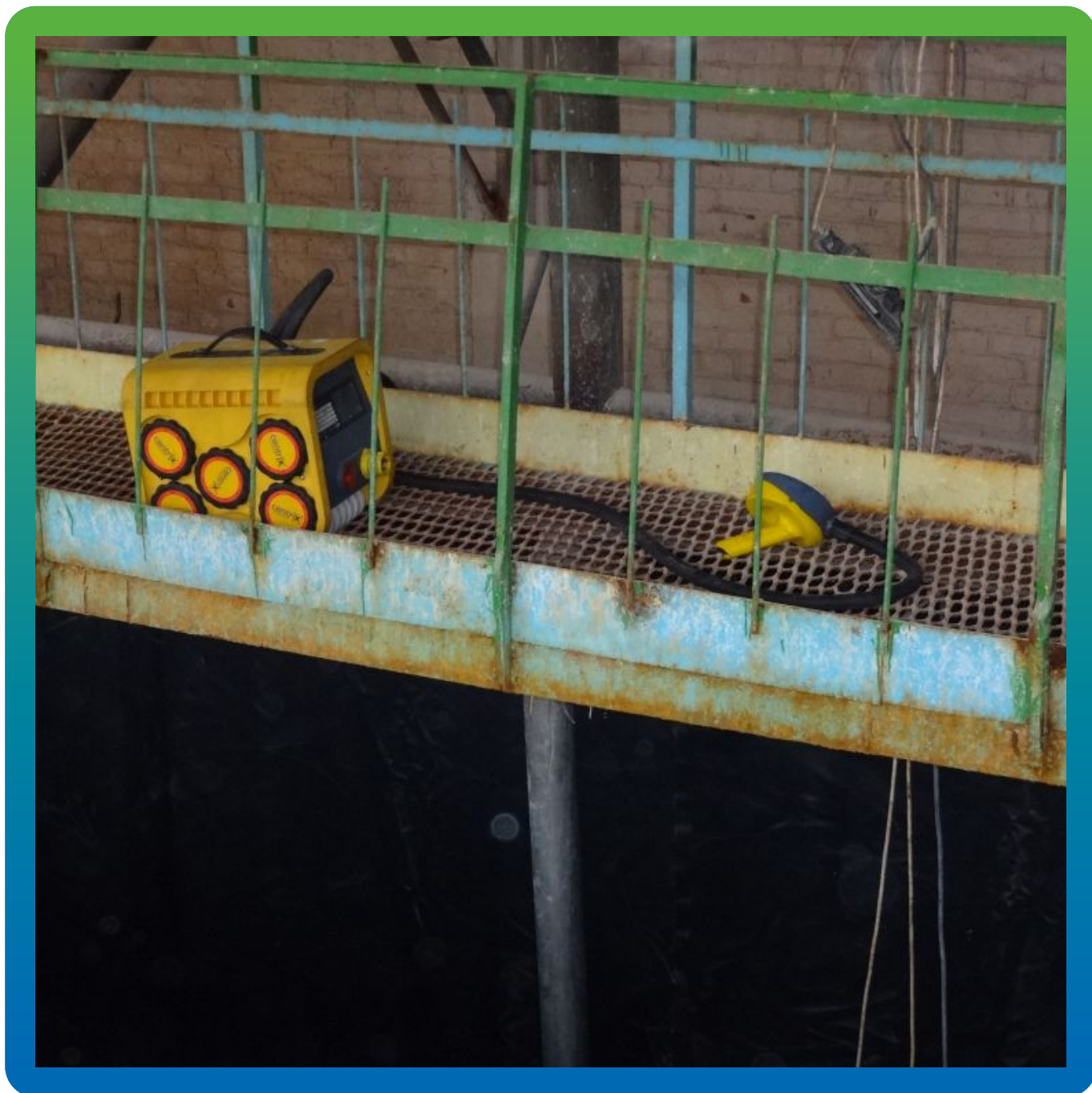
Крепление к основанию мембраны Преласты СТ 1,2 мм без прокола методом "Центрикс"