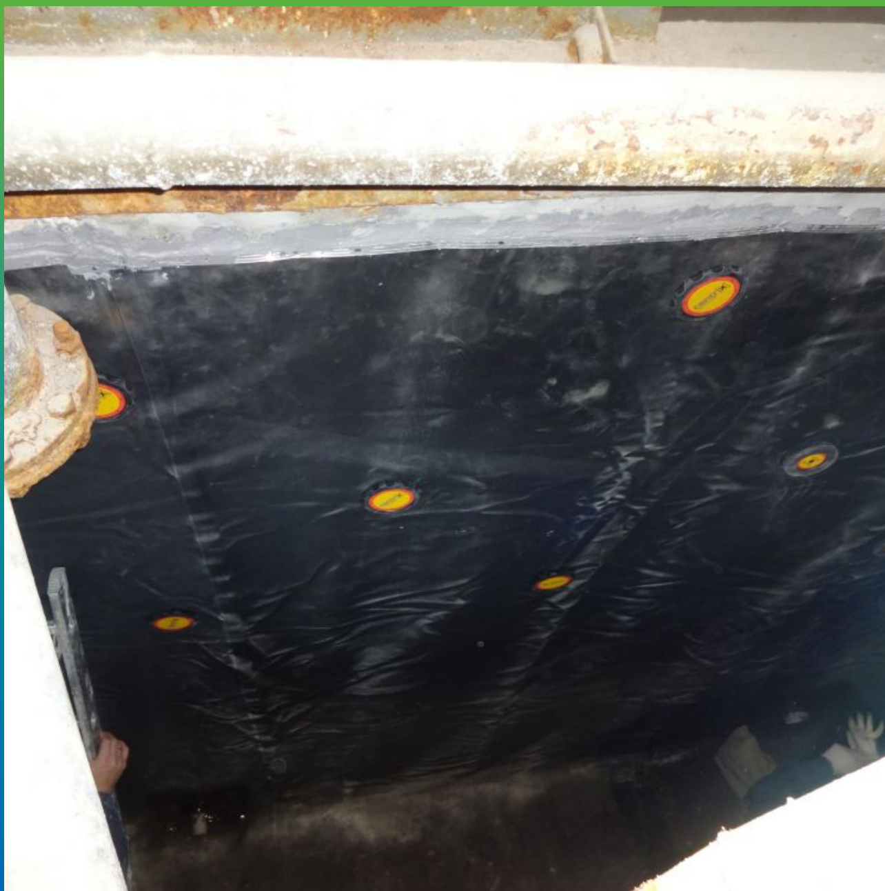
Крепление к основанию мембраны Преласты СТ 1,2 мм без прокола методом "Центрикс"