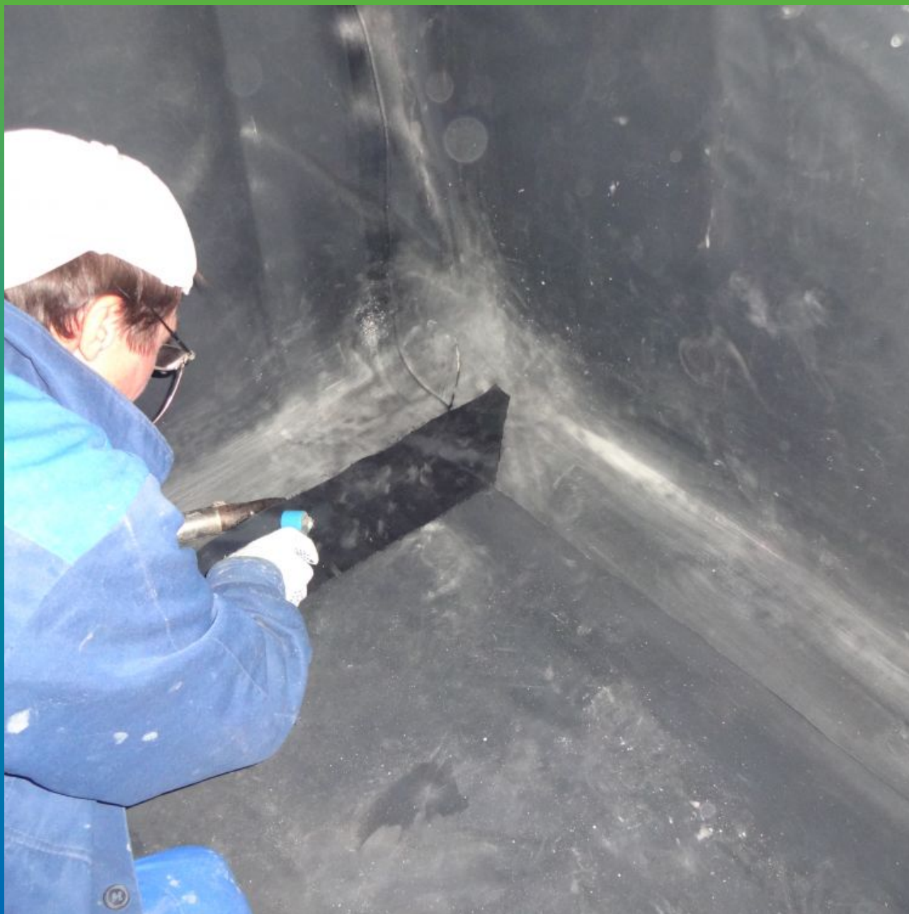
Сварка горячим воздухом двух карт методом "Термобонд"