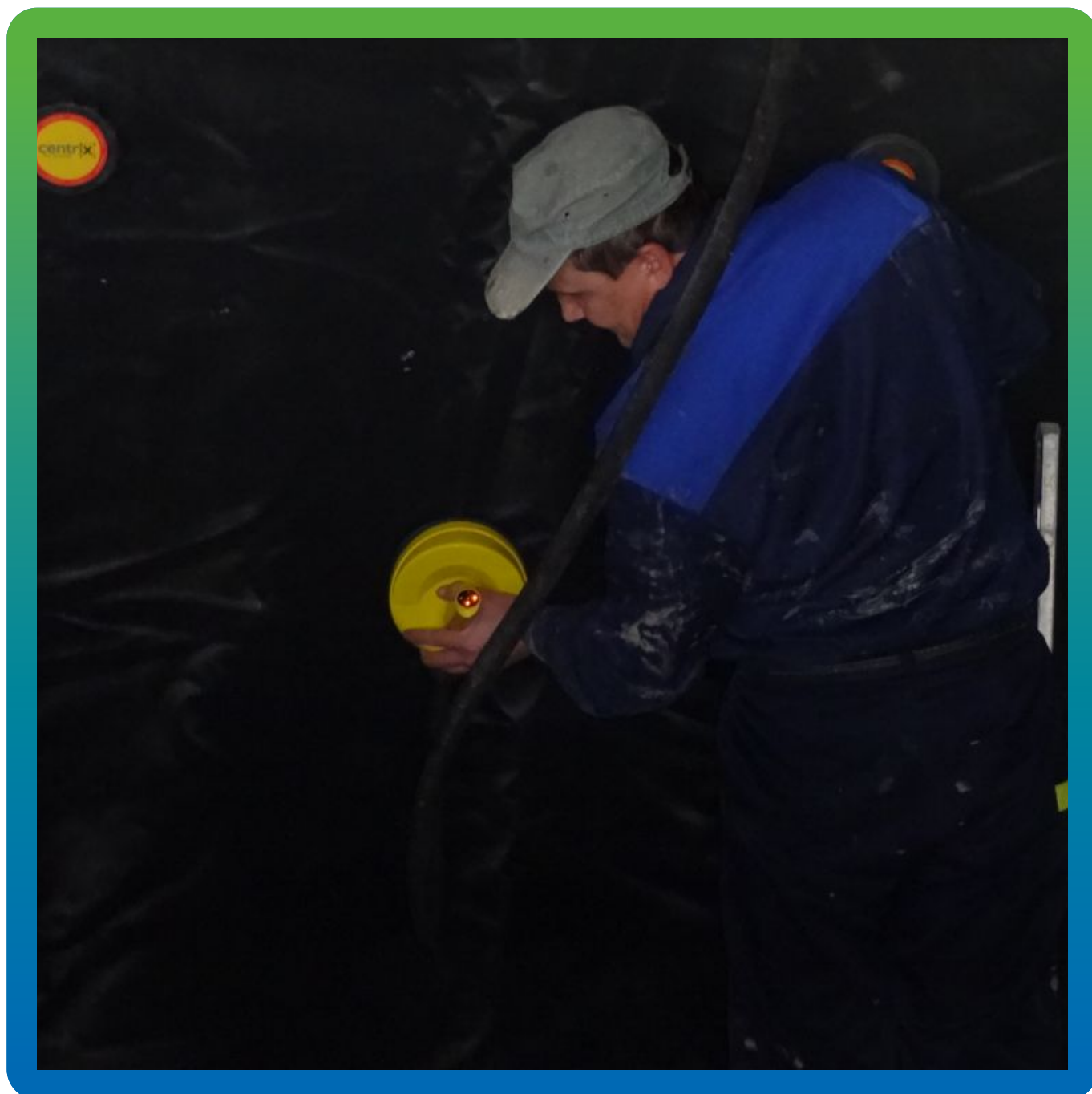
Крепление к основанию мембраны Преласты СТ 1,2 мм без прокола методом "Центрикс"