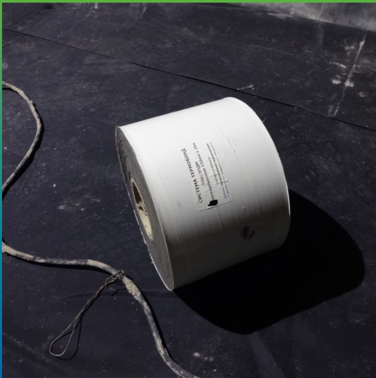
Сварка горячим воздухом двух карт методом "Термобонд"