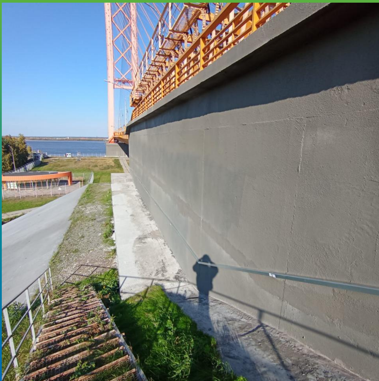
Отремонтированная поверхность концевой опоры составами Стармекс РМ3 и Стармекс РМ5