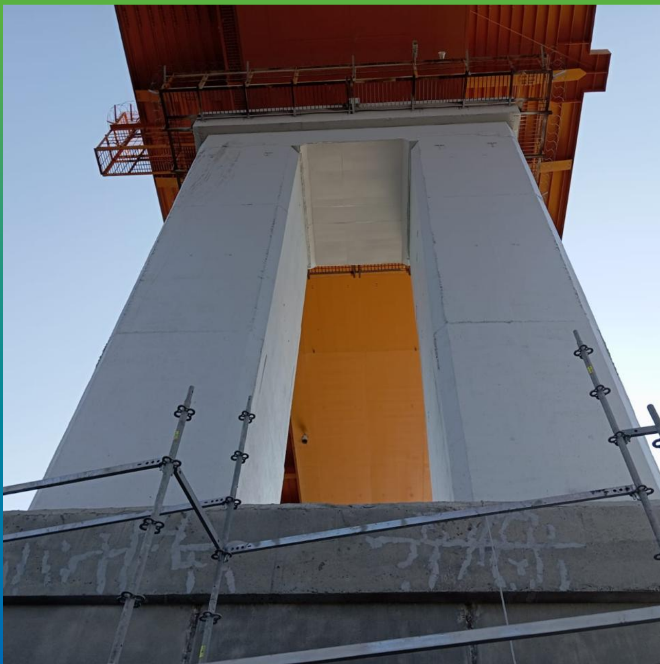
Ремонт трещин на волнорезе опоры моста ремонтными составами Стармекс