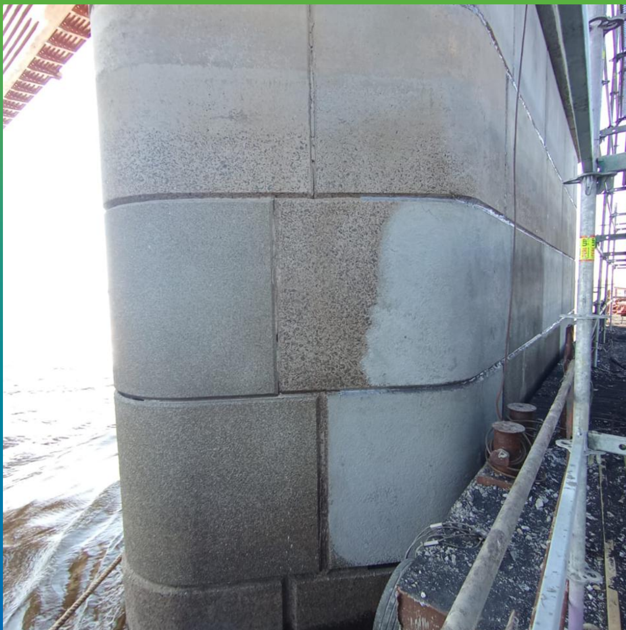
Процесс нанесения гидроизоляционного состава Стармекс Сил Флекс на волнорезы промежуточных опор