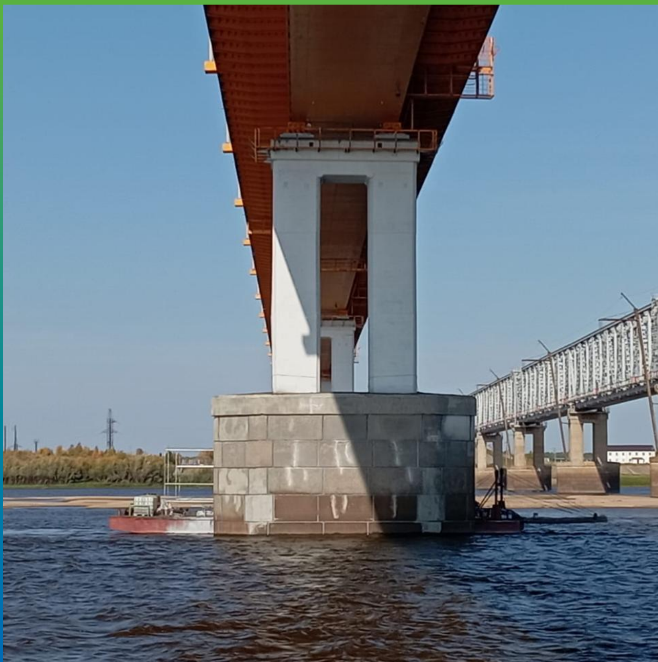
Вид опор мостового сооружения до проведения ремонтных работ