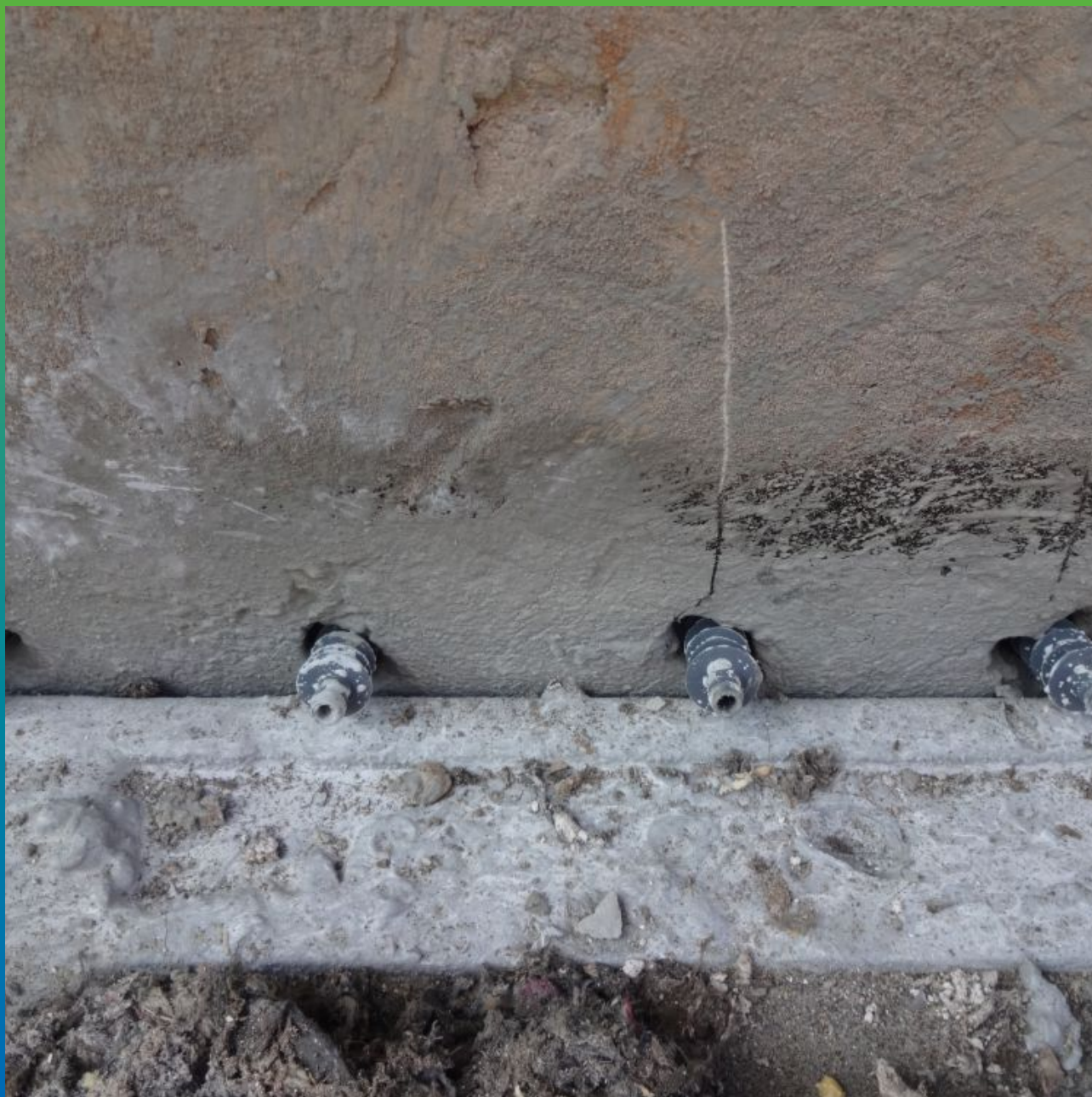
Установка пакеров в пробуренные шпуры