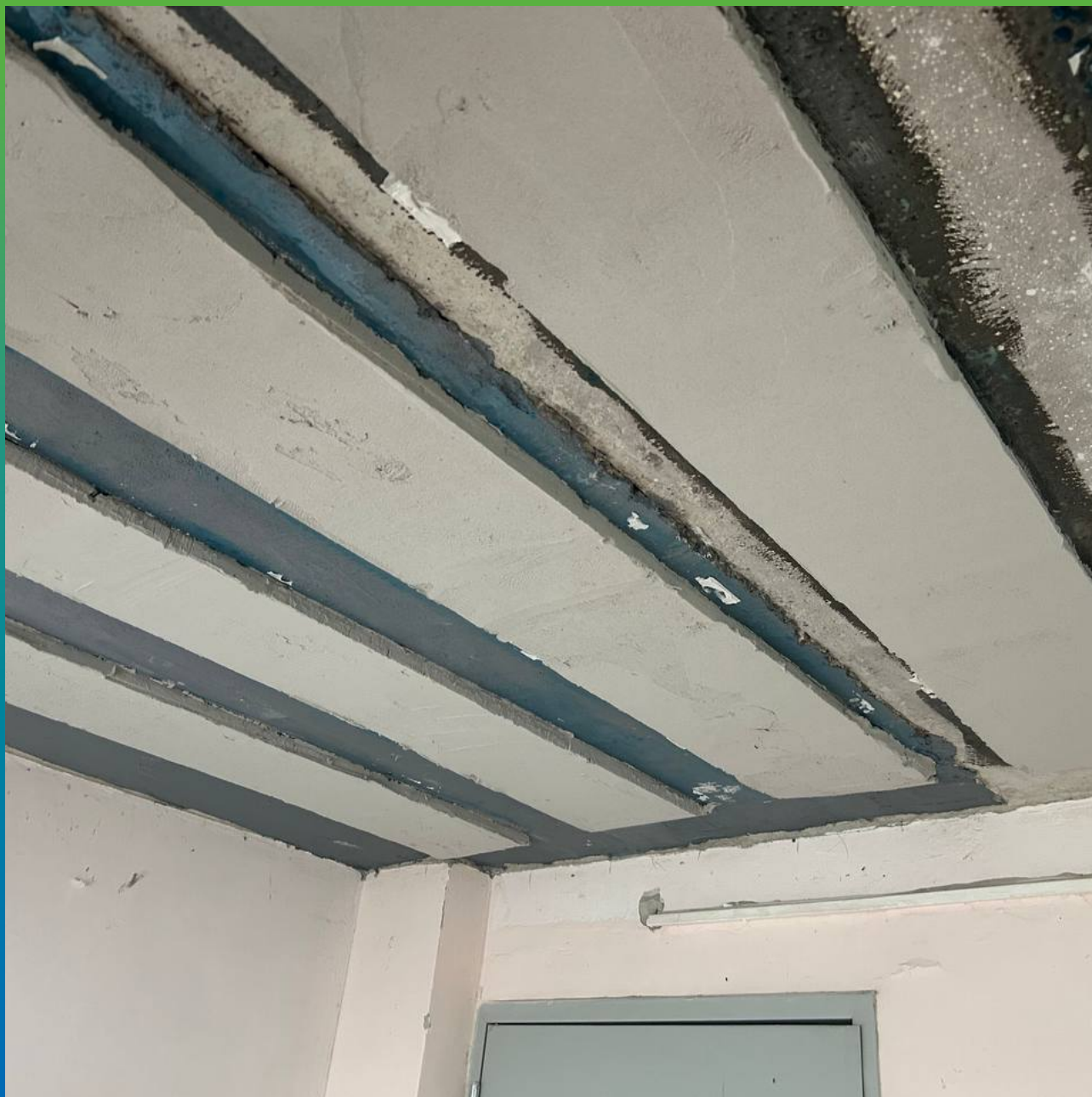
Общий вид объекта после проведения работ по усилению плит под установку томографа