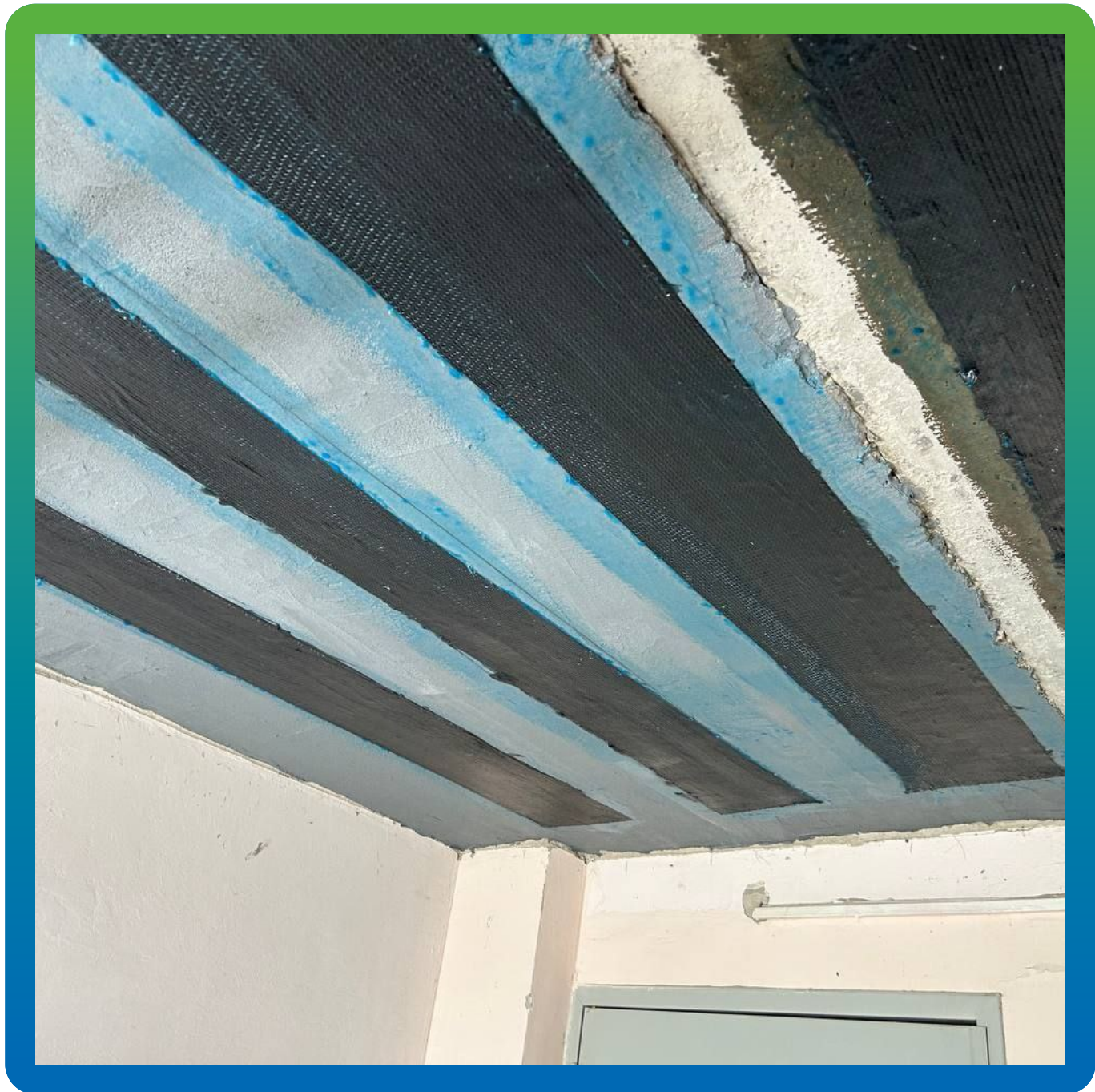
Монтаж холстов на конструкцию