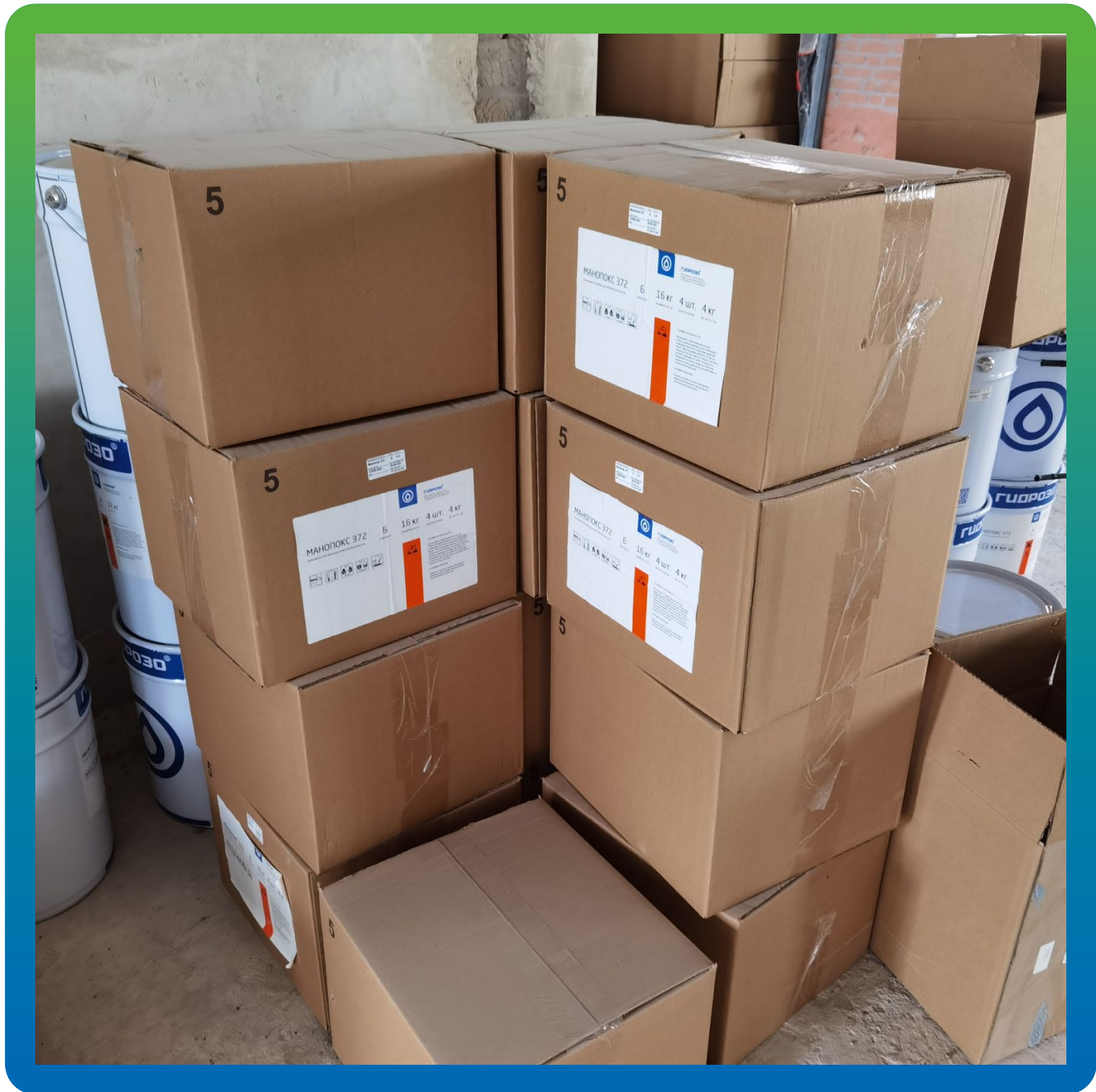
Материалы Гидрозо на объекте