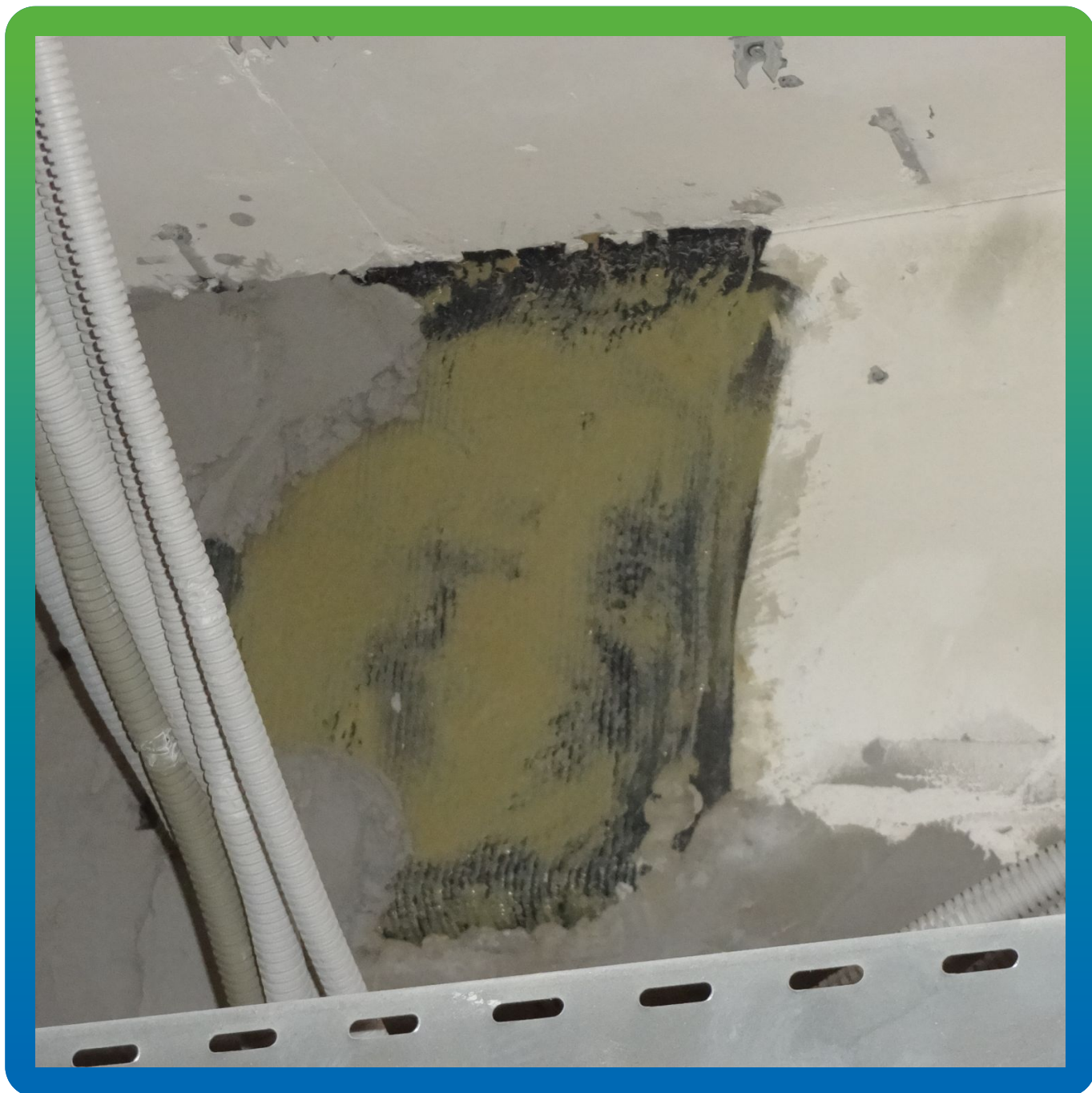
Нанесение грунтовочного слоя Пирошел Бонд