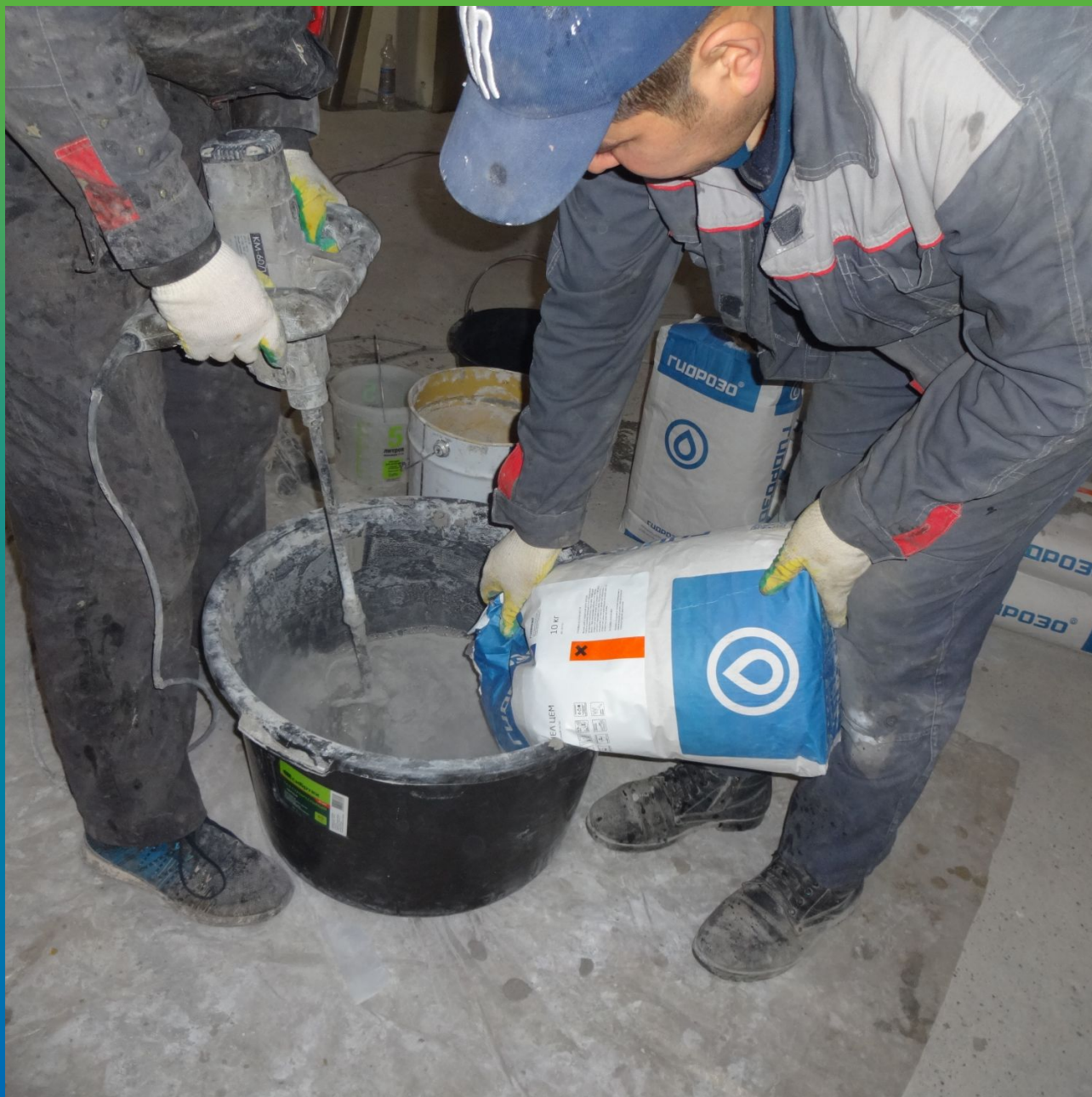
Подготовка к нанесению системы огнезащиты Пирошел Цем