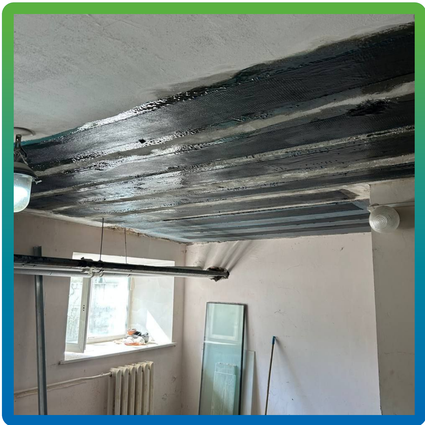
Общий вид смонтированной системы усиления на клей Манопокс 372