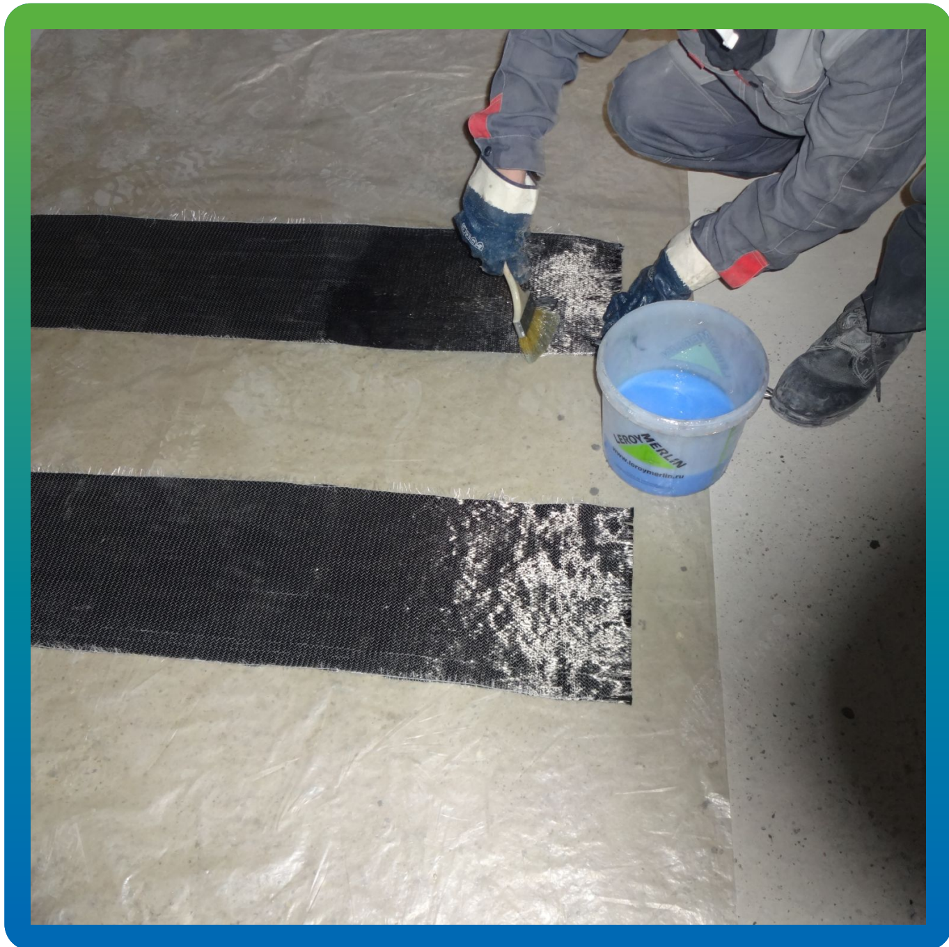
Пропитка клеевым составом заранее нарезанных по размерам Армошел KB 200