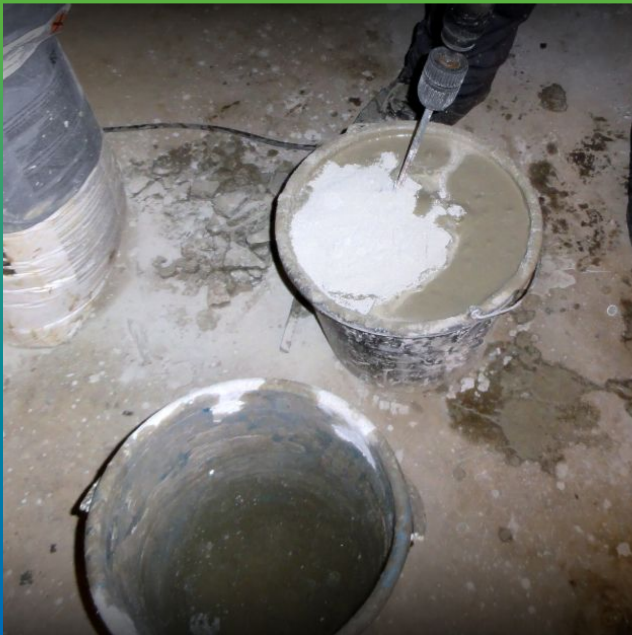
Затворение полимер-цементной семи с водой согласно ТО.