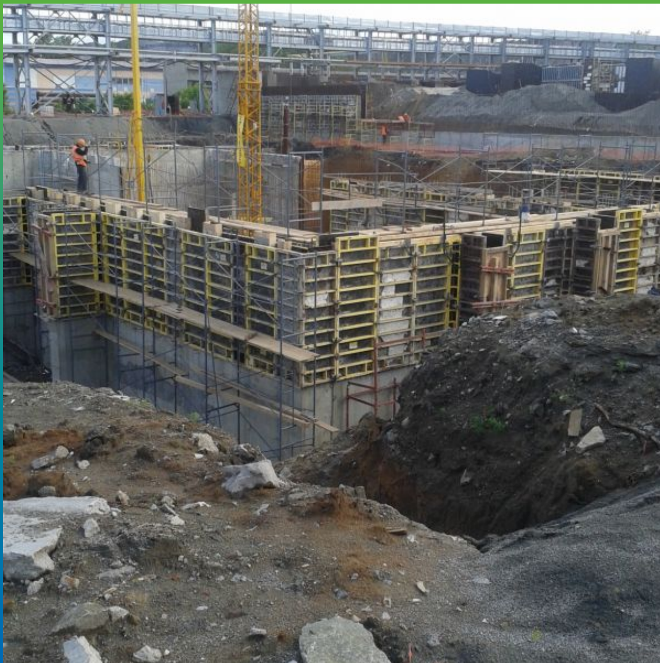
Общий вид объекта.