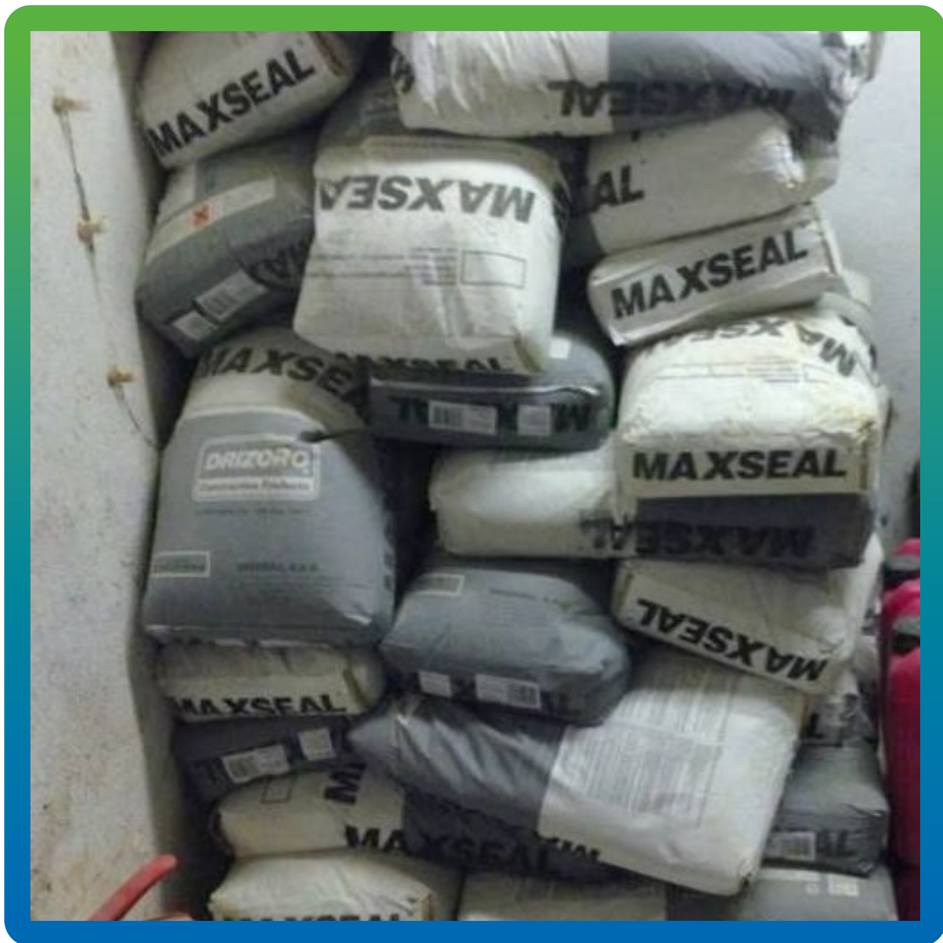
Полимер-цементная гидроизоляция на объекте.