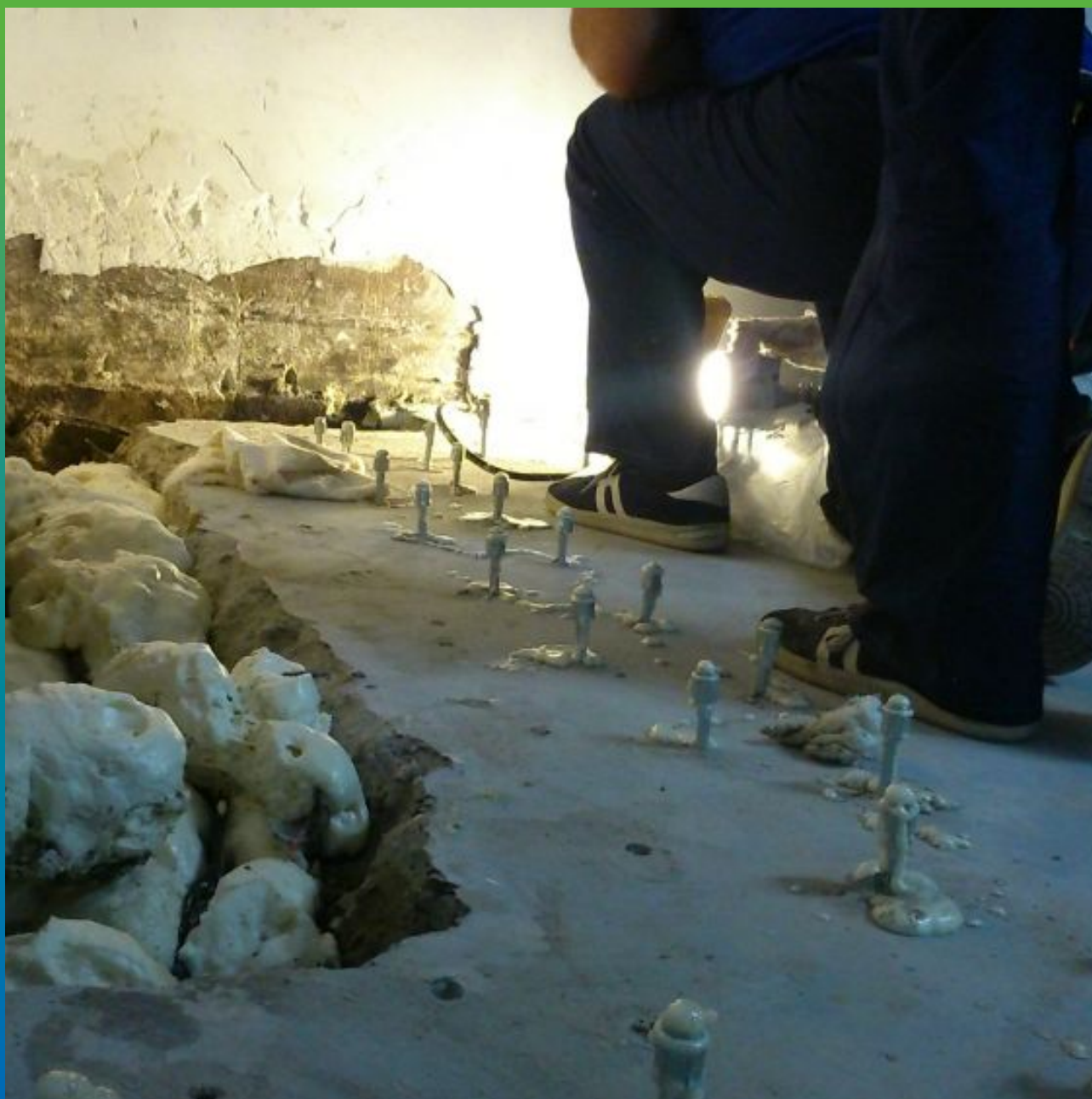
Результат инъектирования материала Манопур 15