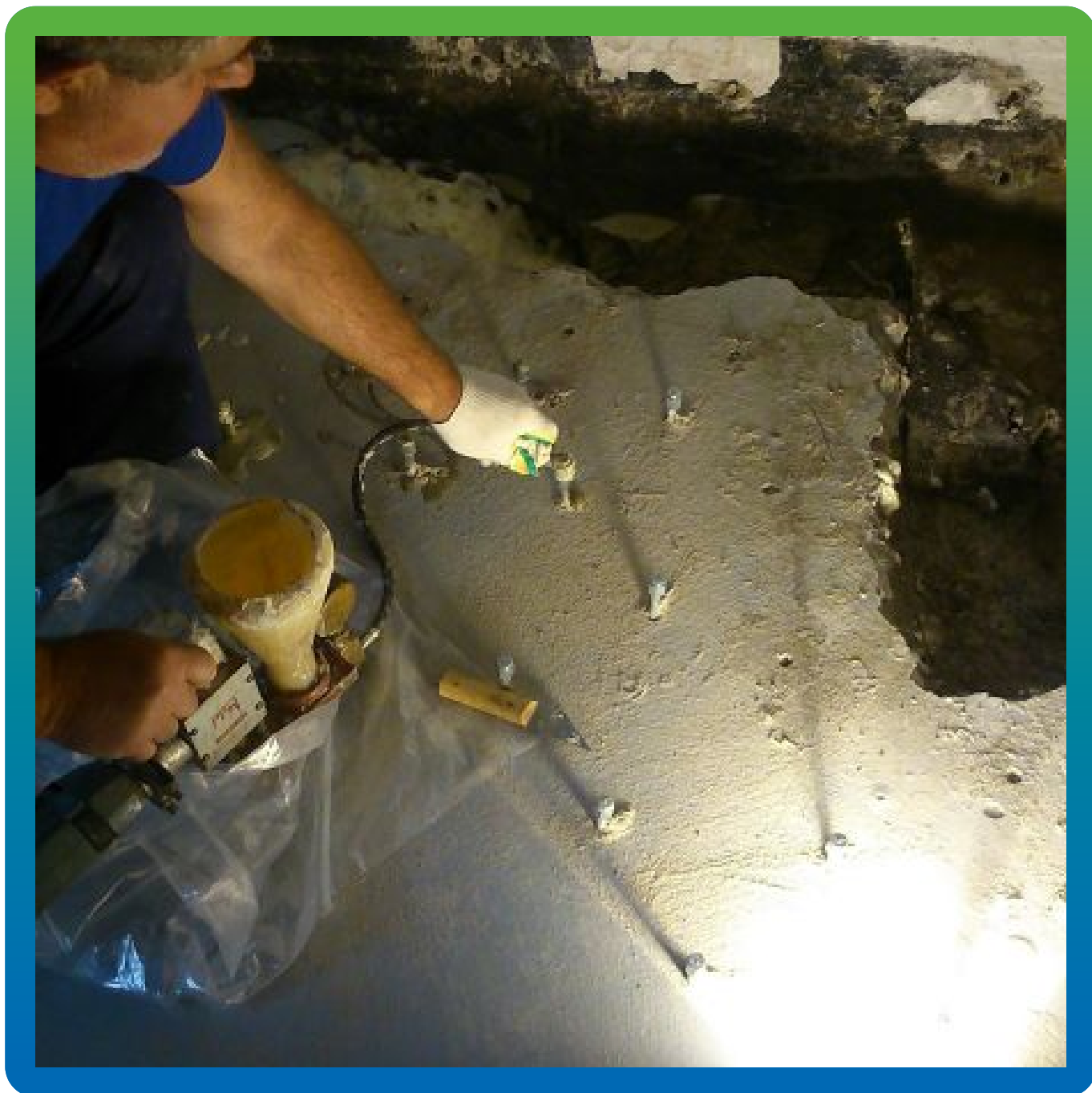
Инъектирование Манопур 15 насосом БМ 0400