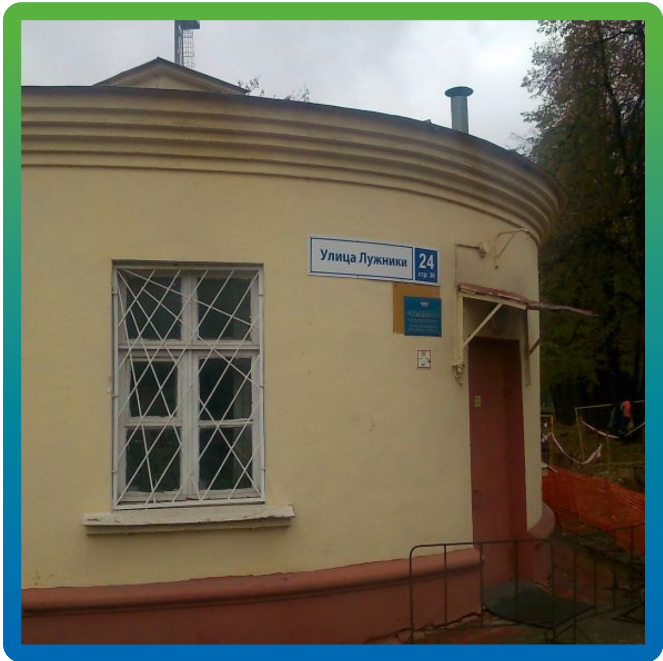
Общий вид объекта