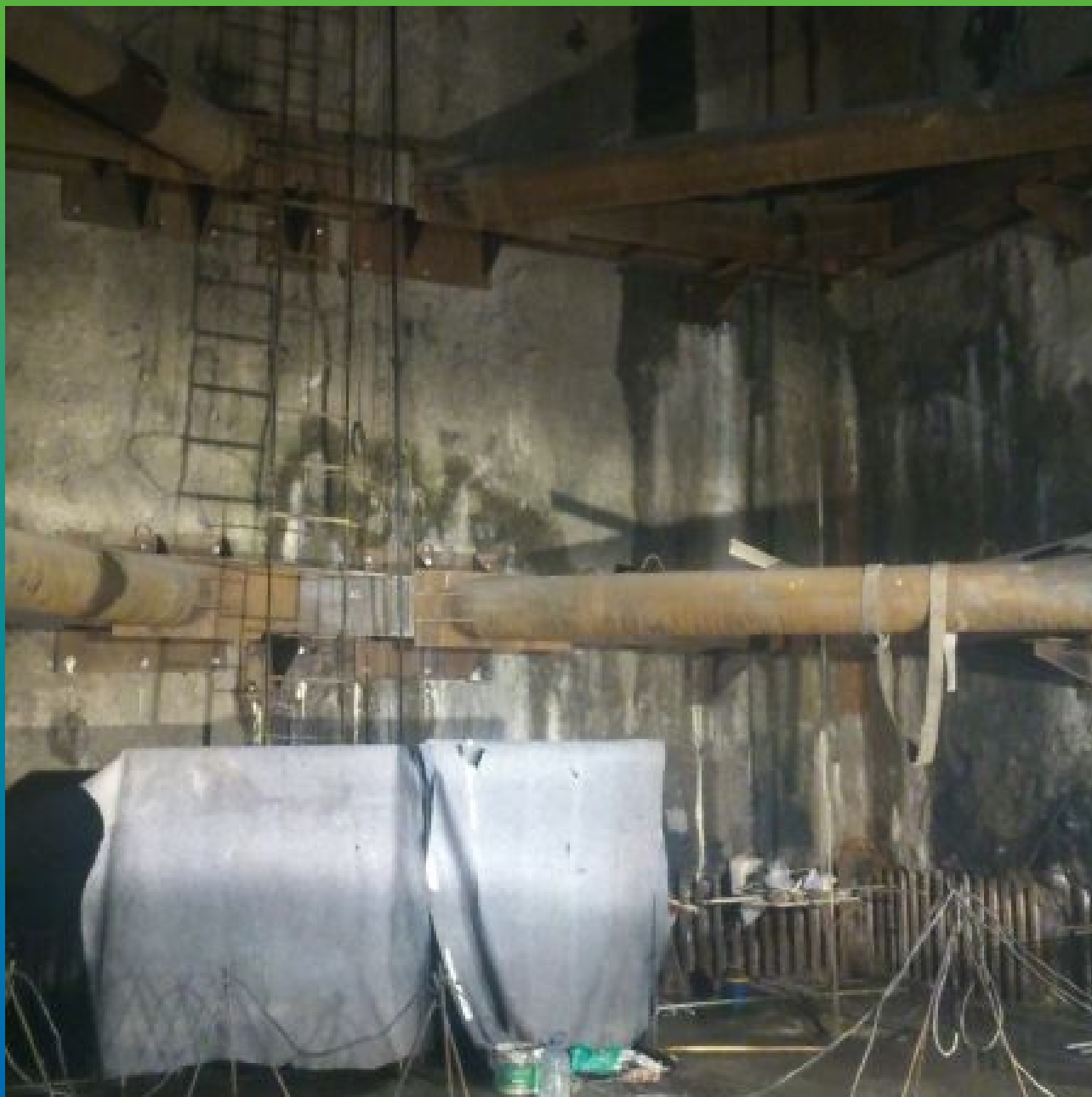
Вид объекта изнутри сооружения