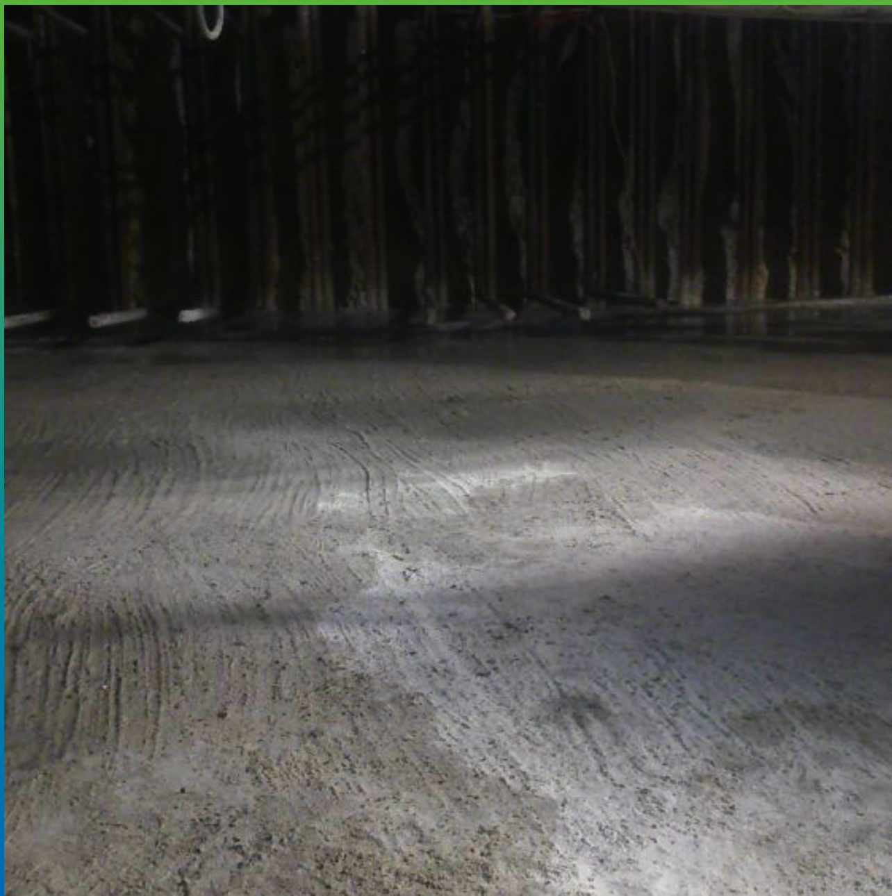
Конечный вид бетонной подготовки, после обработки материалом Макссил Супер