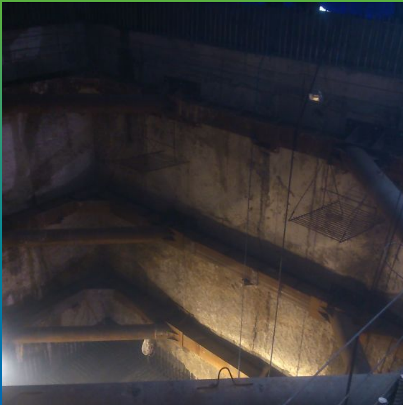
Вид объекта под шатром