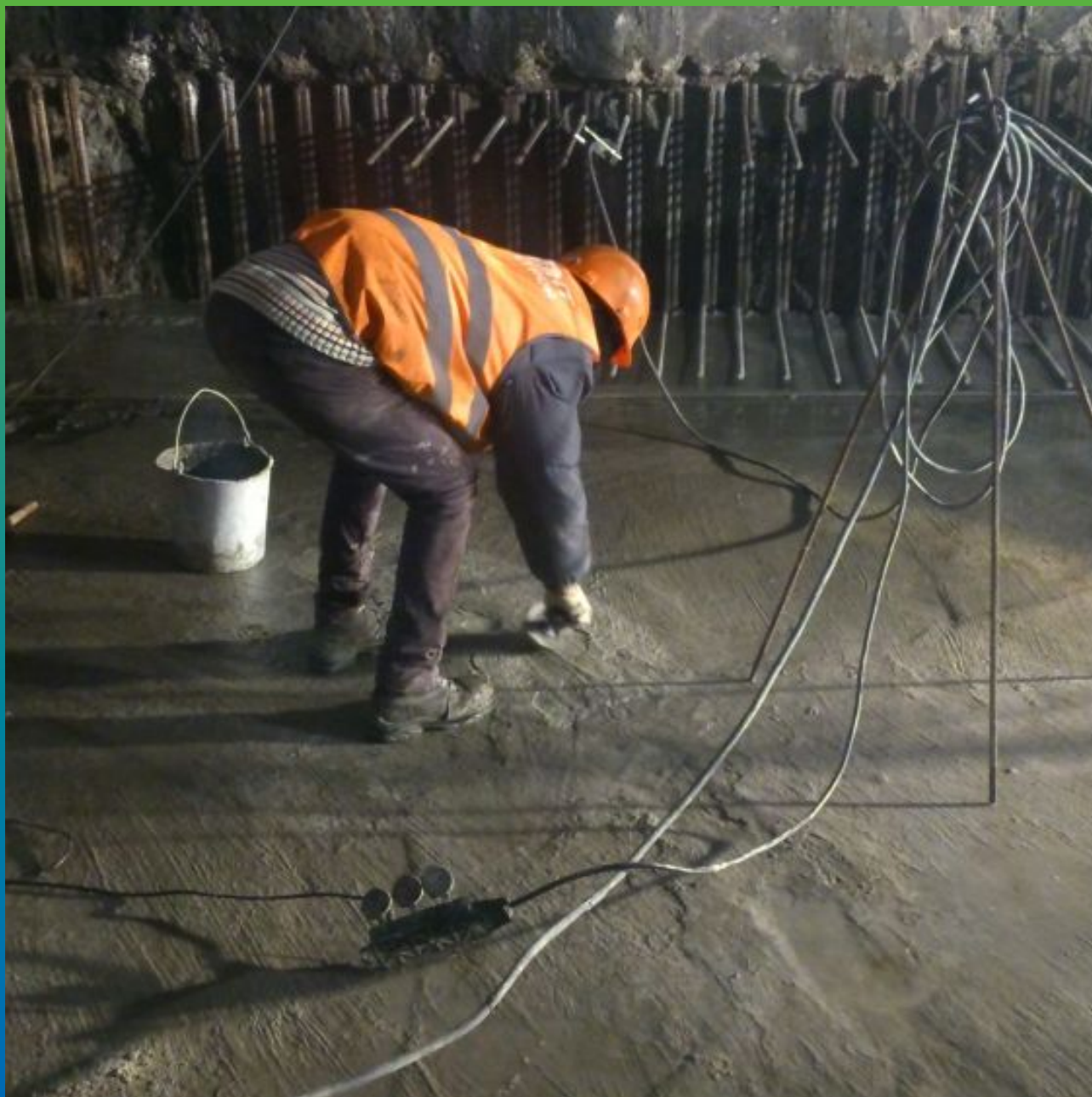
Нанесение Максил Супер на бетонную подготовку