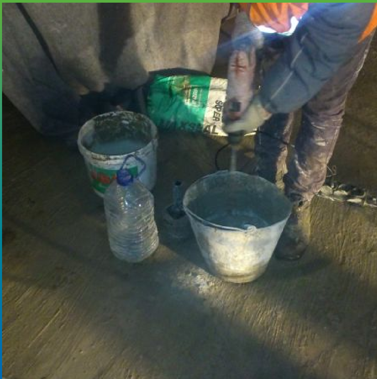
Приготовление материала Максил Супер