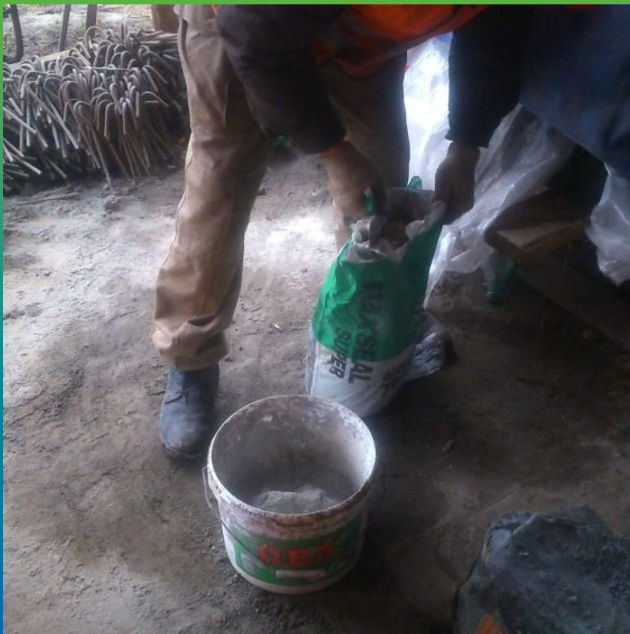
Приготовление материала Максил Супер