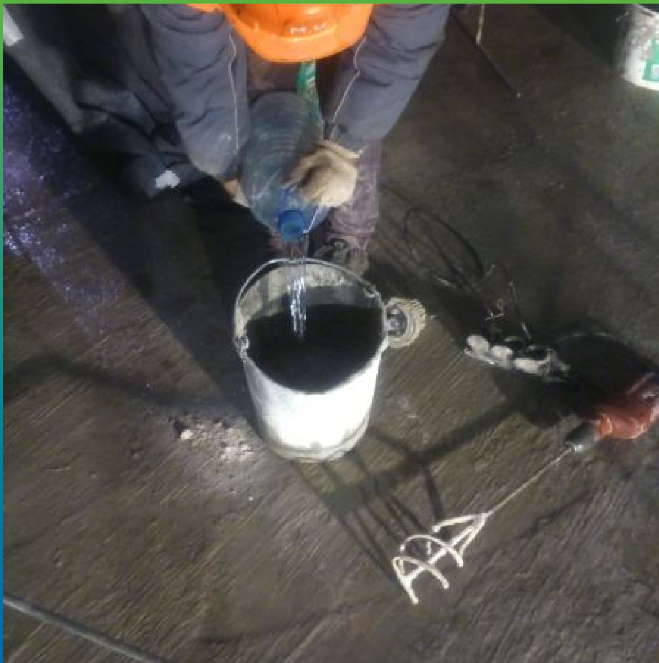
Приготовление материала Максил Супер