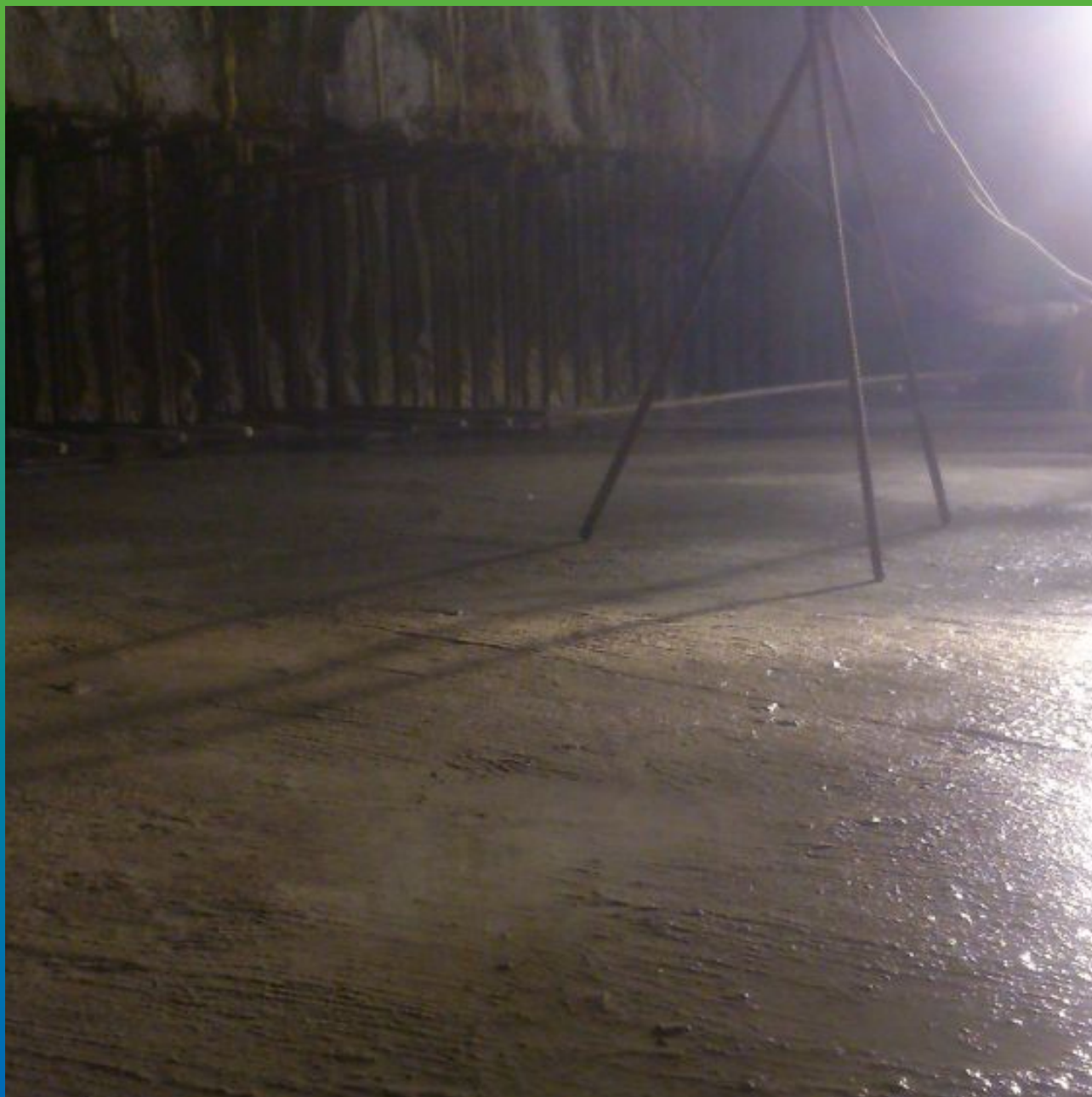
Вид обработанной поверхности