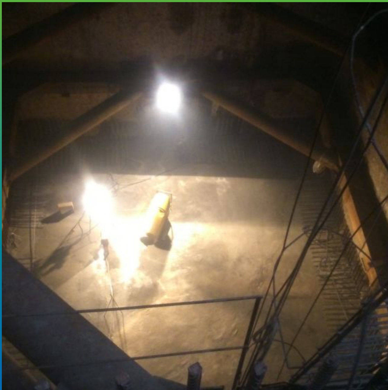
Вид объекта под шатром