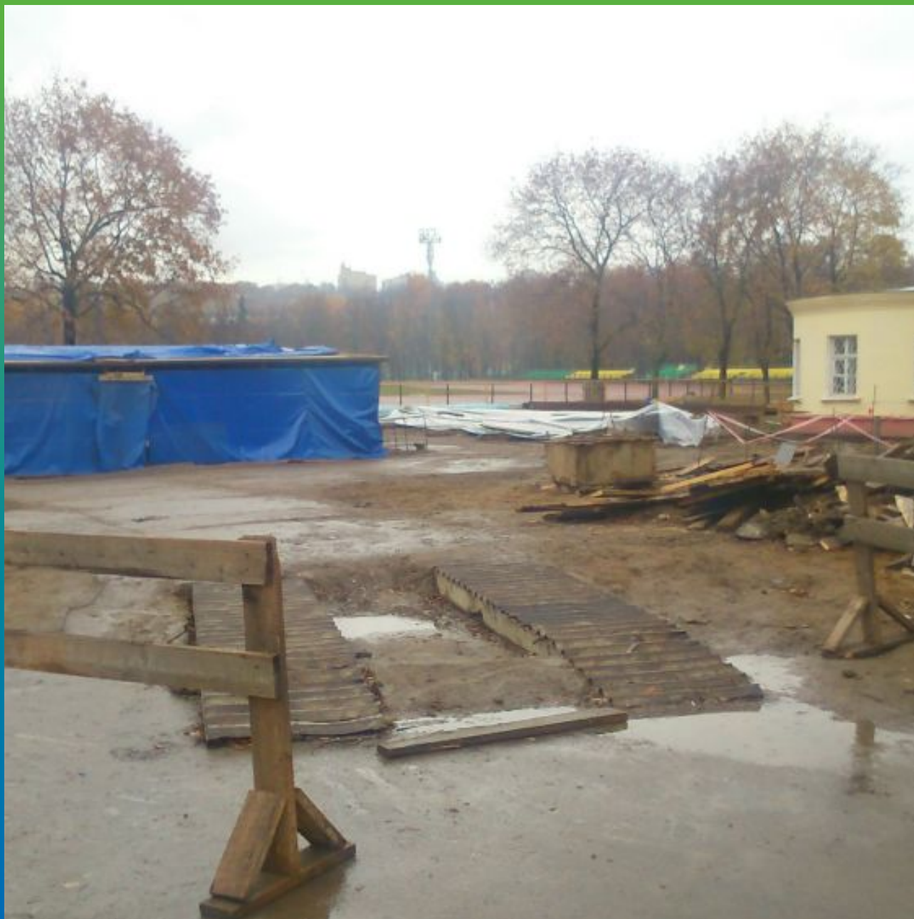
Общий вид объекта