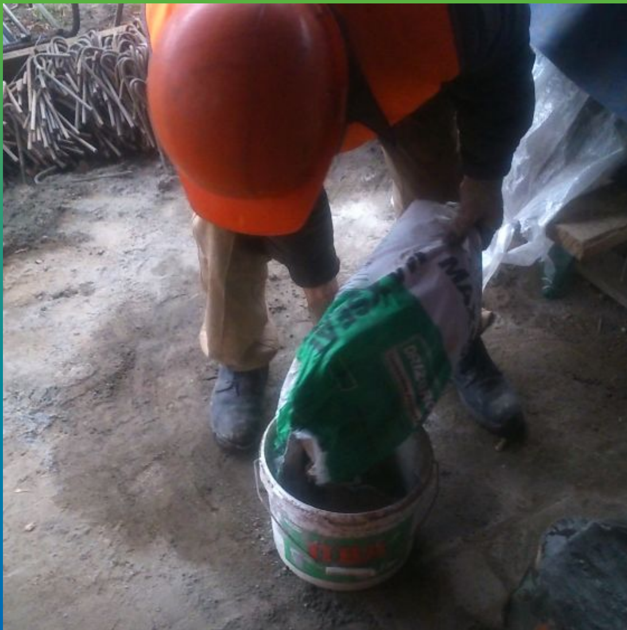
Приготовление материала Максил Супер