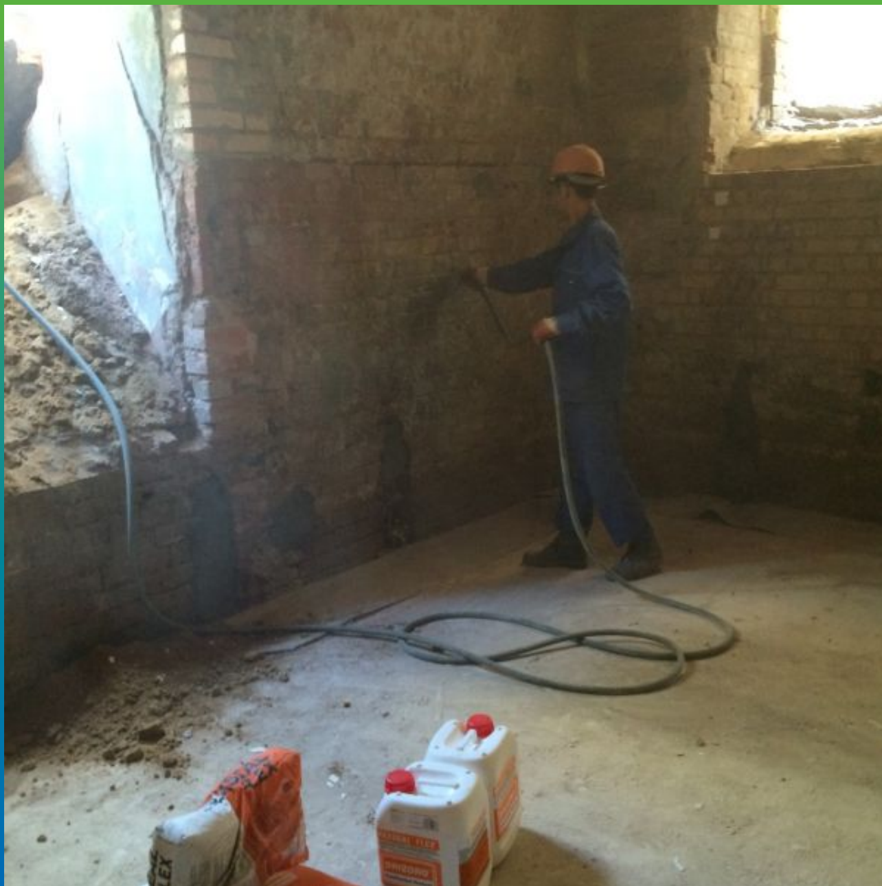
Очистка от пыли кирпичной стены сжатым воздухом