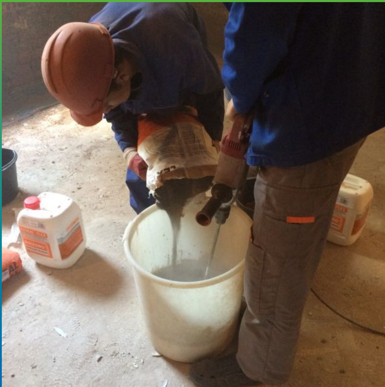
Смешивание двух компонентов Макссил Флекс