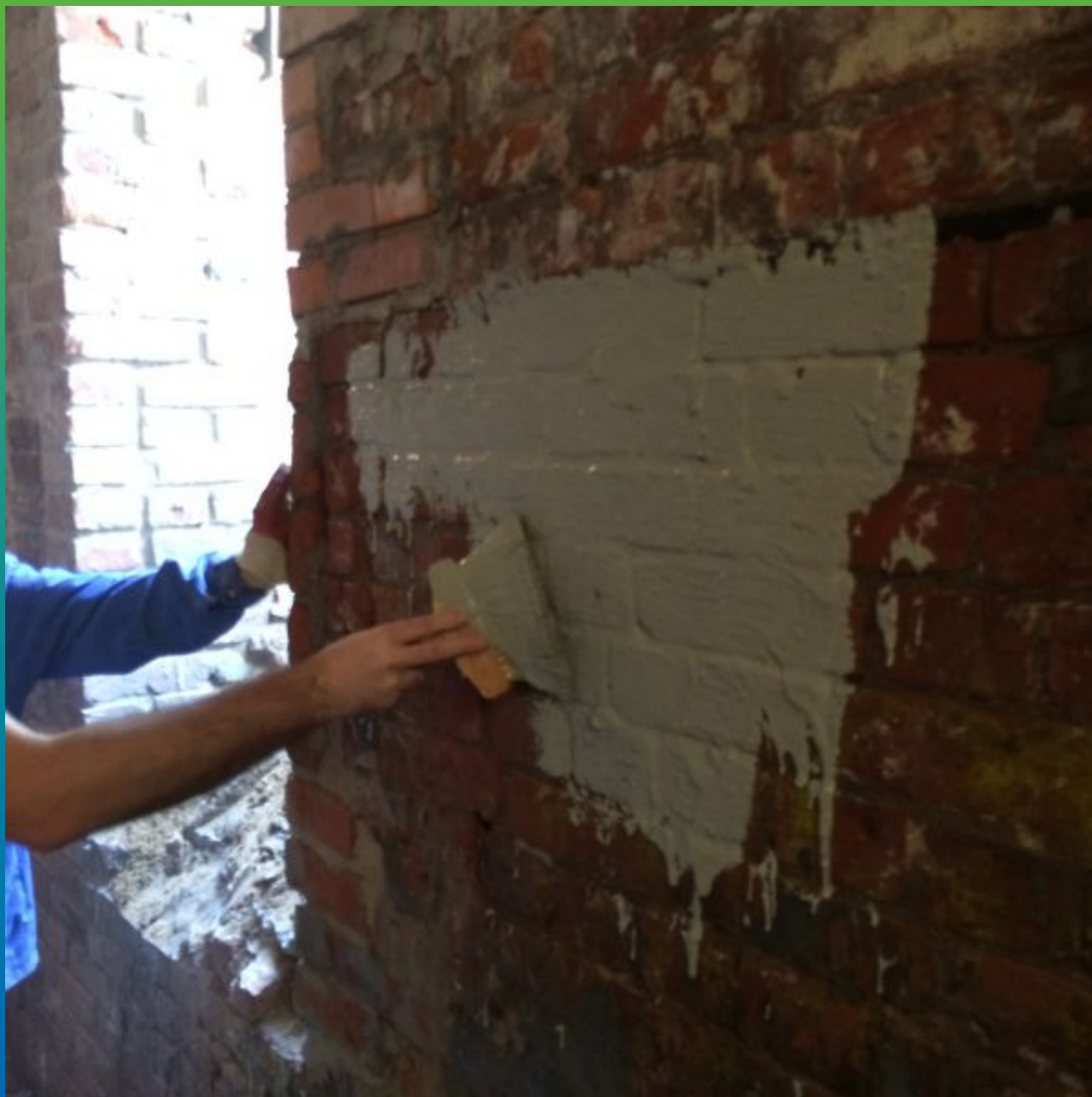
Нанесение Макссил Флекс на кирпичную стену подвала