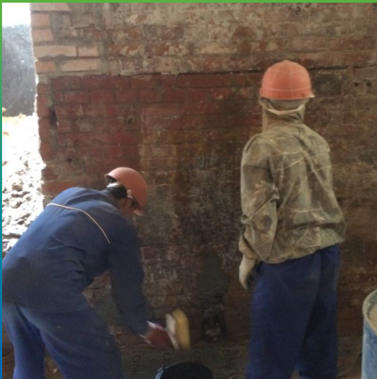
Увлажнение гидроизолируемой поверхности