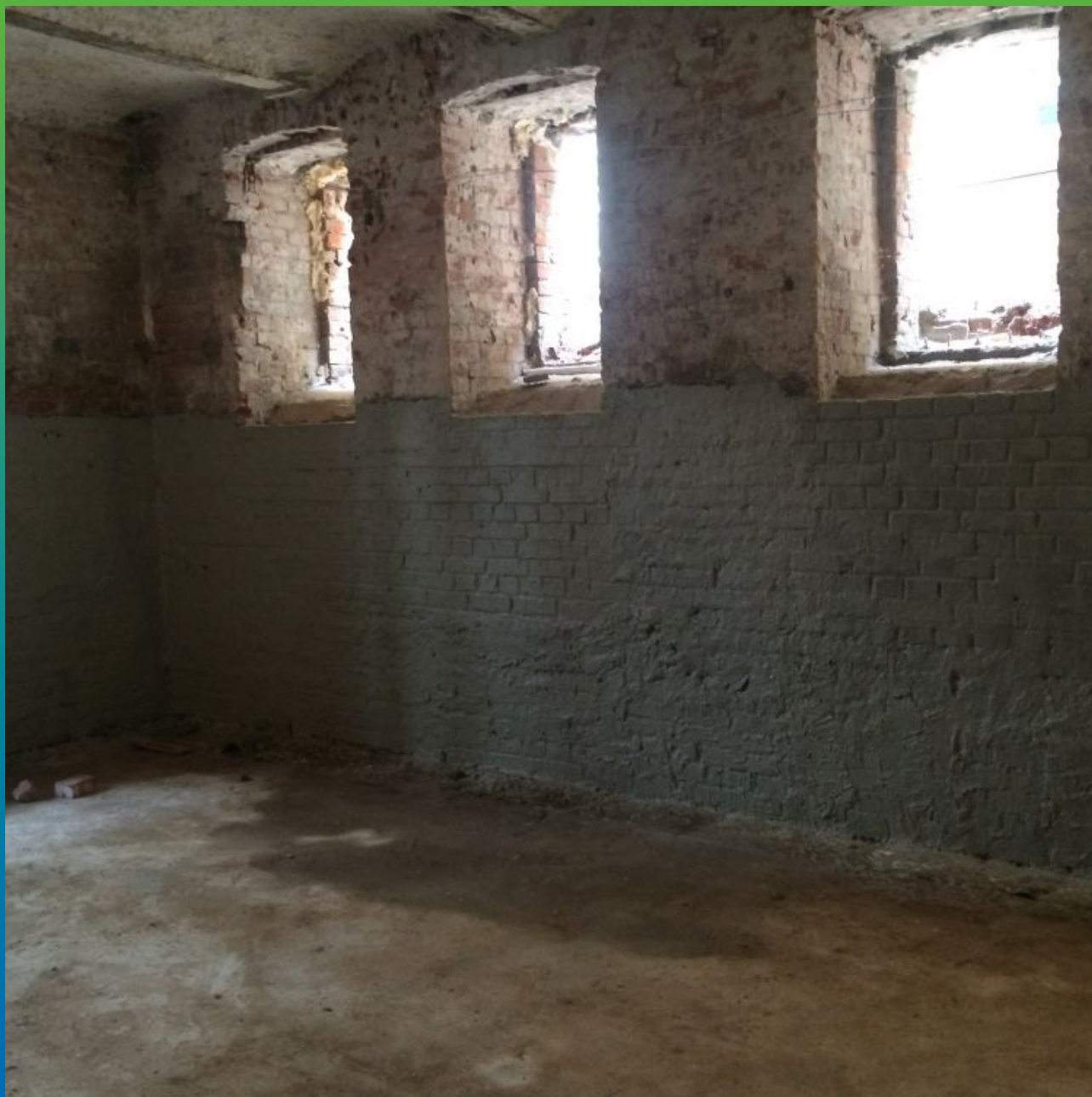
Окончательный вид гидроизоляции в два слоя