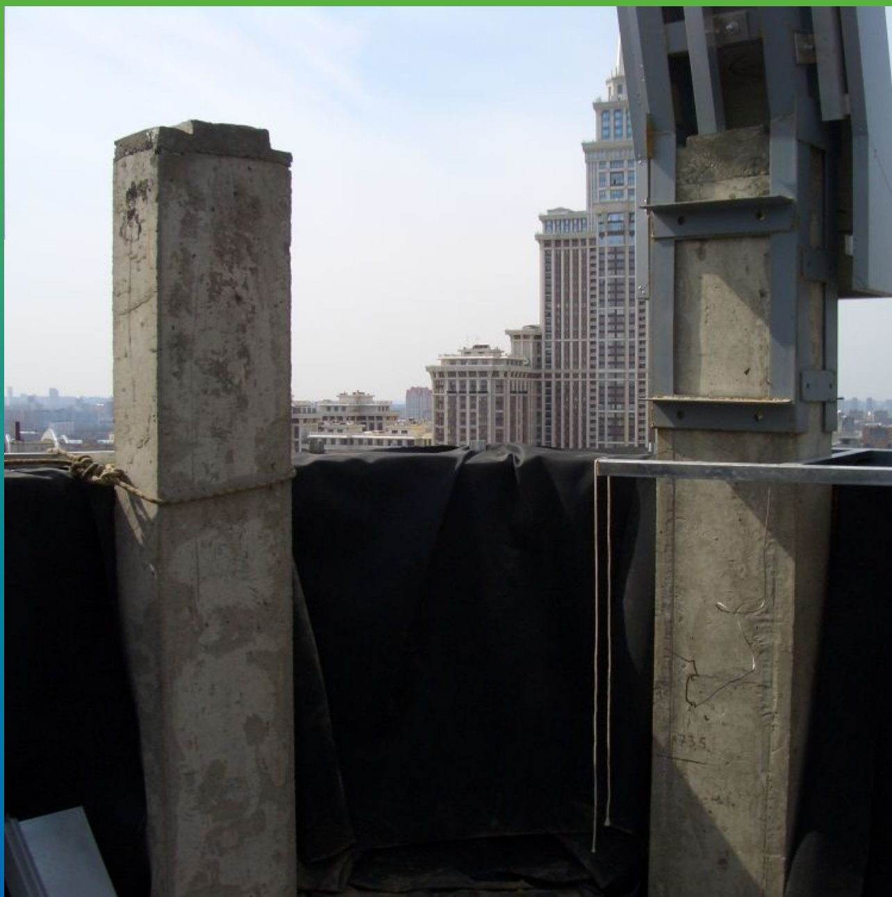
Устройство ЭПДМ мембраны на парапетной части здания