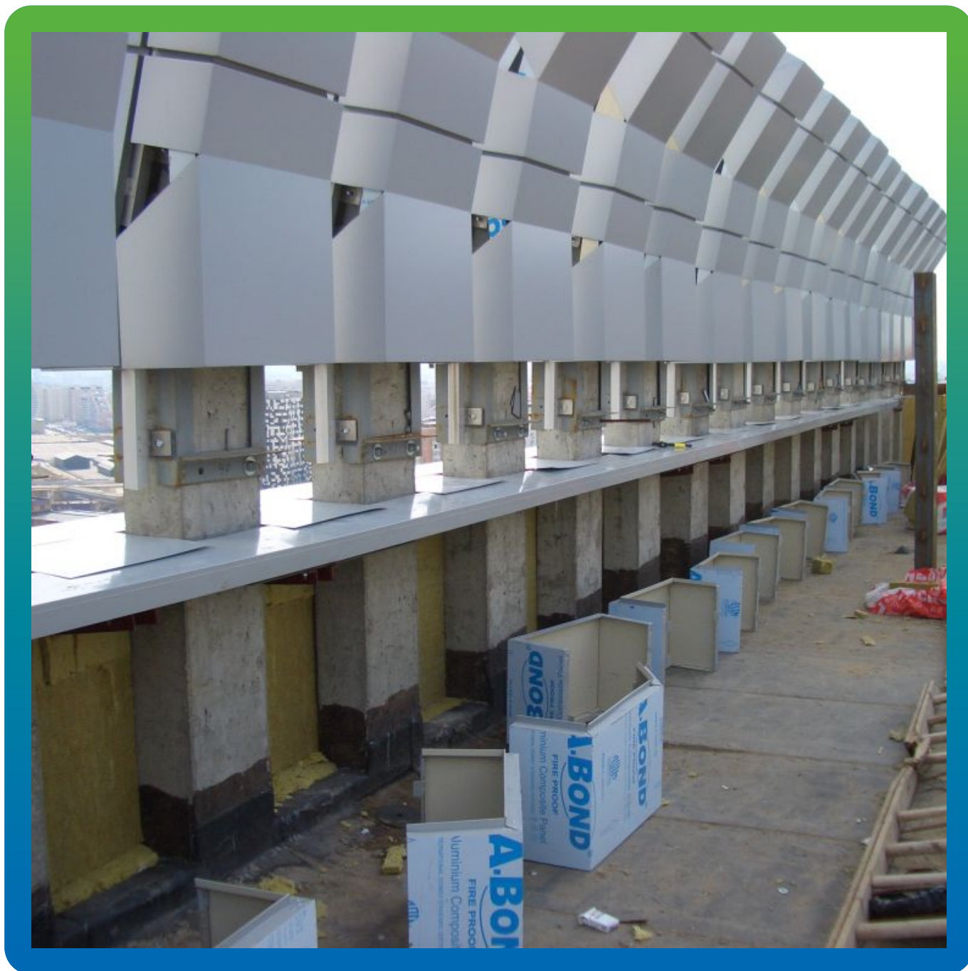
Общий вид парапета до монтажа ЭПДМ мембраны