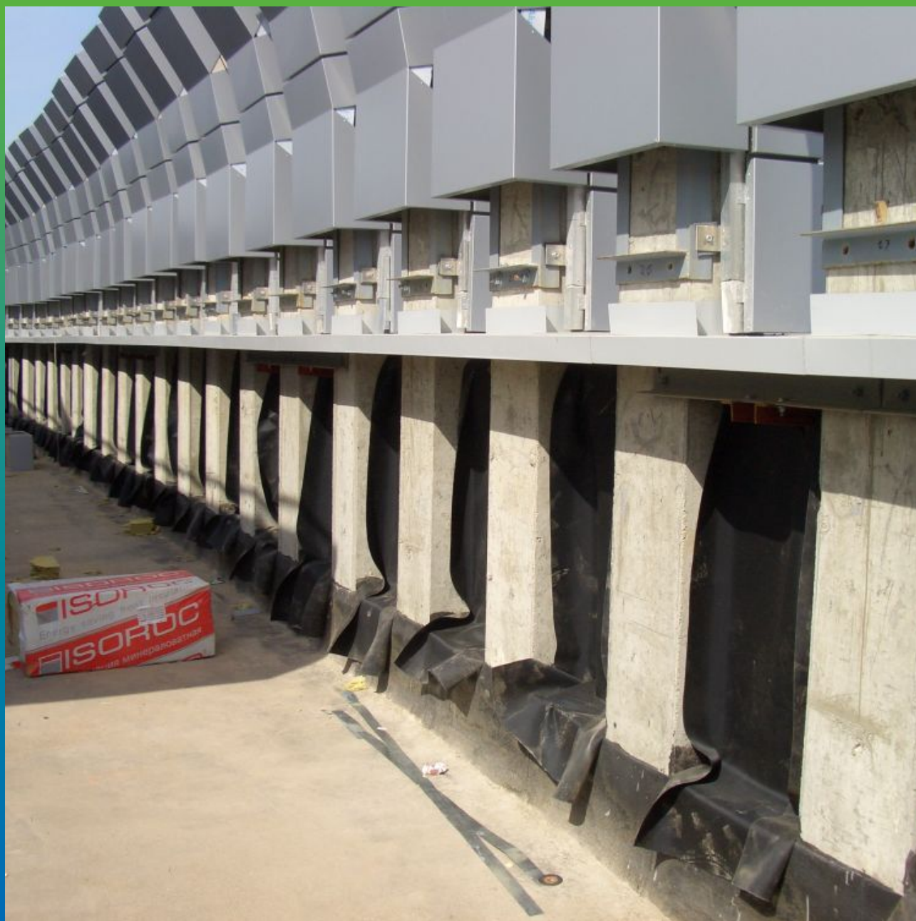
Устройство ЭПДМ мембраны на парапетной части здания