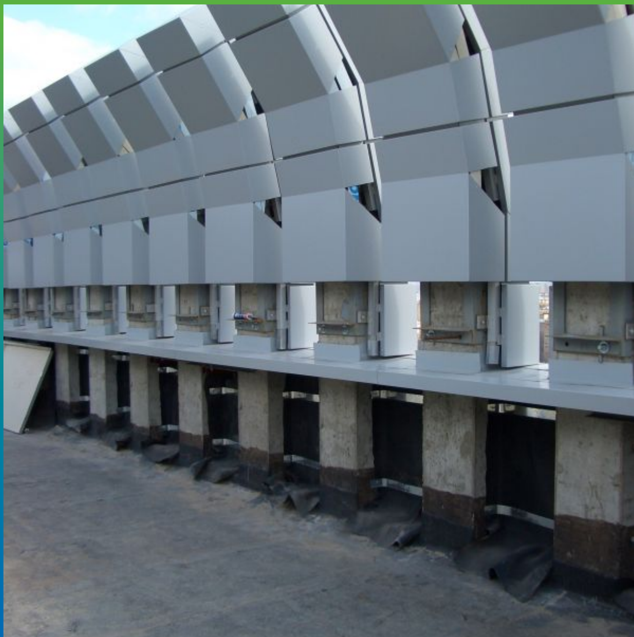
Крепление ЭПДМ мембраны к парапетной части здания