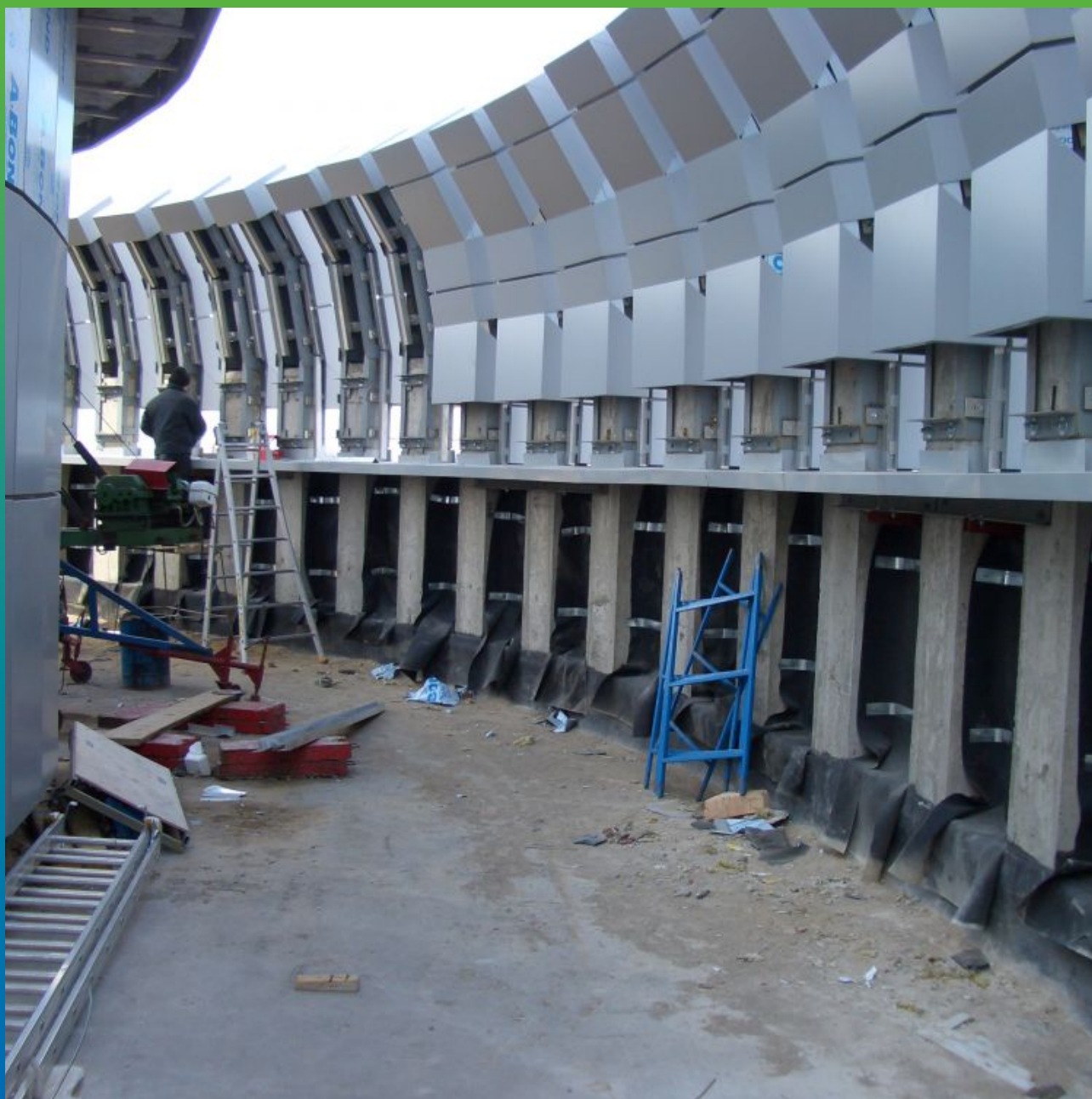
Крепление ЭПДМ мембраны к парапетной части здания