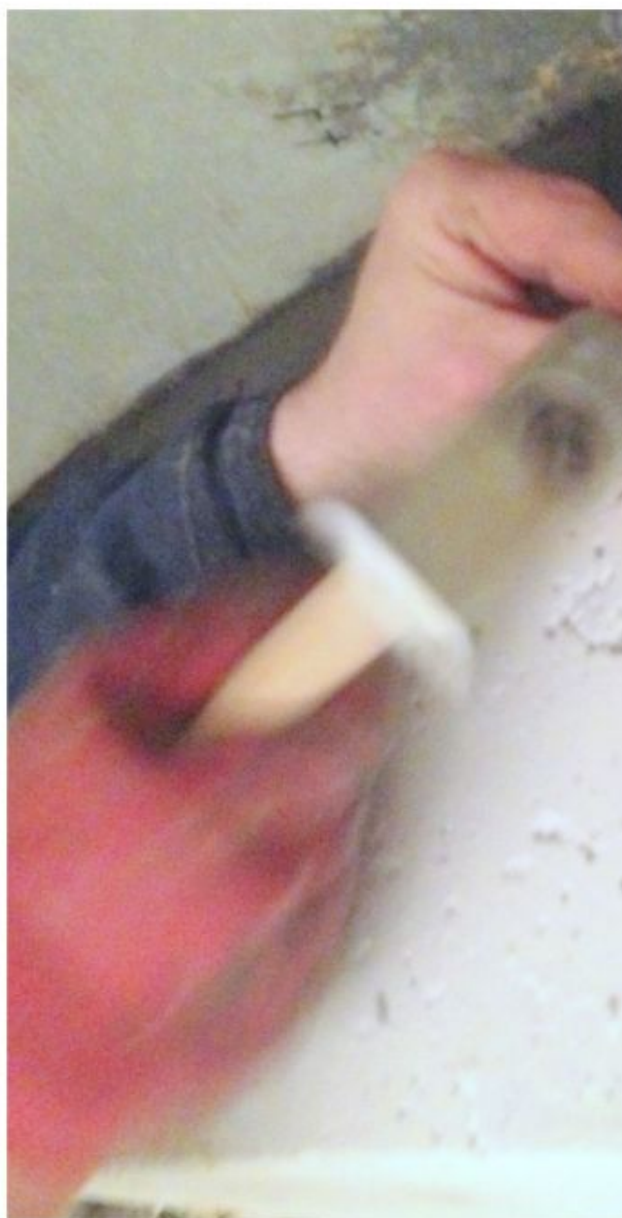
Установка инъекционных трубок - пакеров.