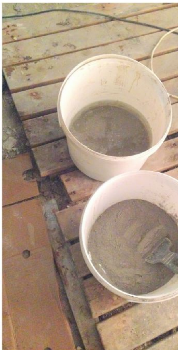
Замешивание гидравлических ремонтных составов с водой.