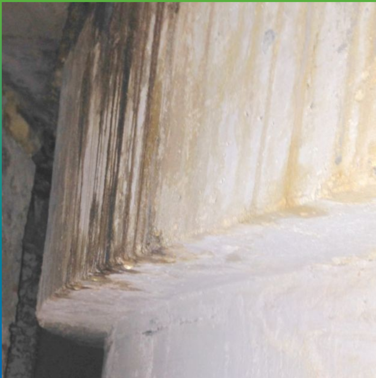
Течь рабочего шва бетонирования. Частный вид.