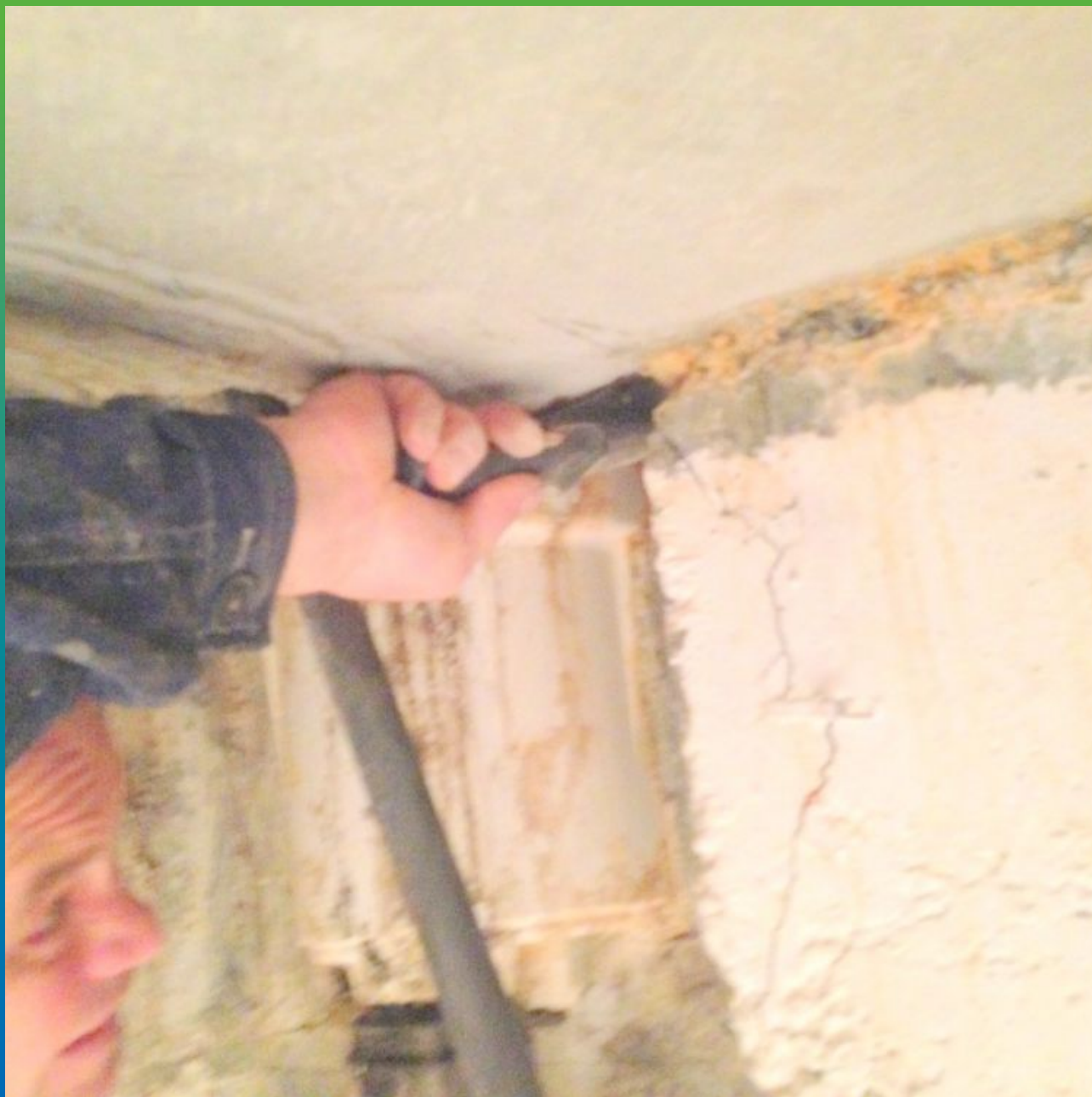
Подготовка шва и его зачистка.