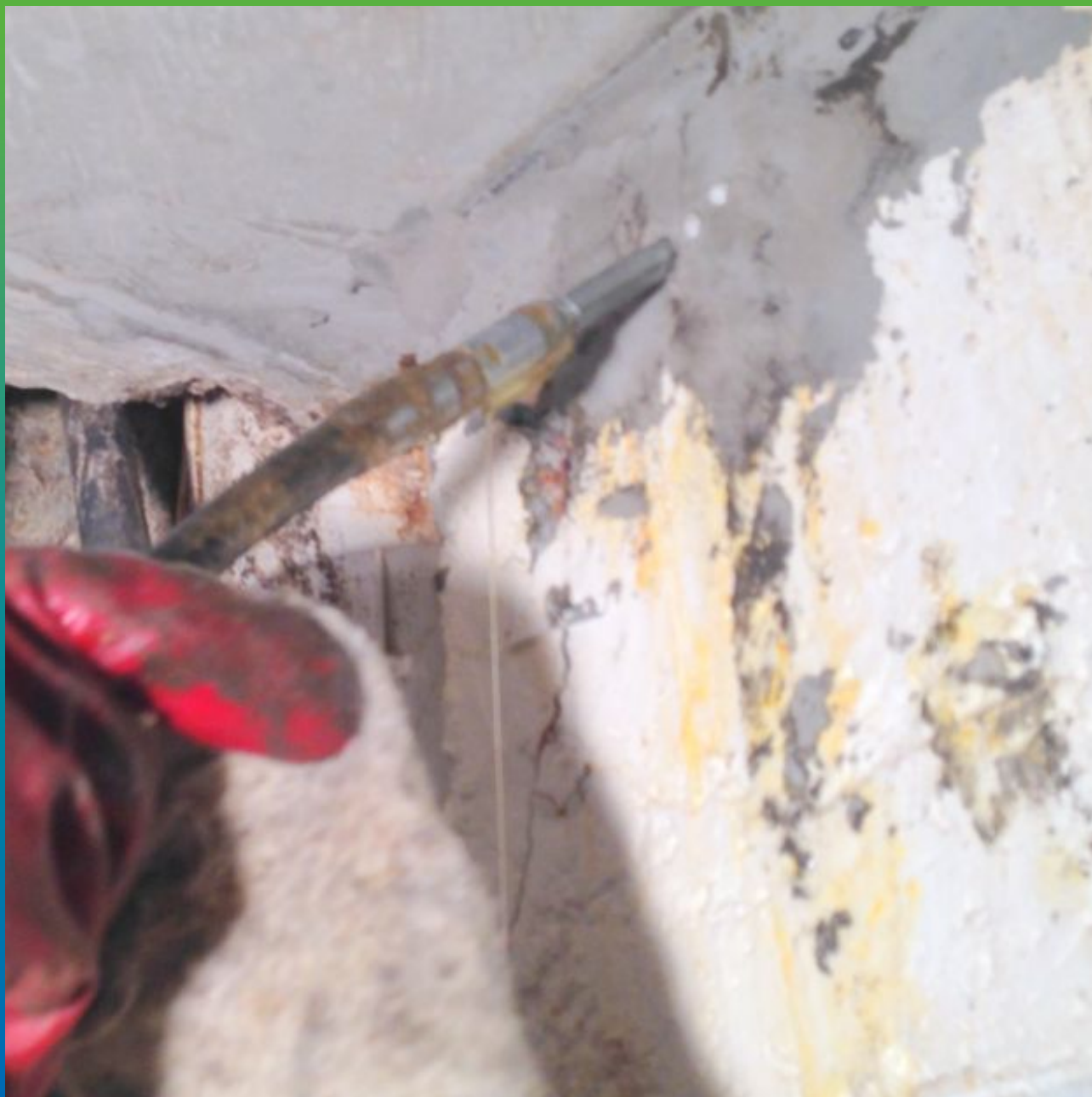
Процесс прокачки пакеров 1К ПУ смолой. Частный вид.