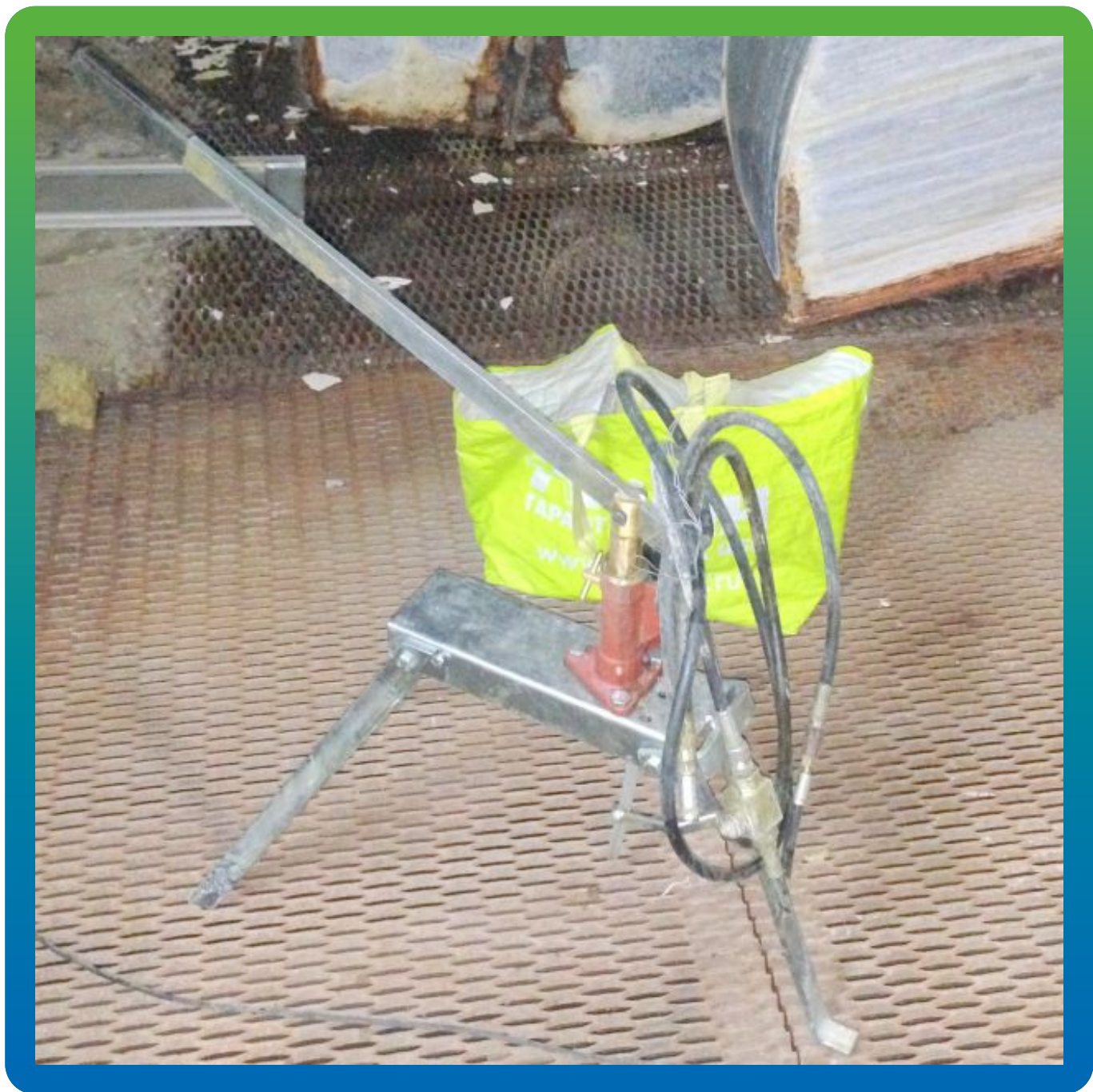
Профессиональный ручной насос БМ 0303 на объекте.