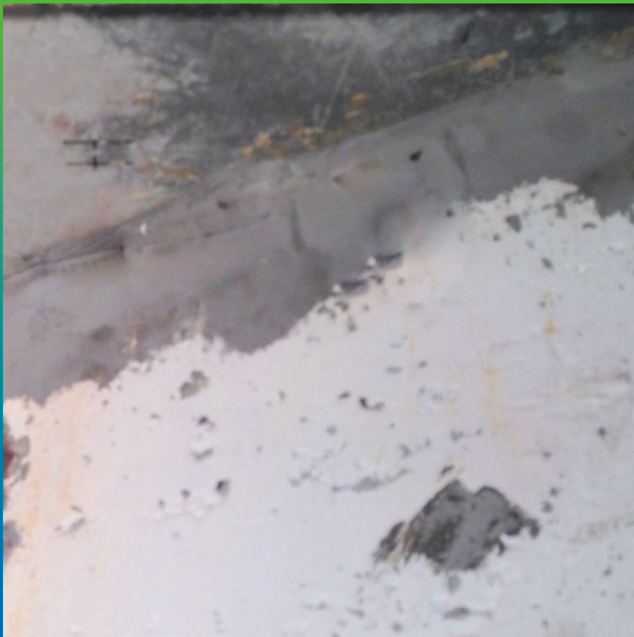
Демонтаж пакеров и заделка отверстий ремонтными смесями.