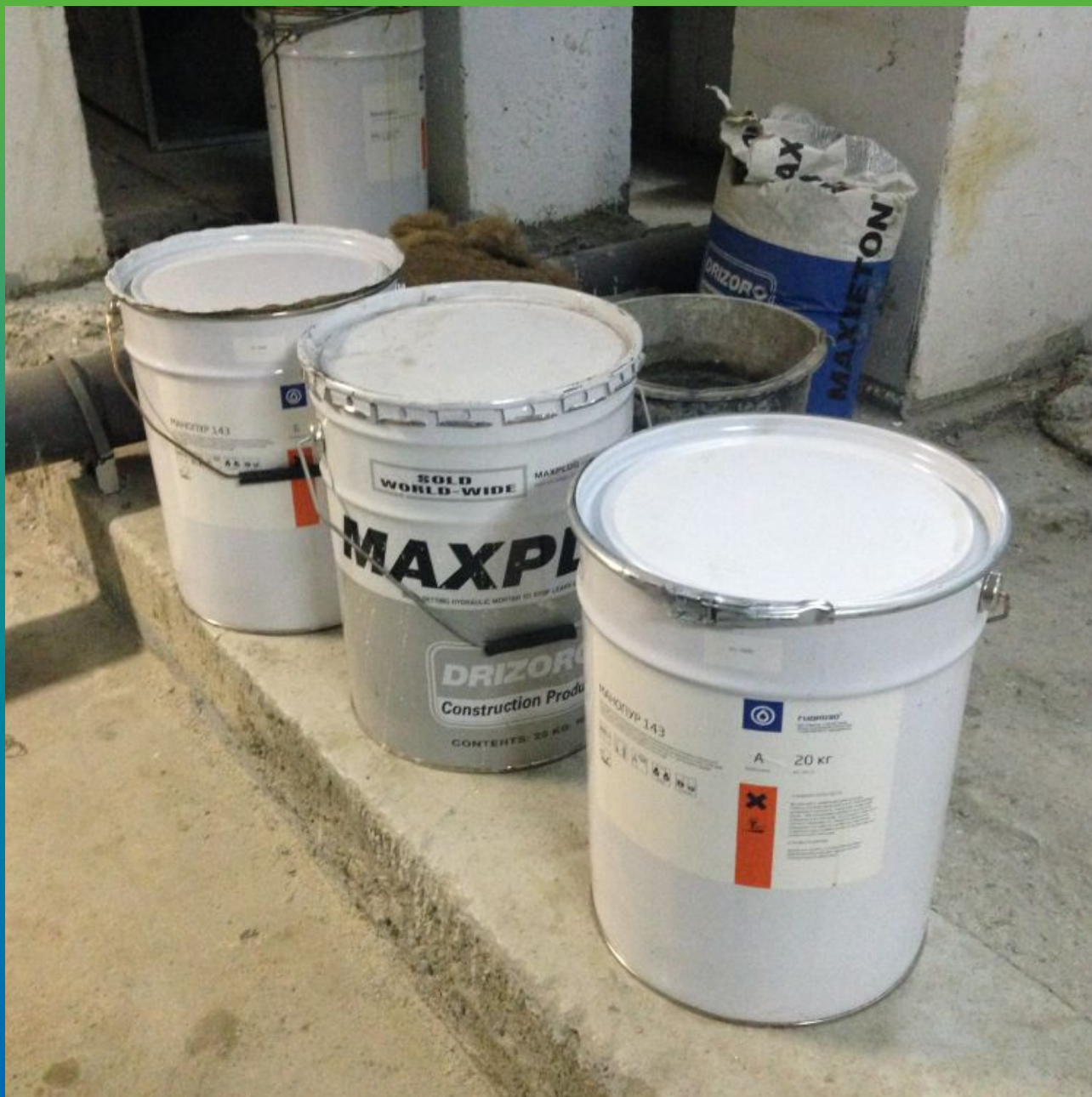
Материалы на объекте. Манопур С + Манопур 143, Максбетон и Максплаг.