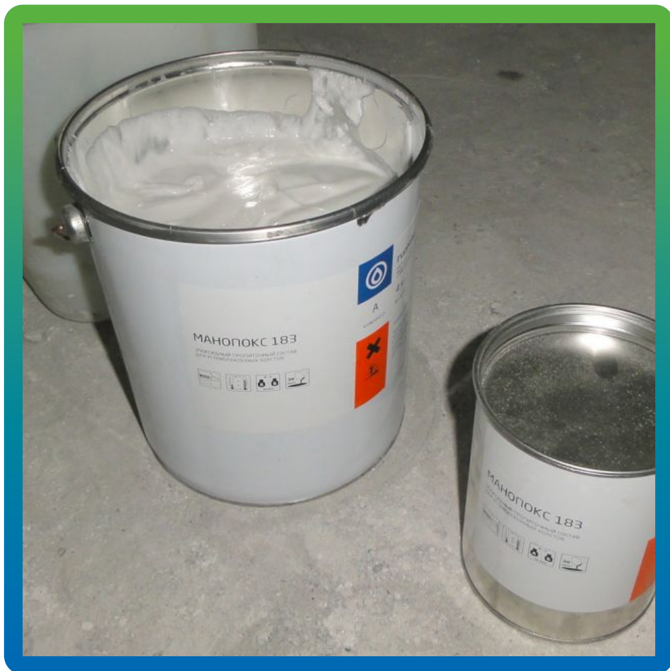
Материалы ГИДРОЗО на объекте. Наполненный клей Манопокс 183.