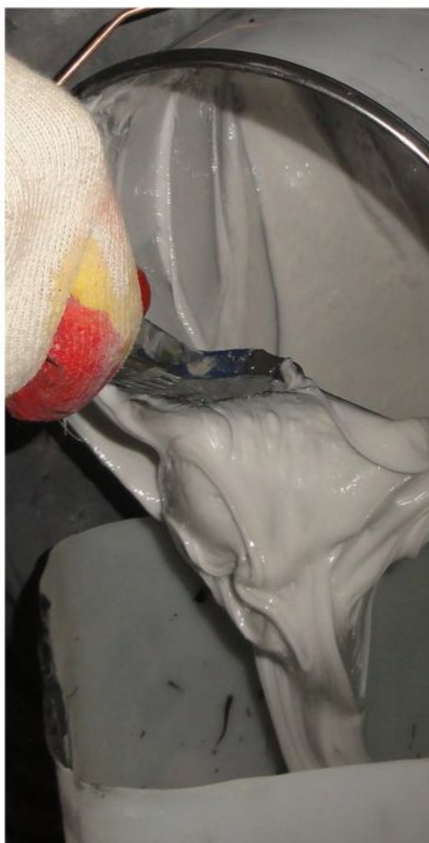
Смешивание Компонентов А+Б Манопокс 183.