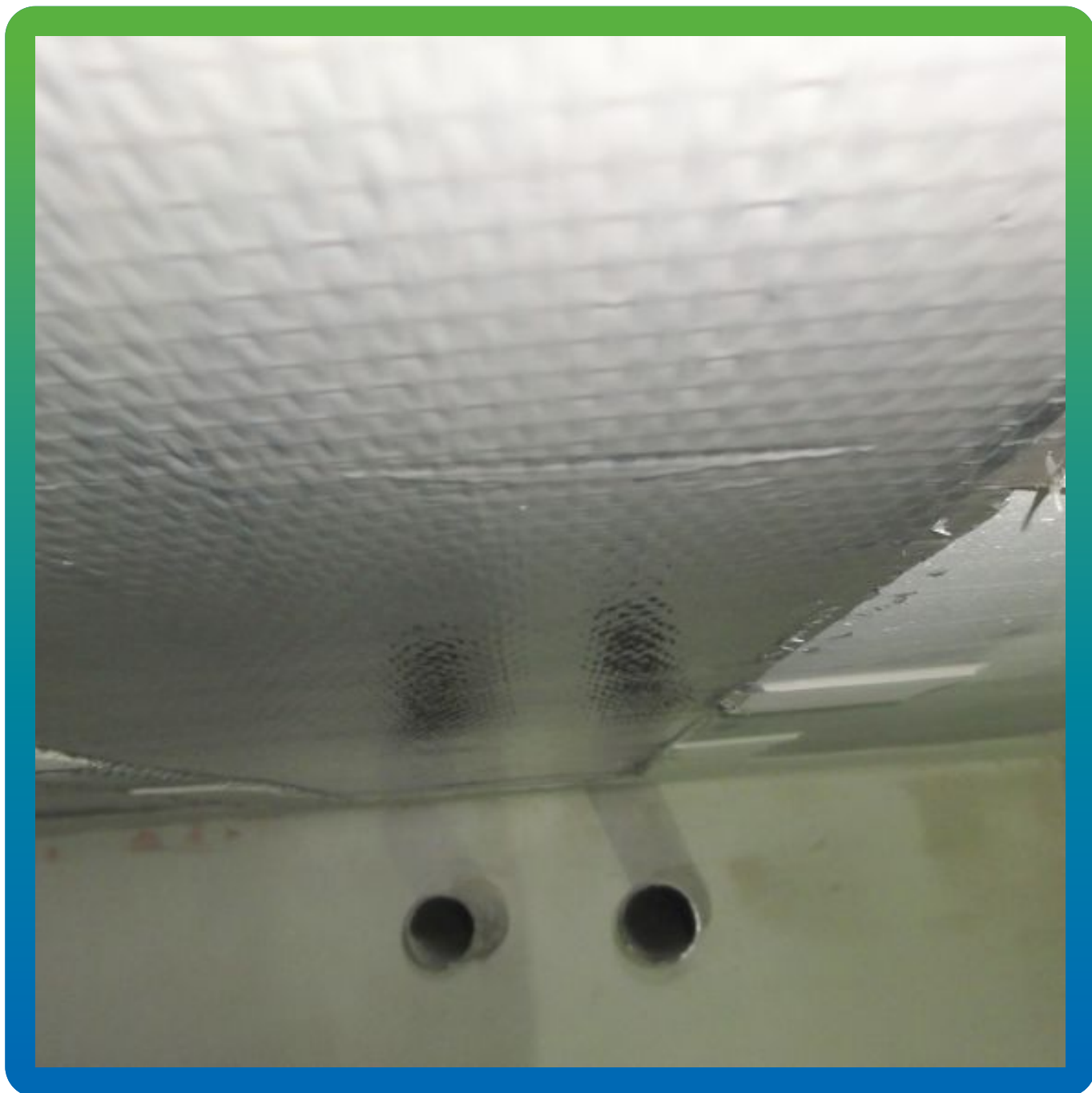
Частный вид смонтированной системы внешнего армирования ФАП с клеем Манопокс 183.