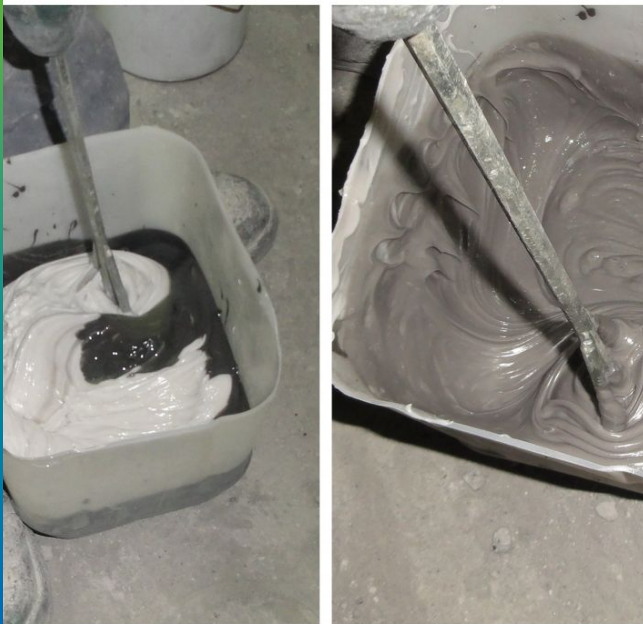
Процесс смешивания компонентов Манопокс 183 до однородной массы.