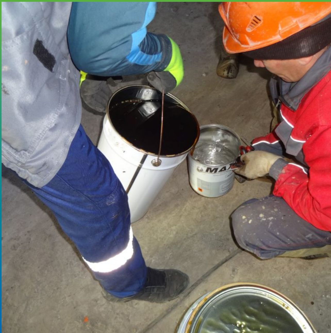
Затворение компонентов А+В Манопур 15