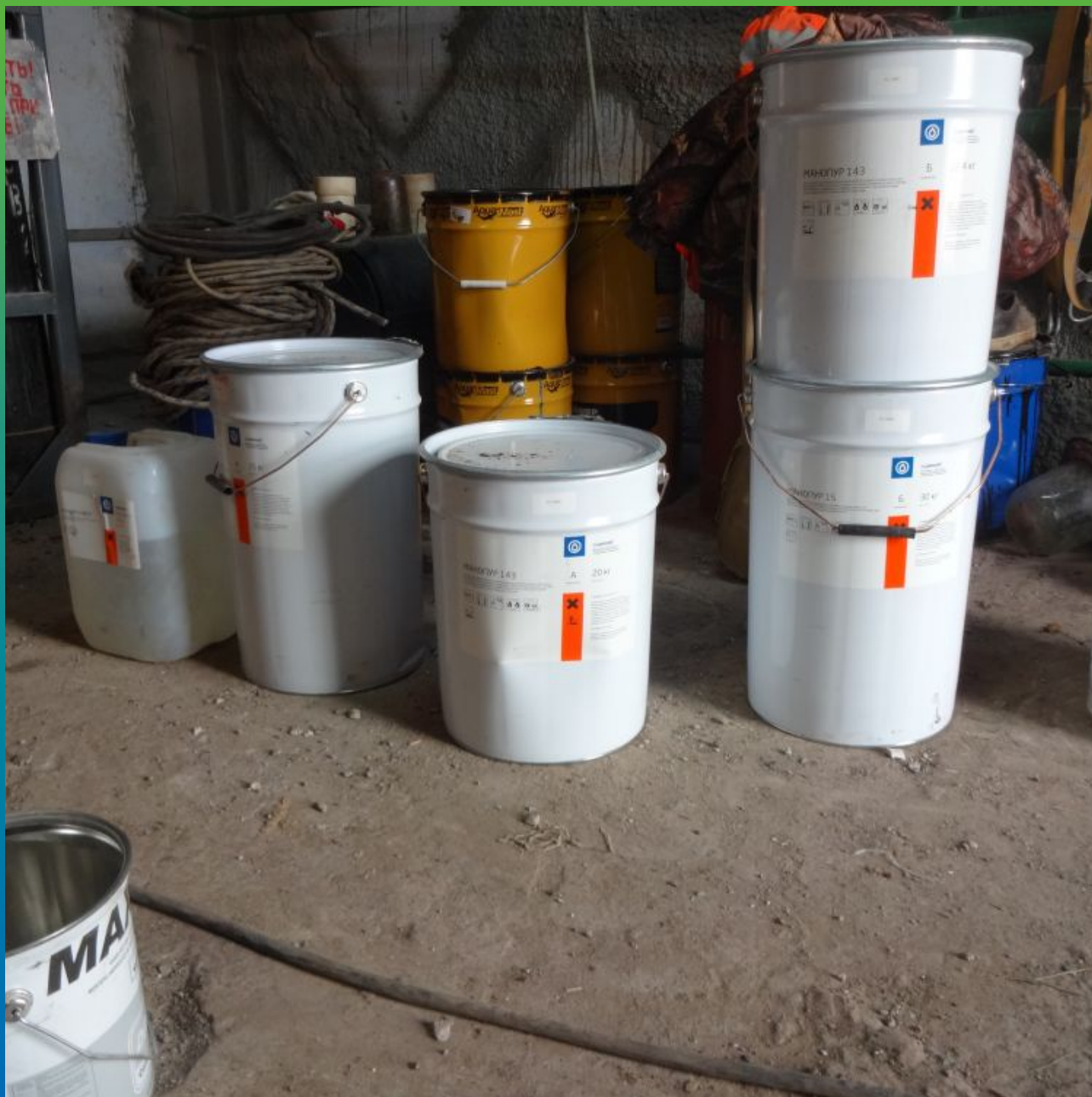
Материалы "Гидрозо" на объекте