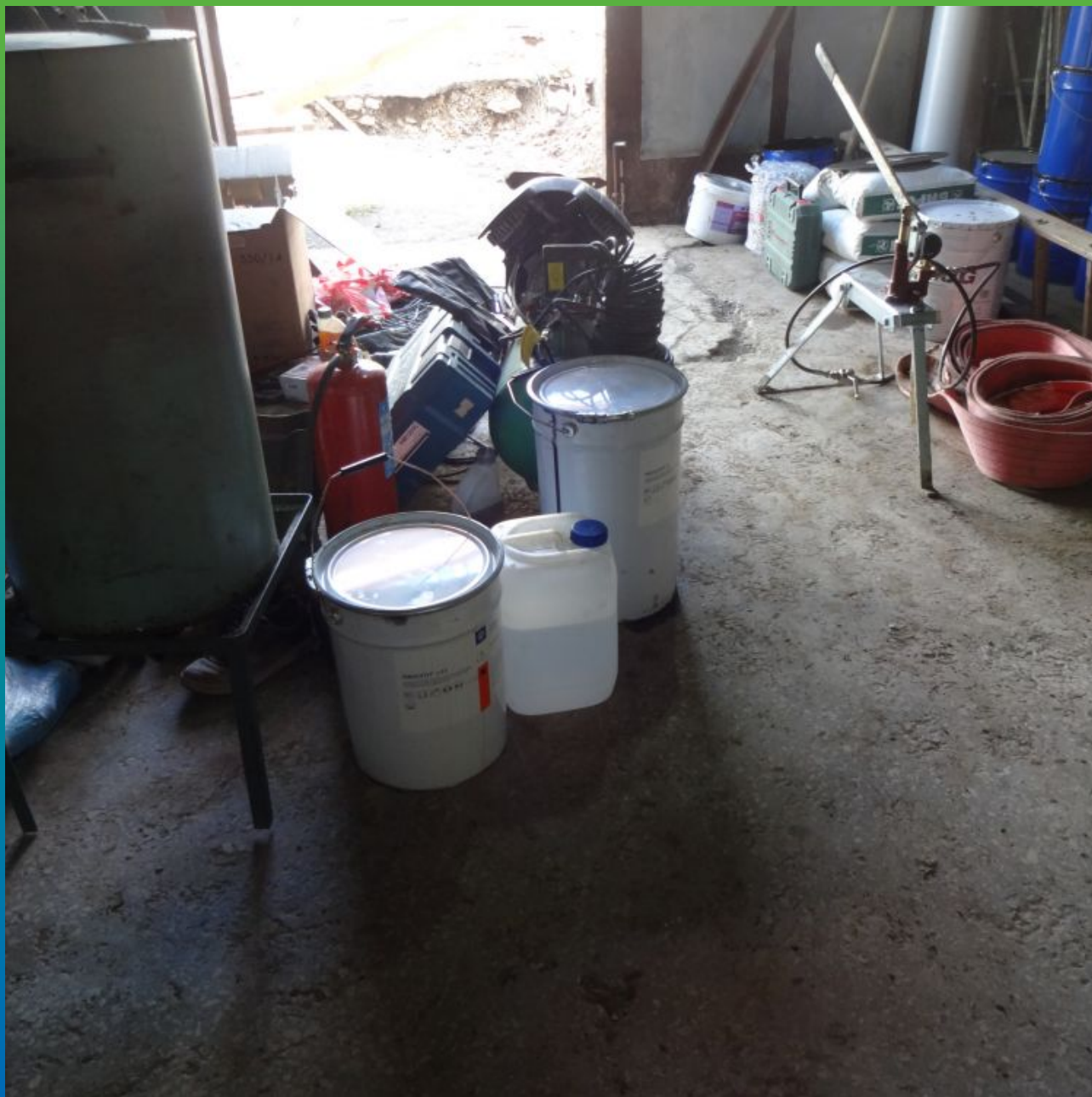
Материалы "Гидрозо" на объекте