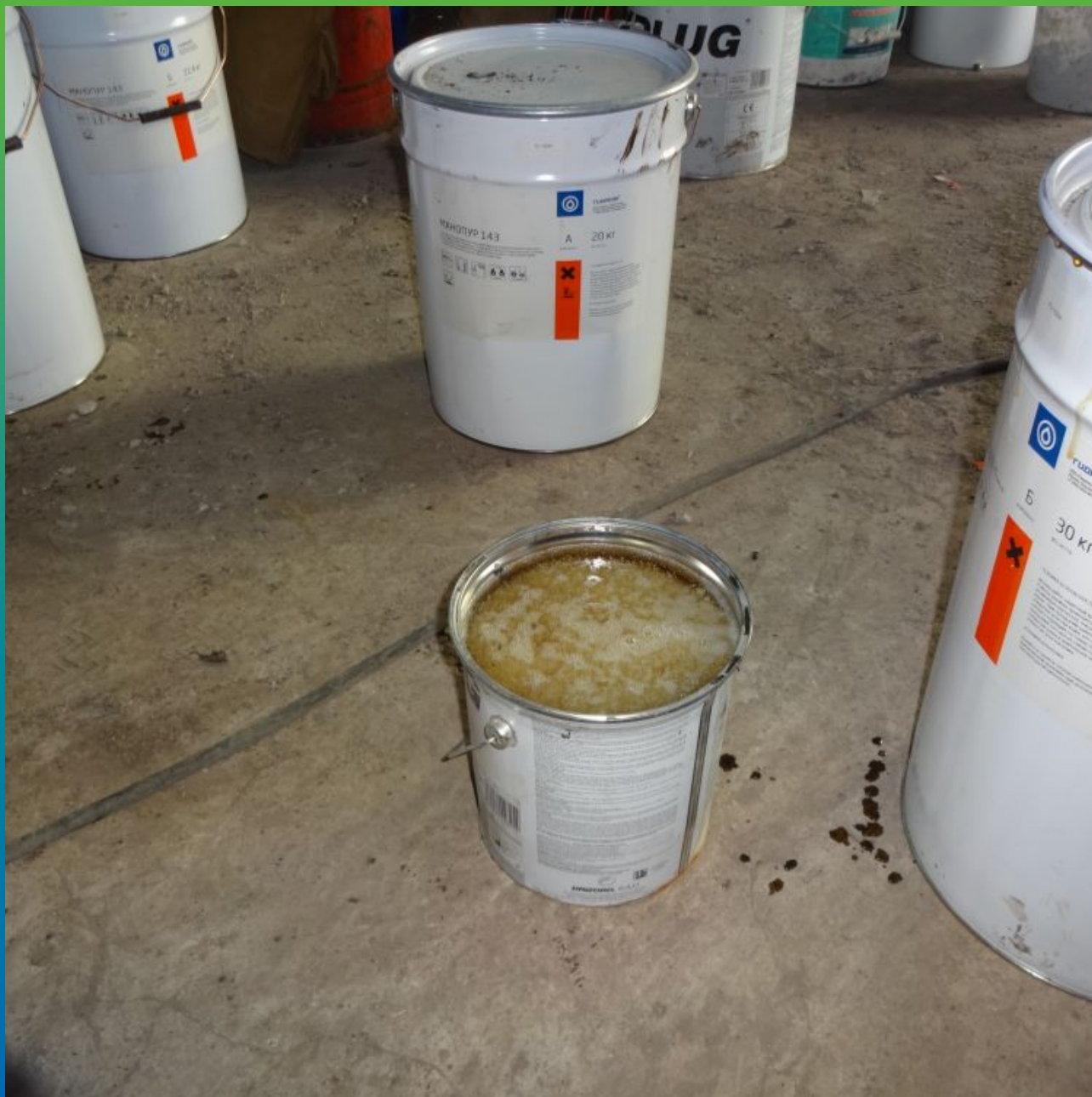
Готовый к инъектированию Манопур 15