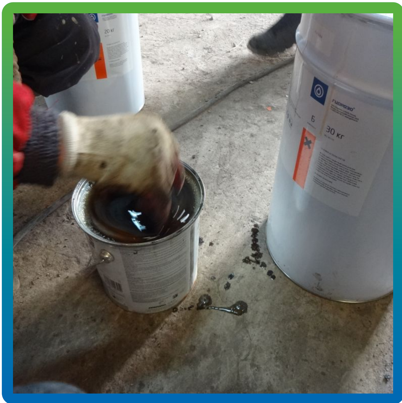
Перемешивание компонентов между собой