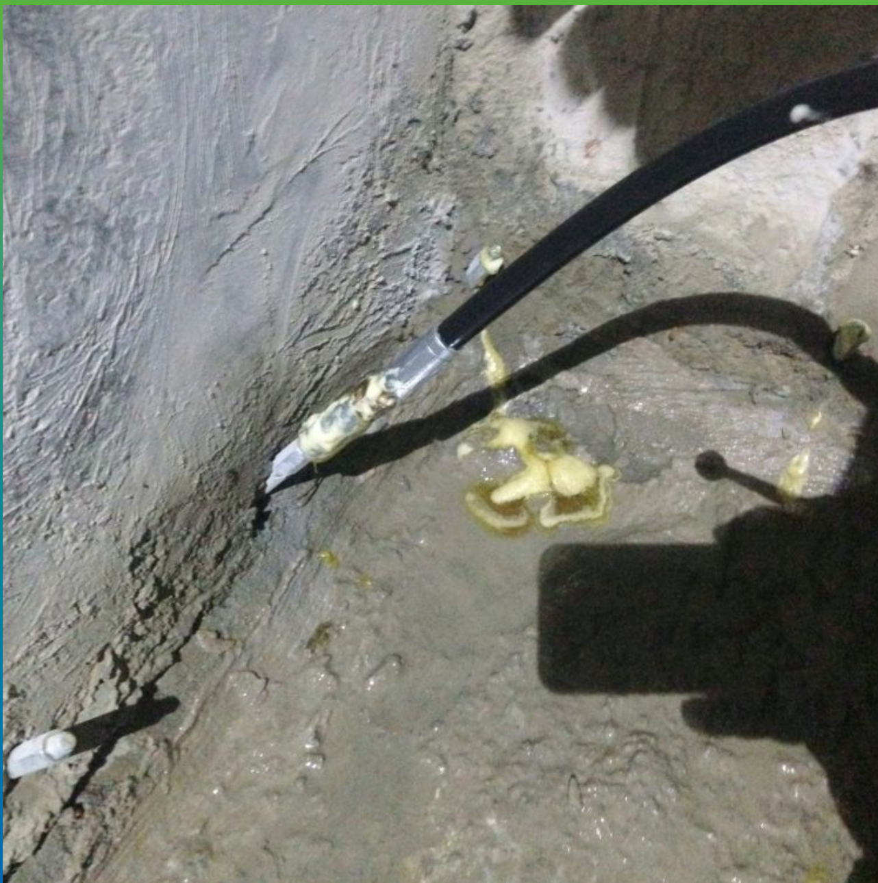
Процесс инъектирования Манопур 15