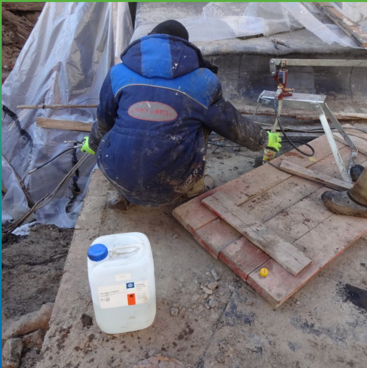
Промывка оборудования после проведенных инъекционных работ