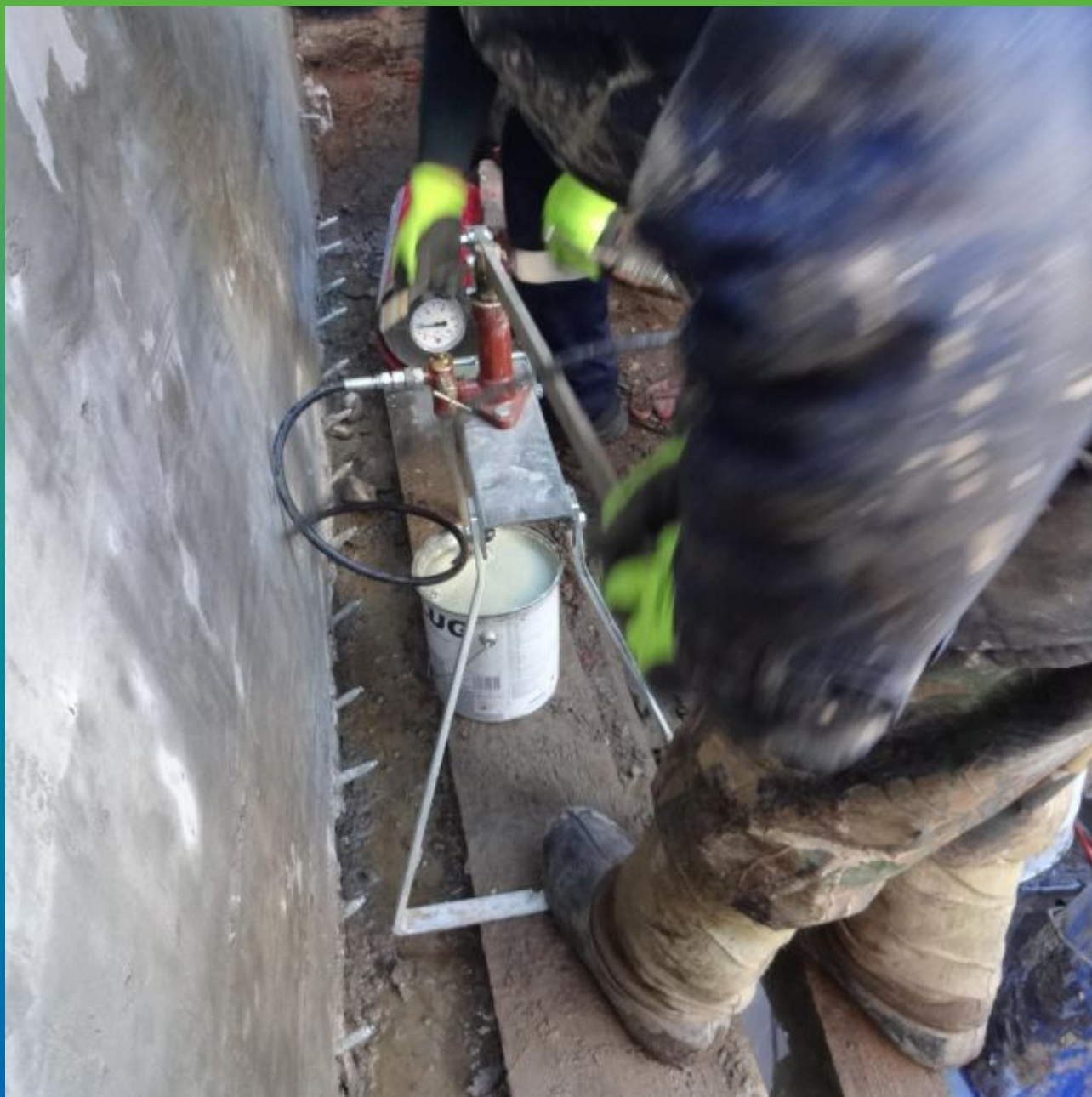
Процесс инъектирования Манопур 15