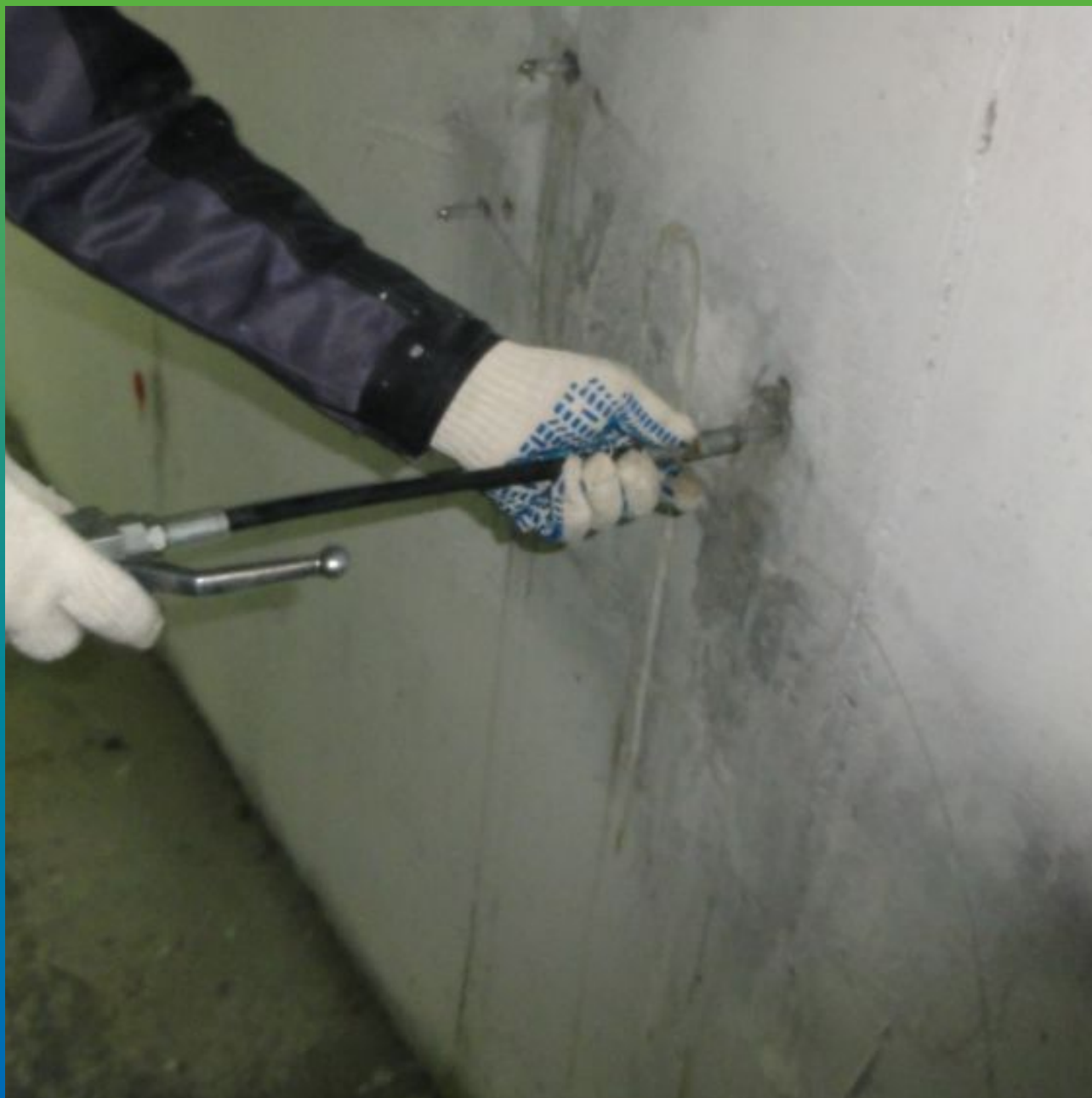
Процесс инъектирования гидроактивной полиуретановой композиции Манопур С