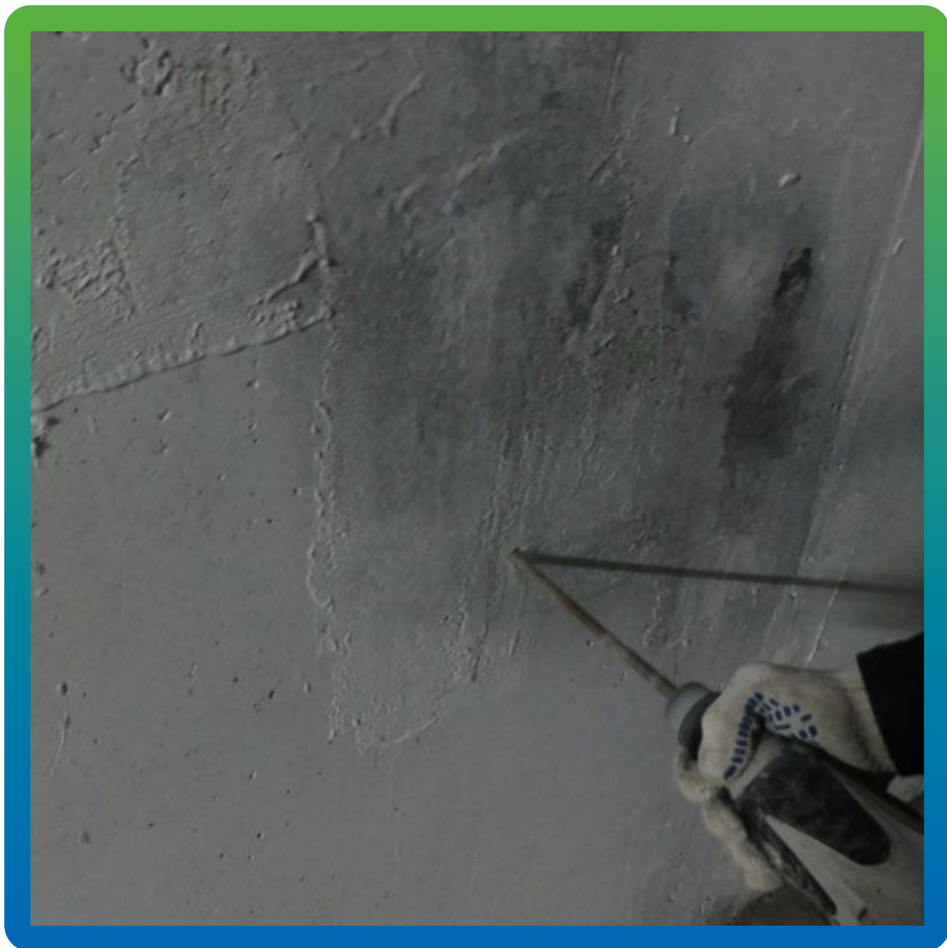
Бурение шпуров для установки пакеров