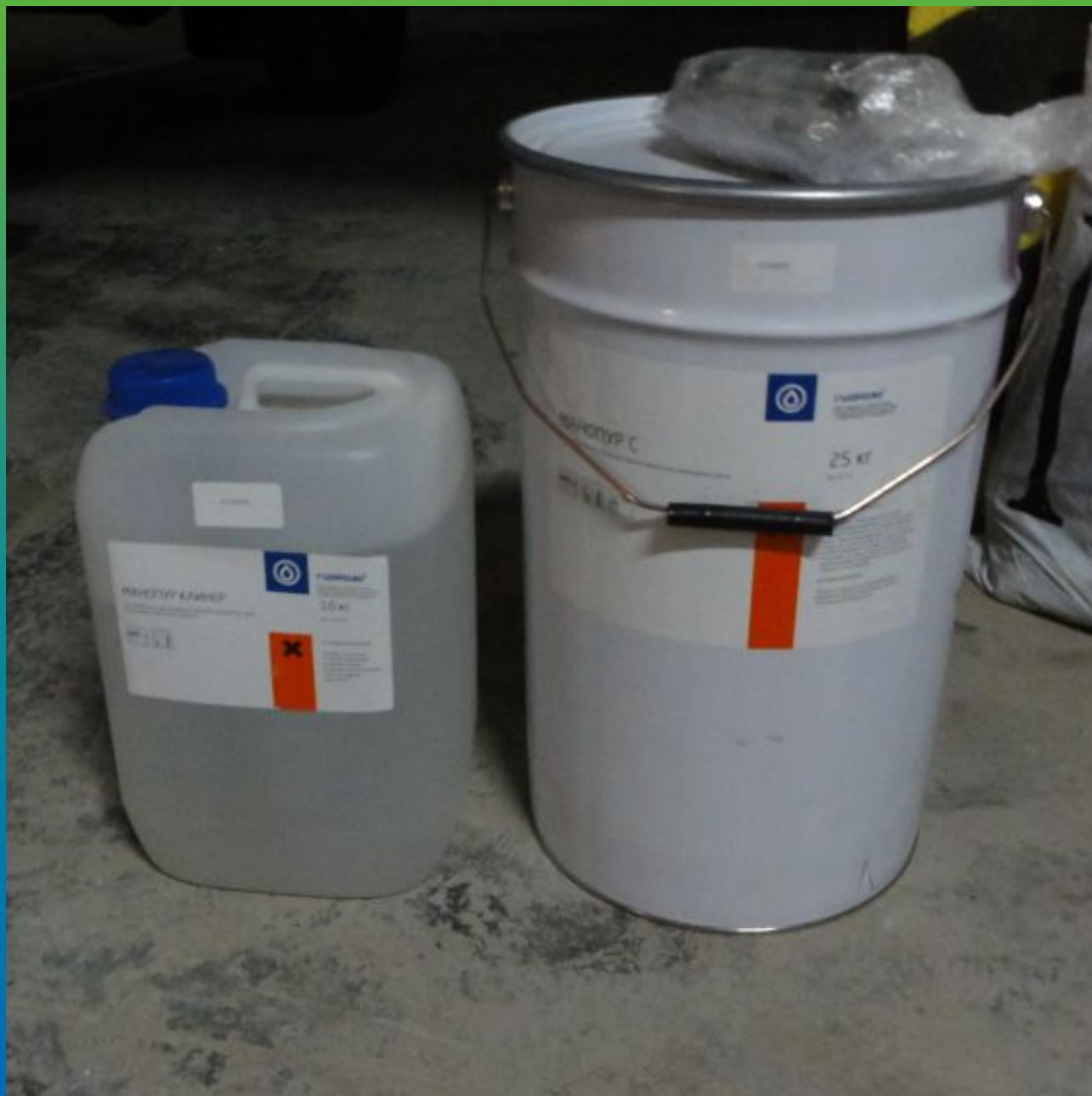
Вид материалов на объекте