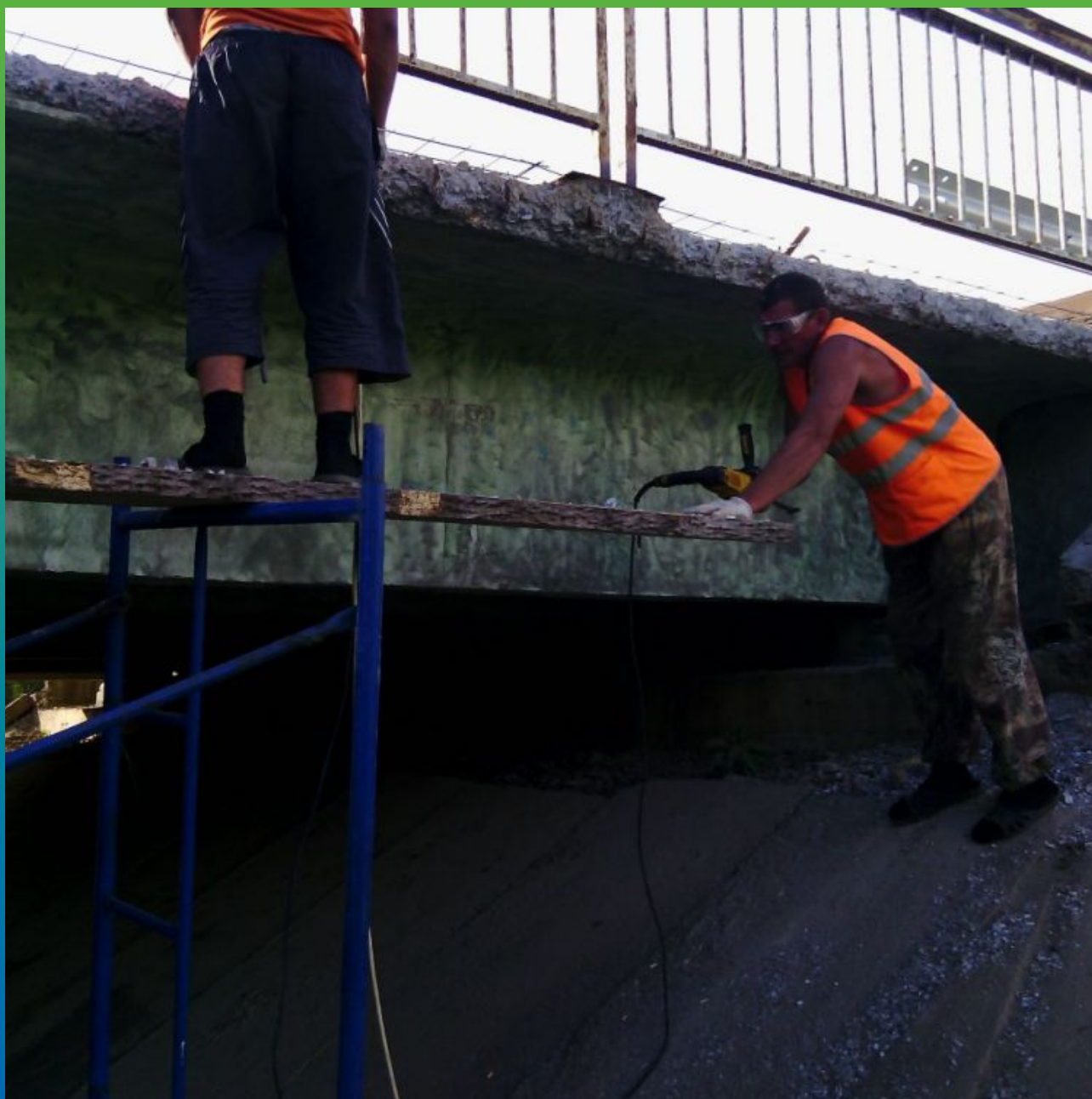
Шлифовка пролета моста для нанесения проникающей гидроизоляции Максил Супер