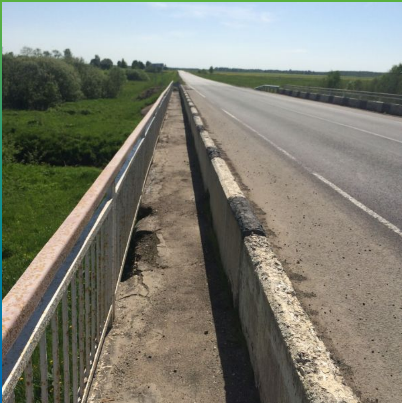
Разрушенная пешеходная дорожка моста