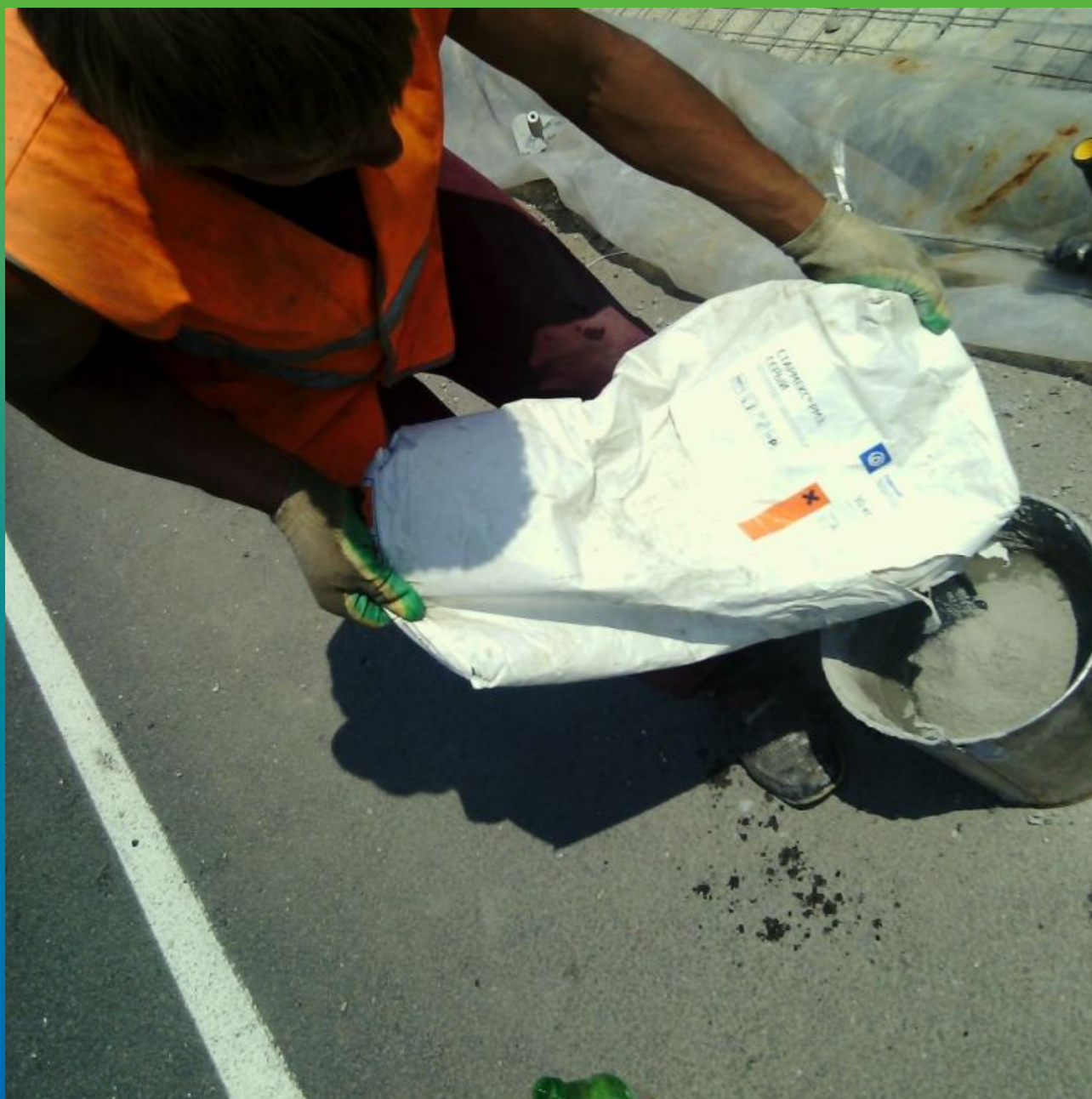
Подготовка состава Стармекс РМЗ для локального ремонта