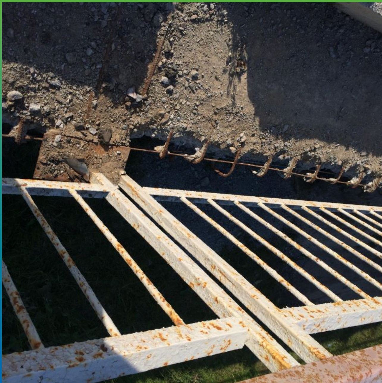
Разрушенная пешеходная дорожка моста