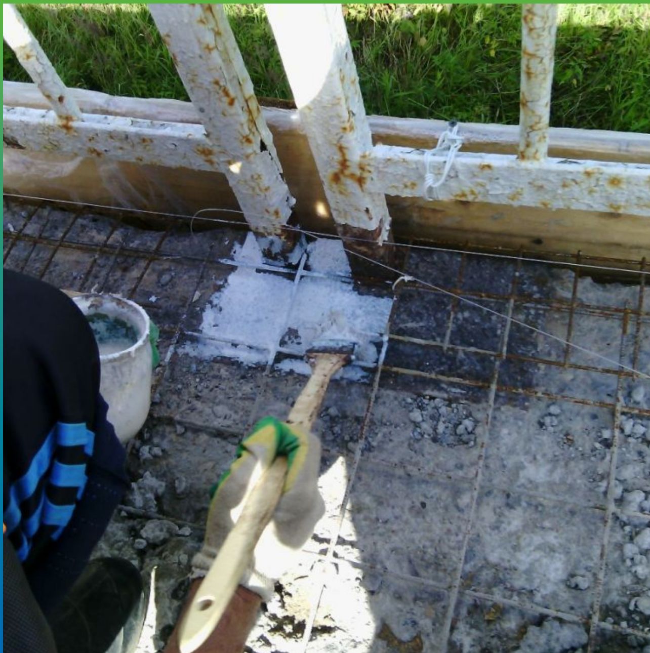
Обработка металлических элементов пассиватором коррозии Макрест Пассив