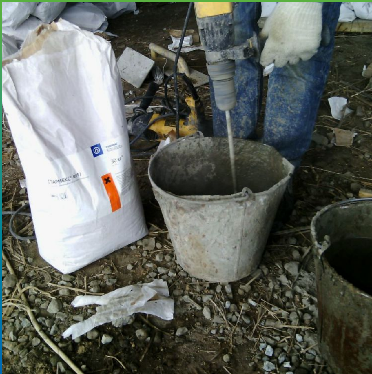
Затворение подливочного состава Стармекс ФМ7