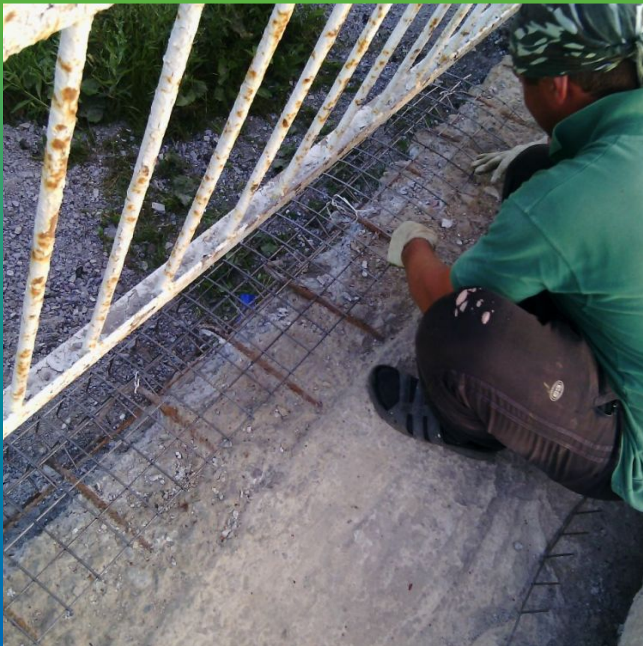
Устройство дополнительного армирования