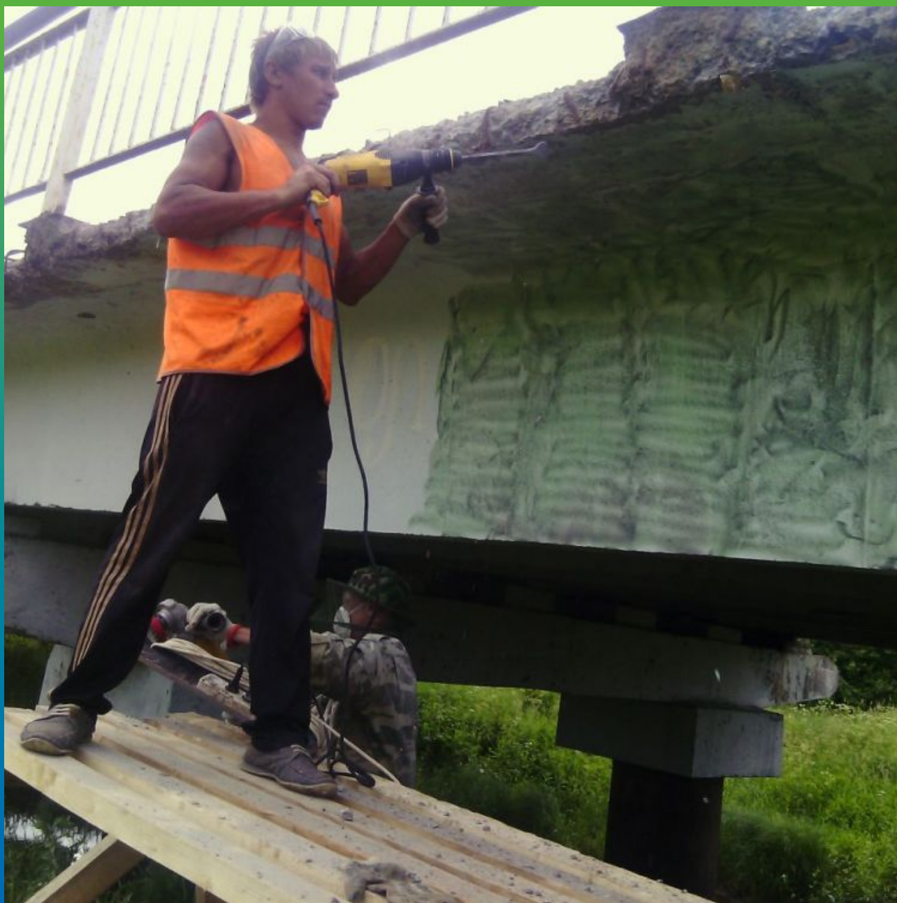
Удаление непрочных частей бетона