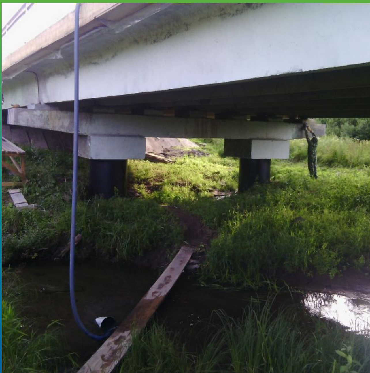
Максил Супер, нанесенный на пролет моста