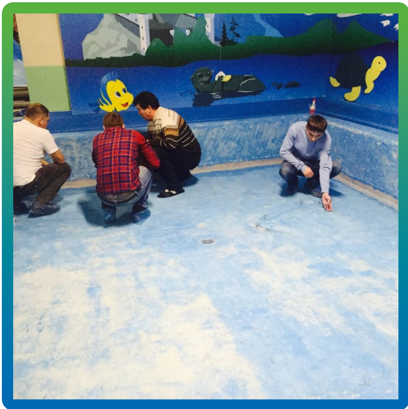
Бассейн после снятия предыдущего эпоксидного покрытия