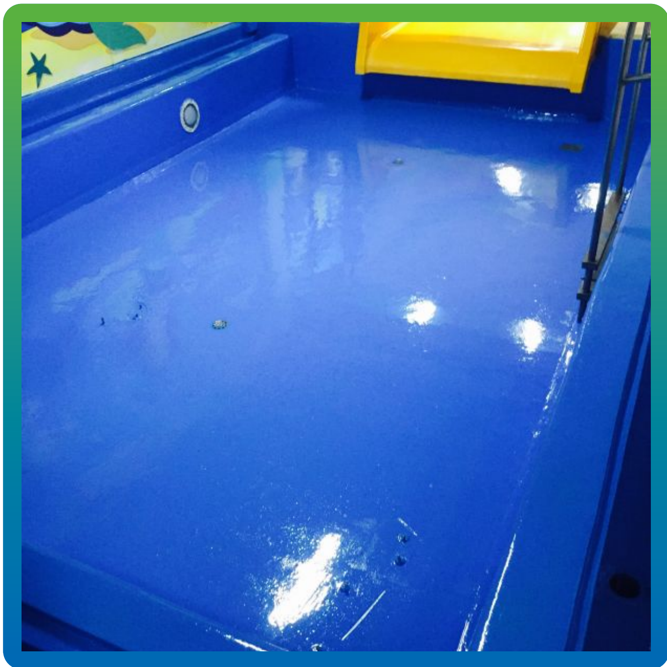
Бассейн с покрытием Денстоп ЭП 201 в 2 слоя