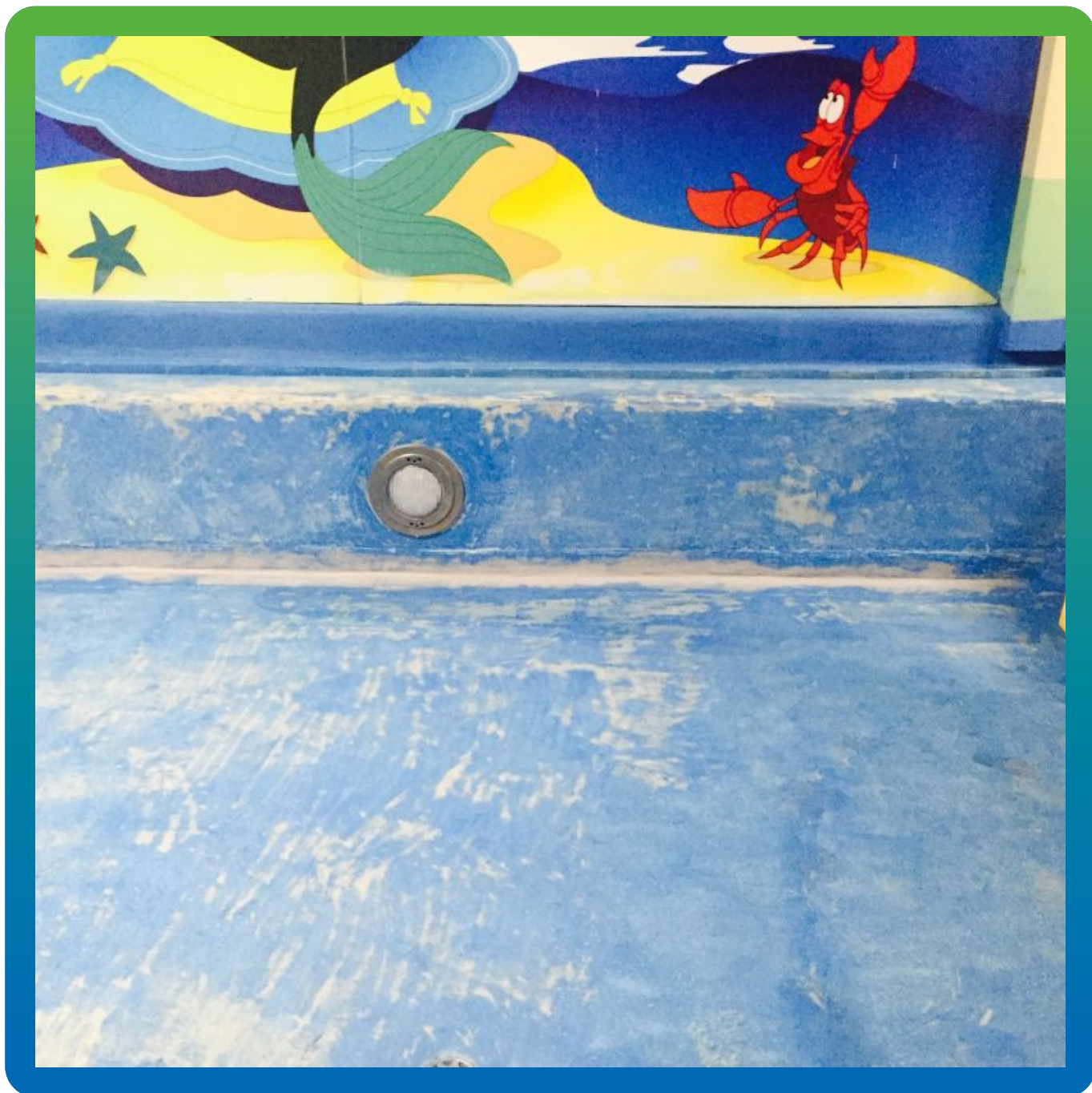
Бассейн после снятия предыдущего эпоксидного покрытия