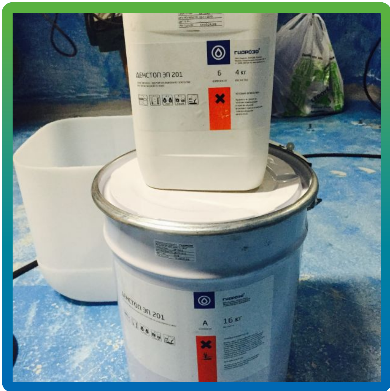
Материал на объекте