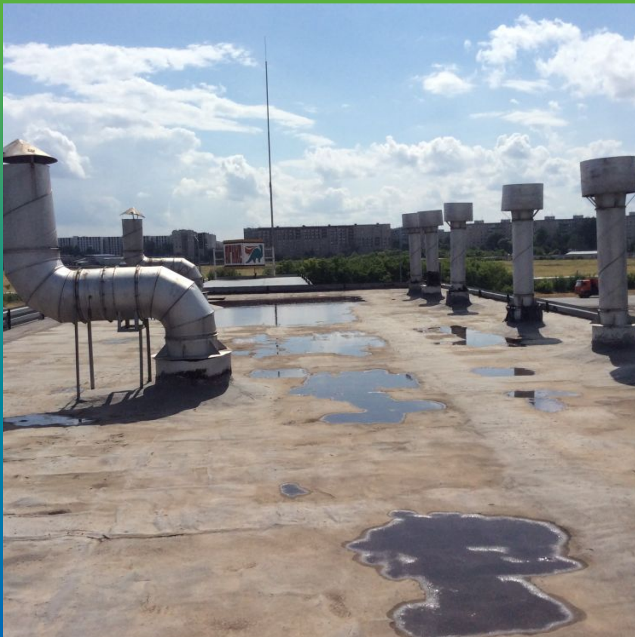
Первоначальный вид кровли