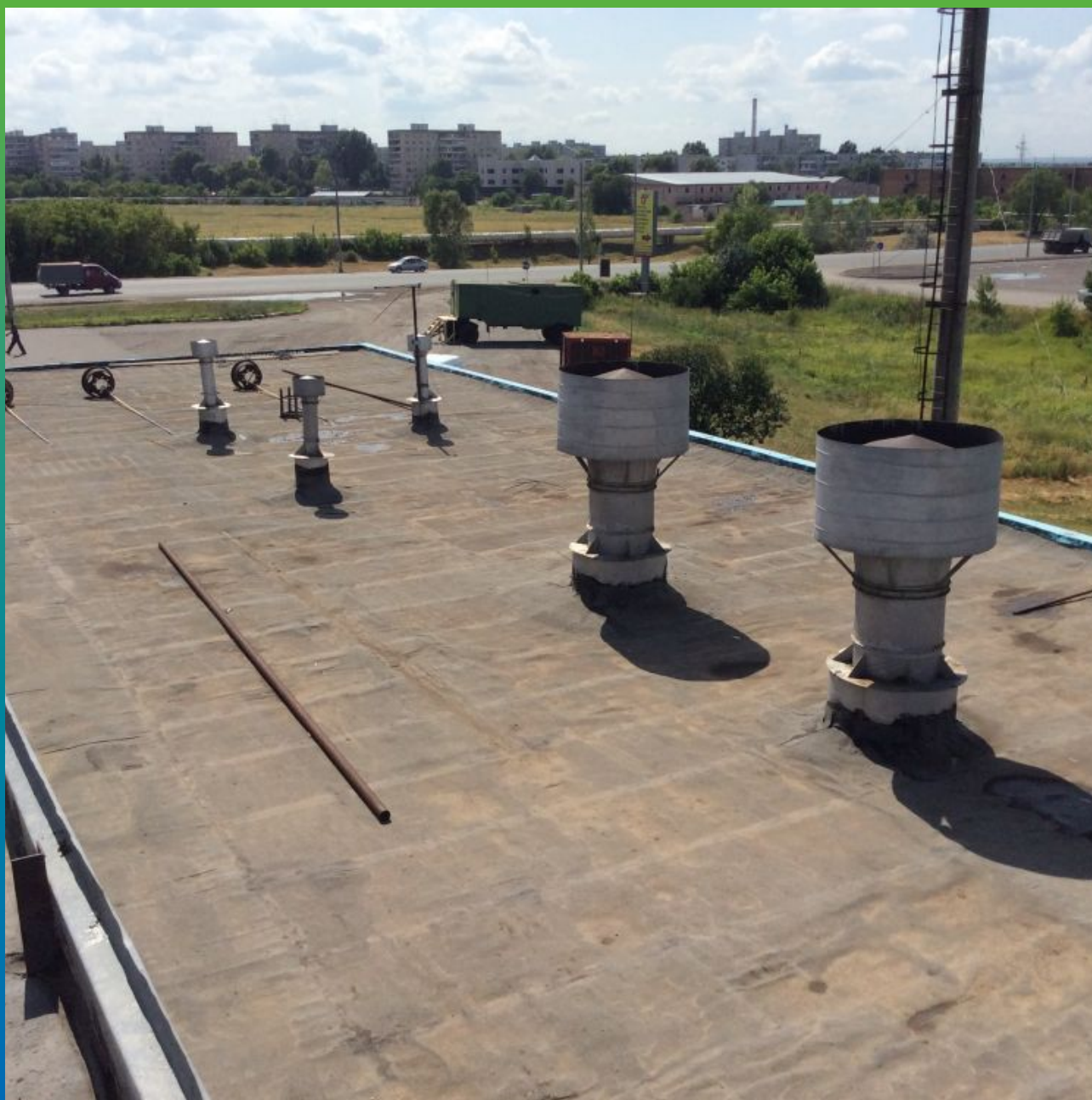
Первоначальный вид кровли