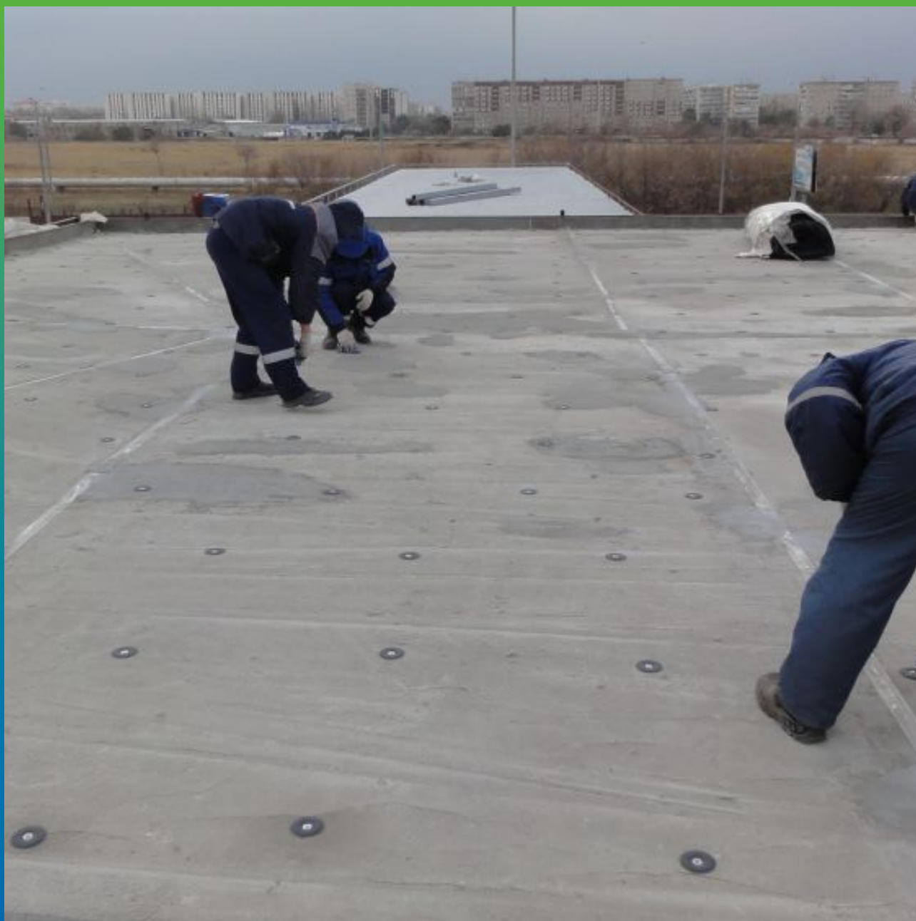
Очистка шайб центрикс перед укладкой ЭПДМ мембраны