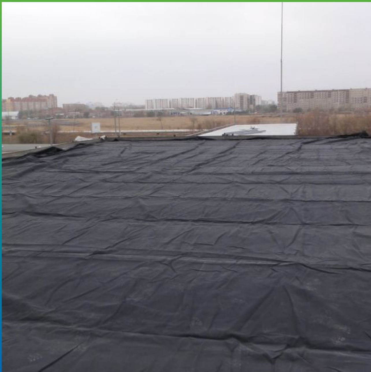
Вид растянутого полотна ЭПДМ