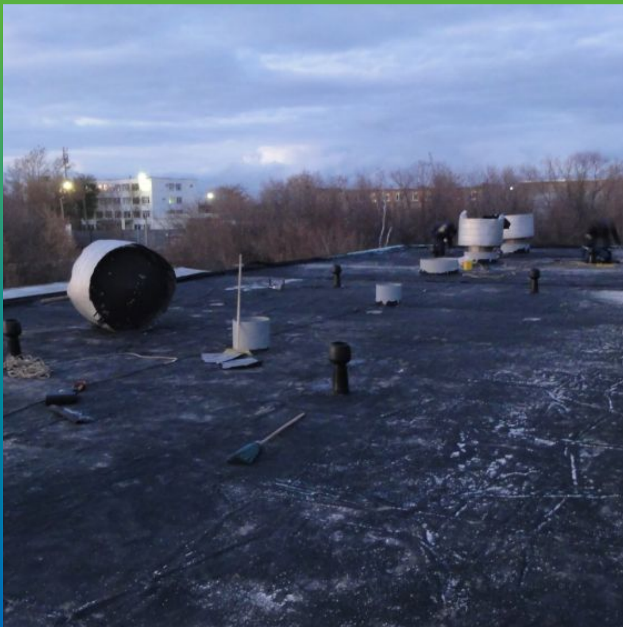
Финальный вид кровли