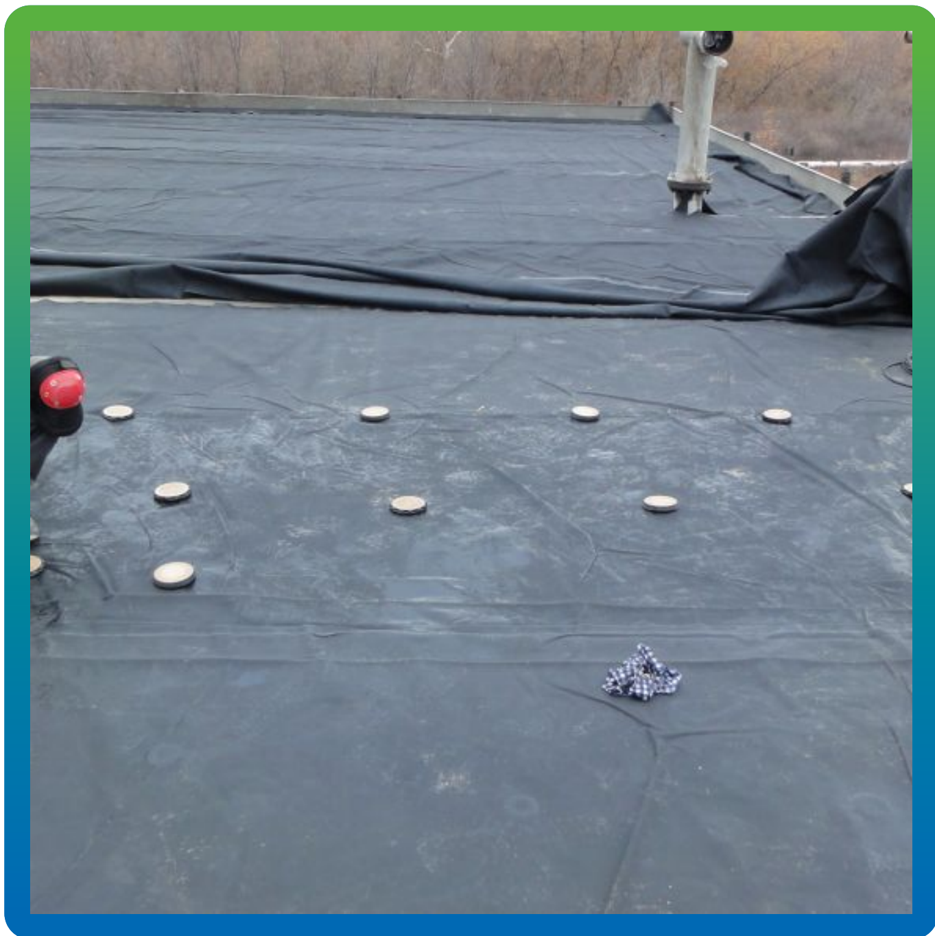
Крепление ЭПДМ мембраны по системе Центрикс