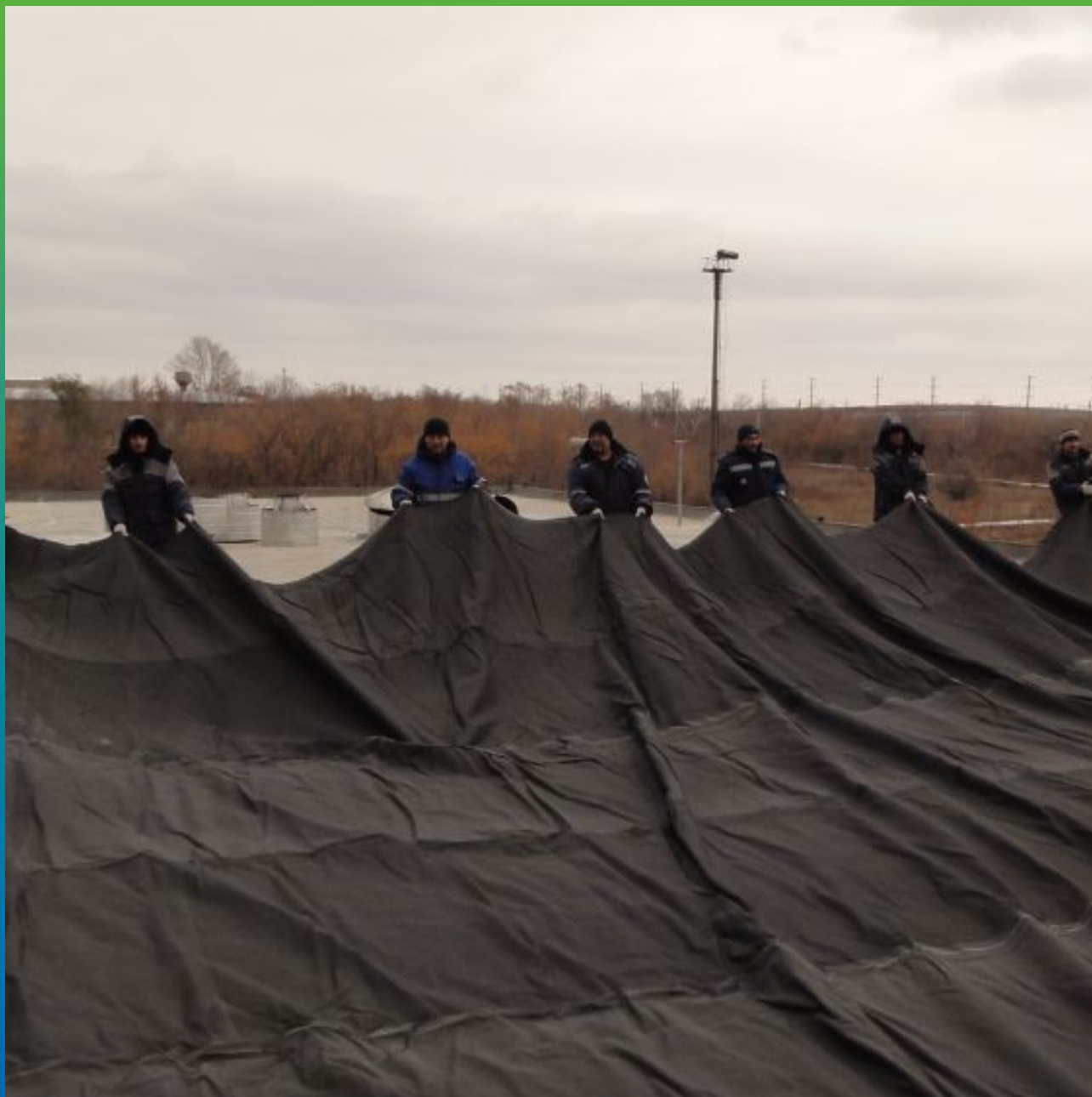
Укладка ЭПДМ мембраны Прелести СТ 1.2 мм