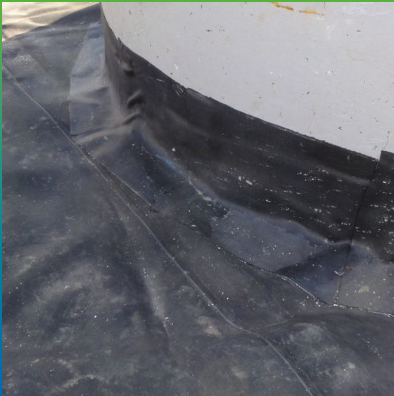
Устройство герметизации вывода коммуникаций с помощью ленты Термобонд