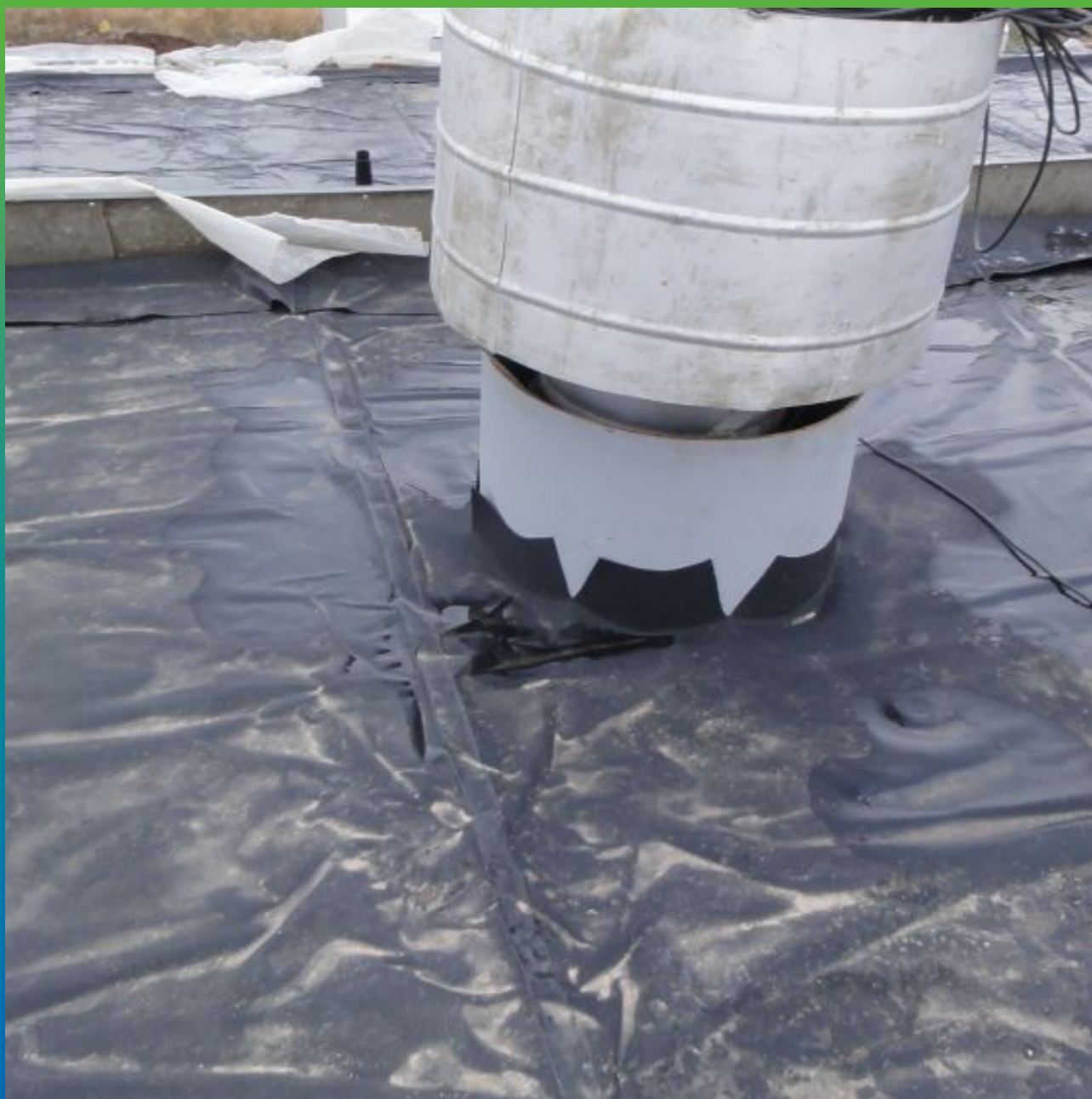
Устройство вывода коммуникаций