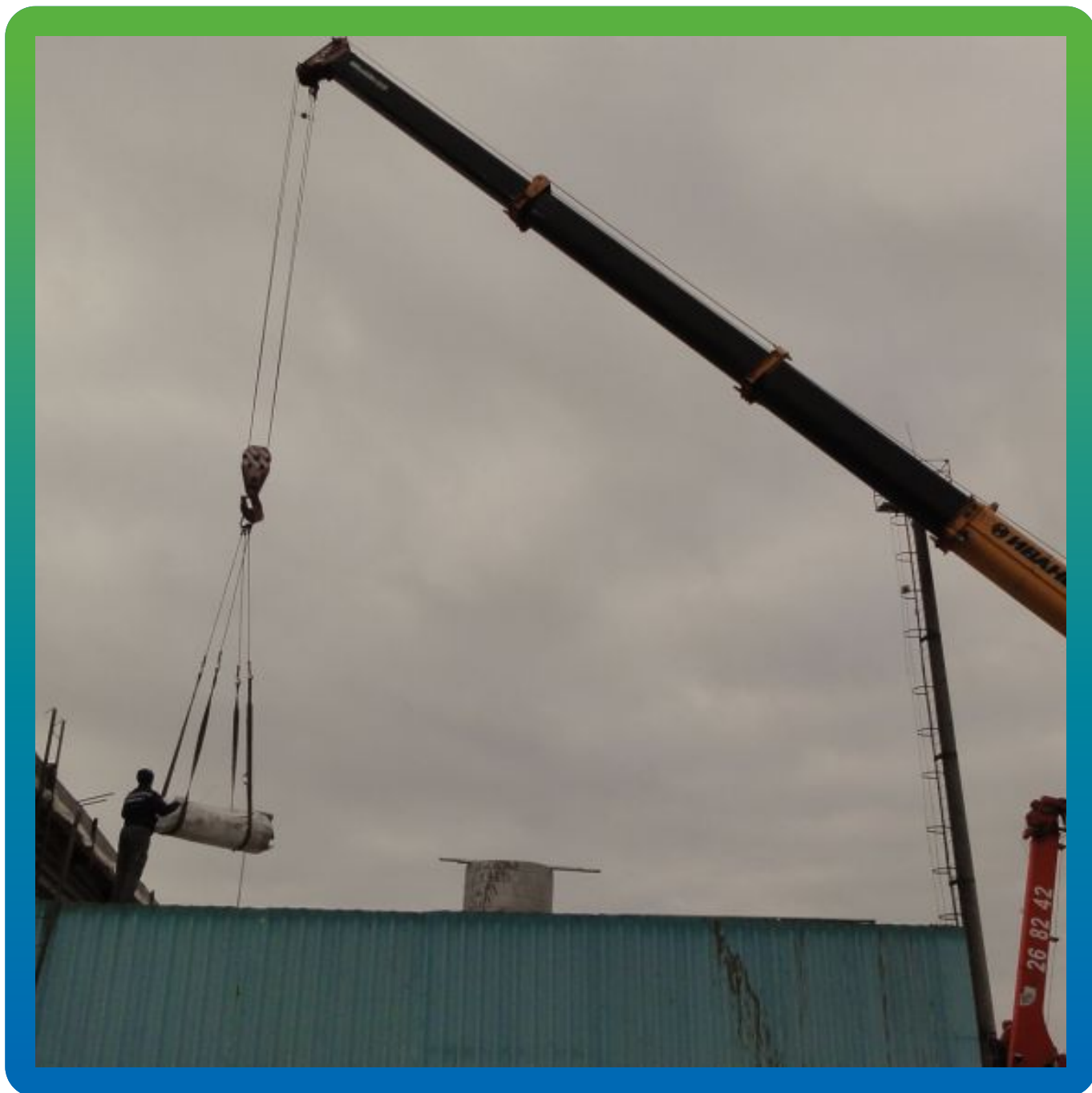
Подъем полотна ЭПДМ мембраны Прелести СТ 1.2 мм на кровлю