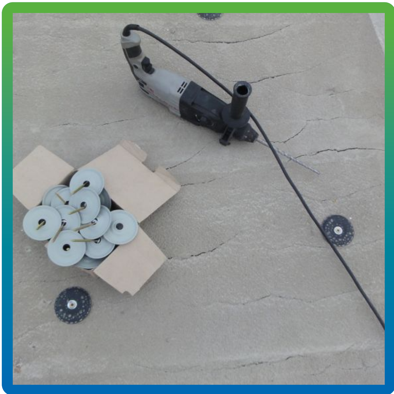
Установка шайб Центрикс