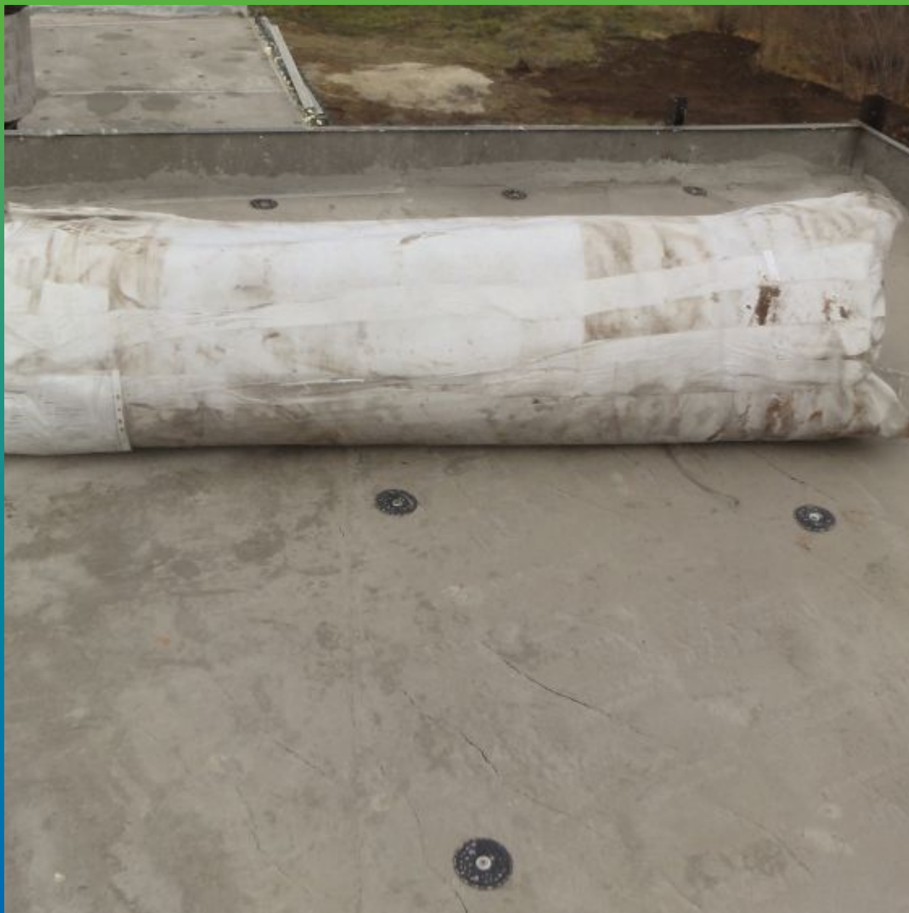
Полотно ЭПДМ мембарны в сложенном виде