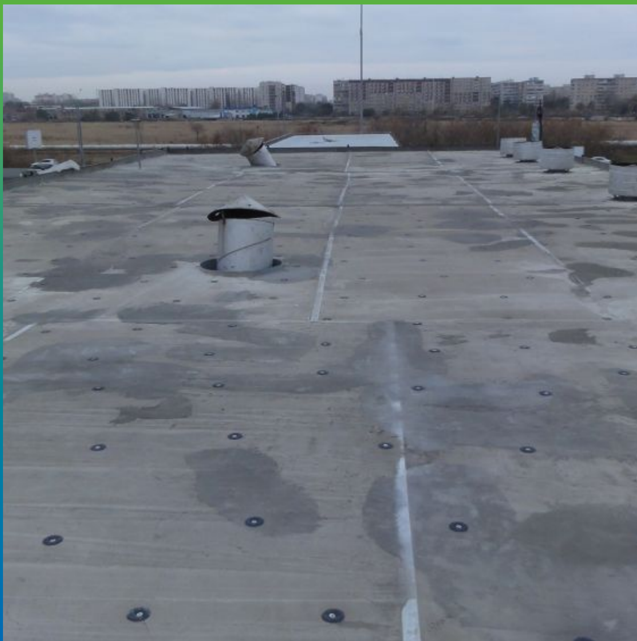
Вид подготовленной кровли