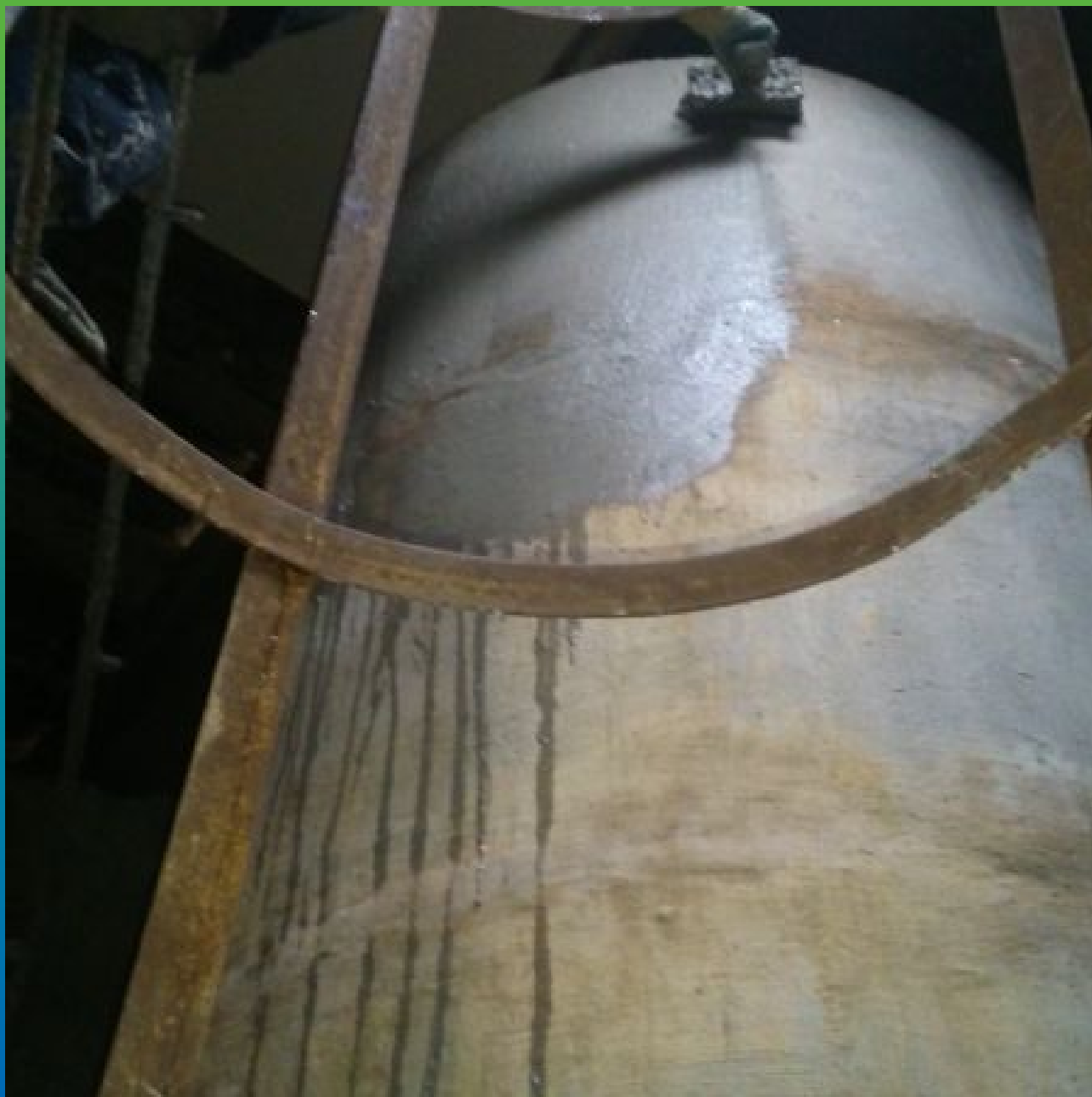
Нанесение Макссил Супер