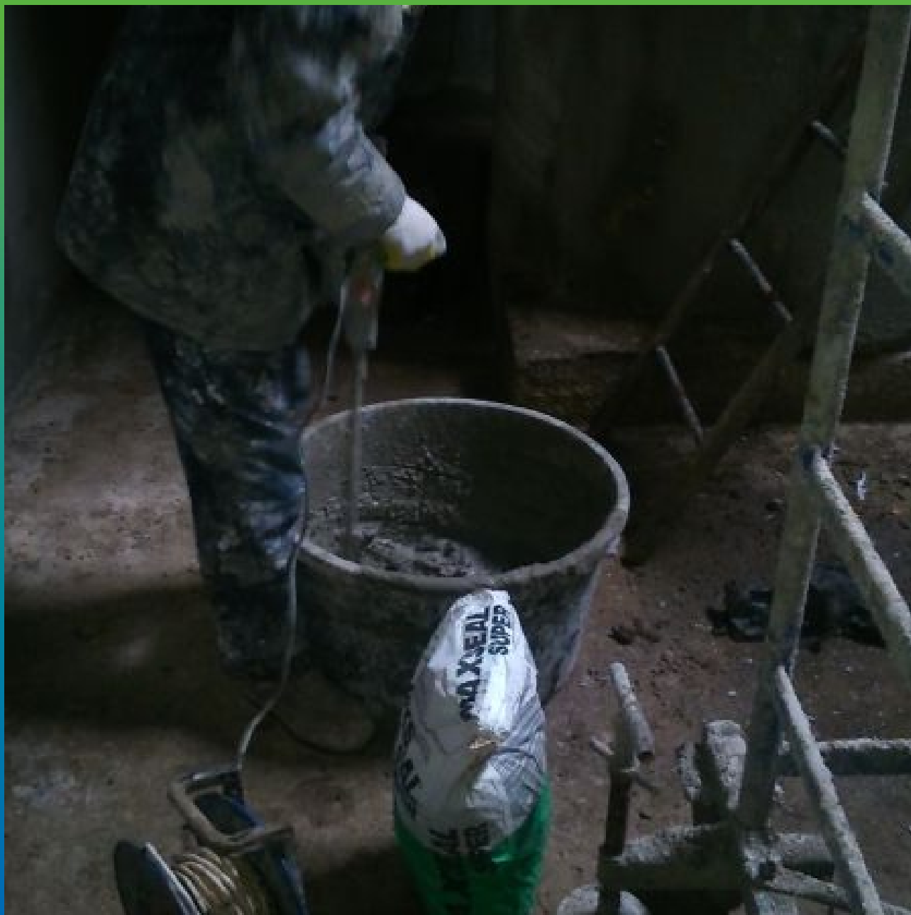
Приготовление материала Максил Супер