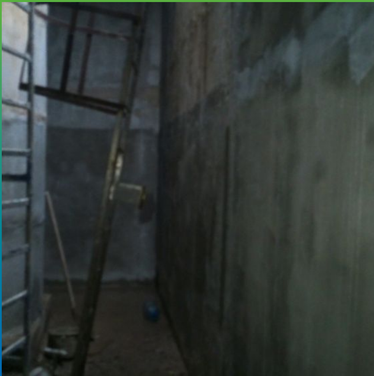
Конечный вид после нанесения Макссил Супер