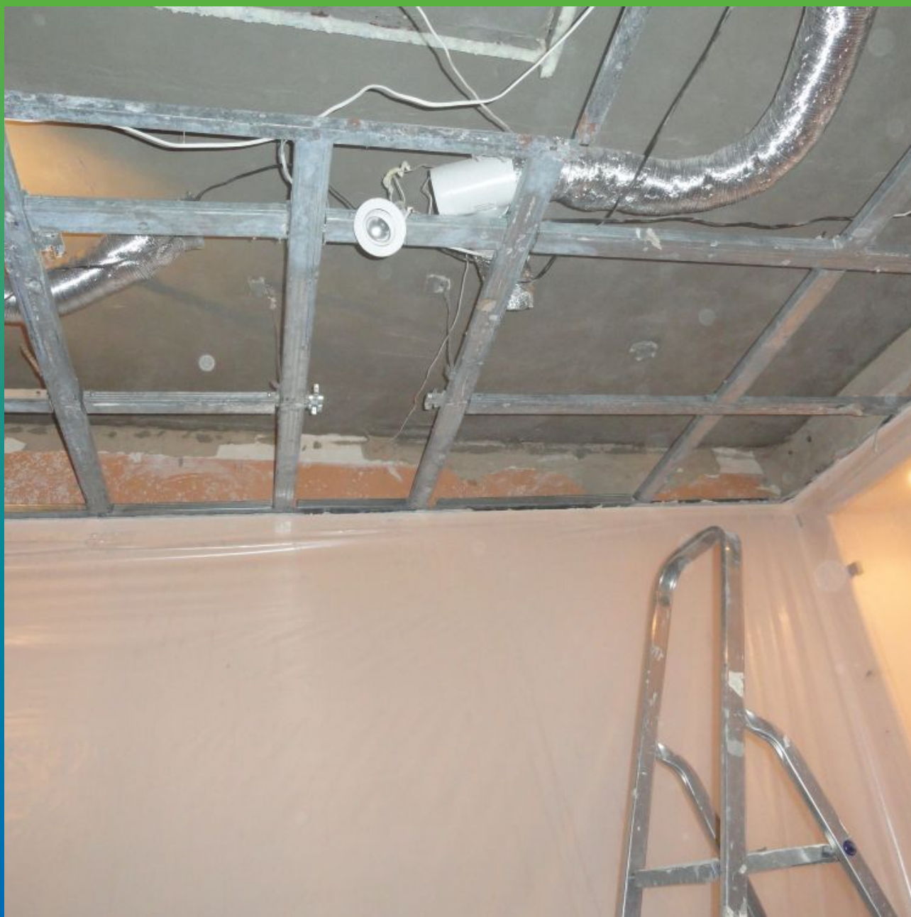
Вид на плиту с нанесенным первым слоем