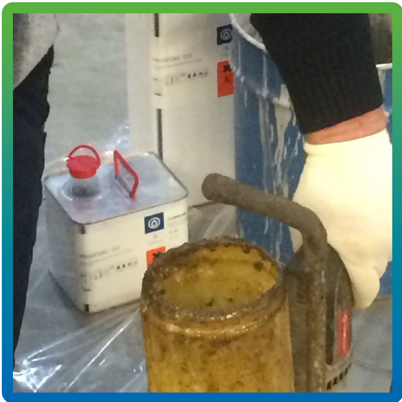
Инъектирование Манопкс 352