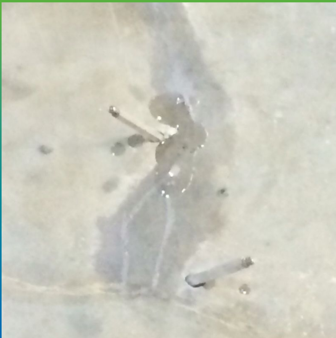
Вид отремонтированной трещины