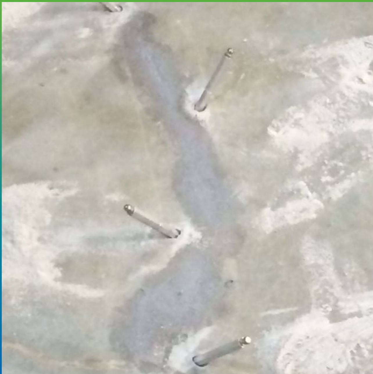
Установка пакеров заделка трещины материалом Манопокс 331