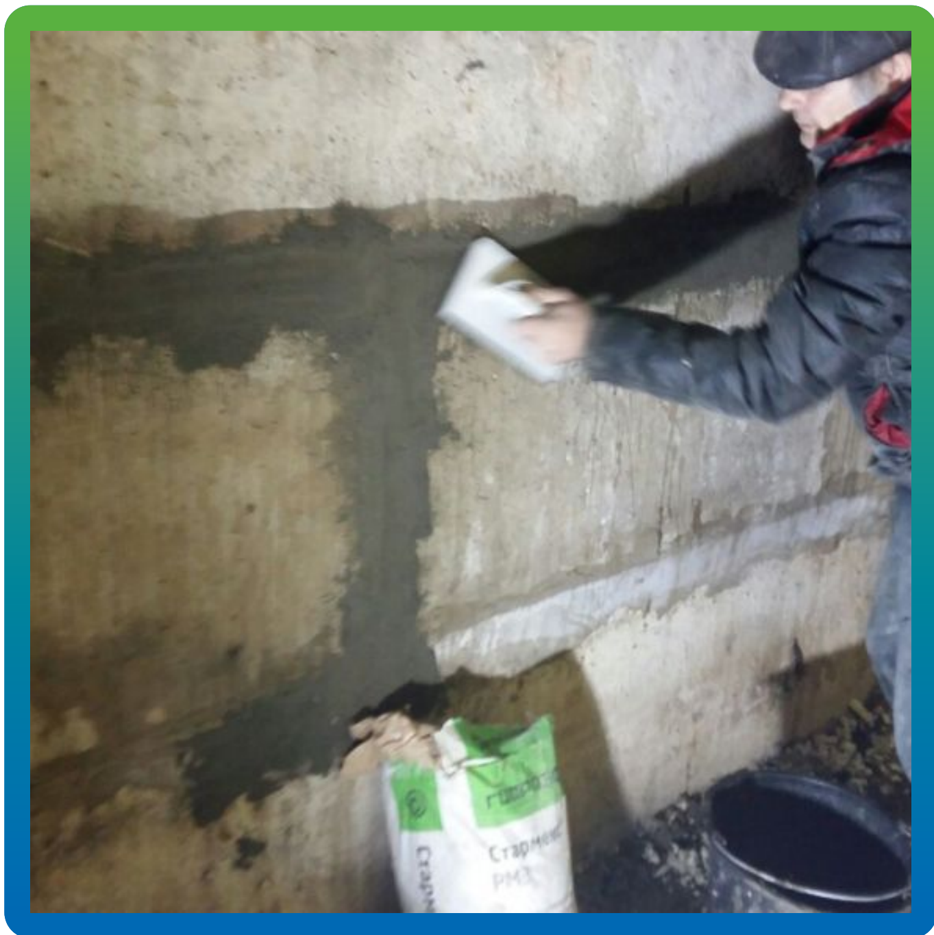
Заделка швов ФБС ремонтным составом Стармекс РМЗ