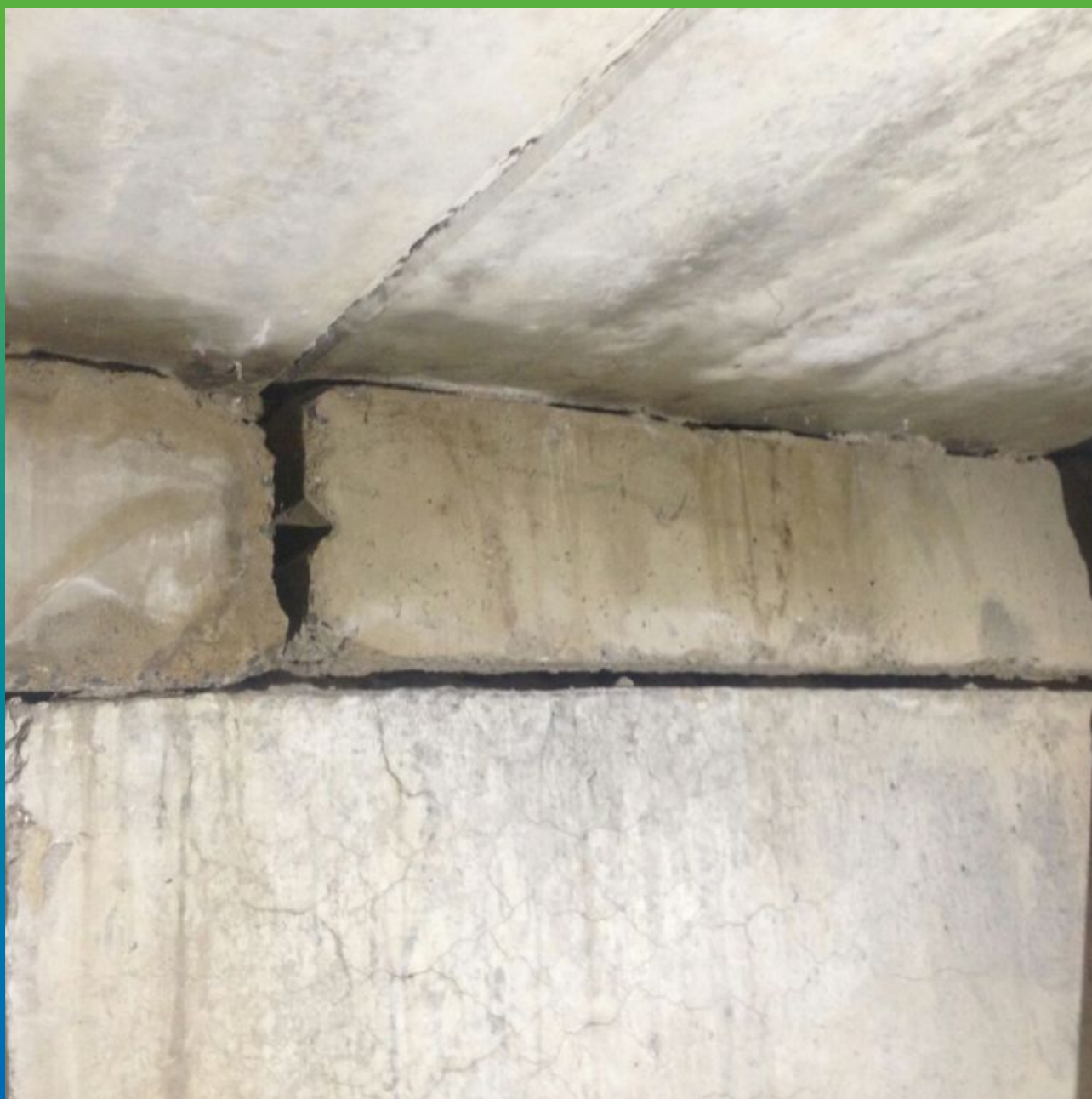
Швы ФБС до ремонта