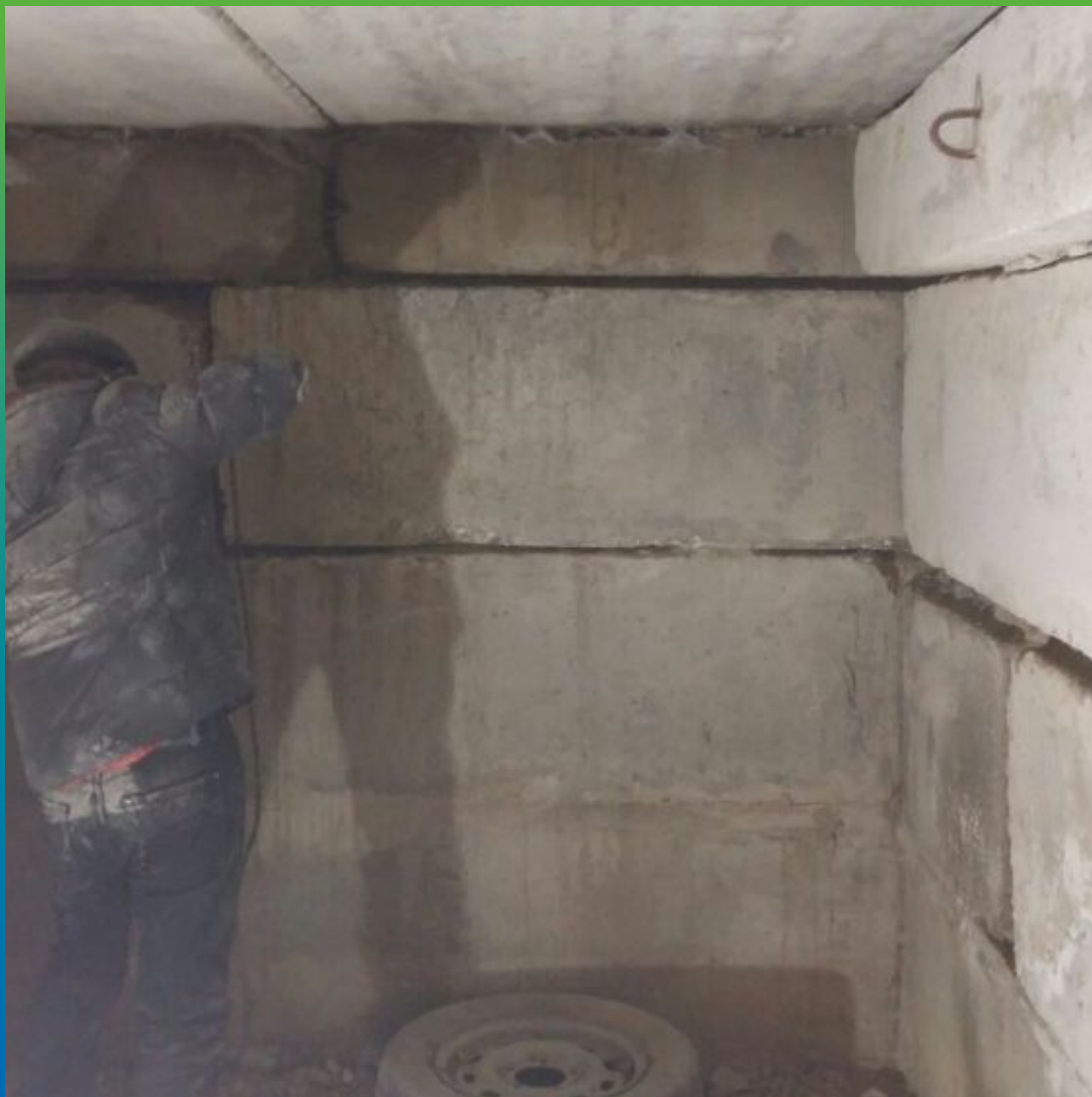
Подготовка швов перед нанесением ремонтного состава Стармекс РМЗ