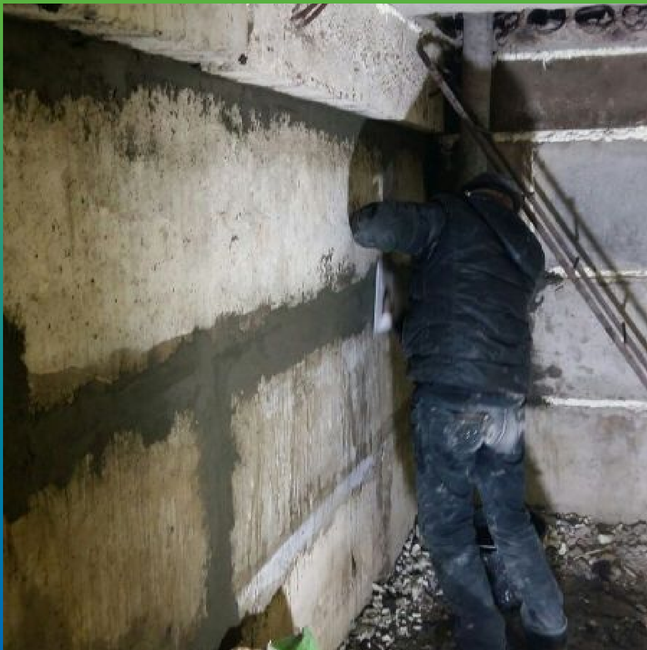
Заделка швов ФБС ремонтным составом Стармекс РМЗ