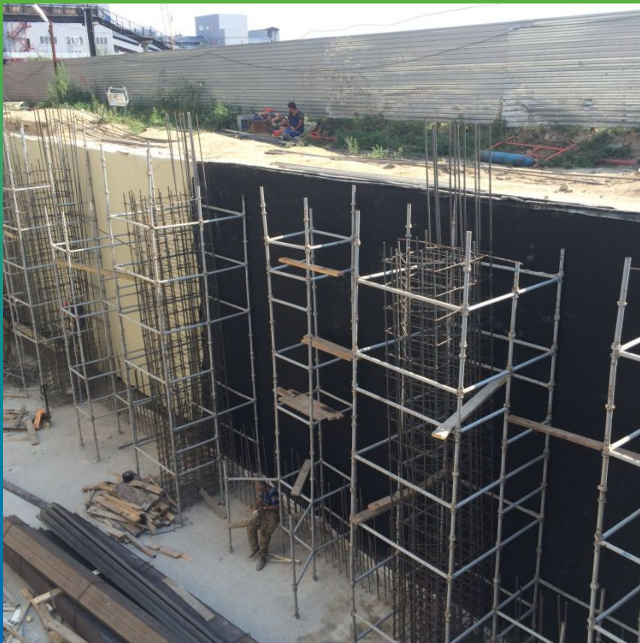
Вид смонтированных полотен мембраны на стене