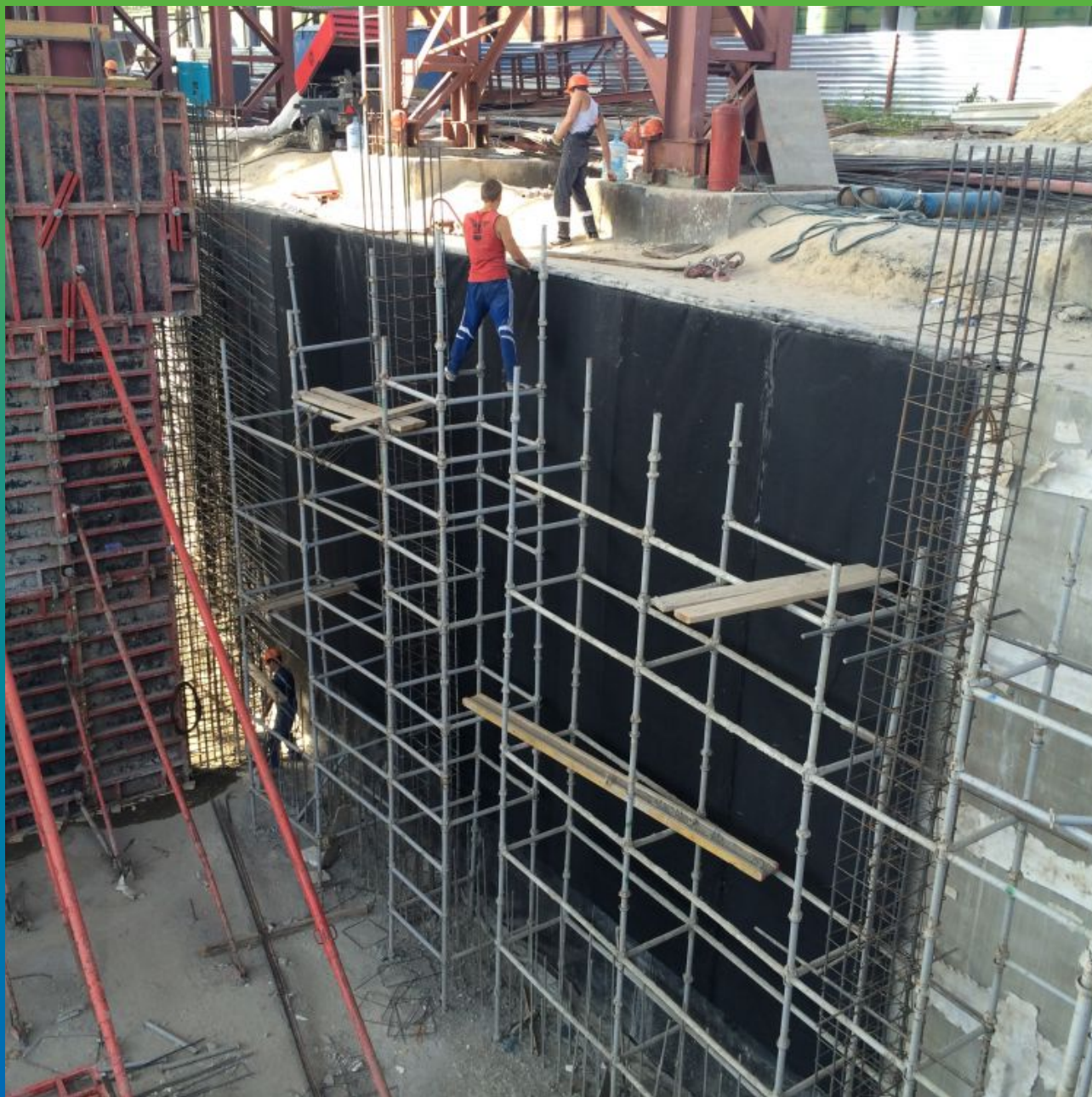
Процесс монтажа полотна мембраны на стену