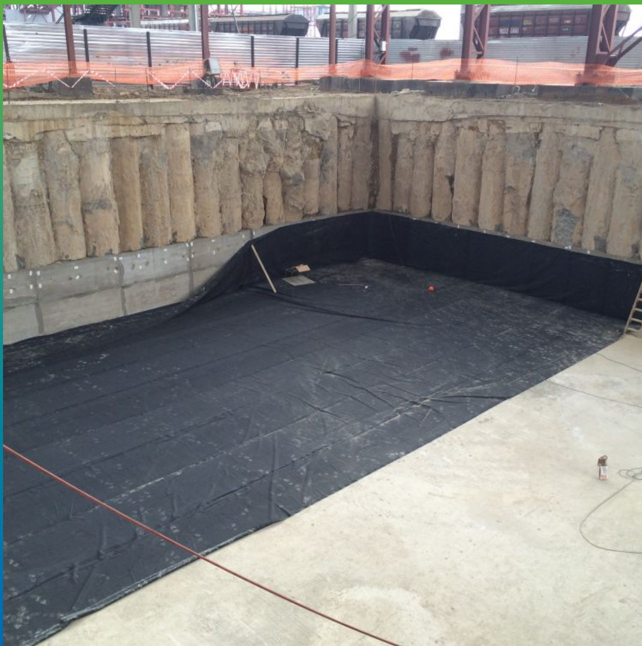
Монтаж первого полотна 480 м2 для гидроизоляции фундамента склада