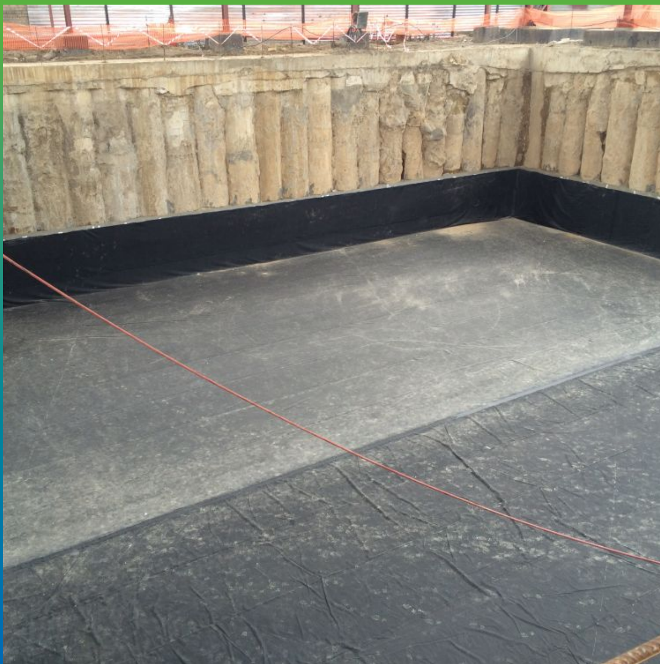
Готовая гидроизоляция фундамента из двух полотен мембраны с одним сварным швом