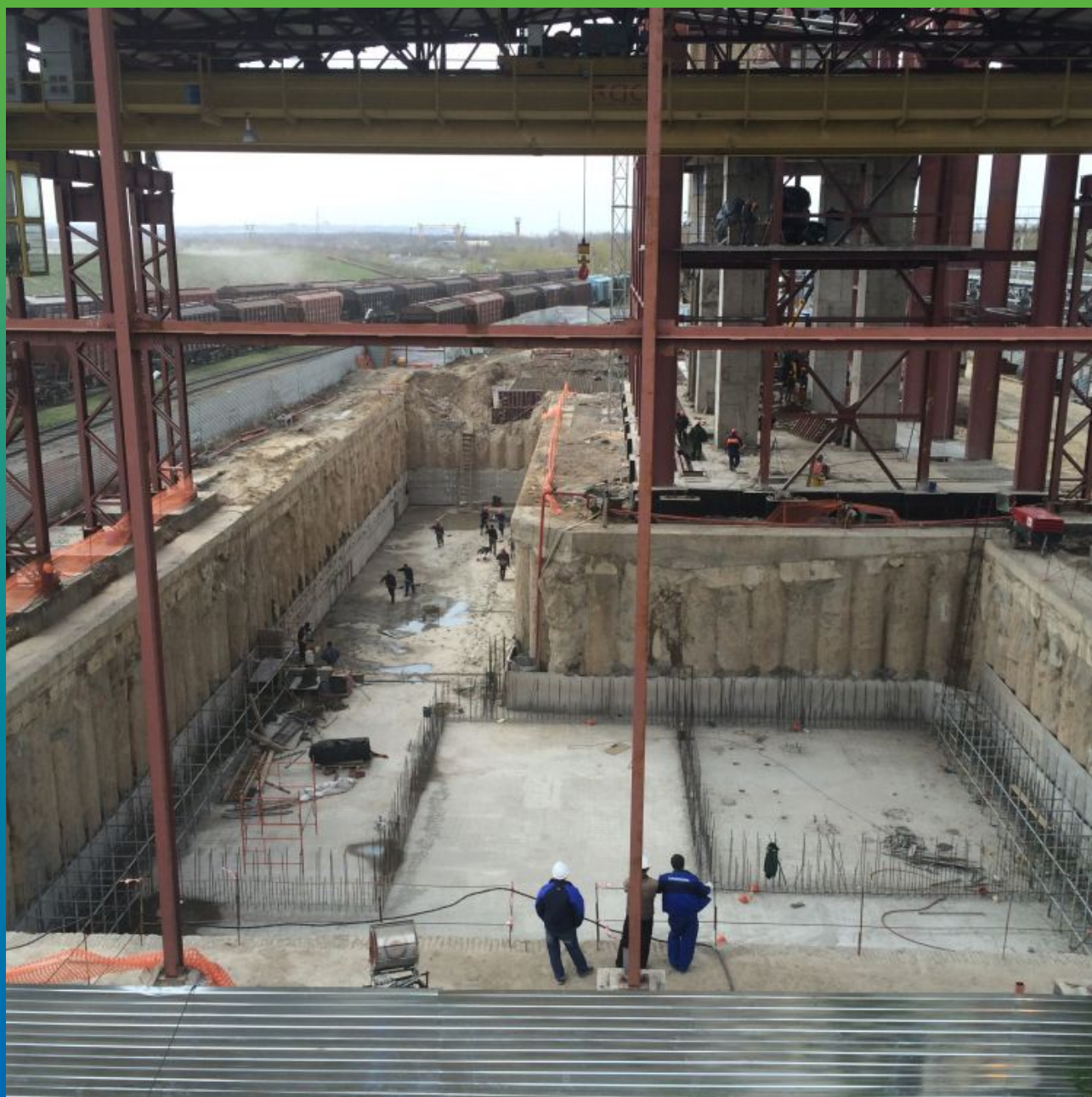
Залита фундаментная плита 80 см на защитную стяжку