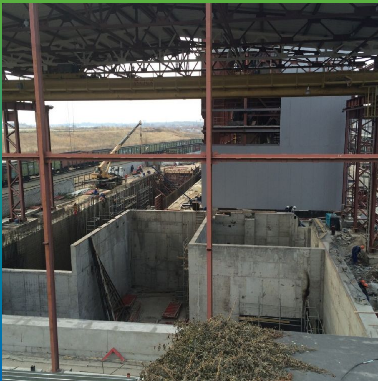
Общий вид объекта на завершающей стадии