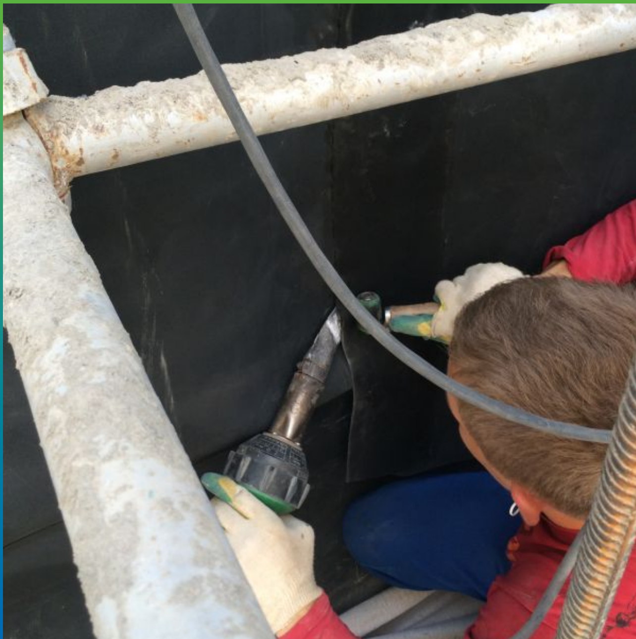
Сварка вертикального шва между полотнами мембраны