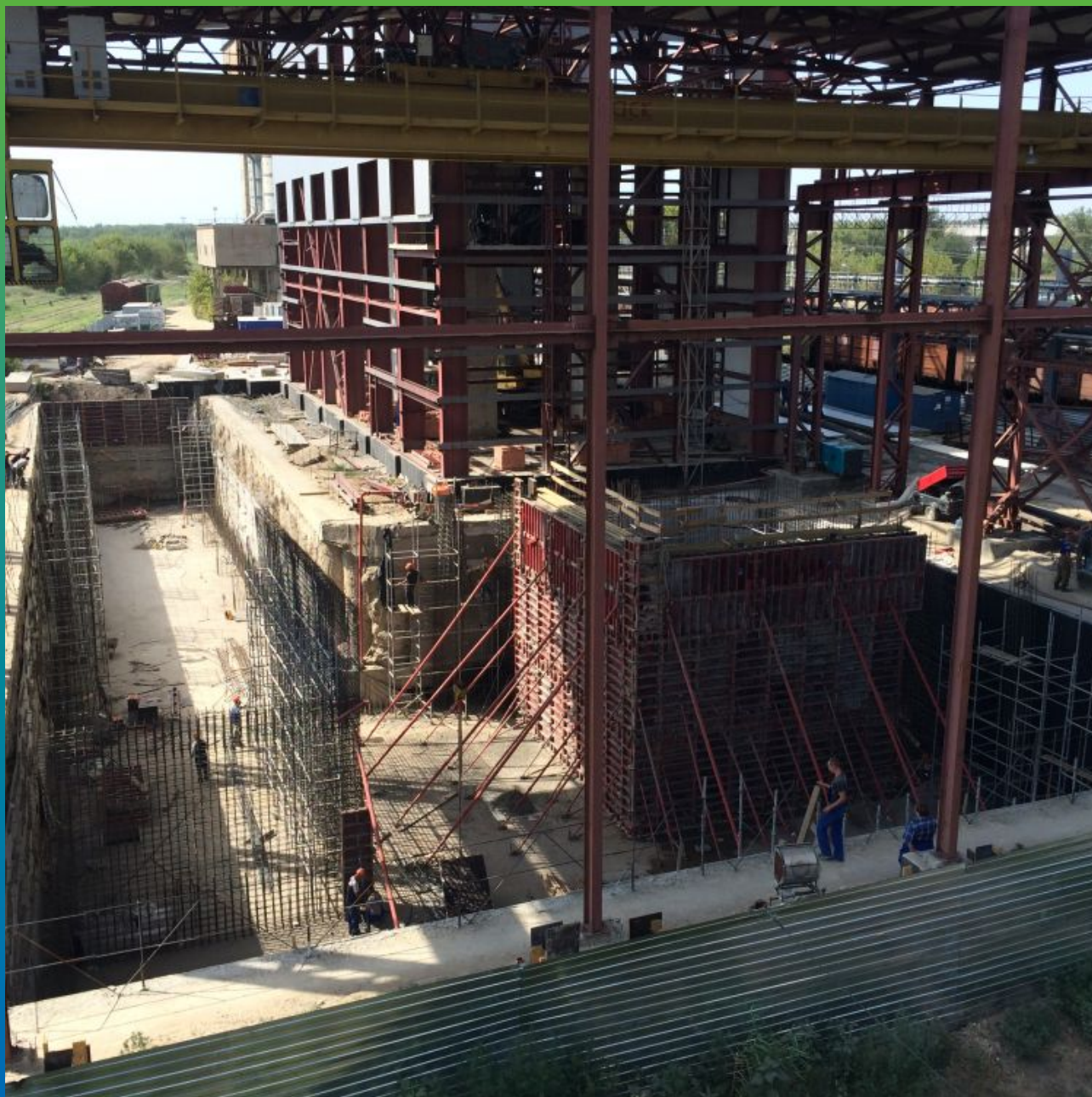
Общий вид смонтированных полотен мембраны на стенах