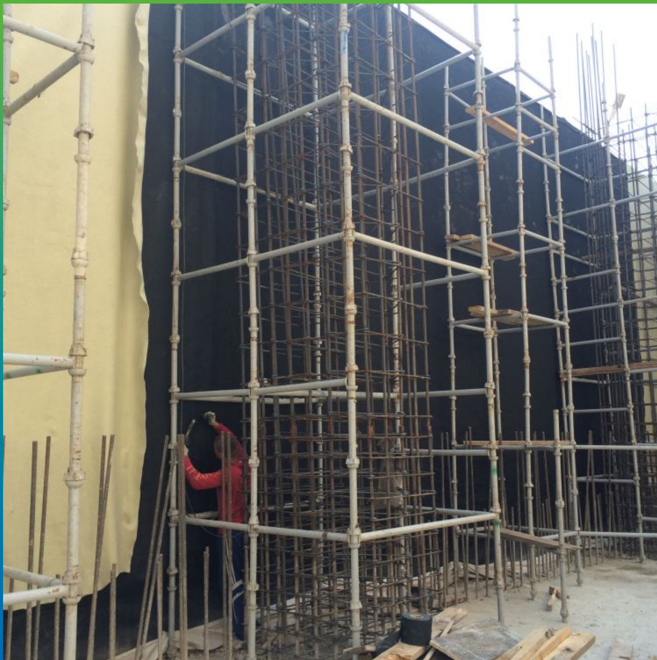
Сварка вертикального шва между полотнами мембраны