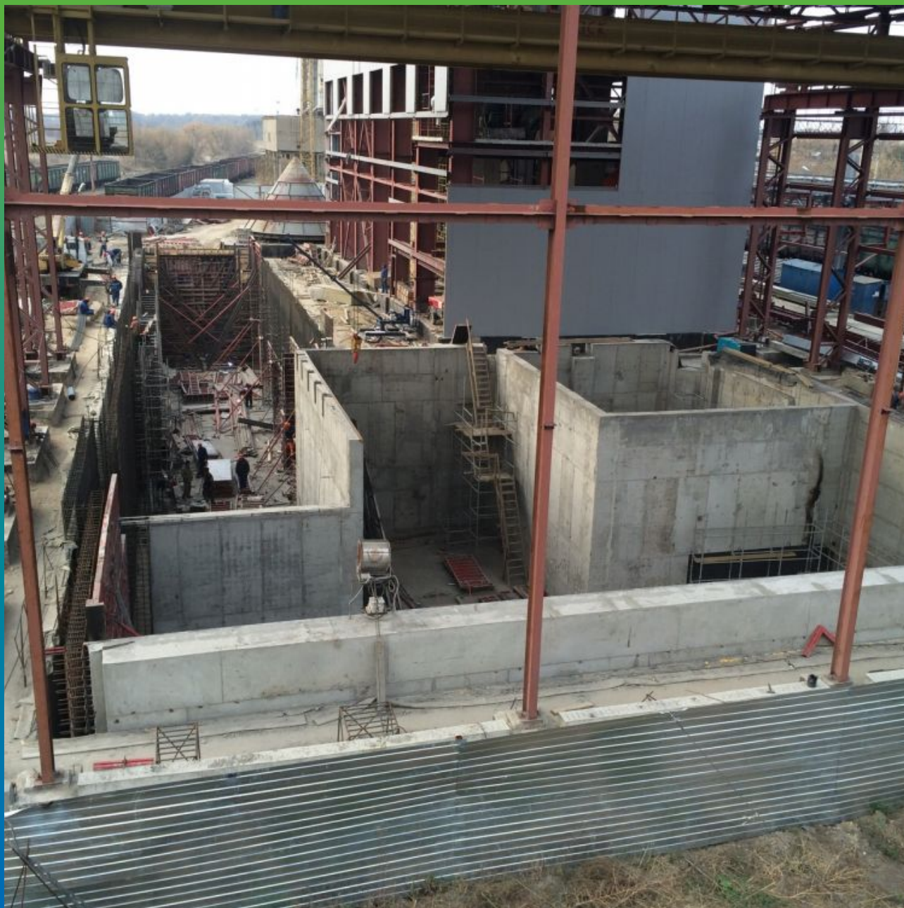
Общий вид объекта на завершающей стадии