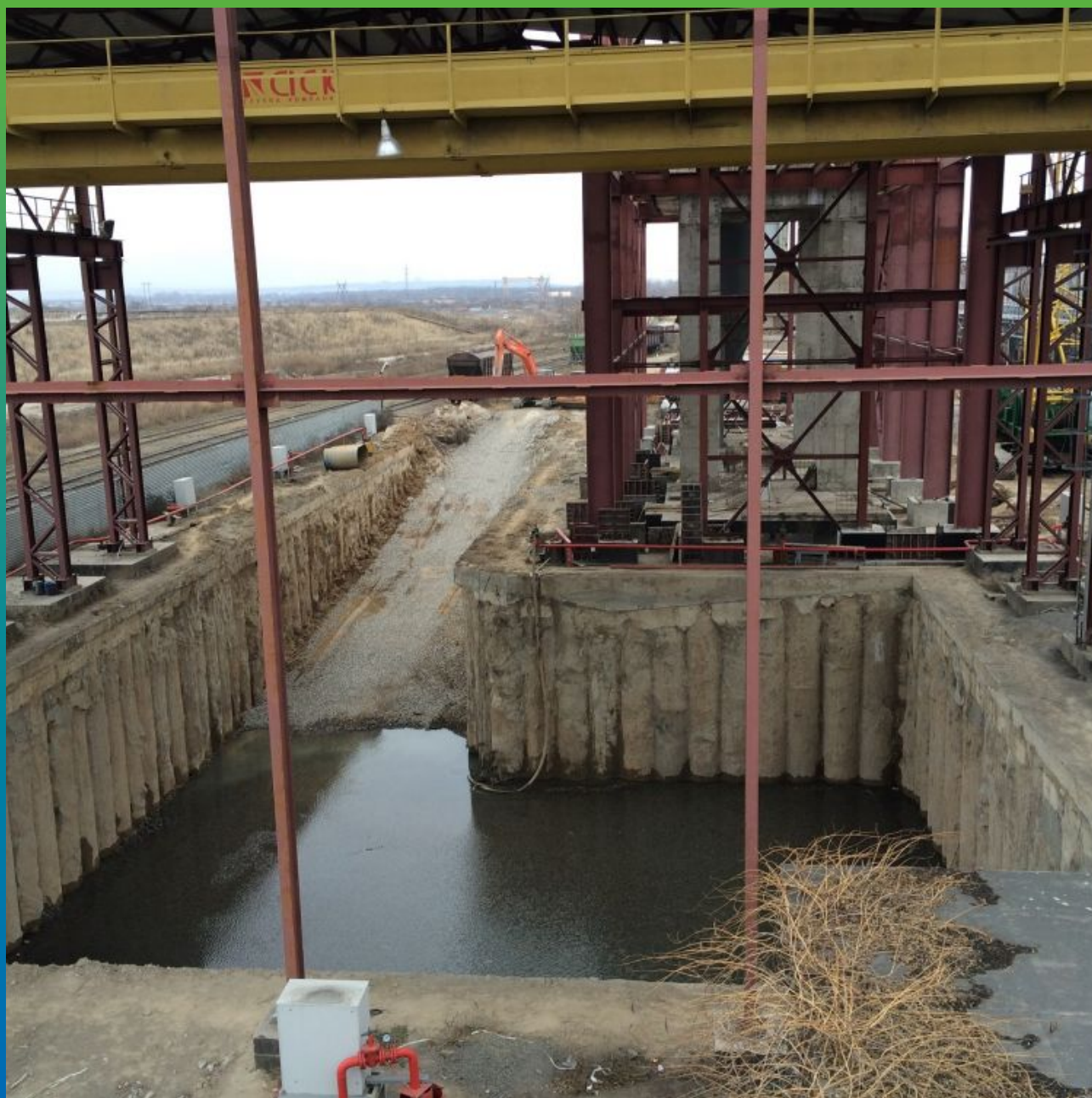
Общий вид объекта до начала работ