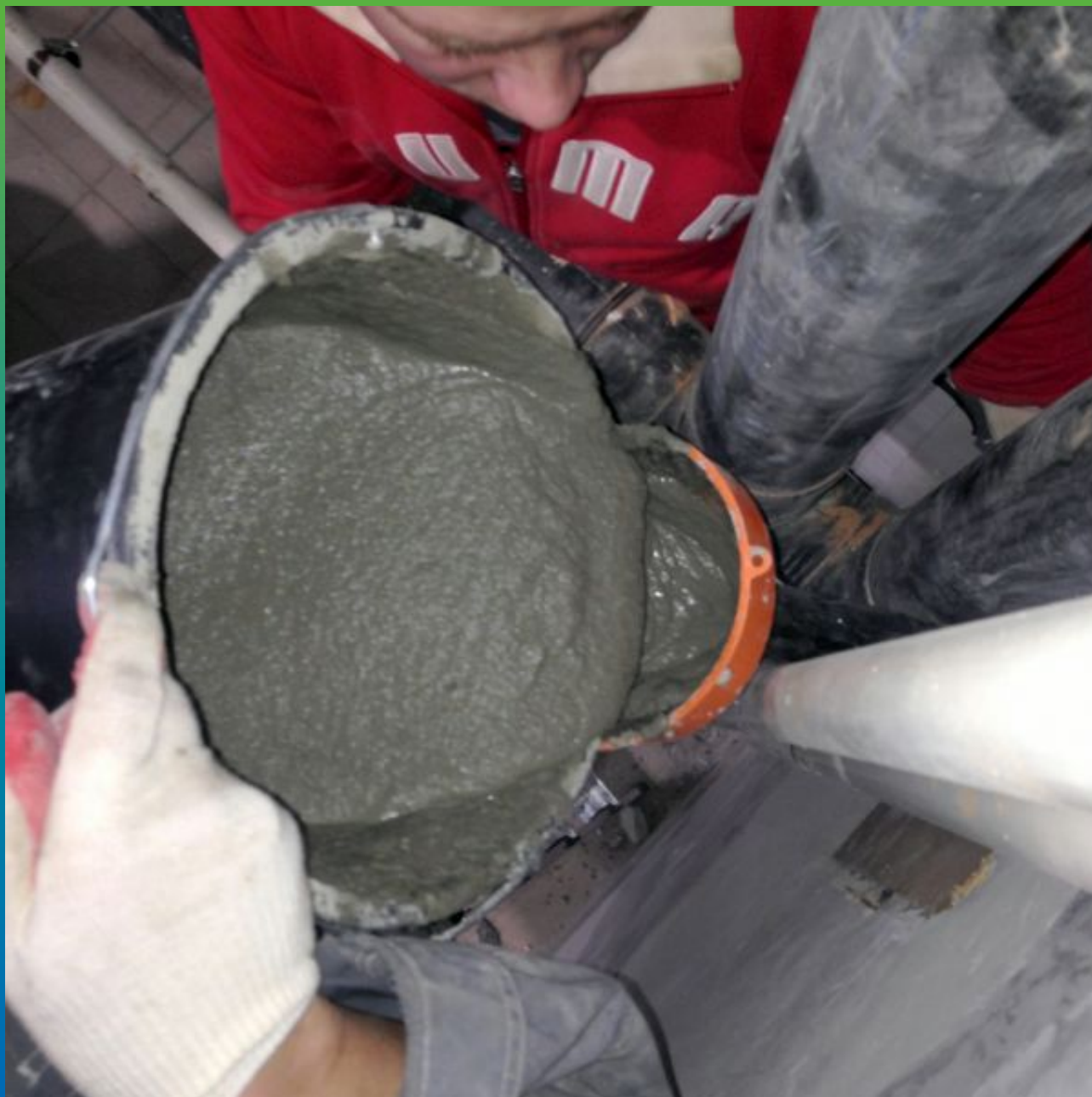
Процесс заливки через подготовленное отверстие