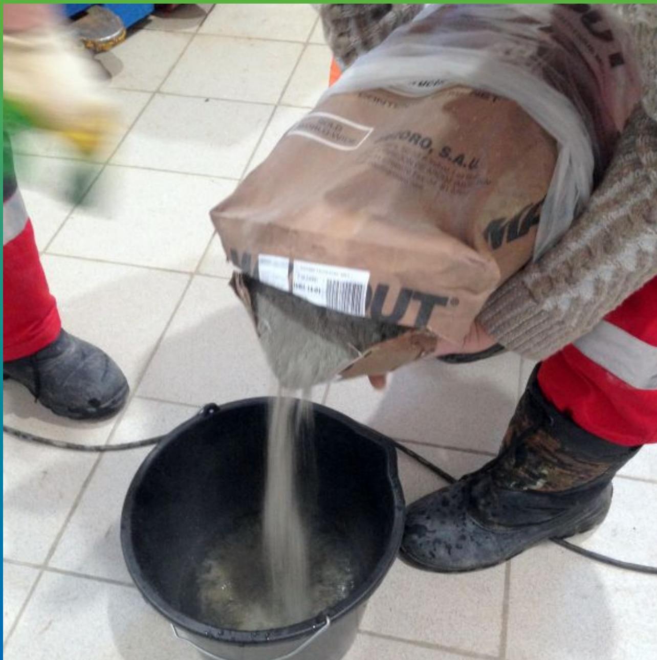
Замешивание Максграут с водой по ТО