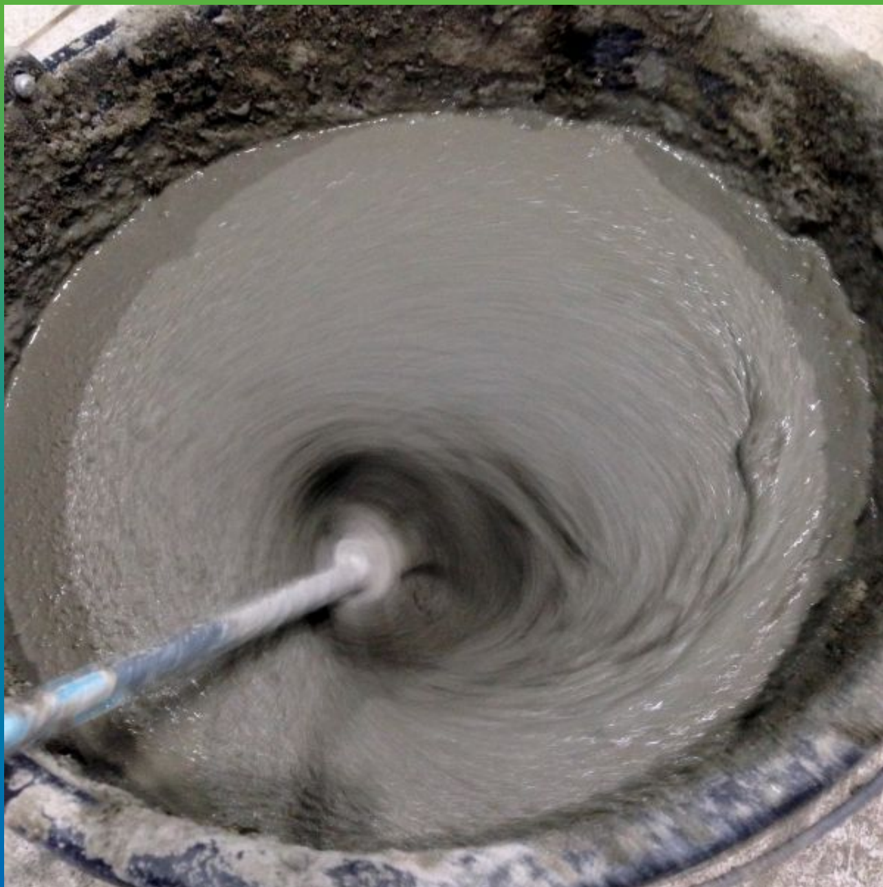
Перемешивание до однородной консистенции