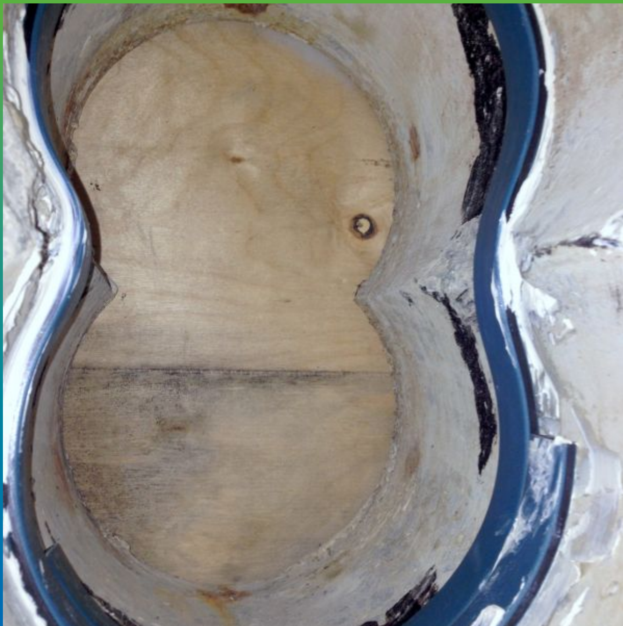
Укладка разбухающего профиля Манодил Свелл 2507