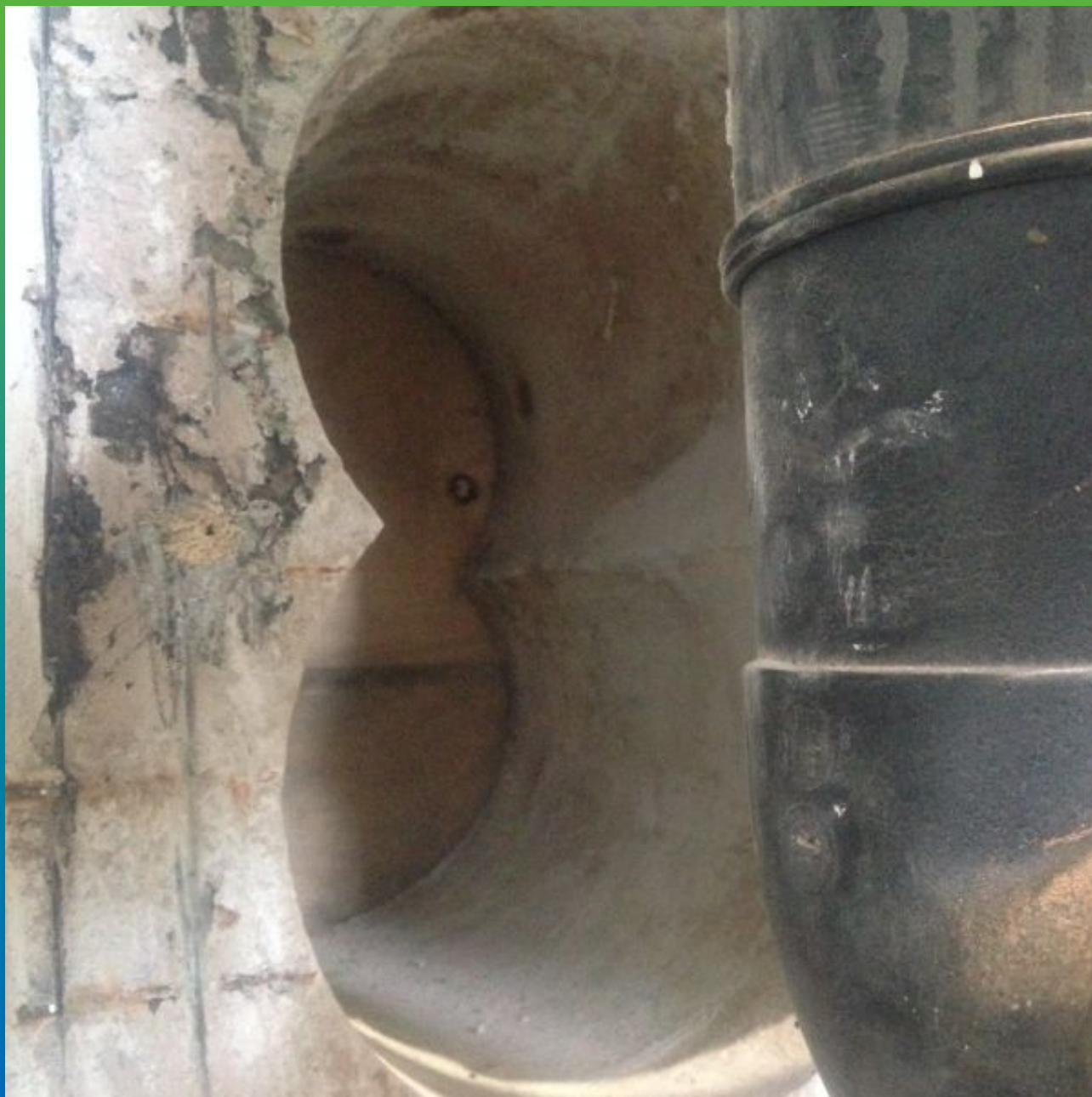
Общий вид отверстия до начала работ