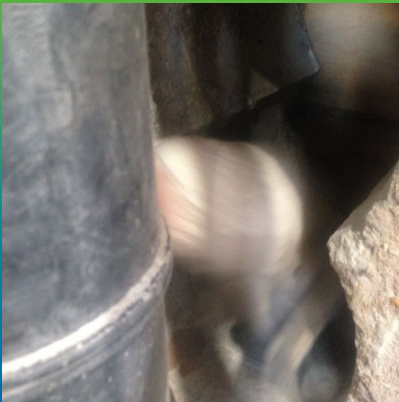
Очистка и обеспыливание отверстия