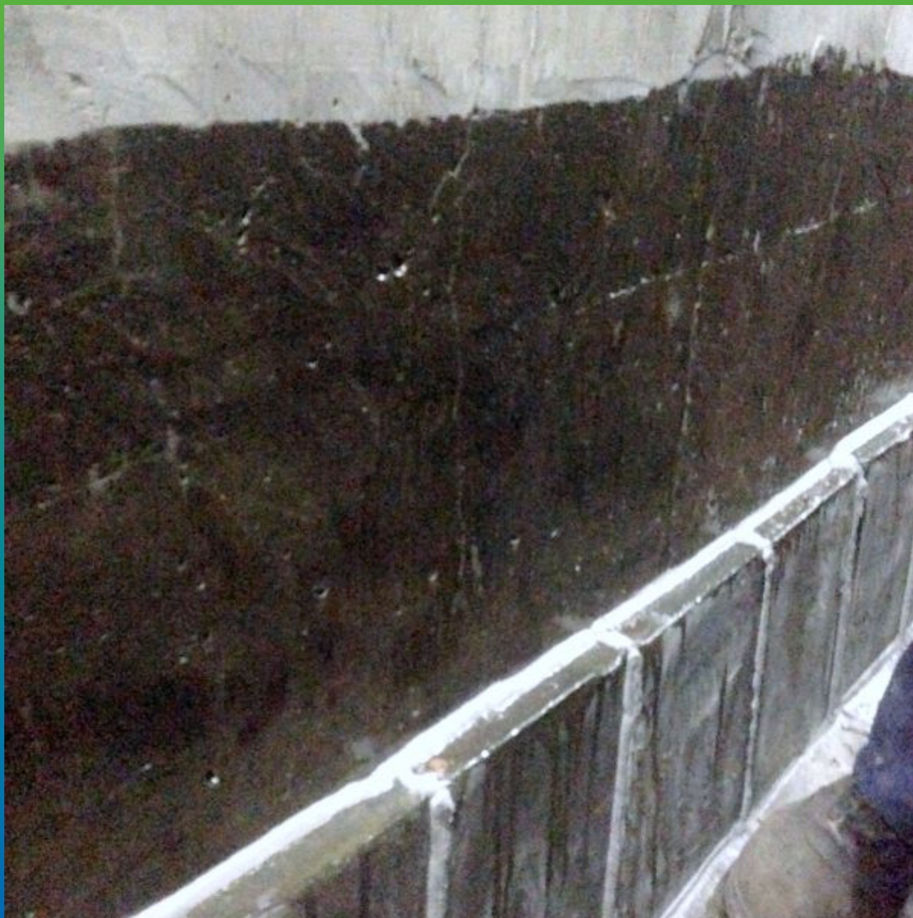
Нанесение грунтовки Денстоп ЭП 100 на основание