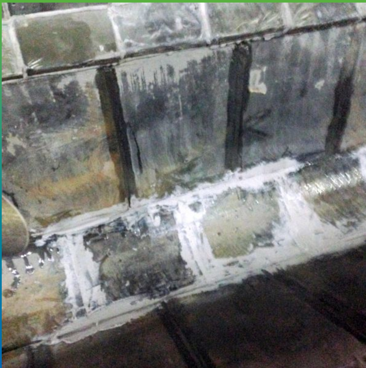
Конечный вид лотка с устроенной химостойкой плиткой