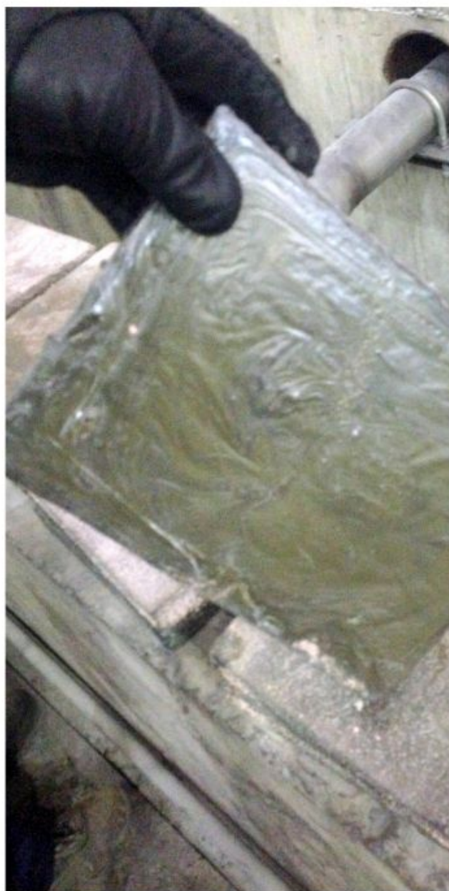
Вид кислотоупорной плитки