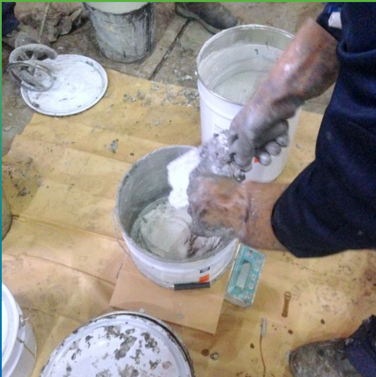
Замешивание компонентов А+Б Манопокс 331 на весах