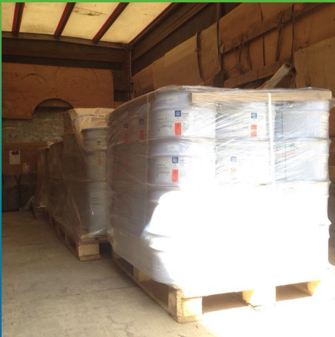
Материалы на объекте