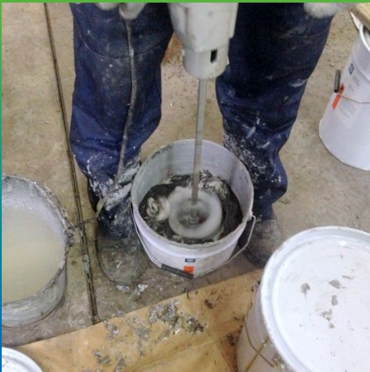
Смешение подготовленного состава миксером до однородной пастообразной смеси