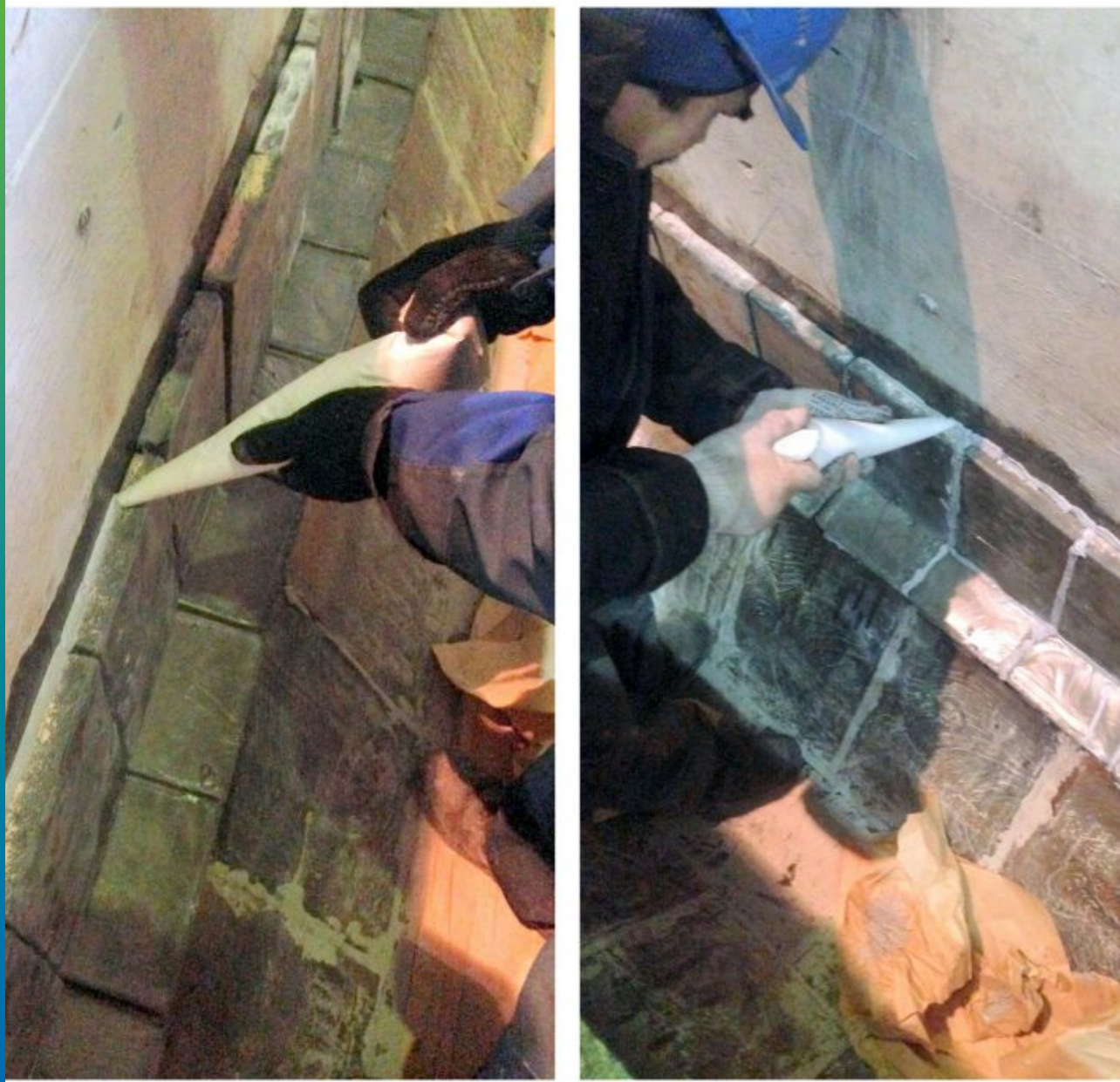
Химостойкая затирка швов с помощью Манопокс 331