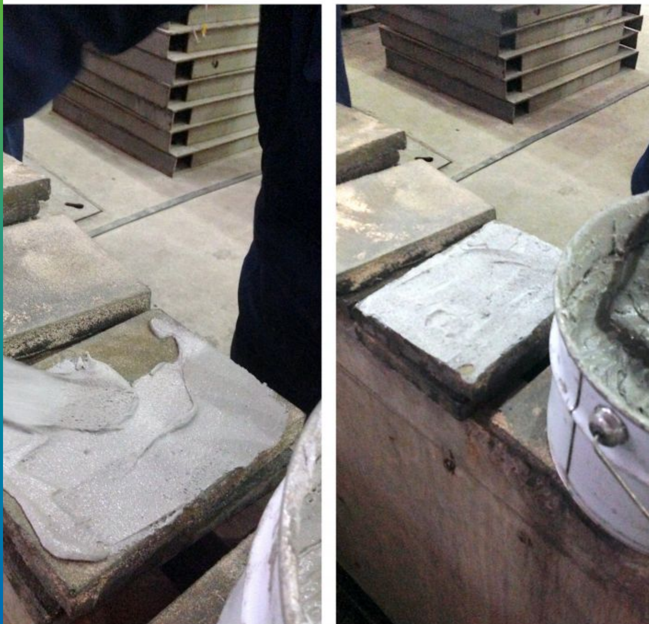
Нанесение слоя Манопокс 331 на кислотоупорную плитку