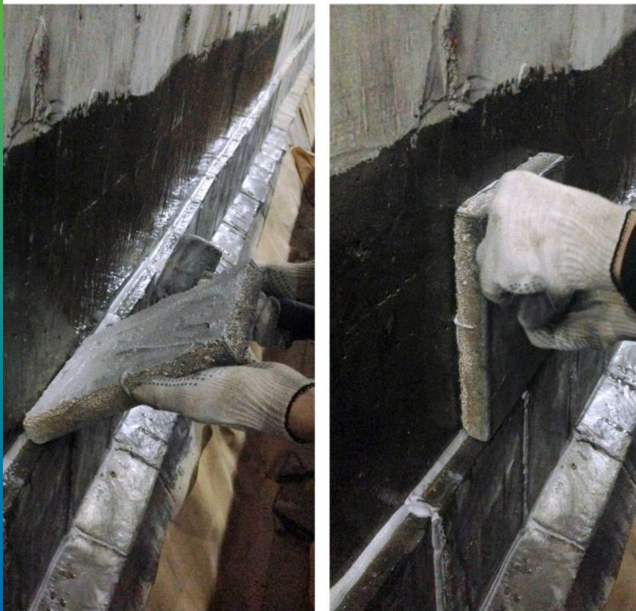
Монтаж плитки на основание лотка