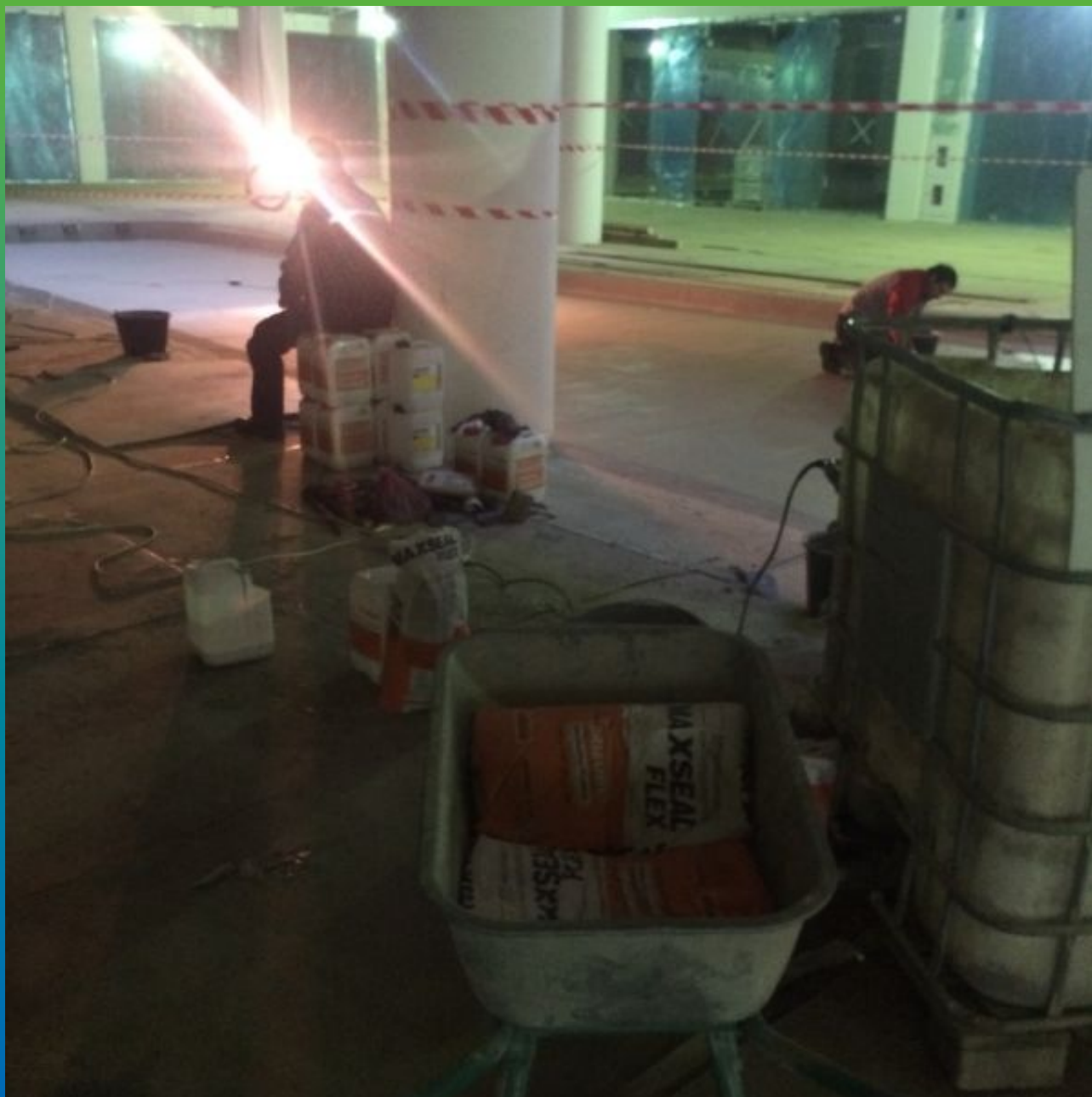
Материал Макссил Флекс на объекте