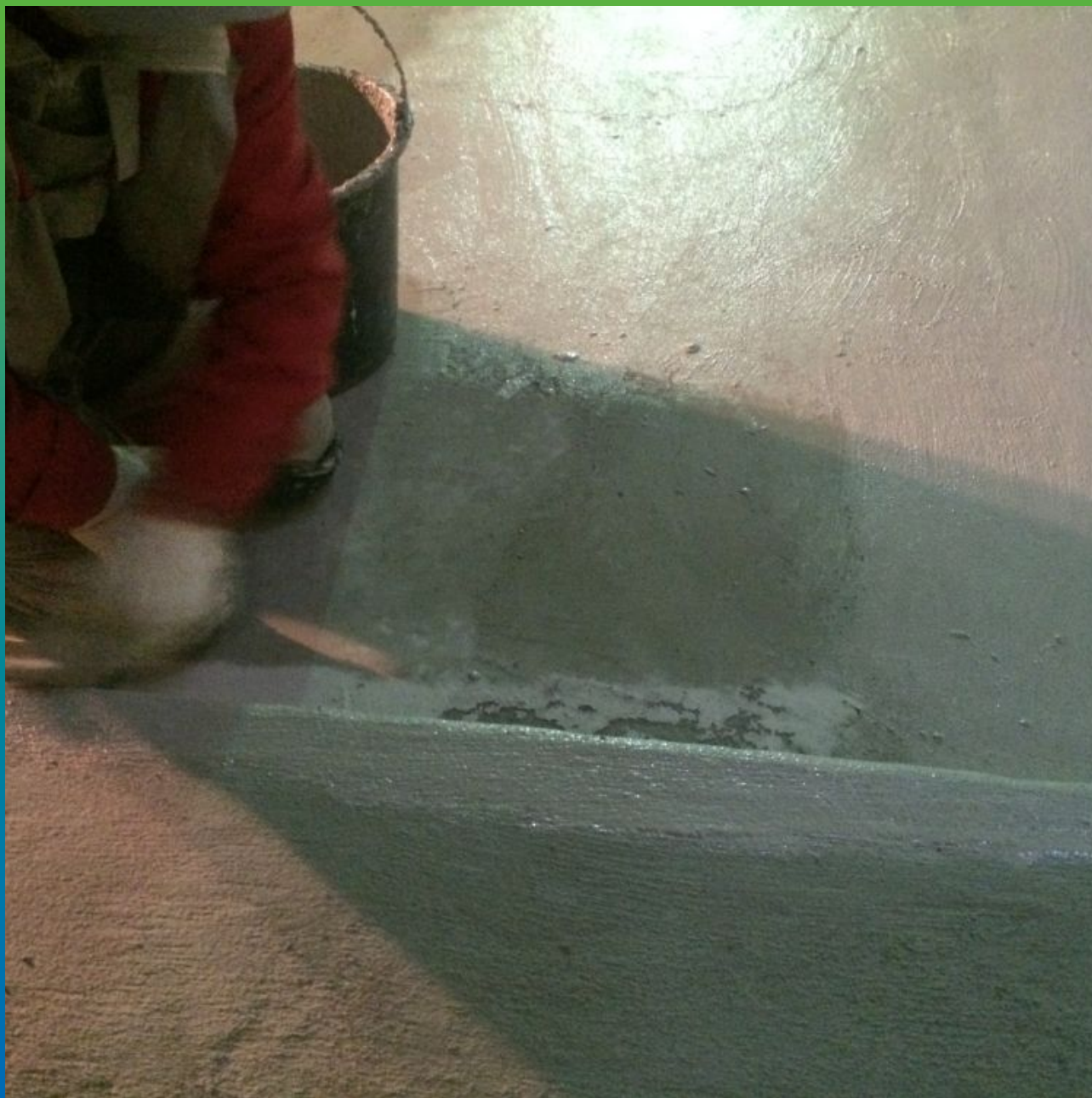
Нанесение первого слоя эластичной гидроизоляции Максил Флекс