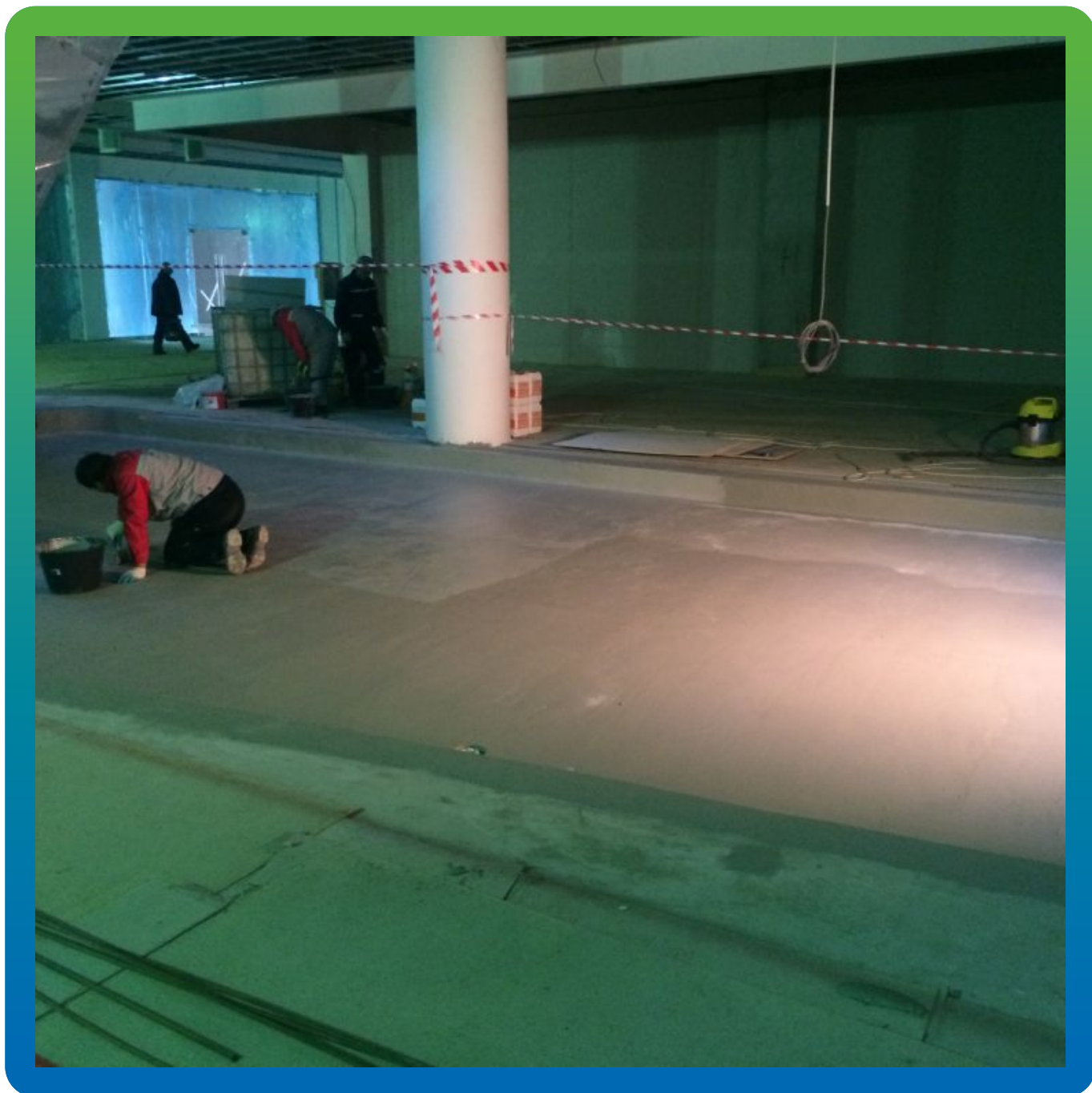
Нанесение второго слоя эластичной гидроизоляции Макссил Флекс