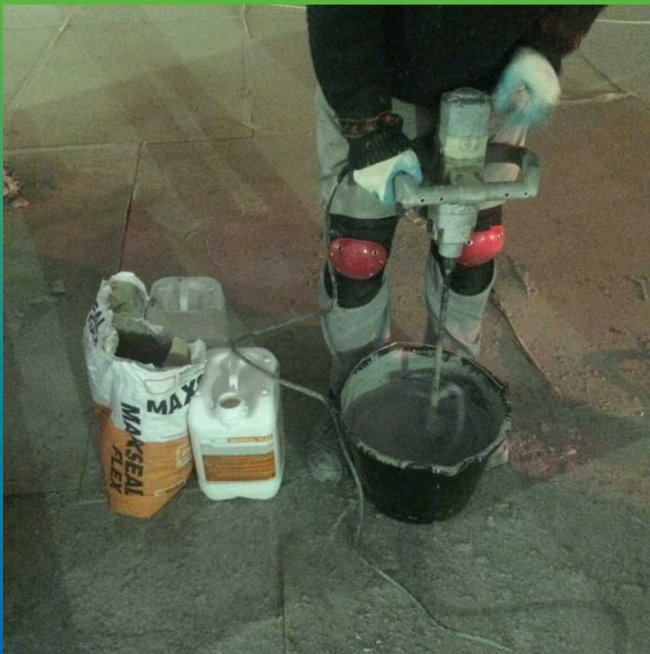
Смешивание двухкомпонентной гидроизоляции Макссил Флекс