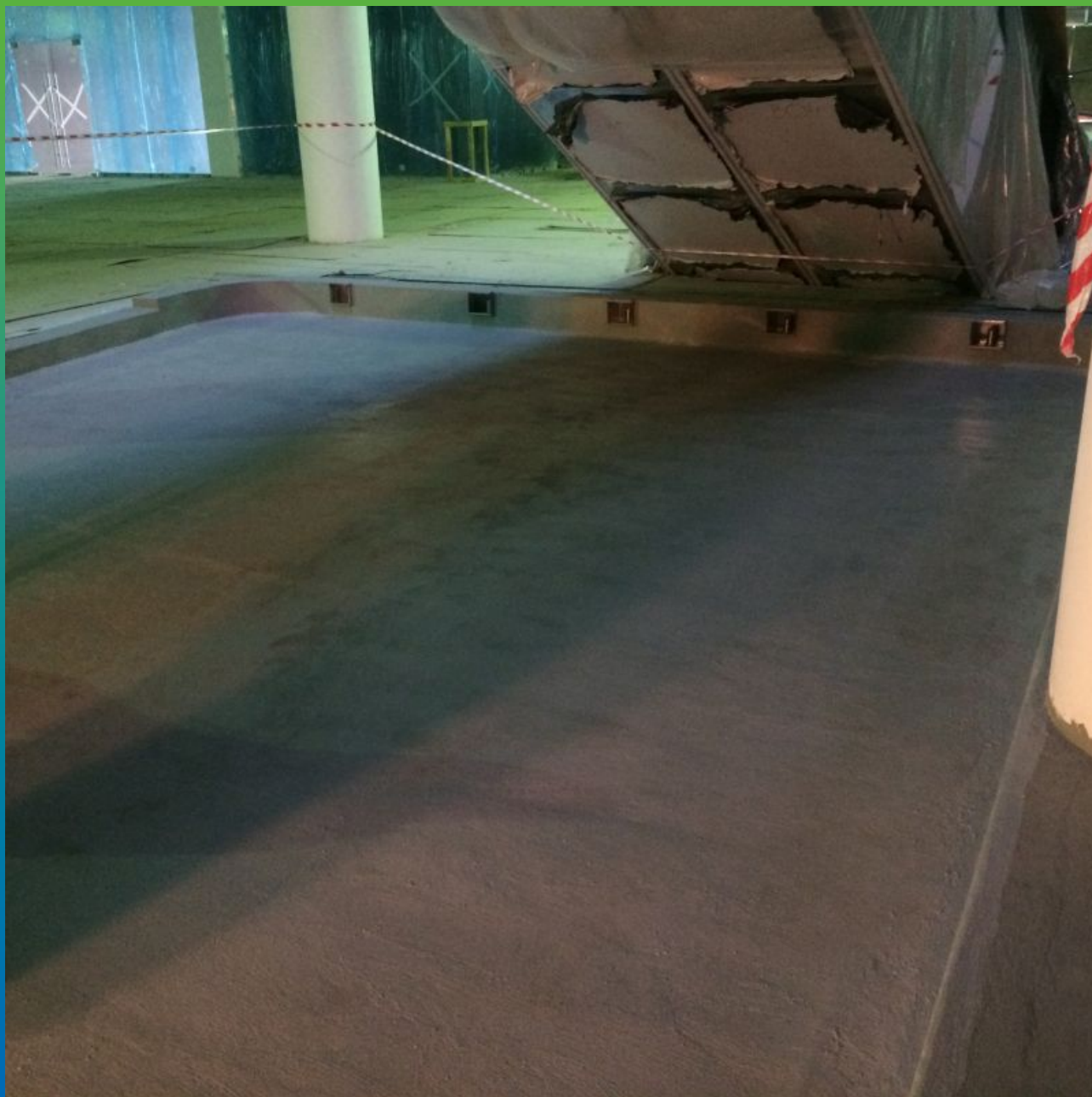
Окончательный вид гидроизоляционного покрытия Максил Флекс