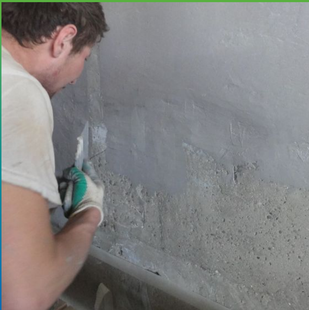
Ремонт поверхности эпоксидным ремонтным составом Манопокс 331