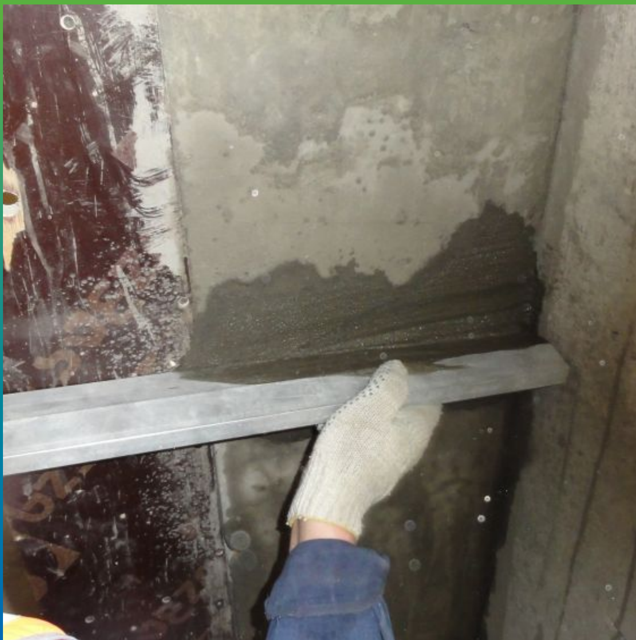
Выравнивание геометрии четвертей ремонтным составом Максрайт 700