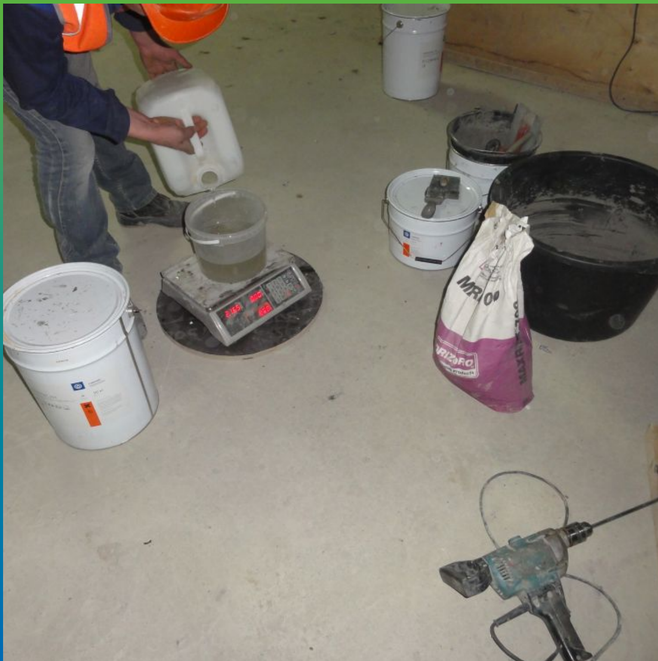
Приготовление ремонтного состава Маскрайт 700 для работы