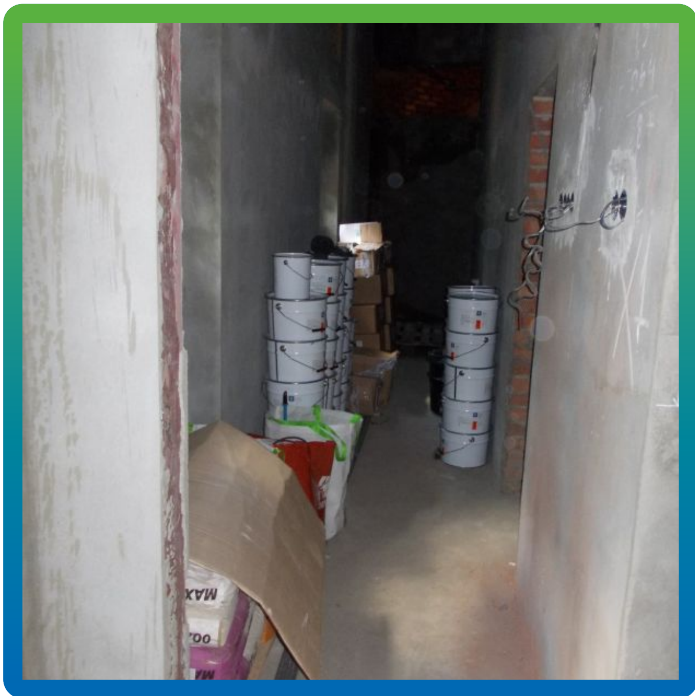
Материалы "Гидрозо" на объекте