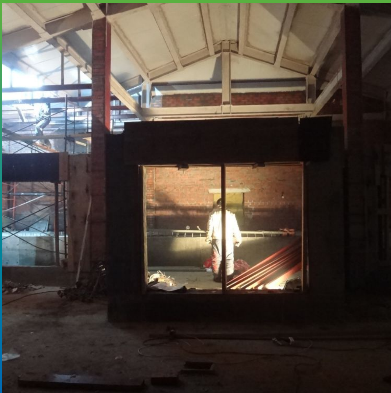
Зимний вольер с пингвинами до отделочных работ