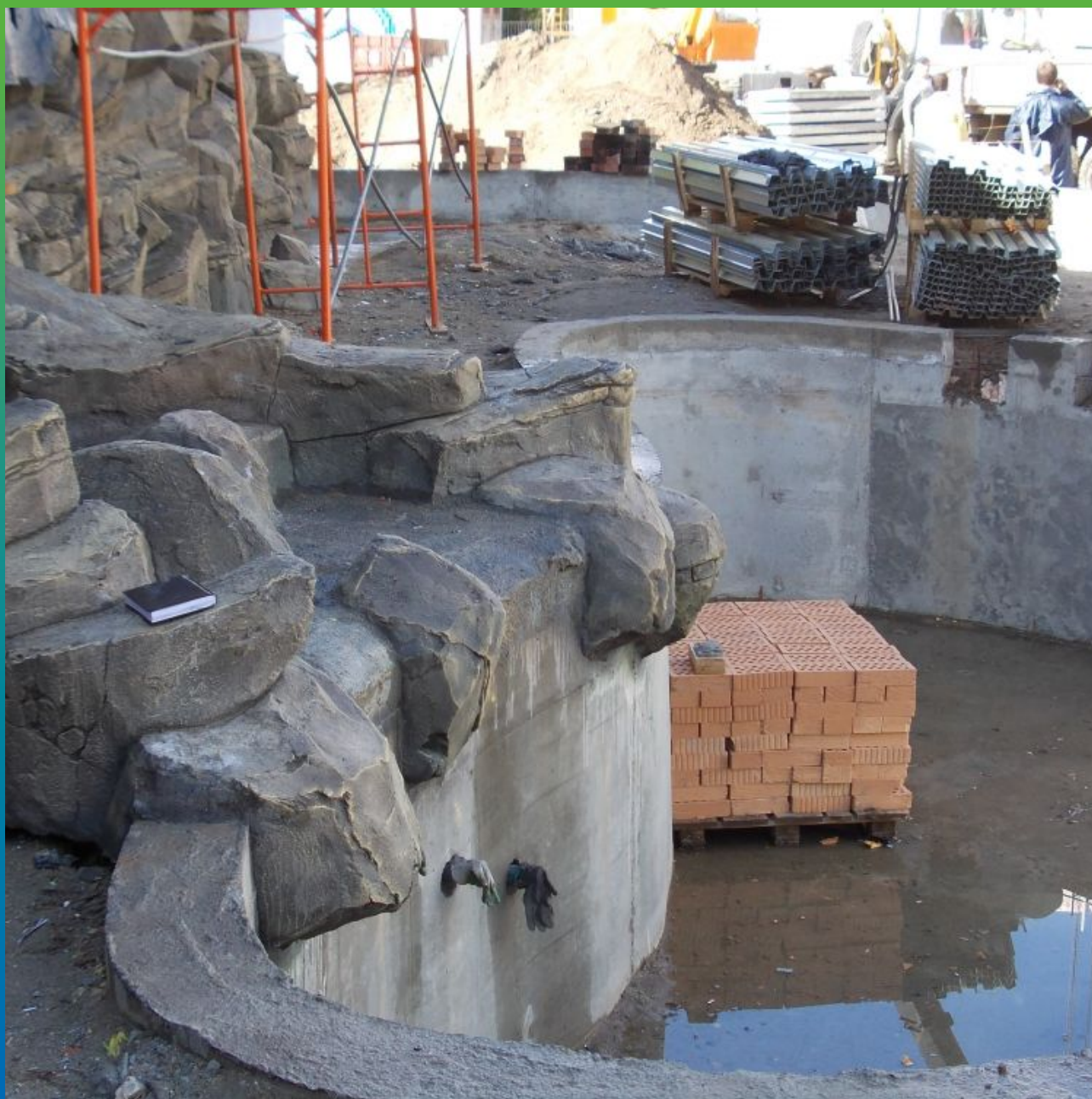
Летний вольер с пингвинами до отделочных работ