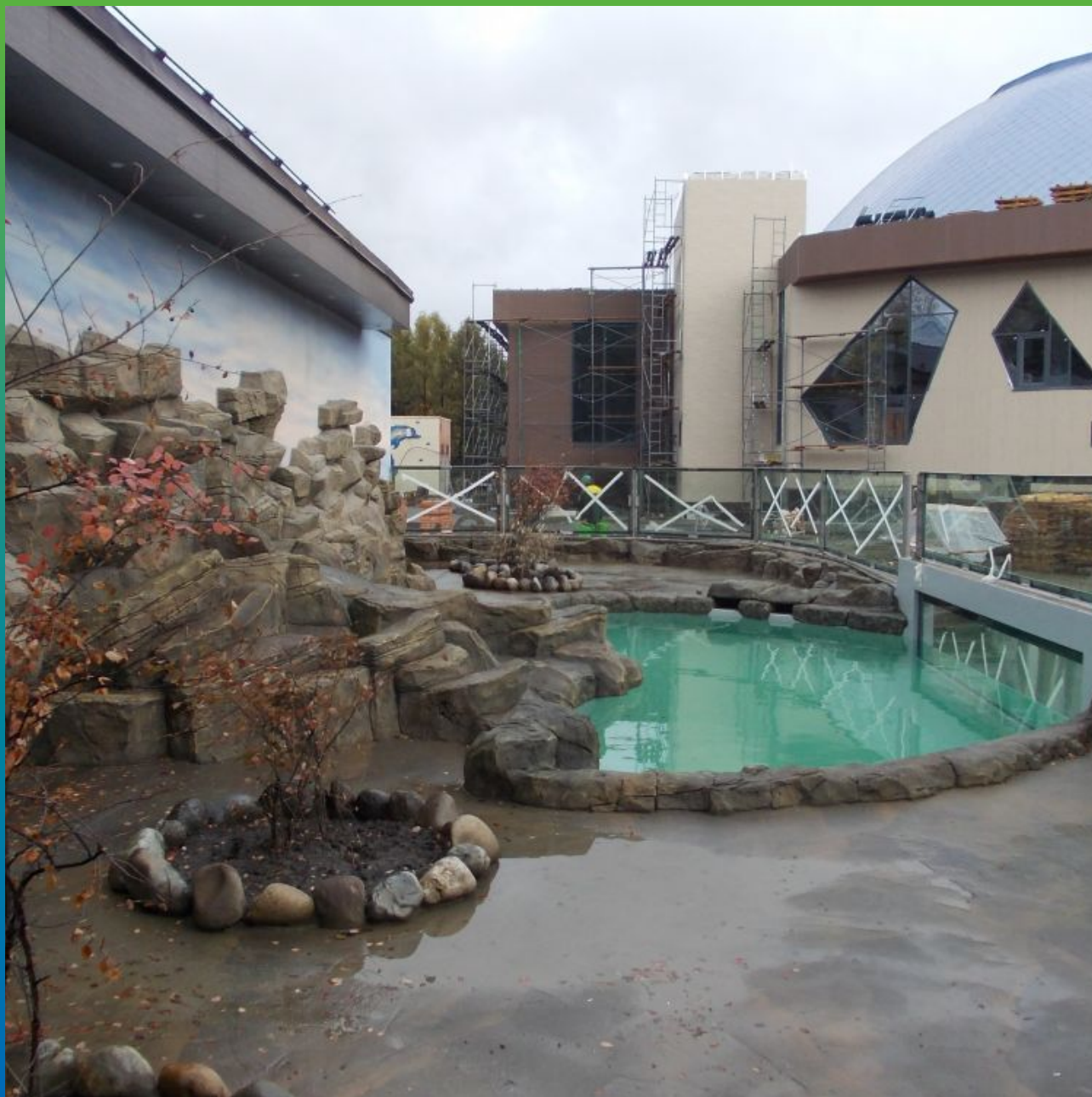
Финишный вид летнего вольера с пингвинами